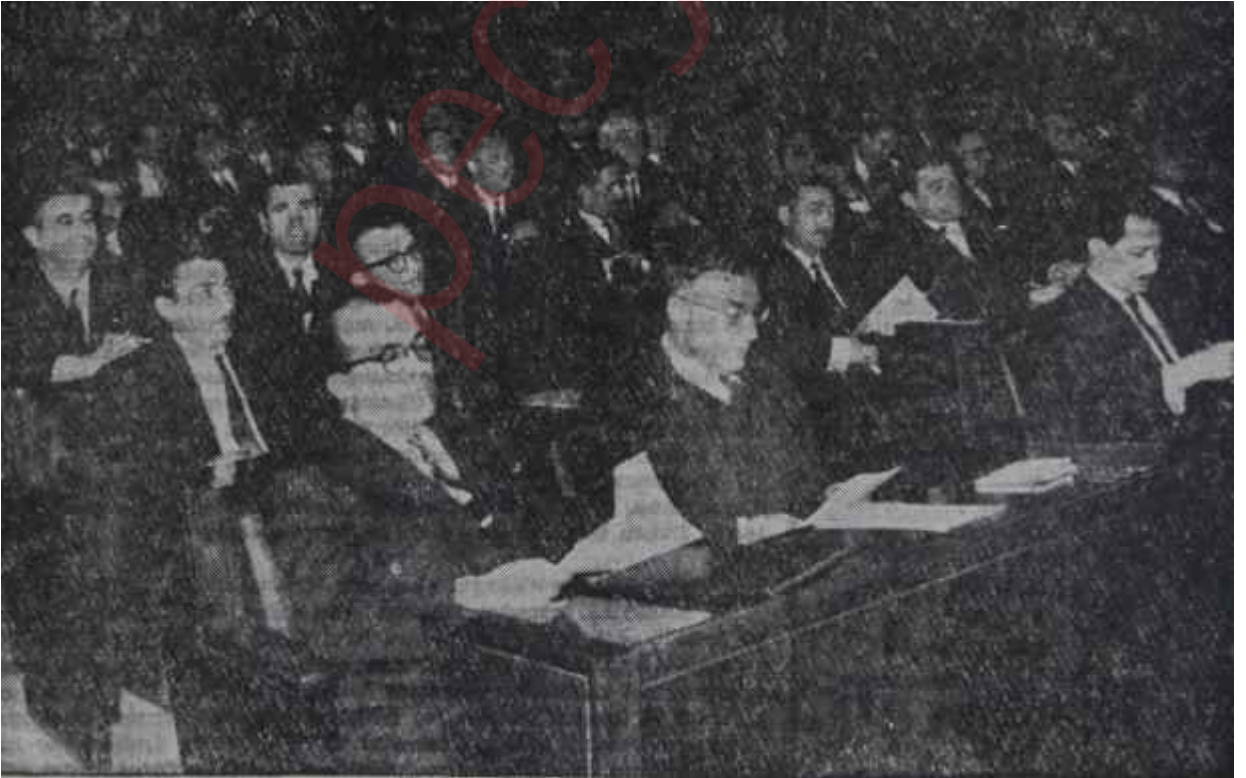
Temsilciler Meclisi çalışıyor Kanunlar buradan çıkar

"Ekspres Kanunlar" bu zaviyenin dışında, çıkarılış tarzları dolayısıyla da tenkide uğramışlardır. Bunlardan bir kısmının Kurucu Meclis resmen teşekkül ettikten sonra yayınlanmış bulunması hassaslığı arttırmış, bunları gafil veya maksatlı gözlerde Kurucu Meclise maletmiştir. Aslında, M.B.K. nin genç subayları bir kaç gece sabahlara kadar çalışmışlar ve içlerinde ukte olan ka-