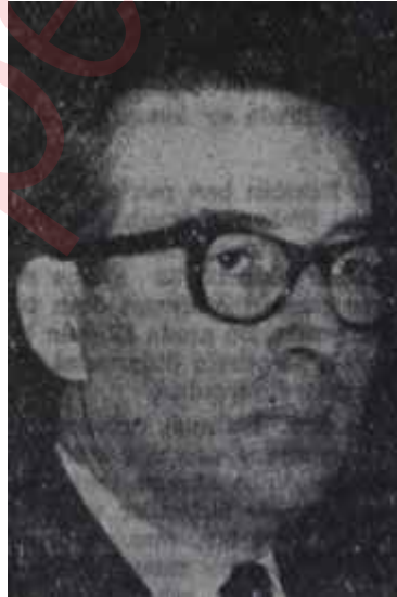
Turhan Feyzioğlu Ümit dağıtan adam

Meşhur ve malûm 114 sayılı kanunun keskin kılıcının 147 öğretim ü. esinin kafasına indiğinden bu yana tek ümit kapısı, bir Üniversite adamı -tabii politik hüviyeti dışındaki- Turhan Feyzioğlunun Millî Eğitim Bakanlığına getirilmesi oldu. Feyzioğlunun Bakanlık koltuğuna oturmasıyla meselenin halledileceğini sanan bazı nikbinler hemen faaliyete geçtiler. İlk iş olarak İstanbulda Üniversitelerarası bir Kurul toplayarak meseleyi orada tartışmağa bağladılar. Kurul, meseleyi enine boyuna tartışarak bir muhtıra hasırladı. İki sayfadan ibaret muhtırada mesele bütün teferruatıyla izah ediliyor ve 114 sayılı kanunun kaldırıl-