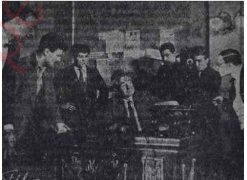
"Baş Sayfa" dan bir sahne Bakın sahneye bakın

Anouilh'un Antigone'si işte bu "tâviz"i reddeder ve ölmeyi tercih eder. Bu tercihi "mânâsız" bir gurur ve inat için yaptığını sananlar, Anouilh'un bu eski mythos'a verdiği yeni "mâna"yı kavrayamayanlardır. Evet, Antigone, de haklının mı, haksızın mı cesedini gömmek için çırpındığını bilmemektedir. Evet, ölenlerin ikisi de çiğeri iki para etmez iki taht düşkünü olabilirler. Fakat mühim olan bu değildir. Mühim olan insanların öldükten sonra insan gibi gömülme haklarıdır. Mühim olan, bir kudret sahibinin adalet ve ahlâk örneği vermek bahanesiyle -üstelik hakikati bilmeden- insanoğlunun en tabii -ve son- hakkını çiğnemesidir. Antigone bu çiğnenen insan hakkı uğruna isyan etmiş, kendini ölüme atmıştı, Çürümeye mahkûm edilen ceset erkek kardeşinin cesedi olmasaydı da, bunu yapardı.