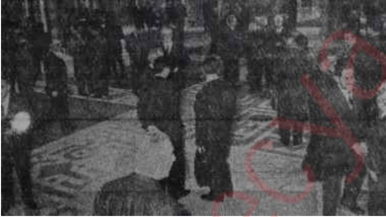
Temsilciler Meclisi salonunda kulis faaliyeti Avlananlar ve tavlananlar pek çok

Kurultaydan önce Bu hafta, Türkiye'nin 1 numaralı siyasi teşekkülü C.H.P. de, gene canlı bir hava esiyordu. Partinin en mümtaz 1300 temsilcisi pek yakında Ankarada toplanacaktı. Bazı kimşeler toplantıda parlak nutukların söyleneceği, ciddi tartışmaların yapıl-