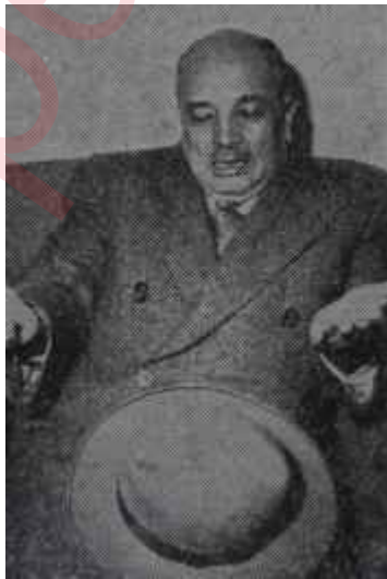
Fahrettin Kerim Gökay Hay aklınla bin yaşa

Yeni particiler bitirdiğimiz hafta bir bakıma daha rahatlamış sayılırlardı. Partinin kuruluşu hakkındaki hareket tarzı da kesin olarak çizilmişti. Müteşebbis heyet tüzüğü hazırlıyacak ve bir dilekçeyle ay sonunda resmen faaliyete geçilecekti.