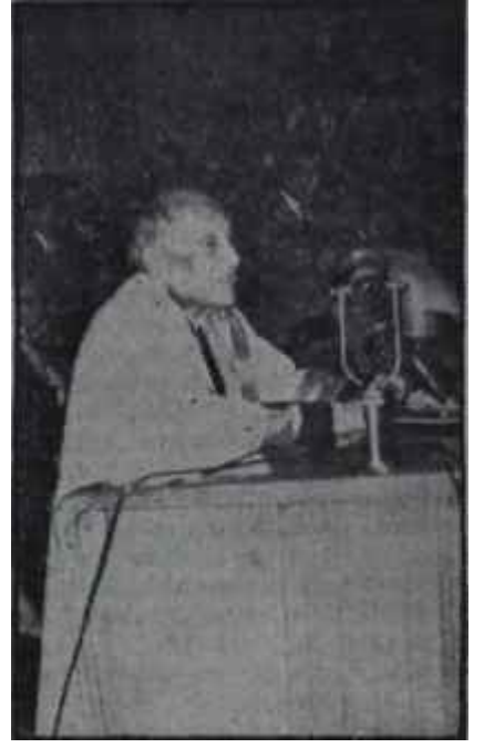
Rektör Onar konuşuyor İlmin sesi

Bir gün sonra bu sefer Gümüşsuyunda, Türkiye'nin bir başka ilim ve irfan merkezinin 187. açılış töreni başlamıştı. 114 ve 115 sayılı kanunların yarattığı keşmekeşten sonra, İstanbul Teknik Üniversitesinin kapalı Spor Salonu titizlikle tezyin edilmişti. Öğrenciler sabah saat 8 den itibaren sükun etmeğe başladılar. Spor Salonundaki organizasyon İstanbul Üniversitesi Konferans Salonundakinden daha muntazamdı. Hiç olmazsa davetliler oturacak yerler bulabildiler. Bir gün öncenin aksine, Gümüşsuyundaki açılış töreninde 115 sayılı kanunun keskin ve insafsız palasının İstanbul Teknik Üniversitesinin .nasibine düşen 28 kurbanından bazılarına tesadüf ediyordu. 28'lerden birinin Spor Salonuna girip öğrencilerin arasına karışması coşkun tezahürata yol açıyordu. Günün sürprizi Kasım Gülekin arzı endam edivermesi oldu. Gülek hayli alkış topladı. Sıraların önüne geçerek belinden itibaren eğilip selâmlar yağdırmak ve sert hareketlerle sağ elini havada sallamak gibi kendine has profesyonelce usûllerle kopan alkışı uzatmasını da becerdi. Salona girer girmez, birinci ve ikinci sıradaki Millî Birlik Komitesi azası olmayan üç resmî üniformalı subayın elini gösterişli şekilde, hareketle sıktı. Gülektan sonra Millî Birlik Komitesi üyelerinden İrfan Solmazır Numan Esin, Orhan Erkanlı ve Or-