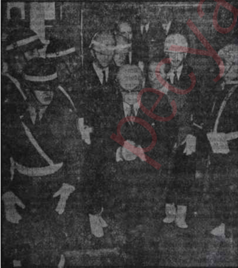
Düşükler muhafaza altında duruşmaya götürülüyor