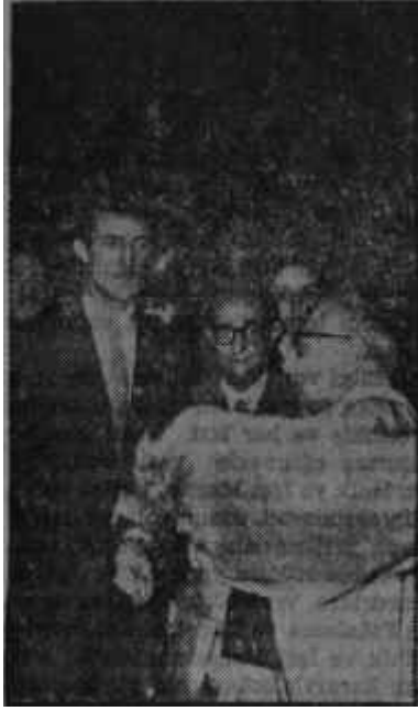
Onara buket veriliyor İlme gösterilen sevgi

öğrenci düşmesi, verimli bir çalışma için asgari şarttır. Bu asgari şart dahi bilim için erişilmesi muhal bir gaye, bir serap iken... -tasfiye hareketi- Üniversitemizin öğretim ve araştırma fonksiyonlarında çok önemli koruluk meydana getirmiştir. Bütün ömrünü binbir fedakârlıkla bu müessese ve bu öğrendiler için harcamış olan bu arkadaşlarımla hakkında âdil bir karar alınacağından emin bulunuyoruz". *