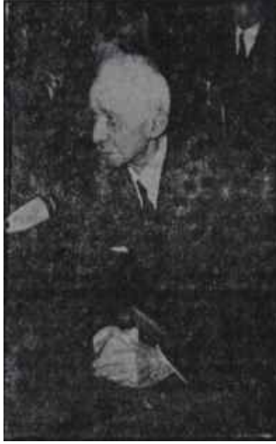
İsmet İnönü Gençlerin sevgilisi

Gençliğin İnönüye sevgi tezahüratında bulunmasına sebep olan toplantı, Ankara Üniversitesi'nin açılış töreni toplantısıydı. Tören saat tam 10.30