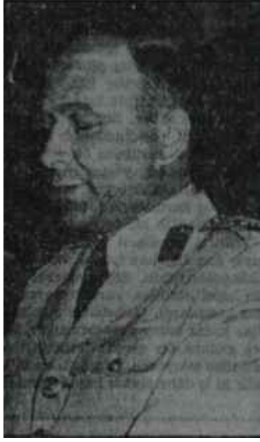
Orhan Erkanlı Komitenin kolu

Komitenin çalışmalarına Devlet ve Hükümet Başkanı Org. Gürsel sık