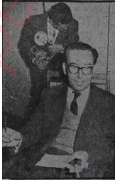
Feyzioğlu konuşuyor Bir organizatör

Kurucu Meclis Komisyonunun vazifeye başladığı, gündün bu yana ka-