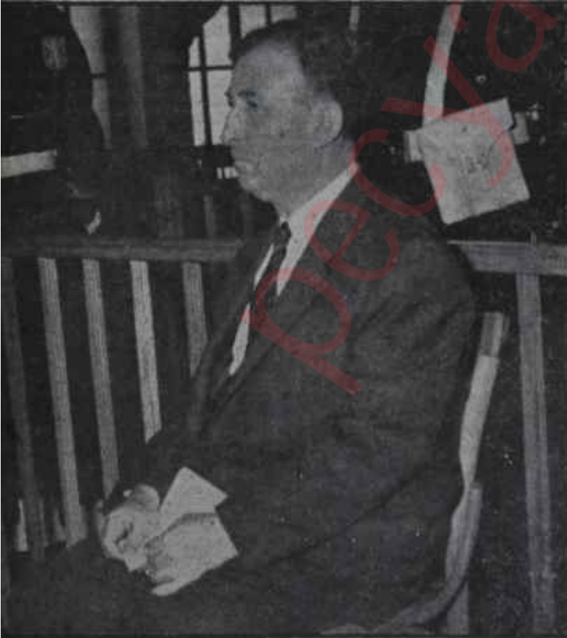
Mandalinci duruşmalarda dinliyor Ayıkla pirincin taşını

Böylece, haftanın başında "nüfuz ticareti" denilen âfetin dört başı mâmur bir örneği Yassıdadada gözler önünde belirdi. Ortada, yapılan hiç bir gayrikanuni muamele yoktu. Vinileks mükemmel bir inkişaf kaydet-