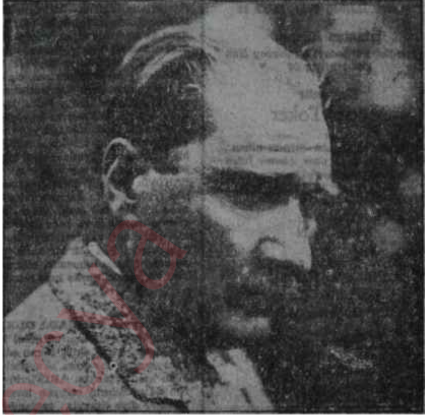
M. Kemal Atatürk