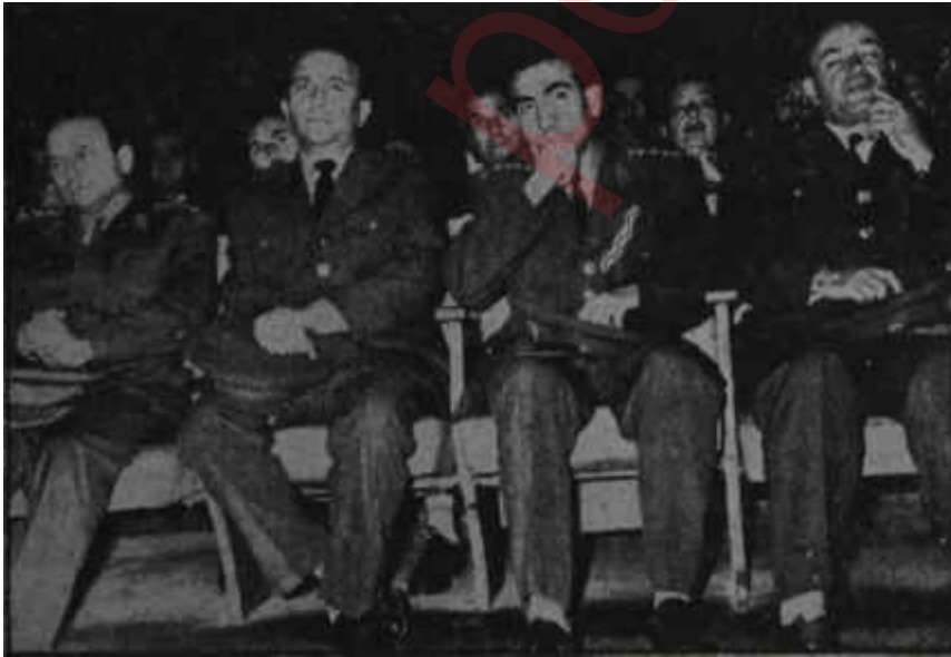
Millî Birlik Komitesi üyeleri üniversitenin açılışında

"... 1959 yılının Eylül ayında Dijon'da toplanan... Rektörler Konferansında tebarüz ettirildiği gibi bir öğretim üyesi veya yardımcısına 10