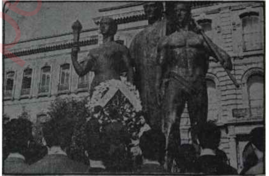
Öğrenciler üniversite bahçesinde