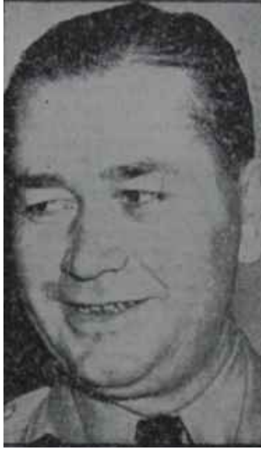
Sami Küçük Okumuş adam

Genel Başkanlığın muhtariyeti üzerinde de hassasiyetle durulmuştu. Seçilecek Genel Başkan altı yıl müddetle değiştirilemeyecekti. Değiştirilmesini gerektiren haller varsa -idari yetersizlik ve ahlâk bozukluğu -Büyük Millet Meclisi. Başbakanlık veya Cum