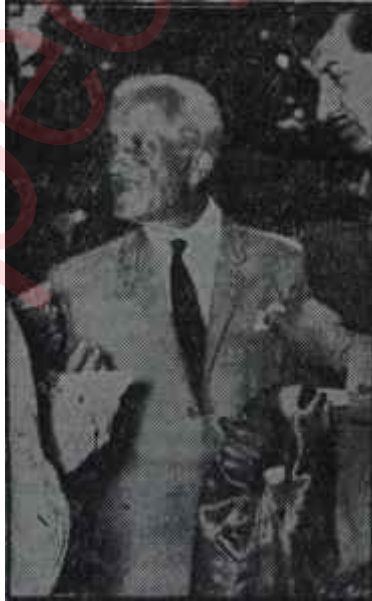
Necip Fazıl Kısakürek

Kararnamenin eğlenceli ve alâka çekici bir muhtevası vardı. Hele şahitlerin ifadeleri dikkate değer mahiyetteydi. Bunların içinde en alâka