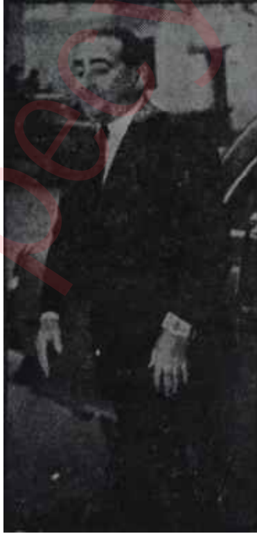
Adnan Menderes Günahkâr adam