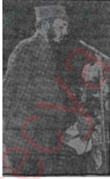
Fidel Castro İşler karşı

Öte yandan, Küba işi Amerikadaki başkanlık seçimi kampanyasının da bellibaşlı konusu hâline gelmişti. Castro'nun Amerikan aleyhtarı faaliyetlerine karşı Amerikan halk oyuunda duyulan nefret o kadar büyüktü ki hiçbir aday Amerikanın Küba Milletine karşı çok eskiden be-