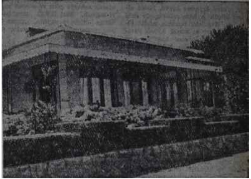
Aydanın İstanbuldaki sayfiye ev

Genç kadın evine, tebligatın yapılmasından on dakika sonra geldi. Üzerinde açık sarı bir trençkot vardı. Kırmızı, siyah, gri kareli skoç bir eteklik, koyu sarı çok sık ve zengin