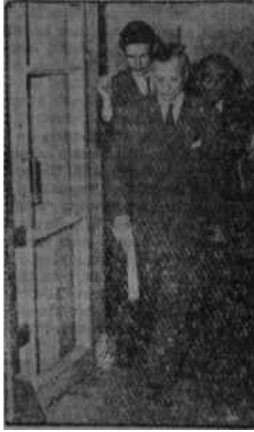
Fikret Narter İlmin şerefi

Bir çok Komite üyesinin etrafını saran ve onları, bazen nasıl emsalsiz insan olduklarını tekrarlayarak, kudretlerinin sonsuz olduğu yolunda telkinlerde bulunarak, hattâ ne kadar yakışıklı kimseler olduklarını sosyete sütunlarında yazarak o belirli istikamete sürüklemek isteyenler esasta başarı kazanamamışlardı. Komite, memleket idaresinin kendi eline milletçe niçin terk edildiğini hatırdan çıkarmaya niyetli görünmemiş, demokratik nizamı tesis gayesinden uzaklaşmamış, gidicilikten vazgeçmemiş, kendisine bir de müddet çizmişti. Ama salon ideologları bir takım yan meseleler konusunda bir çok üyeyi tesir altında bırakmaya muvafak olmuşlardı. İhtilâli yok Babâlden geçirmek, yok Beyazıtın geçirmek işte bu tesirlerin neticesiydi. Kışkalarından çıkarak bir anda kendilerini politikanın tâ içinde ve karışık düzenbaz ir muhitin ortasında bulanlar yol gösterici rolünü görülmemiş el çabukluğuyla üzerlerine alanlara sarılmışlardı. Bunlar, komite üyelerine herkesi ve her müesseseyi kötülüyorlar, onları cemiyetin hali karşısında iğrenme hissine itiyorlardı.