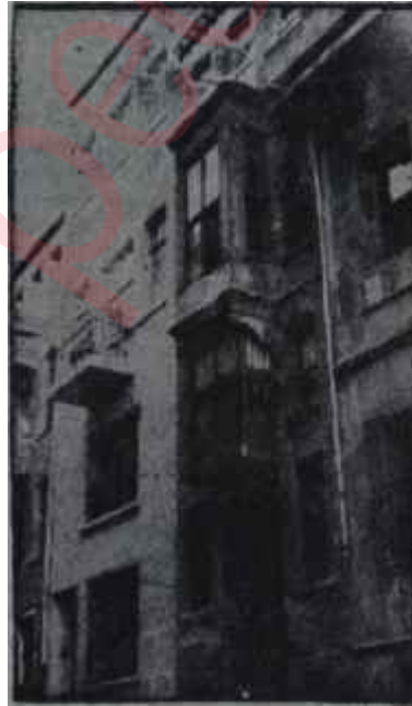
O. Enginin evi

"— Bugün paralar yandı. Bilet ücretini dahi çıkaramadık" diye şakalaşiyorlardı.