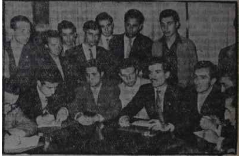
Öğrenci teşekkülleri tasfiyeyi protesto ediyorlar