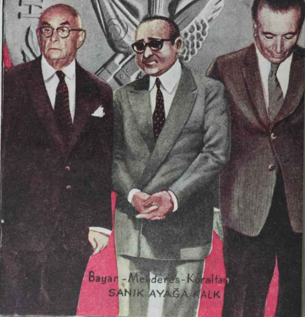
Bayar - Menderes - Koraltan SANIK AYAĞA KALK