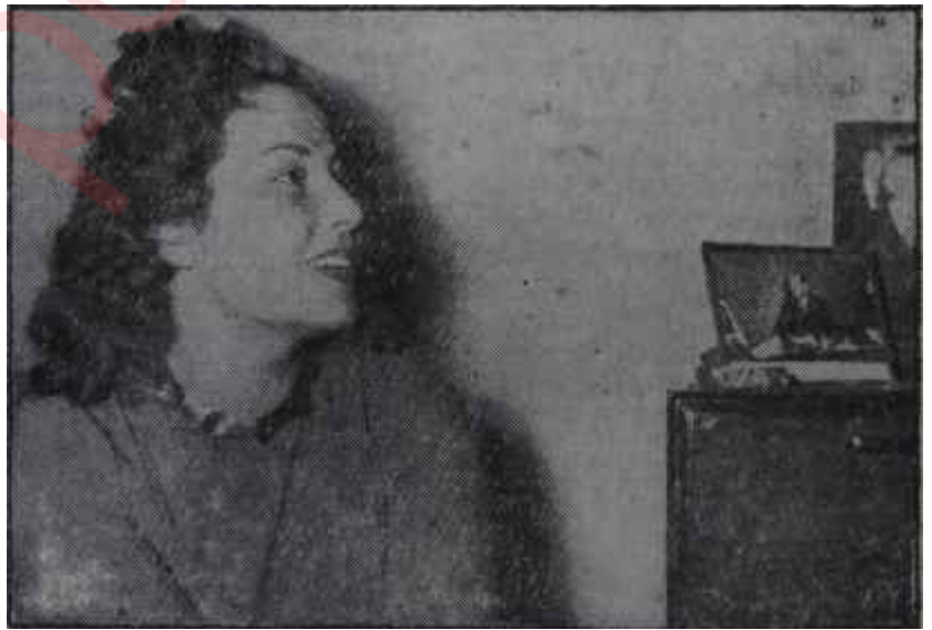
Ayhan Aydan Menderesin portresi önünde

Kani Verana başkanlığındaki 12 Numaralı Tâli Kurulla döviz işlerini ve haksız iktisabı tahkik eden, Ziya Kanal başkanlığındaki 9 Numaralı Kurul, haftanın ortasında işbirliği yaptılar ve ellerindeki dosyaları Genel Kurula yetiştirmek için mücadeleyle giriştiler. Çalışmalar iki kısımda cereyan ediyordu. İlk kısım ifade faslı olarak mütalea ediliyordu. Kurullar, ortalama olarak günde 10-15 kişinin ifadesini alıyorlardı. Bu ifadeleri 10 yıllık kirli işler devrinde, usulsüz olarak alınan paralar ve dövizlerle alakalıydı, ikinci kısım, ifadelerin tevhidini ve bu ifadelerin raporlar haline getirilmesi kısmıydı. Bunun için Kurul üyeleri aralarında bir iş bölümü yaptılar. Bir kısmı, düşüklerin haksız muamele ile menfaat sağladıkları şahısların ifadelerini alırken, diğerleri dosya münde-