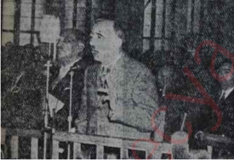
Köprülü Yüksek Adalet Divanına ifade veriyor Bir "İstanbul döneltimci" daha...