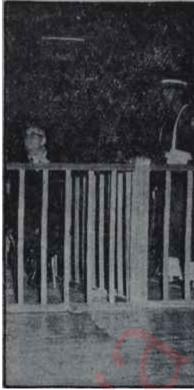
Bayar sanık mevkiiinde "Gözü kararmış" bir adam