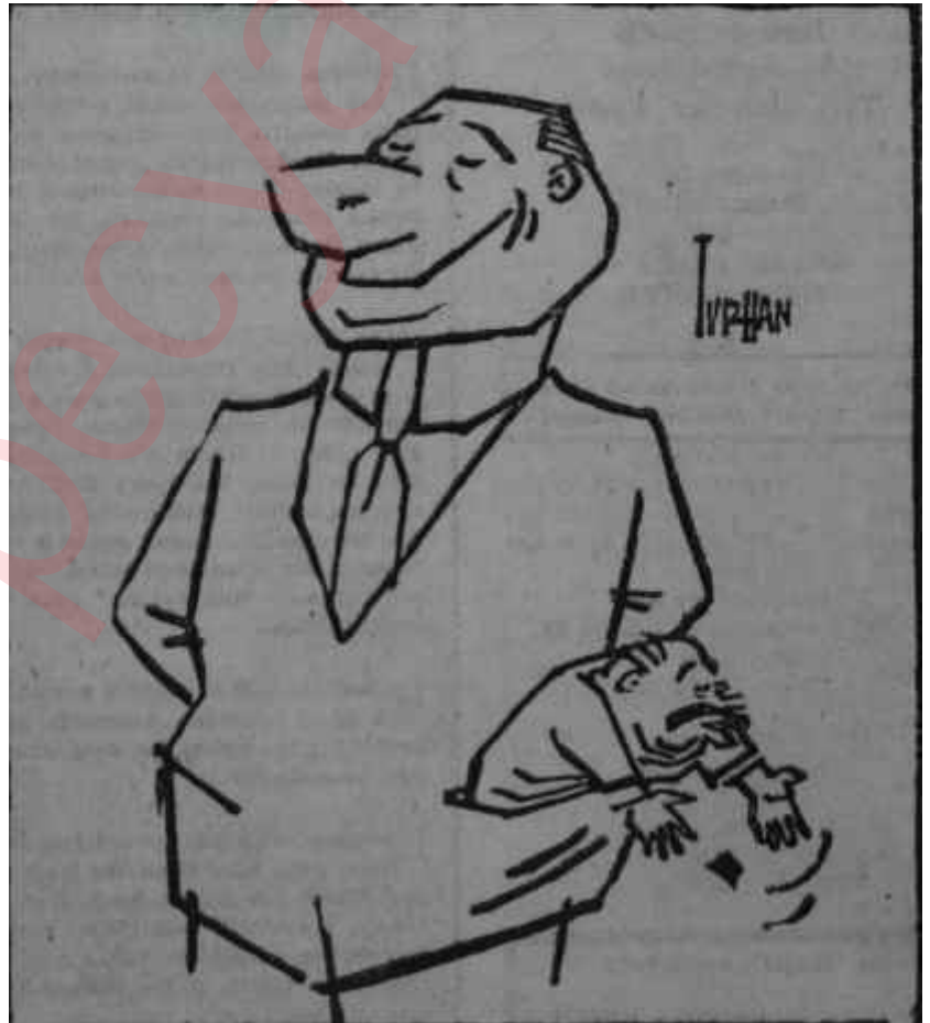
F.K.G. - DERMİMİ ANLATAMIYORUM BİR TÜRLÜ ...6/7 EYLÜL HADİSELERİYLE İLGİM YOK BENİM.

Nitekim bir gün evvel, perşembe sabahı Yassıadanın jimnastikhaneden bozma duruşma salonu inanılmayacak derecede tenhaydı. Gündemde "Köpek Dâvası" vardı. Dâva