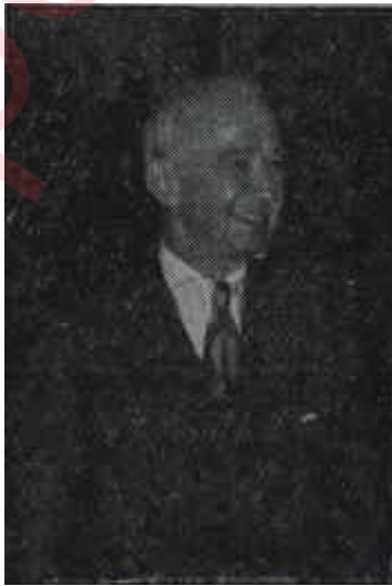
İsmet İnönü Milletin sevgili

İnönünün salona girmesi, sahne- de Hind Bale Topluluğunun gözükmesini bekleyen Ankaralıların gözünden kaçmıştı. C.H.P. liderinin yerine oturmasından bir iki dakika sonra sahnede, Hind Bale Topluluğu değil, ama, topluluğun, yararına bu gösteri-