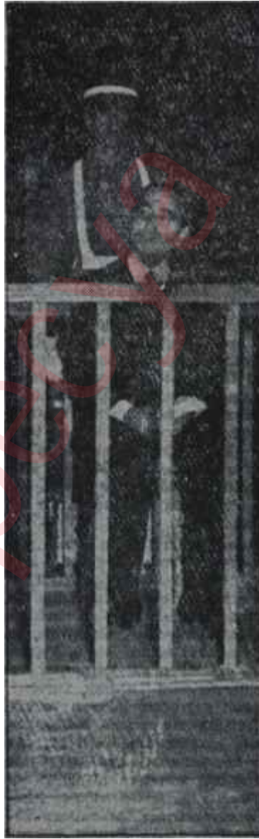
Düşük Menderes duruşmada Artistik pozlar