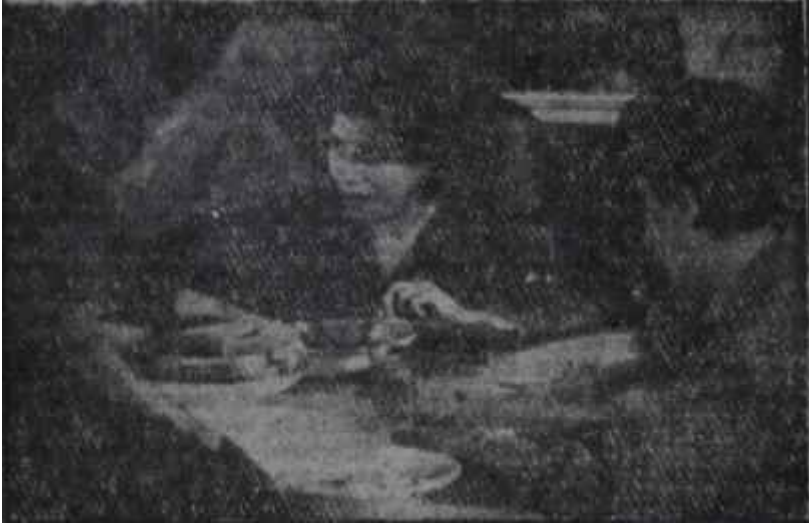
Düşük kadın milletvekilleri yemekte