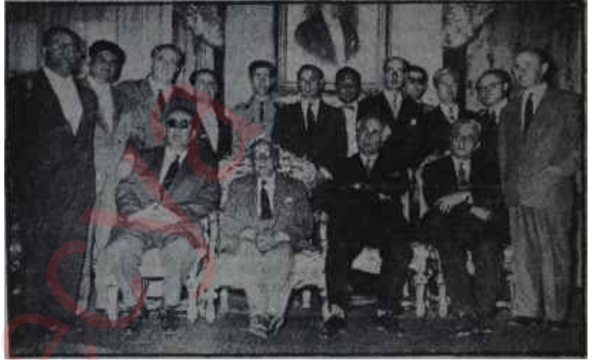
Anayasa Komisyonu üyeleri bir arada