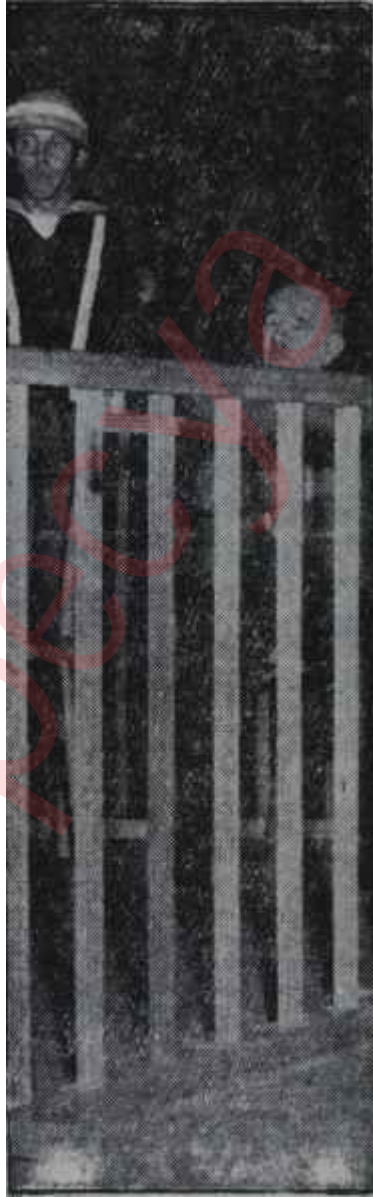
Fuat Köprülü Başı dertte

B aşkan evvelâ Köprülüyle Gökay birlikte mikrofona başına çağırıldı. Köprülü eski İstanbul valisi ve yeni kader arkadaşından beş parmak kadar uzundu. İki ahbap çavuşlar mikrofona başında numara yapan çift balarısına benziyorlardı. Başka herkesin ağzında dolaşan bir hususu kendilerinden sordu. Bu, "te hikâyesi" neydi? Güya Gökay, o gece konuşulanları banda almıştı ve bant sayesinde devrin ileri gelen rini avuçu içinde tutuyordu. İki ahbap çavuşlar böyle bir hâdiseden haberdar mıydılar? Köprülü, adeta malûmat beyan etti. Bu mevzu hiç bir şey bilmiyordu. Gökaya gelince o, şayanın kendi kulağına geldiğini söyledi. Fakat şayanın lı yoktu. Sadece, cereyan eden vakaları dakikası dakikasına zaptetmişti -yazmak suretiyle-. Her halde haber ondan galattı. Halbuki işin aslında haber F.K.G. nin ta kendisinden galattı. Bu nevi oyunların me raklısı Gökay "teyp hikâyesi"ni biz zat doğurmamış da olsa bizzat beslemiş, adamlarına besletmişti. Kö