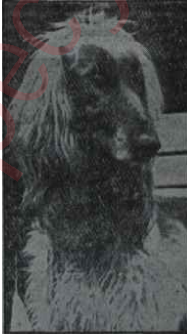
Afganlı "Bastı" Kim bastı ?

terlerinin bir vasfı olarak tescil etmektedir. Ama Türklere devrilen idarenin gayrimeşru hâle düştüğünü anlatmak için bu gibi vasıtalara lüzum yoktur. Türkler devrilen idarenin gayrimeşru hale düştüğünü evvelâ anlamışlar, ona karşı sonradan ayaklanmışlardır. İhtilali bir avuç aydınn eseri saymak ve memlekette Demokrat düşükleri halâ sıkı sıkıya tutan kalabalık bir kütle nin mevcudiyetine inanmak nedense batılı gazetecilerin kapıldıkları bir zehaptır. Bu, biraz da tükürülenin yalanamamasının neticesidir. Bir çok batılı gazete D.P. iktidarının son yıllarında bu iktidarın çığırda çıkmış olduğunu belirtmekle beraber bir iyi tarafı bulunduğunu, bu yüzden köylerde tutulduğuna tez olarak savunmuştur. D.P. yi köylünün tuttuğu masalı son zamanlara -bilhassa 1957 seçimlerine kadar Türkiye'de dahi yaygın bir inanç olduğuna göre yabancıların böyle bir teşhis hatasına düşmelerini mazur görmek gerekir. Mesele bu yanlış inancı dışarda beslemekte devam etmemek, içerde ise onu zihinlerde muhafaza suretiyle Köpek ve Bebek meselelerini ön plâna çı-