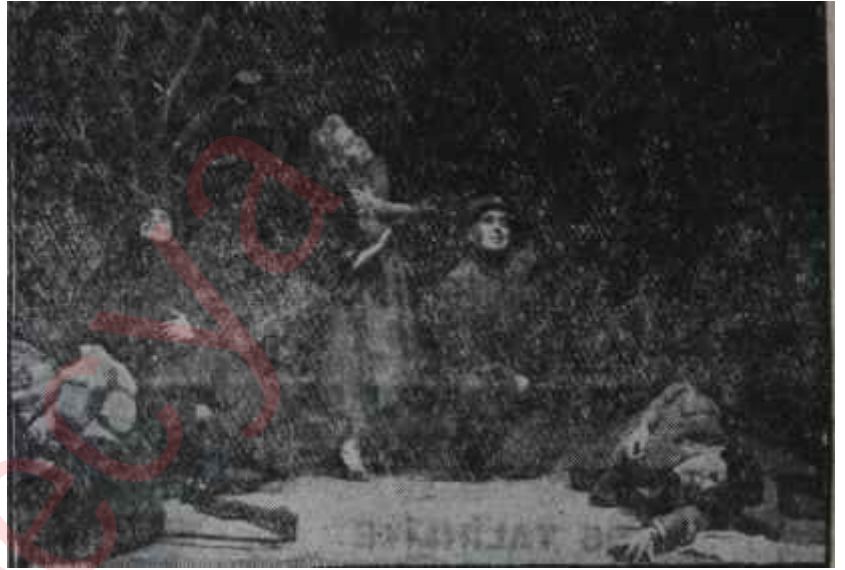
"Cephede Piknik"ten bir sahne

yor, annesiyle babasını oraya getiriyor, bir pazar günü kır gezintisine çıkmışlarcasına güle oynaya ailece "piknik" yapıyor, hattâ bu pikniğe -farkında bile olmadan- esir aldığı düşman erini de iştirak ettiriyor. Ya o konuşmalar.. Arasına duyulan bombardıman Ve makineli tüfek sesleri de olmasa, seyirci, bu insanları cep hede, atış hattında değil, amatörce yapılan bir harb oyununda, yahut ciddiye alınmayan bir askeri manevrada zannedecek. İşin şaka olmadığını son perde kapanırken anlıyoruz. Bu kır safası bir "kanlı piknik" halini aldığı zaman, çocuklar kadar sâf ve temiz yürekli, çocuklar gibi hür yaşamaktan başka bir şey istemeyen