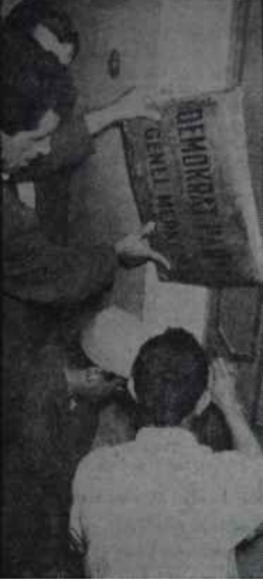
D.P. levhası indiriliyor Bir hikâye böyle biter

Mayıstan bu yana girilmemiş bulunan D.P. Genel Merkezinin içi küf kokuyordu. Yerlerde sayısız kara sinek ölüsü vardı.