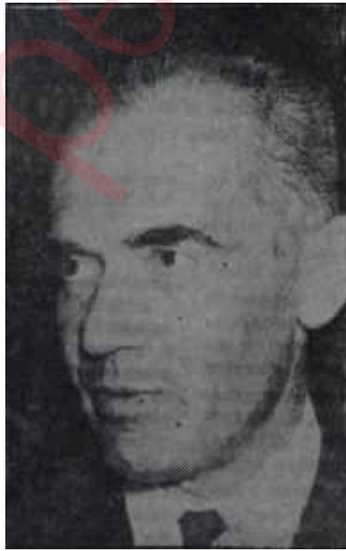
Ragıp Üner İftiraya uğradı

şehirlerarasımdan İstanbulda Vahit Turhanın aranmasını ve acele bağlanmasını istemişti. Şehirlerarası memuru iyi bir kanal seçerek İstanbuldan 63 64 15 numaralı telefonu Başkent'in meşhur 27070 numarasına bağladı. İstanbuldan konuşan ses hafif heyecanlıydı. 27070 kendisini acele Ankaraya davet etti. Prof. Vahit Turhan Başbakanlığın kapısından içeri girerken, saatler 9.25'i gösteri-