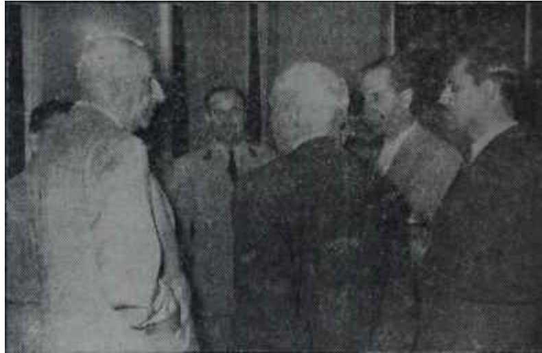
Devlet Başkanı Gürsel Çankayadaki kokteylde Kokteyl içinde kokteyl

"— Bunların yazmalarına alışacakınız. Sakın kızmayın ha.. Bırakın yazsınlar. Bunları yola getirmek için en iyi çare, istedikleri kadar se-