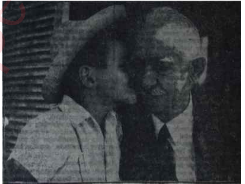
İnönü torunu Hayri İnönü ile birlikte İyi aile bağılığı = İyi çalışma

İnönünün konuşmak lüzumunu niçin hissettiği ve ne söylemek istediği iyi tertiplenmiş demecinin okunması bittiğinde gazeteciler tarafından mükemmelen anlaşılıyordu. Gazetecilerden biri "İki Paşa arasında mutabakat tam" dedi ve bu, doğru bir