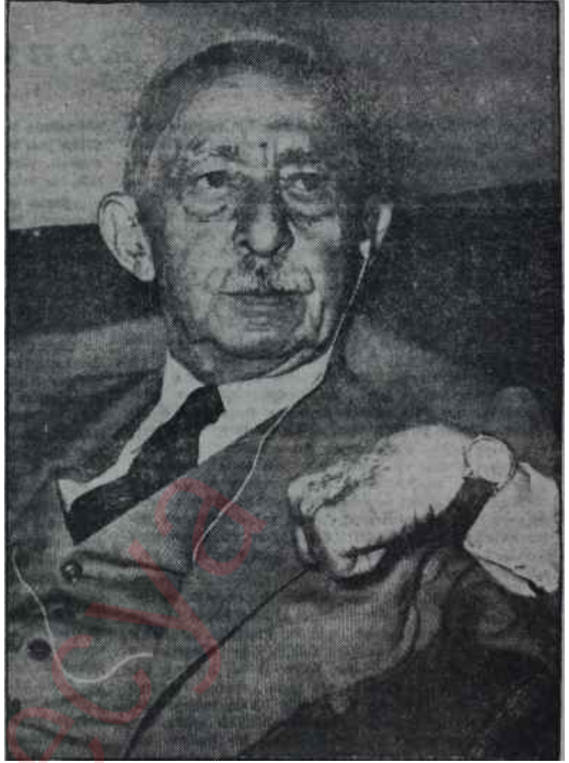
İnönü basın toplantısında Olimpos dağından bir ses