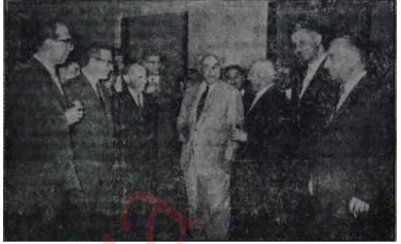
Gürsel Kabine üyeleriyle birlikte Huzur sebeplerinden biri

relerinde sevinç sayhaları arasında -evet, bayağı sevinç sayhaları- okundu. Zira 27 Mayısın yaratıcıları ve 38'lerin hakiki dayanağı olan bu çevreler Millî Birlik Komitesinin kendilerinden uzaklaştırılması manevralarını hüznle takip ediyorlar, bu manevraların netice verdiği zehabını uyardıran bazı talihsiz demeçleri, hareketleri, ihtiyatsızlıkları üzülecek seyrediyorlardı. Elbette ki azimlerini kaybetmemişlerdi, elbette ki son zaferin kendilerinde kalacağını biliyorlardı. Ama bağırlarından kopup gelmiş bir hareketin maksatlı ellerce dejenere edilmesine çalışılması karşısında mahzun olmamak elbette ki kabil değildi. İnönü'nün beyanatından sonra Millî Birlik Komitesinin açıklanan "Ana Fikir"i 27 Mayısın şevkini iade etti. 38 subayı 38 havari gibi görüp tıpkı Menderese yapıldığı tamda onları da "Allahın Türkiyeye bir lütfu" sayarak "Bu partilerle memleket adam olmaz, geldiniz hemen gitmeyiniz" diye girişilen manevralar böylece boşa çıkıyordu. İhtilâl, evlâtların yemek, kendisini yaratanları karşısına almak niyetinde değildi. Yobazlar -sarıklı yobazlar ve sözüm ona aydın yobazlar- iki yanaklarına birden iki şamar yiyorlardı.