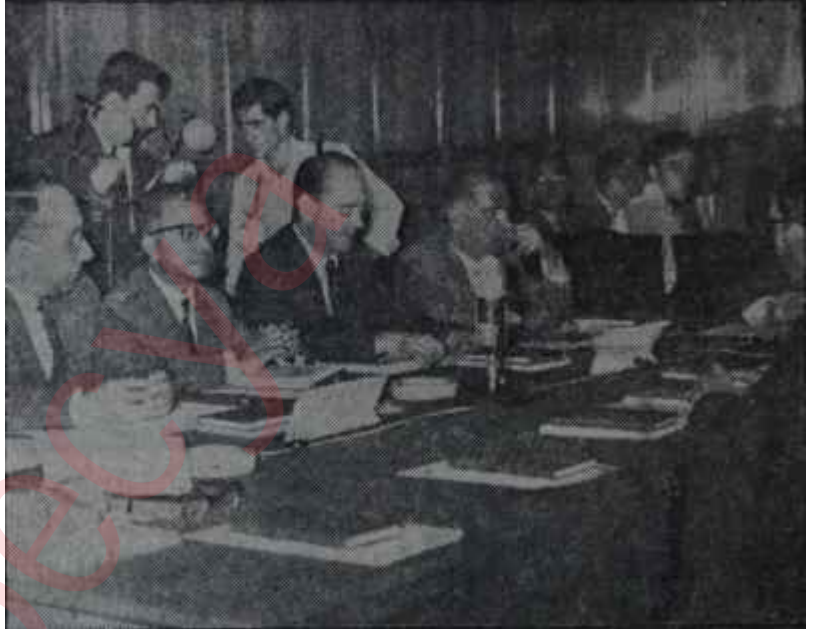
Eğitim Komisyonu faaliyet halinde Seferberlik öncesi