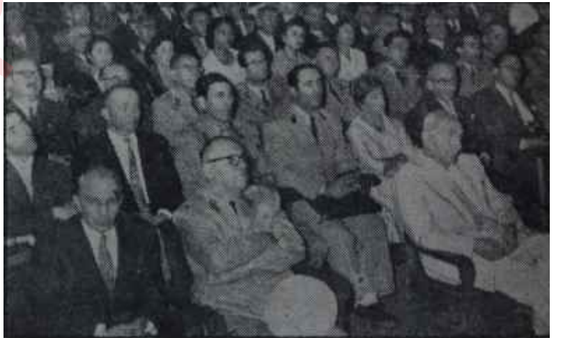
Adli yıl kutlanıyor Hatırlanangelenek

Sâbık Başbakanın çalışma odasının kapısında "Başkan" ibaresi yazılıydı. Odada, Genel İdare Kurulu toplantısından alınmış büyük ebatta