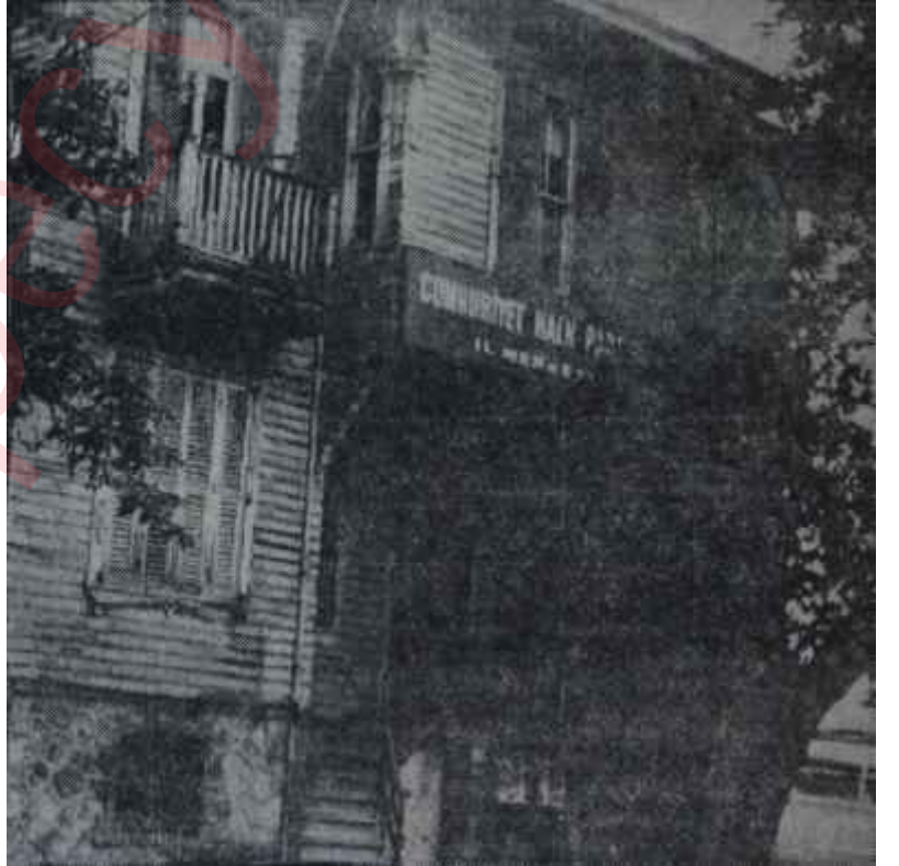
İstanbul C. H. P. İl Merkezi Yeni arı kovani

Bu komisyonlar hazırlayacakları raporları C.H.P. İl Danışma Kuruluna verecekler, Danışma Kurulu vasıtasıyla C.H.P. Araştırma ve Dokümantasyon Bürosuna göndereceklerdi. Bu büro tarafından yeniden incelenecek olan bütün bu komisyon raporlarının neticesinde, 1961 de yapılacak olan genel seçimlerde, C.H.P. nin güvenerek millet önüne çıkaracağı "Seçim Beyannamesi" hazırlanacaktı. Bu suretle "zihinlerde hiç bir