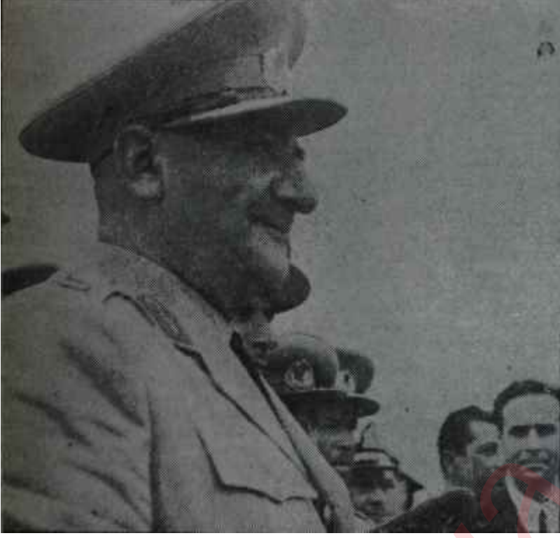
Orgeneral Gürsel Bir teminat

Köprüler atılmış kalmaktadır. Başka bir talihsizlik belirli İnönü ve CHP. düşmanlarının Milli Birlik çevrelerini artmış bulunmaları ve onları telkin altında tutmalarıdır. Şu veya bu partinin safında İnönüyle uğraşmaya halkın yenilen, kendisinde "milletin beklediği lider" vasıfları tevahhüm edip bir fiskede siyaset sahasından eliniverdiği için yüreğinde aşağılık duygularının bütün arazlarını muhafaza etmiş kimselerin şimdi sanki gayriresmi sözcüymüş tavrı takınmaları ve iki lâf arasında mutlaka C.H.P. ile D.P. yi aynı sepette göstermeye kalkışmaları memlekette es- -eye başlayan havanın mucip sebepleri arasındadır. İnönü, geçen hafta--- sonundaki demeciyle bu sınıfın gayretlerine karşı açık, sert, kati ihtarını yaptı. Şimdi, bu tutumu kuvvetlendirmek için topa vurma sırası Gürseldedir. Gürselin Milli Birlik komitesinin fikrini ve görüşünü, Komitede açılacak bir müzakereden ve varılacak karar üzerine Türk milletine resmen ifadesi geniş fayda sağlayacak, bir müddetten beri hakiki vatanseverlerin bogazına atılmış durum yumruğu kaldırıp atacak, güneş- 27 Mayıs günlerini geri getirecektir. Bu, bazı genç Komite üyelerini de şüphesiz daha fazla "devlet adamı"