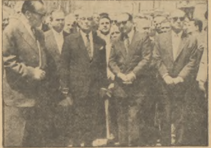
Adnan Menderes bir cenaze merasiminde

Yeni edebiyatın Menderes ismi etrafında geliştiğini kulak gazetesinin nesriyatı ve bu mektuplar açık şekilde gösterdi. Aslında taktik başarılıydı. Menderes, on yıllık kesif propagandanın neticesi bazı çevrelerde hakikaten müstesna bir mevki edinmiş, kendisine bağlı fanatikler türemişti. Bihassa basit zihniyete sahip çevrelerde düşük Başbakan prestij edinmiş, aslında olduğundan bambaşka şekillerde tasavvur olunmaya başlamıştı. D.P. nin kuyrukları için mühim sayı-