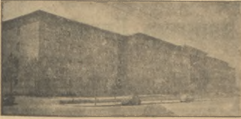
Ulaştırma Bakanlığı binası