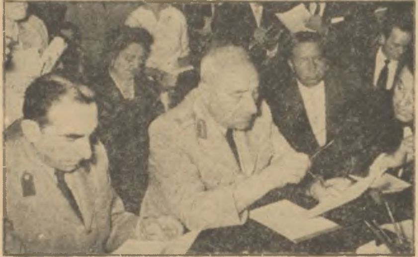
Devlet Başkanı Gürsel basın toplantısında

Doğrusu istenilirse cevapları hazırlayanlar, eğer bu oyuna gelmeyi hususi surette arzulamamışlarsa pek ihtiyatsız davranmışlar, bazı talihsiz ibareler kullanmışlardı. Meselâ ilk suale verilen cevabın bir yerinde "Millî Birlik Komitesiince iktidar, C.H.P. ye değil, seçimi kazanan partiye devredilecektir. Bu parti pekâlâ Halk Partisinden başkası da olabilir" deniliyordu. Ashında fikirde