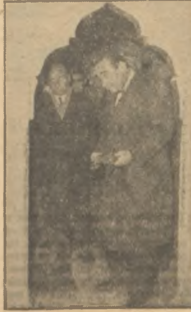
Menderes camide Aptestsiz namaz

Bunların yaydıkları bir hikâye şuydu: Adnan Menderesin Yassıada-