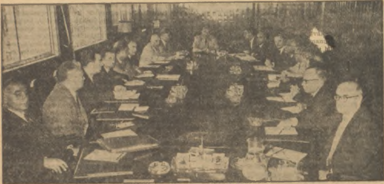
Eski Bakanlar Kurulu toplantı halinde