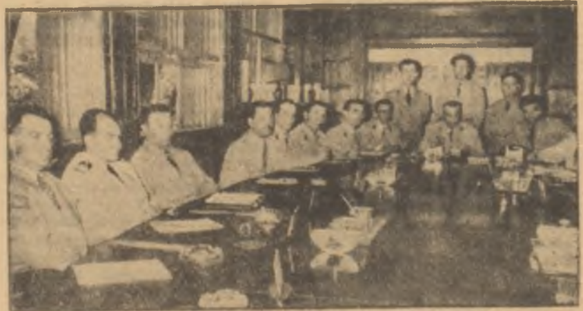
Millî Birlik Komitesi faaliyet halinde