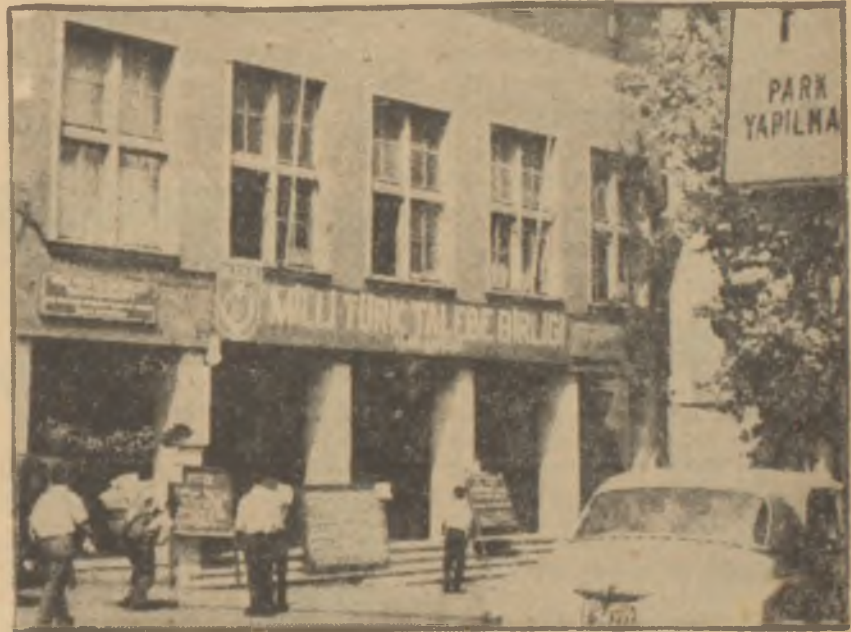
Millî Türk Talebe Birliği Genel Merkezi

Birleşme fikrinden yana olan öğrenciler bu son durum karşısında Millî Birlik Komitesinin alacağı karar beklemekten başka çâre göremiyorlardı.