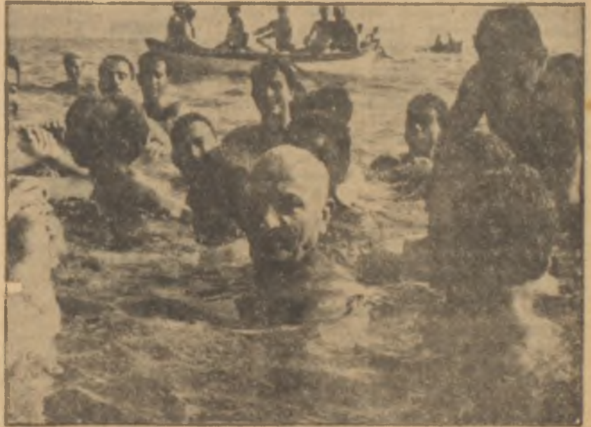
Orgeneral Gürsel yazın yorunluğunu çıkarıyor