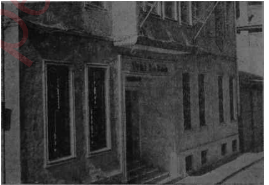
Kılıçoğlunun meşhur "YeniSabah"ı

Garipti ama bu fikir, iyiniyet erbabı bir takım yazarlar tarafından, da paylaşıldı. Sanki C.H.P. eski iktidar bir serbest ve dürüst seçim yapardı yüzde bin kazanamayacakmış gibi iktidarın bu partiye gitmemesi için bir başka partinin kuvvetlenmesi ne müddet istiyorsa seçimlerin