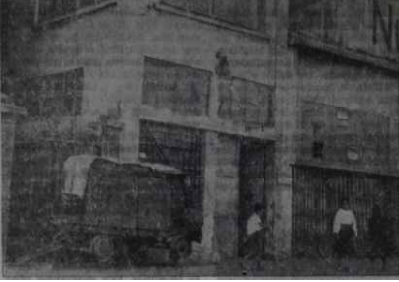
Tercüman Matbaası Üstad Peyaminin atlama taşı!

ancak o tarihte yapılmasını savunuyorlardı. Millet reyini C.H.P. ye verdikten sonra millete vasilik etmeye kalkışmanın mânası neydi, anlamak zordu. Mesele C.H.P. yi iktidara getirip getirmeme değildi. Mesele G.H.P. iktidara geldikten sonra D.P. gibi hareket edemesin, onun çaresini ve şartlarını sağlamaktı. Bu sistem hazırlandıktan sonra CELP. ye rakip bir partiyi beklemek balığın kavağa çıkmasından daha akıllıca bir hareket, olamazdı. Fakat iyiniyet erbabının da peşin hükümlerinden, bir takım hislerinden, eski düşmanlıkları veya antipatilerinden, şahsi meşelerinden faydalanarak cereyanı idare edenler bununla bir belirli havayı Türkiye'ye yaymak gayesini güdüyorlardı. Bir defa bütün politikacıların suçlu olduğu kanaati yayılırsa ve politikanın kendisinin memleket hayırına bulunmadığı fikri kafalara sokulursa memlekete on yıl zarar veren Bayar - Menderes rejiminin büyük kellelerini kurtarmak kaabil olacaktı. Nitekim Orhan Seyfi Orhon Bayarın idam edileceği lâfının dolaşmasından bile hoşlanmamış, hemen bir fıkraya döşenmişti. Ama asıl hedef, yarın duruşmalar bşaladığında eski İktidarın büyük kellelerinin kurtarılması için tutulacak savunma taktiğine milleti şimdiden suni olarak ısındırmaktı. .