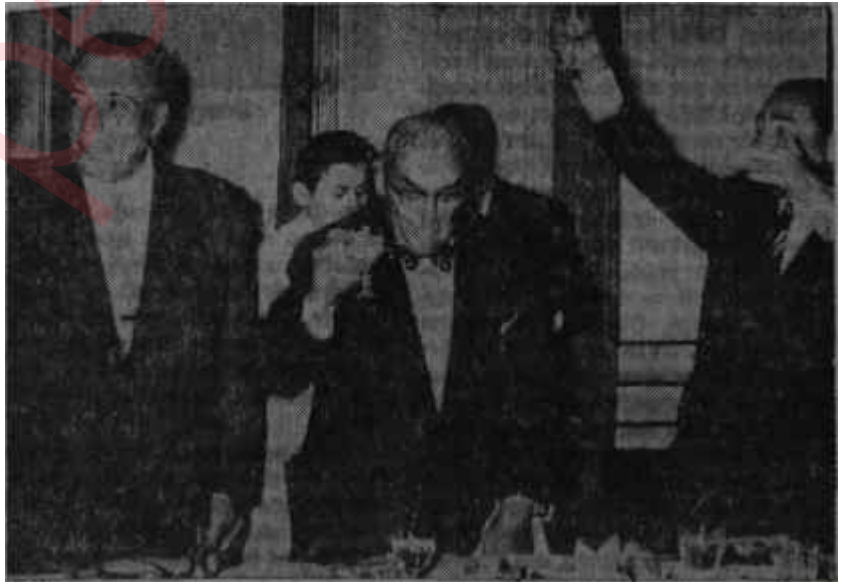
Bayar hususi hayatında

Bayarın son onbeş yıllık faaliyet herkesin hafızasındadır. Muhalefet yıllarında devrin iktidarının sağladığı imkânlarla o kadar inandırıcı olabildi ki 1950 de milletin sevgilisi olarak iktidara geldi. Fakat kudret devri Bayarın bütün foyasının meydana çıkmasına yol açtı. Bugün en sert adamın dahi yüreğinde Yassıada sakinlerinden bir veya birkaçı hakkında merhamet hissi mevcuttur. Ama bütün Türkiye'de Bayara acıyan, hâttâ onun yumuşak şekilde cezalandırılmasına razı olan tek şahıs bulmak kaabil değildir. Bunun sebebi rejimin hakiki mesulünün, fenalıklarının menbainin Bayar olduğunu herkesçe bilinmesinden ibarettir. Nasıl İnönü'nün talihi uzun ömrü olmuşsa, uzun ömür Bayarın talihsizliğini teşkil etmiştir.