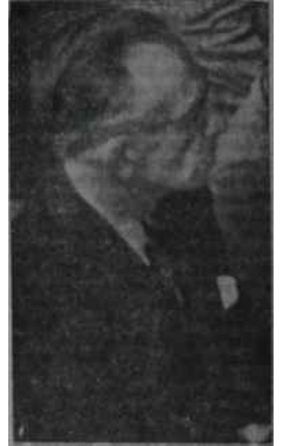
Peyami Safa Meçhul kahraman

Ankarada tehlike çanının sesine ciddiyetle kulak verildi.