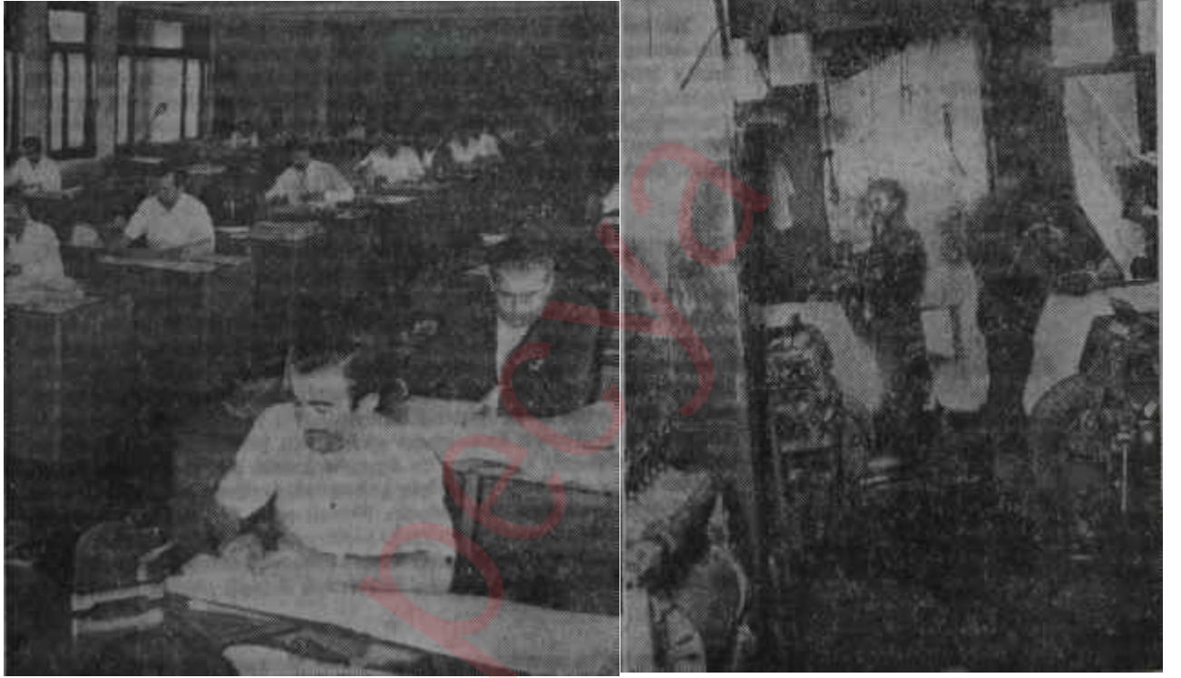
Bir devlet dairesinde ve hususi bir dokuma fabrikasında çalışanlar

Ancak, iki sektörün gidişe pek ayak uyduramadığı bu hafta daha iyi sezildi. Devlet daireleri yaz rehavesini silkeleyip atamamışlardı. İzinler kaldırılmıştı, fakat akıllar izinler-