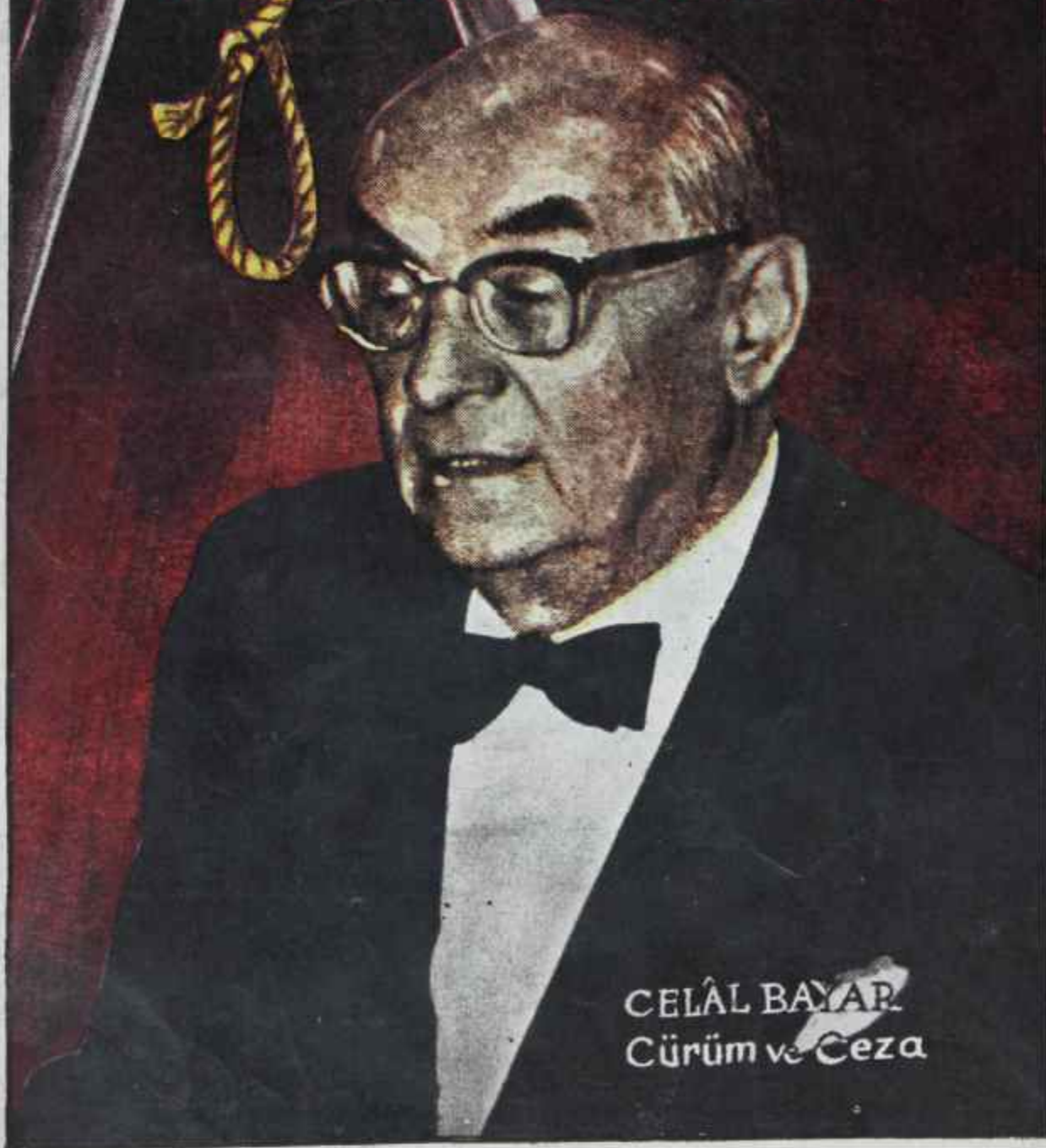
CELÂL BAYAR Cürüm ve Ceza