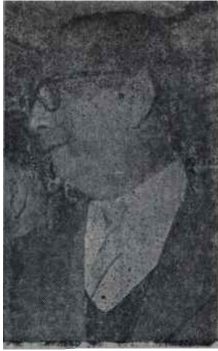
Burhan Belge Beceriksiz radyocu...

nurken belki "birisi durumu sabote etmişti veya edebilirdi. ;