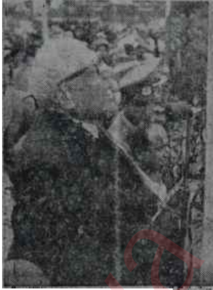
Siddık Sami Onar

Bu haftanın başında Ankarada yeni idarenin en kısa zamanda işleri tasfiye etmek ve normal bir meşru idareye tertemiz memleket devretmek niyeti açık şekilde seziliyor, bütün çalışmalar o istikamette oluyordu. Beklenen, Siddık Sami Onarın başkanlığındaki ilim heyeti tarafından hazırlanacak Anayasa ile Seçim Kanunuydu. Gerçi miras o da-