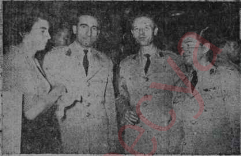
Muhafız alayının Çankayadaki kokteyli Zenginliği: Samimiyet

Kokteyde fena halde sıkılan bir general daha vardı: Cemal Madanoğlu.. İhtilâlin bu mütevazi generali kendisine edilen iltifatlardan boğulur gibi oluyor ve başını öne eğerek kendisinin hiç bir şey yapmadığını, bütün işi genç subay arkadaşlarının