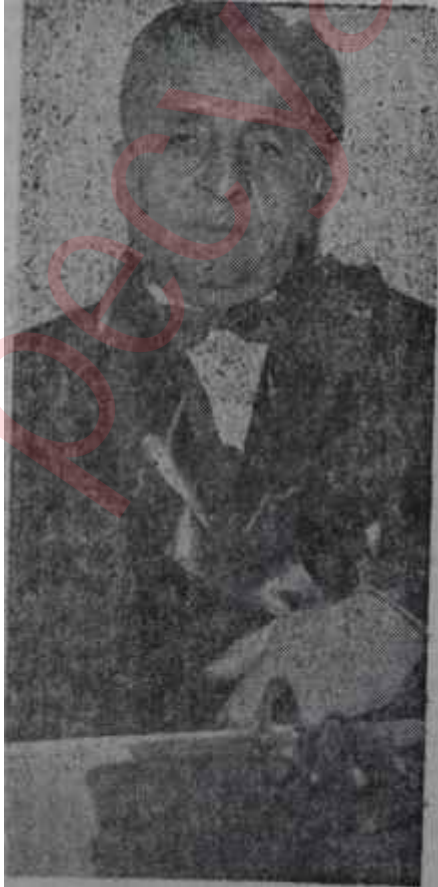
H. Naili Kubalı Hukuk devletin temel taşıdır

C — Memurların siyasi partilere girmesine taraftarız. Ancak memurların ifa ettikleri âmme hizmeti sebebiyle, seçim zamanları hariç, faal siyaset yapmaları doğru olamaz.