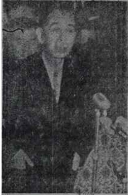
Kişi Anlayışlı Başbakan

Bu nümayişler, Japon Sosyalist Partisi ile muazzam işçi konfederasyonu Sohyo tarafından tertip edilmişti. Haftalardan beri devam, eden nümayişlerden maksat, birkaç ay önce imzalanmış olan yeni Japon-Amerikan İttifak Andlaşmasının tasdikini önlemektir. Başbakan Kişi, seçimlerde kuvvetli bir azınlık, ama nihayet bir azınlık olan Sosyalistlerin baskısına rağmen, Andlaşmayı parlâmanter yollardan müzakere ettirmek ve tasdikini sağlamak istiyordu. Muhalefet isterse gelir Diet'te fikirlerini söyler, protesto mitingleri tertip eder, gazetelerinde istediğini yazabilirdi. Ama çoğunluğun memleketi idare etmek hakkına tecavüz etmesi de gerekirdi. Bu hususta Kişi kararlıydı. Büyük iş adamları