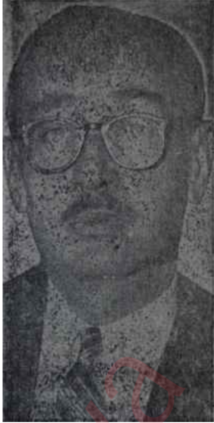
Ragıp Banca Mücadele bitmedi

d. Milletvekilliği üstün ve refah içinde yaşama imkânını sağlayacak bir mali imkan yaratmamalıdır.