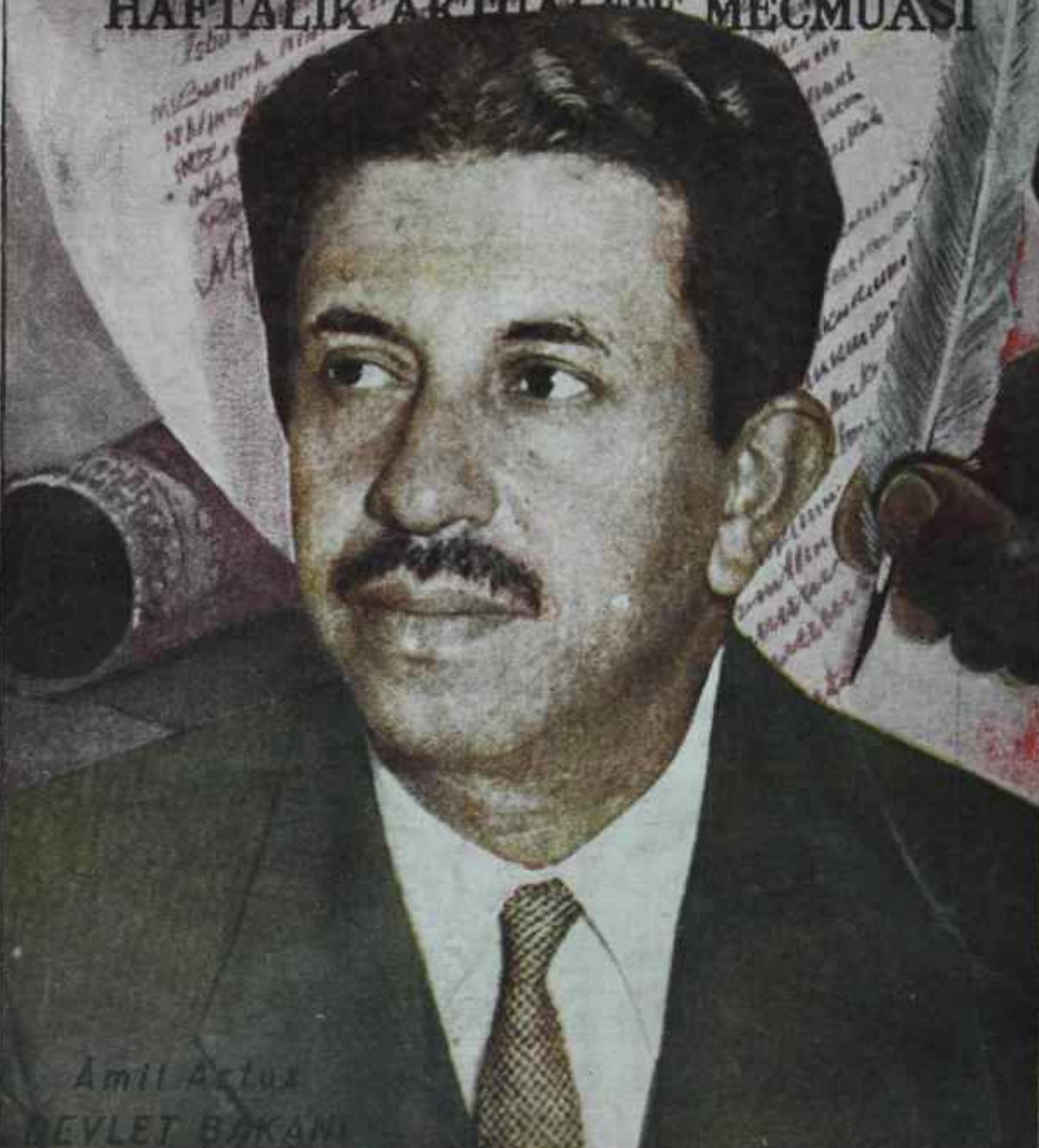
Amel Aktas DEVLET BAKANİ