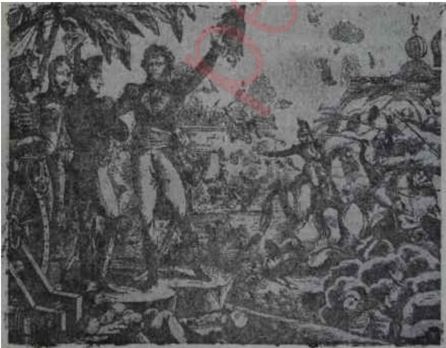
Napolyon Kahire önünde

Napolyon "Vive l'Empereur!" nidaları ile kendisini karşılayan askerlerin karşısında vakur fakat, heyecanlıydı. Askerin askere silâh çektiği nerede görülmüştü. Kaldı ki o büyük bir askerkendi.