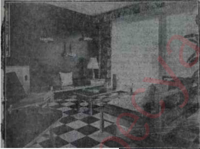
Bir oturma odası

Kadının elini oyalayıp, vaktini alan bir sürü küçük işler vardır ki.