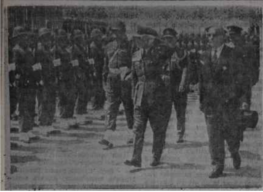
Kral Hüseyin Ankara'da Krallar önde gider, ya polisler ?.

11.30 da Çankaya - Ulus seferini yapan Belediye otobüsünün şoförü Amerikan Sefaretinin önünde frene bastı. Otobüs gıcırdayarak durdu, yolcular merakla pencereden kafalarını çıkararak baktılar. Beyaz kol* luklu trafik polisi yolun kapalı olduğunu belirtiyordu. Ne vardı Sabahleyin açık olan yol neden kapanmıştı? Kim geliyordu? Bu sualler yolcuların zihninde birkaç dakika dolaştı. Sonra o gün Ürdünün genç kralı Hüseyinin Ankara'ya geleceği akıllarına geldi.