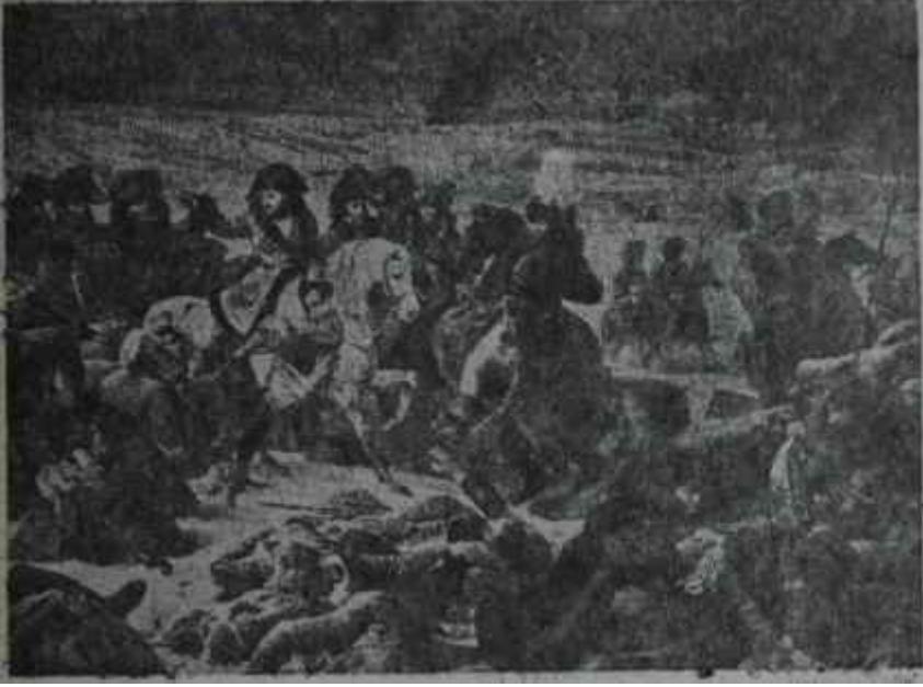
Napolyonun Eylav zaferinden bir sahne.