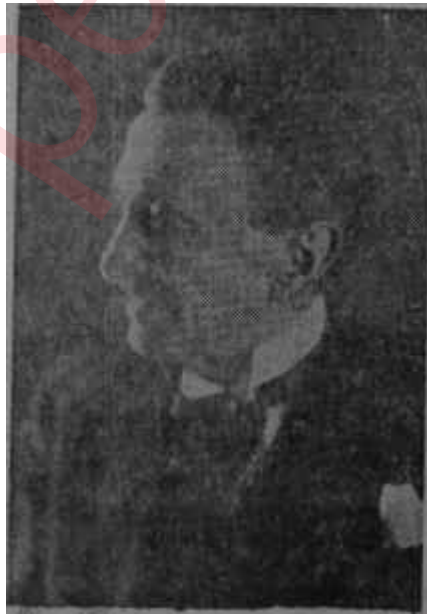
Branislav Nusiç Renkli tipler, iyi çizgiler

Peki ama Devlet Tiyatrosuna ve Edebi Heyetine, bu durumda söylecek hiçbir söz, yapılacak en küçük bir sitem de yok mu? Yukardaki ağır ve gerçeğe uymıyan suçlamalar bir yana bırakılır da mesele daha serin kanlı bir şekilde incelenirse, üzerinde durulacak noktalar elbette vardır. Meselâ Edebi Heyetin, yeni imzalara gösterilen müsamahayı, ikinci ve daha sonraki eserlerini veren tanınmış yazarlara göstermekte