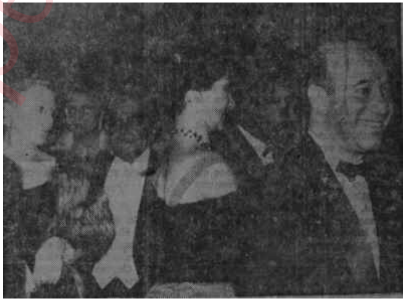
İstanbul Operasının açılışından bir intiba

1941 de Ankarada Türk diliyle verilen ve umumi bir heyecan yaratan ilk opera temsili, meşhur Verismo çığırının en mühim temsilcisi sayılan Giacomo Puccini'nin "Madam Butterfly" operası olmuştur. Devlet Konservatuvarı Tatbikat Sahnesinin, bu temsili verdikten bir sene sonra, 1942 de sahneye koyduğu ikinci opera, gene meşhur İtalyan bestekârının "Tosca" operasıydı. Ama bu sefer eserin tamamı değil, ancak 2. perdesi oynanabilmiş, bu kadarı bile Semiha Berksoyun ve rahmetli Nurullah Şevket Taşkıranın başrollerde gösterdikleri büyük muvaffakiyet sayesinde, ümitleri aşan bir güzel netice olarak hayranlık uyandırmıya yetmişti. O