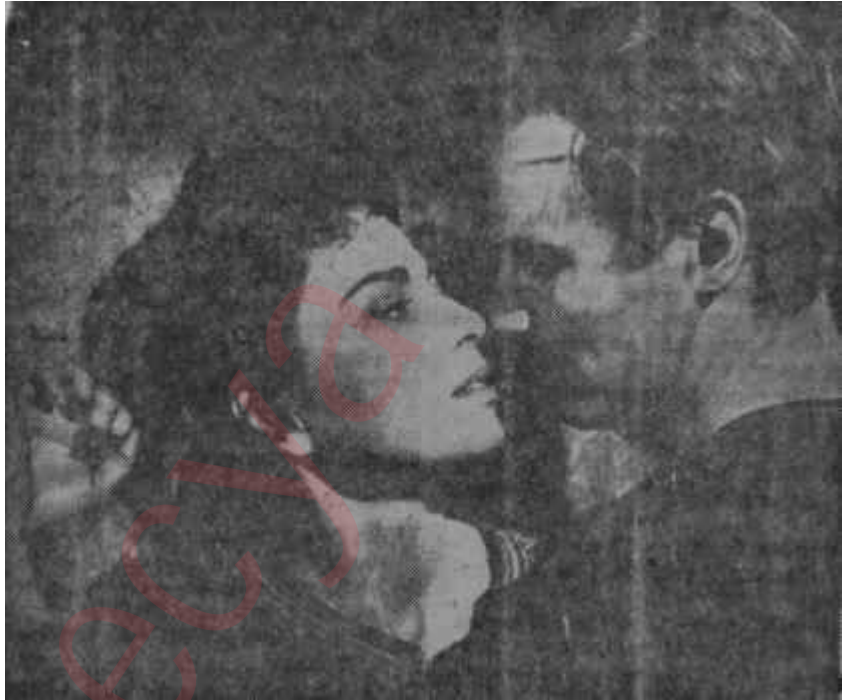
"Ben - Hur" dan bir sahne Isıtılan pilâv

lı romanından çevrilen "Ben Hur", daha önce sinema ve tiyatrodaki ilgi toplamıştı. 1900'de Klaw ve Erlanger'in hazırladığı piyes, daha sonra 1907'de çevrilen tek bobinlik film, ardından 1926'da Fred Niblo'nun rejisörlüğünü yaptığı ikinci film tipik bir İncil hikâyesinin anlatıldığı "Ben Hur" u daha da popüler kılmıştı. Bu defa Karl Tunberg'in yazdığı senaryoda Christopher Fry'ın yaptığı bazı değişikliklerle filme alınan "Ben Hur", bu güne kadar çevrilen en pahalı filmlerden birisidir. Başrollerini Roman Novarro ile Francis X. Bushman'ın oynadığı 1926 versiyonunun 4 milyon dolara çıkmasına mukabil, Charlton Heston, Jack Hawkins, Stephen Boyd ve Haya Harareet'in başrolleri-