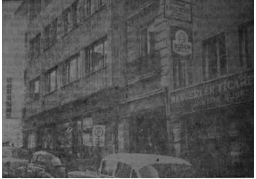
Odalar Birliği merkezi Artık V.C. ocağı olabilir

İren, iktisadî alanda mutedil bir liberal olarak vasıflandırılabilir. Kendisi, hele gelişmemiş bir memlekette devletçiliğin yeri olmadığını iddia