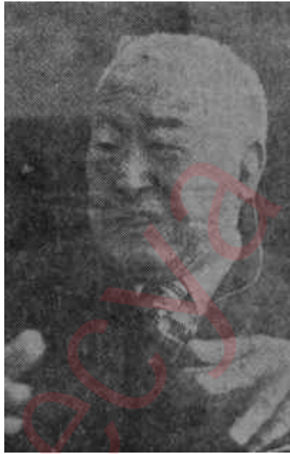
Syngman Rhee Oturdum, kalkmam!

İş Devlet vasıtalarının İktidar Partisi emrinde kullanılmasıyla da bitmemiştir. En küçük köylere varıncaya kadar her tarafa serseriler Liberal Parti tarafından hususi surette toplanmışlar ve bunlar özel bir eğitime tâbi tutulmuşlardır. Bu eğitim devresi tamamlandıktan sonra serseriler vazifelendirildikleri mahallere giderek orada muhalefet mensuplarını, muhalif ve tarafsız gazetecileri, muhalefet propagandacılarını dövmüşler, muhalefete sevgi duyan vatandaşları korkutmuşlar, icabında onların ekinlerini yakmışlar ve Muhalefetin kapalı duvarlar ardında yaptığı toplantılara hile hücum ederek Muhalefeti susturmağa uğraşmışlardır. Bu serseri ekiblerinin faaliyeti neticesinde Muhalefetin propaganda yapması son derece