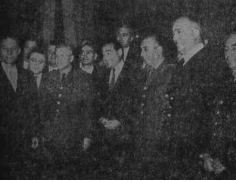
Başbakan yüksek rütbeli subaylarla Gösteri fotoğrafı