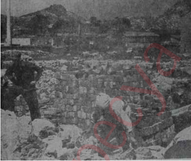
Güney Koreden bir görünüş Kalan pişman, kalmayan pişman

F akat, Kore İktidar Partisinin seçimi kaybetme endişesini ne devlet vasıtaları, ne adam döven sarhoş serseri ekipleri, ne uşak valiler, ne polis copları, ne de devlet hizmetini rey bağlama usulleri giderebilmiştir. Bunun üzerine İktidar Partisinin büyük kafaları bir araya gelerek son derece kurnazca bir rey verme usulü keşfetmişlerdir. Bulunan hüner şudur: İktidar Partisi, seçim gününden çok önce, seçim günü kullanılacak oy pusulalarından 60 milyon adet bastırmıştır. İktidar Partisinin adamları her yerde dokuzar kişilik ekipler kurarak partizanlarına ve korkuttukları halka İktidara nasıl rey verileceğini öğretmişlerdir. İktidar Partisi sözcülerine bakılırsa bundan maksat okuma bilmeyen halka işaretlerini nereye koyacaklarını öğretmekten ibarettir! Fakat, hüner burada bitmemiştir. Oy verme günü bu dokuzar kişilik ekipler üçe ayrılacaklar ve her üç takım kendisine bir de başkan tâyin edildiğine mutali olacaktı. Bu üç kişi rey hücrelerine beraber girecekler ve birbirlerinin hangi partiye rey verdiklerini de kontrol edeceklerdi. Bu suretle, başkan cenapları bir gözüyle bir seçmeni, öbür gözüyle de öbür seçmeni kontrol etmek imkânını bulacaktı. Doğrusu istenirse bu sistem, rey zarflarını resmî dairelerden çalıp üzerine yine zorla elde edilmiş, çalınmış veya sahtesi yaptırılmış resmi mührü bastıktan sonra, seçmene bu mühürlü zarfı verip onunla İktidar Parti-