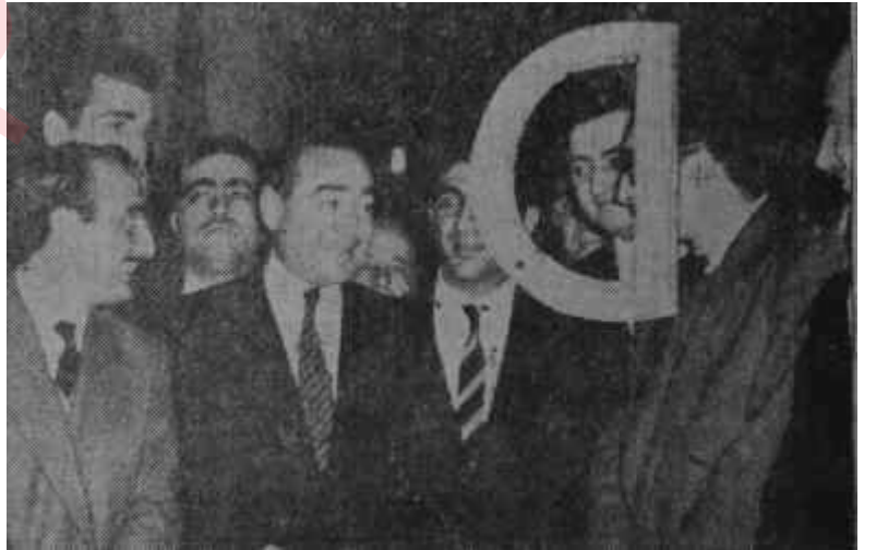
Menderes ve AKİS başbaşa