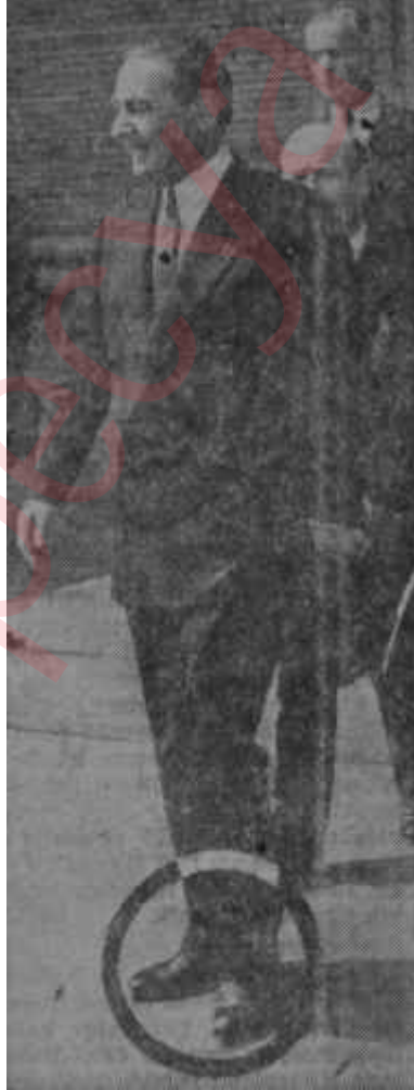
Adnan Menderes Ayağına bastılar