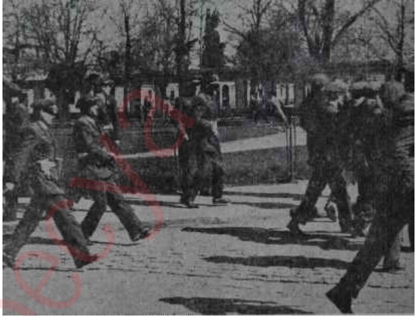
Sultanahmet meydanında kol gezen polisler

Ancak iyi haber aldığını sanan bazı vesveseli zevat polise bir takım tedbirler aldırılmışlardı. Onların istihbaratına göre İnönü Parti merkezinden çıktıktan sonra Beyazıt civa-