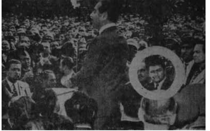
Menderes ve AKİS Hırdavatçılar çarşısında

B u hafta, elbette ki cereyan eden hadiseler sayesinde sizlere keyifli keyifli okuyacağınız bir sayı takdim ediyoruz. İktidarın lideri ile Muhalefetin liderinin İstanbulda -görüşmeden- buluşmaları siyasi havayı bir anda kızıştırdı. YURTTA OLUP BİTENLER kısmımızın "C.H.P." ve "D.P." başlıklı sayfalarında iki liderin nasıl vakit geçirdiklerini en ince teferruatına kadar öğreneceksiniz.