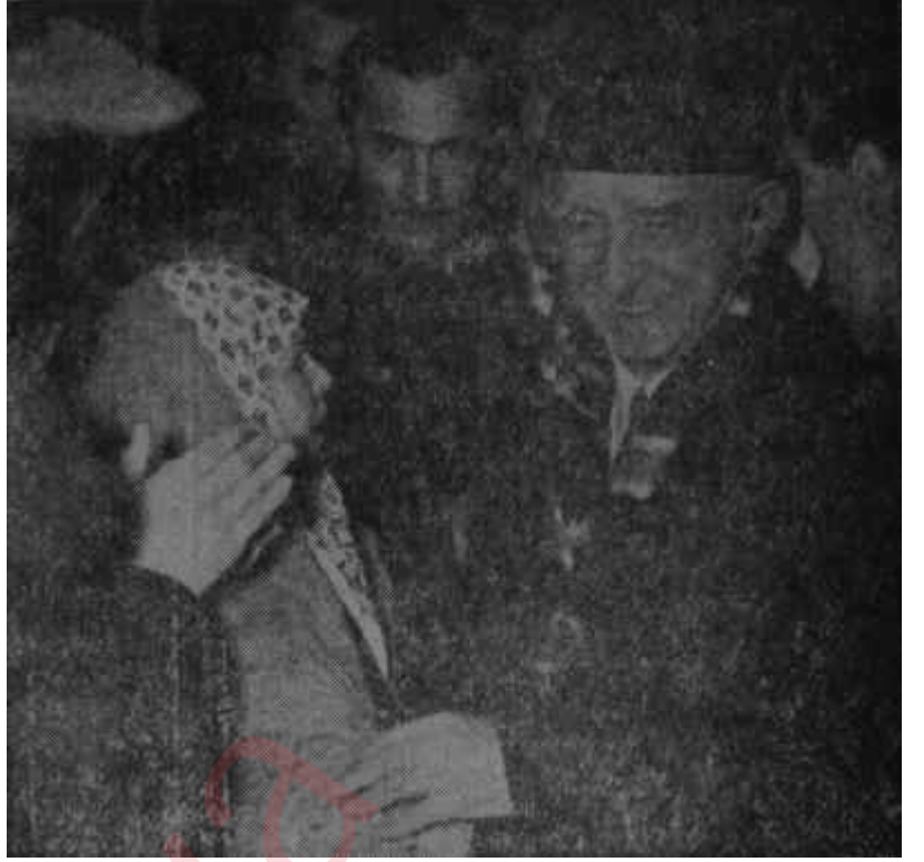
İsmet İnönü gecekonduların sakinleriyle Kulağına kar suyu kaçırdı

Ancak D.P. deki yangın, aynı gün İnönüyü evinde ziyaret edenleri -Rektör, profesörler, C.H.P. iktidarının son Genel Kurmay Başkanı, emekli generaller, işçi temsilcileri, gençliğin kalbine yerleşmiş şahsiyetler.- büsbütün arttı. Bir gün sonra D.P. hatipleri "Bunlar ne diye İnönüyü ziyaret ediyorlar?" diye kongrelerde feryat ediyorlardı. -Sanki onlar da "iki hesap memuru'ndan kor-