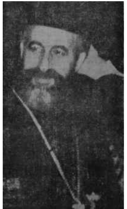
Makarios İsteyenin bir yüzü...

medik bir sebepten dolayı olmuştur. Başpiskopos Makarios, İngiliz üslerinin kurulacağı bölgenin İngiliz hâkimiyeti altında olmasını kabul etmemekte -bölgenin sivil idaresine geniş ölçüde iştirak ettirilmesine rağmen- bu bölgenin Kıbrıs hâkimiyeti altında olmasını ve Kıbrıs Hükümetinin bir anlaşmayla İngiltereye üs kurma izni vermesini istemektedir! Halbuki bu, Londra Anlaşmalarına açıktan açığa aykırıdır. Londra Anlaşmalarında, hayli sarîh bir surette sınırlandırılan bir üs bölgesinin İngiliz hâkimiyeti altında olacağı belirtiliyordu. İngiltere, şimdi Londra Anlaşmalarında tesbit edilen hududu