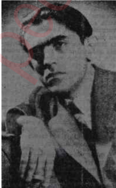
Ümit Yaşar Oğuzcan Verimli şair

Ümit Yaşar Oğuzcan "Karanlığın Gözleri"nde sadece iyi bir şair olduğunu bilmekle de kalmamış. İyiden de öteye iddialı bir şair olarak ortaya çıkmış. İlk kitaplarında Ümit Yaşar serbest vezne geçmeden hece vezni denemişti. "İnsanoğlu" Ümit Yaşarın hece vezni ile de başarılı şiirler yazdığını isbat eden bir kitaptı, daha sonra şair serbest vezne geçti. Bu vezinle de yazdığı şiirler, hemen da ima hâdisinde yazıyor, yazar daima muvaffak şair olarak karşılanmıştır. Zaman zaman şiirde espriyi ön plâna almasına, şiir yerine espri yazmasına rağmen Oğuzcan iyi şair olarak kalmasını bilmiştir. Son kitaplarında ise Ümit Yaşar espriden de kurtulmuş, pür şiir yazmağa başlamıştır. "Kör Ayna", "Beni Unutma" bu tip