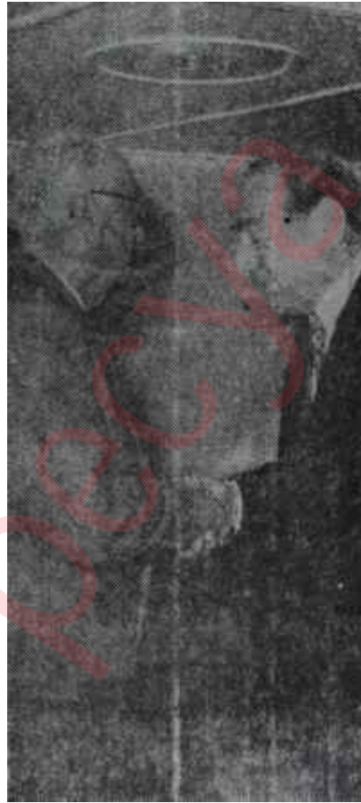
Bayar - Menderes Elele

Aynı haftanın içinde bir gün, Ankara'da İş Bankasının Yenişehir şubasının önü mahşere döndü. Halk kapının önüne toplanmış, ellerini patlatırcasına alkış tutuyor, "yaşa", "varol", "sen çok yaşa babamız" diye haykırıyordu. O gün İsmet İnönü, yanında eşi Mevhibe İnönü ve Dr.