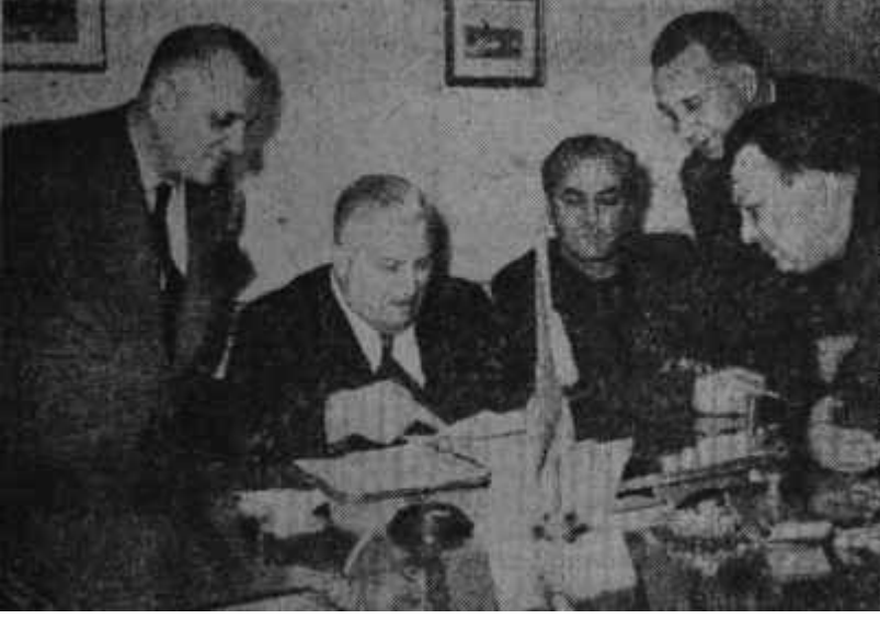
F. B. İdare Heyeti