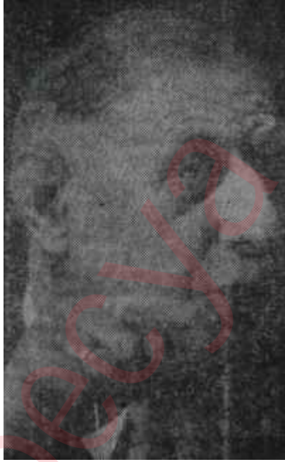
General de Gaulle Hakikaten kuvvetli...

taşıyorlardı. Fakat, yurtiçi savaş birliklerinde 12/7 lik mitralyözler mevcut değildi. Asiler bu mitralyözleri nereden bulmuşlardı? Yapılan kısa bir tahkikat, paraşütçü birlikleri içinde asilerle beraber olanların mevcudiyetini ortaya çıkardı. Sabah saat 6 da Başkomutan Orgeneral Challe, Cezayir şehrinin emniyetiyle görevli 10. Paraşütçü Tümenine bağlı alayların komutanları Albay Dufour, Albay Broizat, Albay Brechignac ve Albay Bonnegal'i bürosunda topladığı zaman, Albaylar ittifakla, silâh dolu kamyonun geçtiği yol kavşağını tutan yüzbaşı ile teğmenlerin kamyonun geçmesine