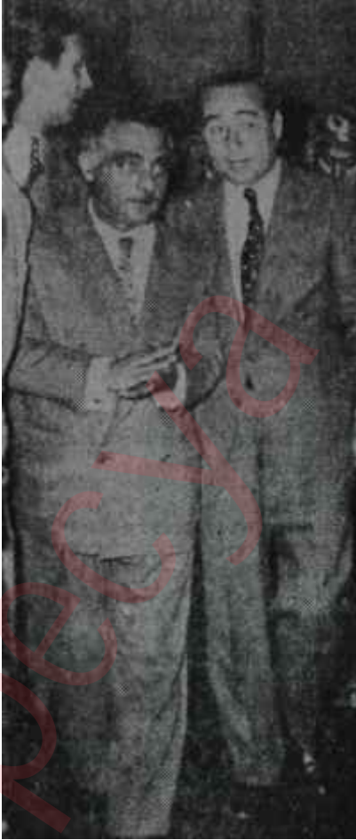
Menderes - Ağaoglu

B u haftanın başında, belki de bütün Türkiye'de en ziyade kararsız kimseler D. P. milletvekilleri idi. D. P. milletvekilleri hâdiselere bakıyorlar