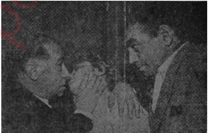
"Öbür Gelişte" nin provasından bir sahne Gişe kapalı oynanıyor.