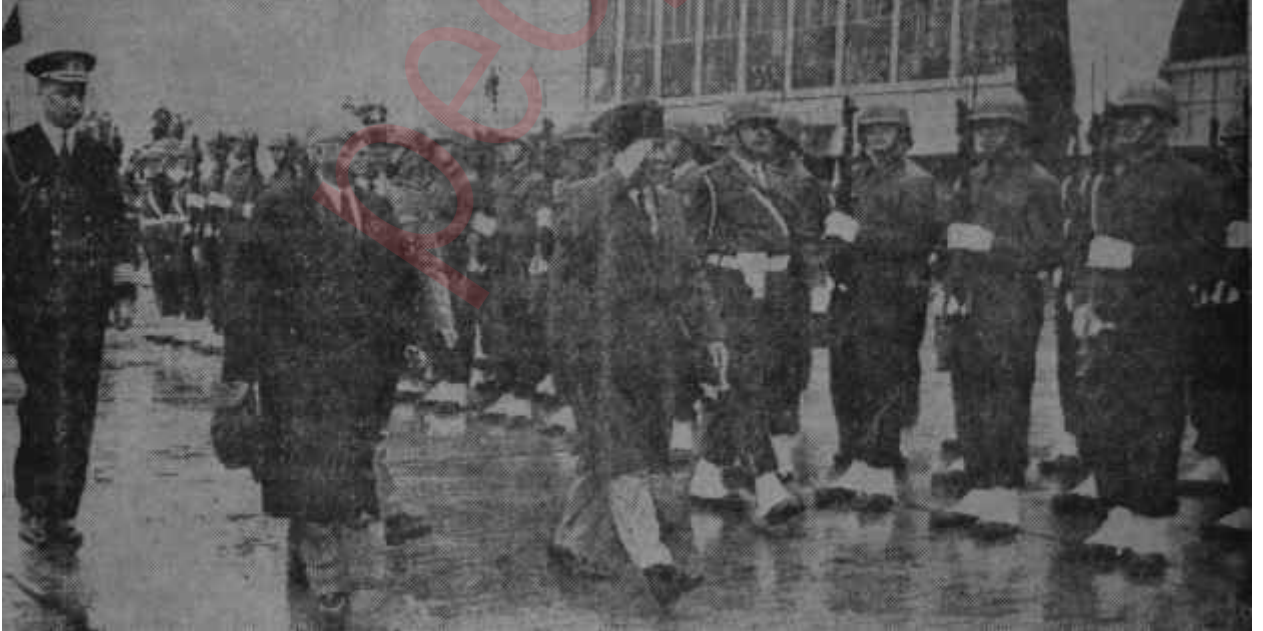
Sukarnonun Ankarayı ziyaretinden bir sahne

Siyah pardesüsü ve siyah noktalı kravatıyla Dr. Küçük uçaktan