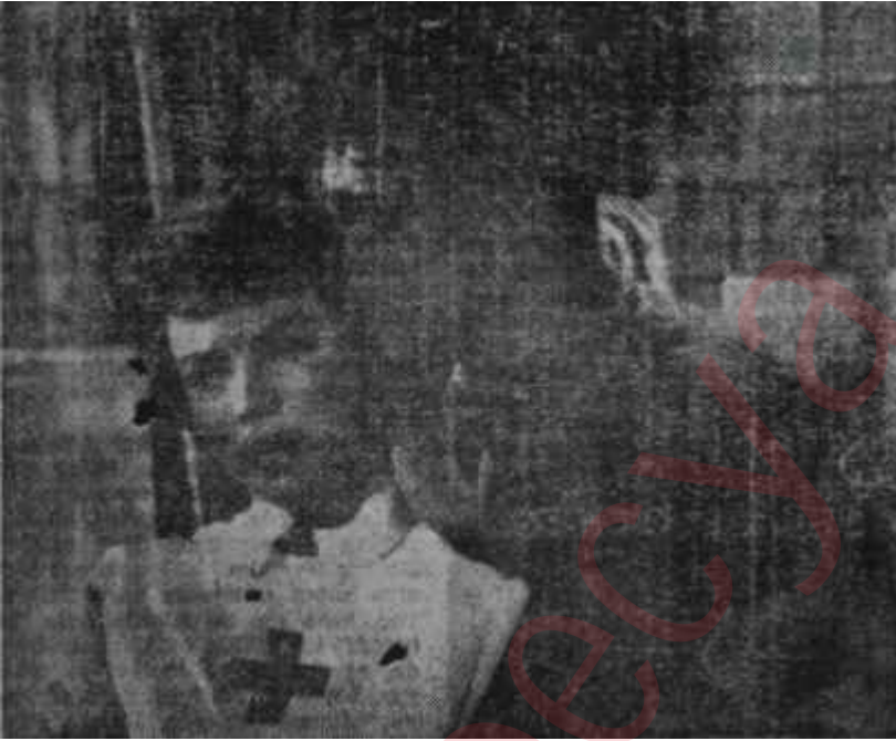
"Silâhlara Veda"dan bir sahne...