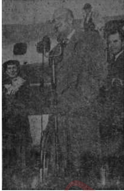
Eisenhower Sulh havarisi

Ike ile Zahir Şah bu vesileyle Afganistanın özel durumunu tetkik ettiler Afganistanın Sovyet Rusyayla büyük bir hududu vardı. Afgan Hükümeti, bu sebepten dolayı Moskova'ya iyi geçinmek zorundaydı. Gene bu sebeple, Kremli'den gelen yardım tekliflerini reddedemezdi. Gerçi, Afganistana yapılan Sovyet yardımları bir aralık Kabildeki Amerikalıların gözünü korkutmuştu. Fakat, sonradan anlaşılmişti ki Sovyetlerin Afganistana karşı askeri bir harekete girişmeğe niyetleri olmadıktan başka, yardımın idaresi için Afganistana gelen birkaç Sovyet teknisyeninin, İslâm dinine derinden derine bağlı Afganlılar arasında ciddi bir sızma hareketinde bulunmaları da hayli güçtür. Zahir Şah, Ike'a,