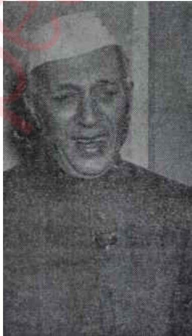
Nehru Bir "Saygıdeğer"

Amerikadan daha az yardım aldığına da hatırlattı. Eğer Amerika Sovyet Rusyayla rekabet etmek istiyorsa, Afganistan bu rekabette Moskovanın Washington'u geçtiği bir diyardı. Amerika bunun icaplarını hemen yerine getirmeliydi. Ike, bütün bu sözleri büyük anlayışla karşıladı.