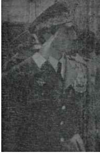
Rıza Şah Pehlevi Para, para!

Pazar sabahı saat tam 8 de Ike, Hindistan Protestan Katedralindeki ayinde dua ediyordu. Saat 10.10 da uçakla Agra'ya geldi. Evvelâ meşhur Taç Mahali ziyaret etti, sonra bir zirai eğitim merkezini ve bir örnek köyü gezdi. Öğleden sonra tekrar Yeni - Delhiye dönmüştü. Saat 16.30 da Ram Lilada kendi şerefine tertiplenen büyük halk toplantısına gitti. Yarım milyon insan muazzam meydana doldurmuştu. Ike burada da, her yerdeki gibi muhteşem sevgi gösterileriyle karşılandı. Pazartesi günü sabaha karşı saat 5,55 te Ike yanında Pandit Nehru olduğu, halde ikametine tahsis edilmiş olan Rashtrapatibhavan Sarayından ayrıldı. Dev Boeing 707. Palam meydana