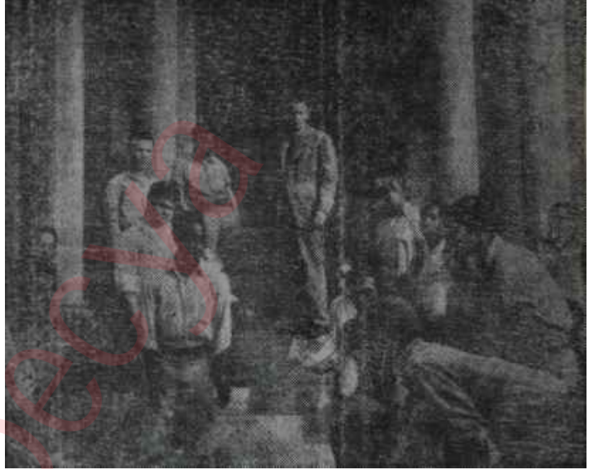
"Karatahta Ormanı"ndan bir sahne..

temem" der. Kadın onu bu fikrinden caydırmak için ne yaparsa yapsın filmin kahramanı ayak diredir, hattâ Londraya telsizle haber verip işin yeniden tetkik edilmesini bile teklif eder. Birisini öldürmek için yetiştirilmiş bir insanın bu kadar tereddüt etmesi ve bu rolün Paul Massie adında beyaz perdeye yeni geçmiş bir Kanadalı tarafından gayet hafif bir şekilde oynanması "Ölüm Emri"nin inandırıcı bir film olmasını önlüyor. Ayrıca kendisini "Brownig Version - Yaralı Gönüller", "The Net - Ağ" ve "Young Lovers - Firari Aşklar" adlı filmlerden tanıdığımız, memleketimizdeki hususi gösterilerde seyredilen "The Importance Of Being Earnest - İstekli Olmanın Ehemmiyeti" ve 1938 de çevrilen "Pygmalion" adlı filmlerden hatırladığımız rejisör