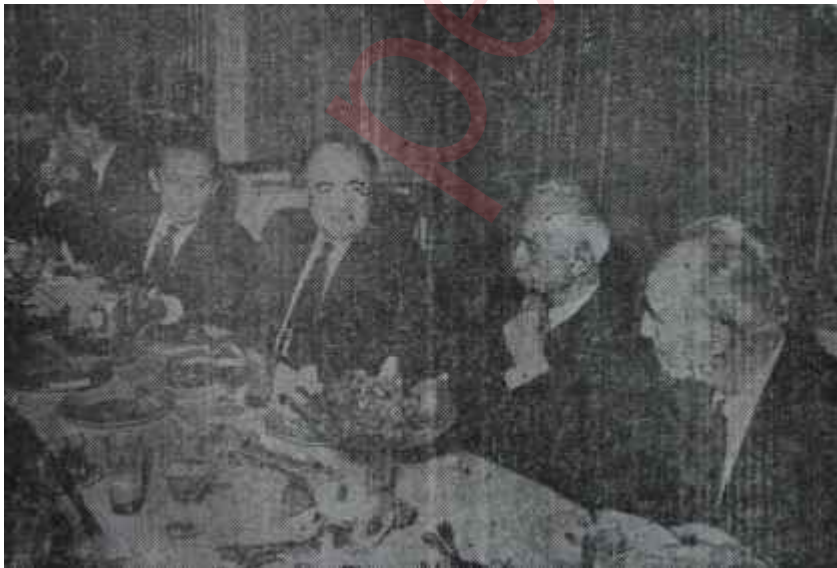
Bekata C. H. P. idarecileriyle birlikte

Şimdi Makariosu bekleyen önemli vazifeler vardı. Seçim kampanyası çok sert geçmiştir. Yer yer çarpışmalar ve cinayetler olmuştur. Makarios, ilk iş olarak Rum Cemaati arasında barışı kurmak zorundadır. Bunun için fakir halk tabakalarına daha fazla refah temin etmesi lazımdır. Makarios bu maksatla Amerika, İngiltere, Türkiye ve Yunanistandan yardım isteyeceğini açıklamıştır. Fakat, Makariosun şimdi halletmesi gereken en büyük istifham, 19 Şubat 1960 günü doğacak olan çocuğun bir ucube olmadığını dünyaya göstermektir.