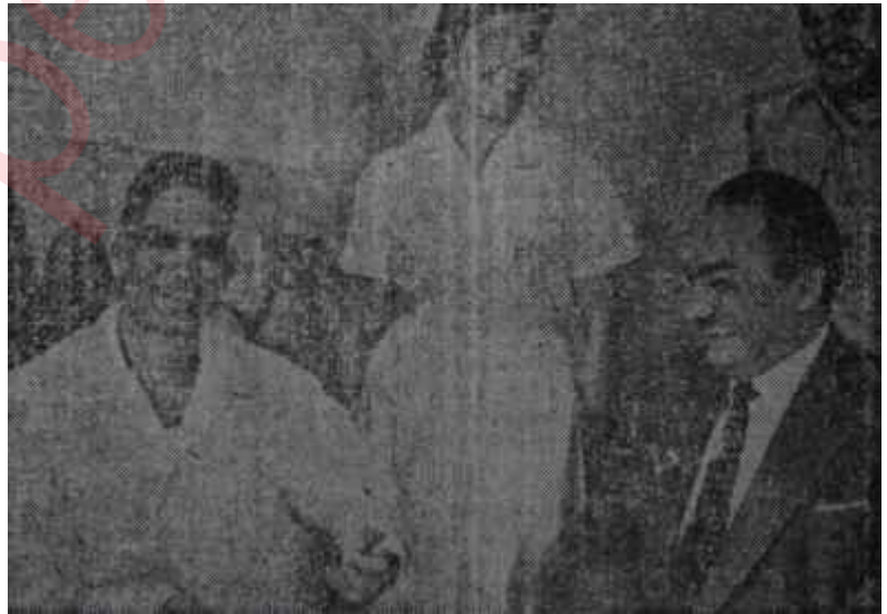
General Kasım hastahanedede

Bağdatta bu nümayişler yapılırken, Hür Dünya çevreleri, Irak Komünistlerinin yediği bu darbelerden memnuniyet izhar ediyorlardı. Fakat, bu memnuniyet çok sürmedi. Başbakan Abdülkerim Kasım tam bu sırada söylediği bir nutukla terazinin kefesini tekrar Komünistlerden yana kaydırıldı. Kasım, geçen 14 Temmuzda Kerkükte Komünist Kürt un-