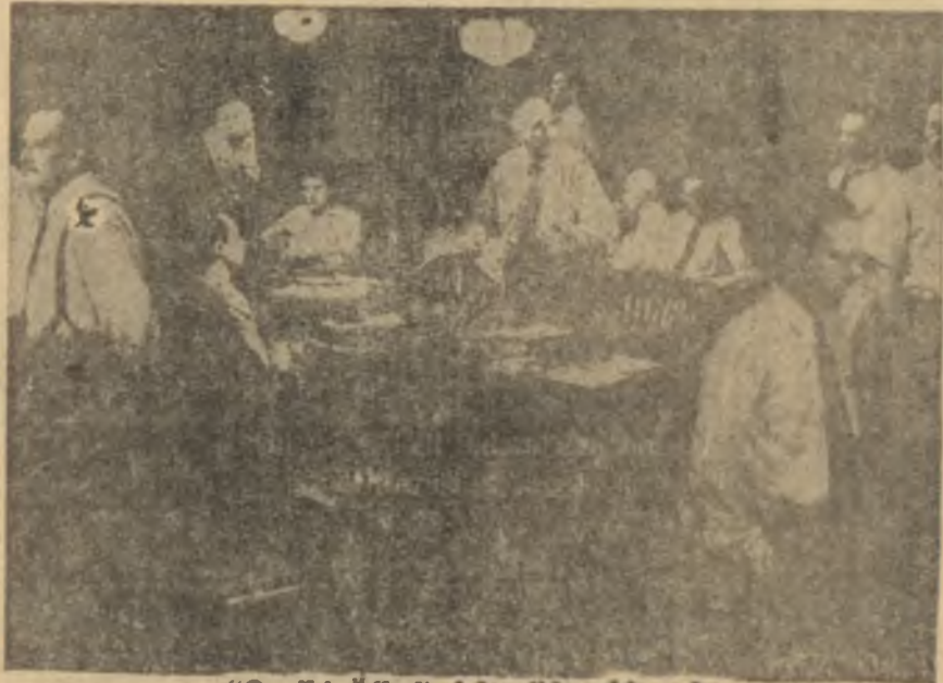
"On İki Öfkeli Adam"dan bir sahne

Bütün bu zorluklar ve rahatsızlıklar neticesinde meydana çıkan "Sâkin Amerikalı" için ne denebilirdi? Graham Greencin romanından perdeye aktarıldığı için yer yer uzun tartışmalarla ve seyirci üstünde tuhaf bir tesir yaratmak gayesiyle bir takım gürlütüleriyle doldurulan