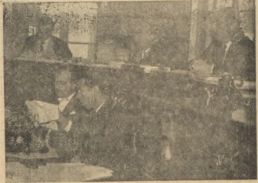
İzmir I. Ağır Ceza Mahkemesi