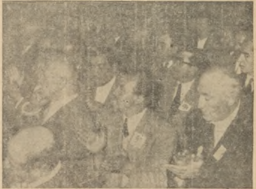
C. K. M. P. Kongresinde delegeler

10 gün önce geçirdiği bir otomobil kazasında yarılan başına - yaralının olduğu yere - tentürdiyot sürmüştü. Kınalı saçlarla dolazmakta olan Bölükbaşı omuzlarda kürsüye çıkarıldı. Tezahürat bir müddet de böyle devam etti. Sonra bölükbaşı, o kendisine pek yakıştırdığı "büyük hatip" sıfatına hiç uymayacak bir çabukluk içinde ve son derece kötü