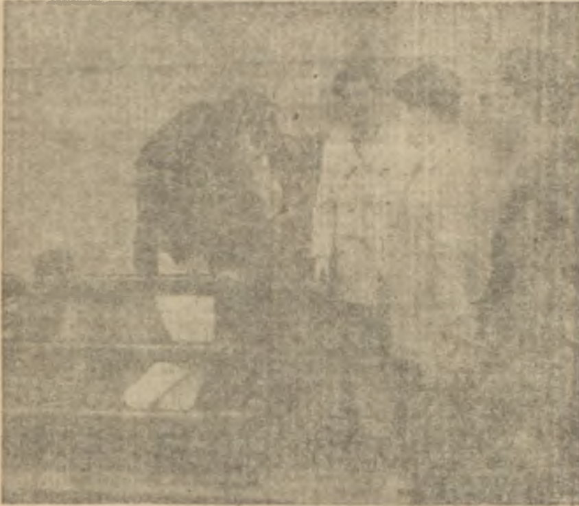
Narkotik büro Eroinmanları tevkif ediyor.