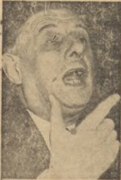
General de Gaulle

«Mevcut olan veya hazırlıkları devam eden atom silâhları dünya