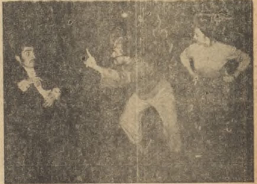
Sahne "Z" de Teklif