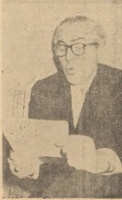
İzzet Kantemir Öfletti adam...

Öyleyse.. Böyle bir ilâna ne ilzüm vardı. Simdiye kadar büyük selâhiyetlerle işi yürüten Andicenin azil neden icap etmişti? Zihinlerde beliren