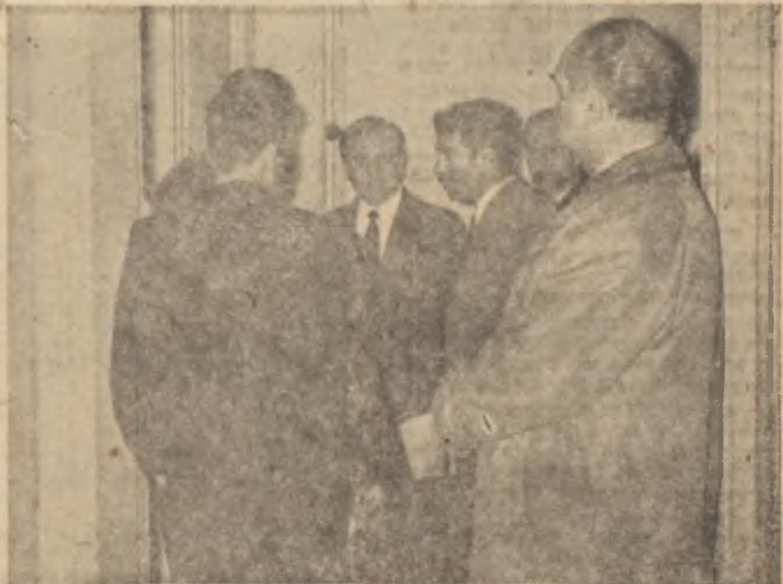
Belediye kapısında sıra bekleyenler

Bu mevzuda iktidarın taifi kâğıtçıları muteber Zafer ile Hüsnü Havadis gazetelerinde muhtemelen bir çok vaatleri ihtiva edilecek vaatler nesredilecektir. İstimlak eden mülklerinin bedellerini isteyen vatandaşlara pek çok vaatlerde bulunulacaktır. Ancak bütün bunlar şikâyetlerin önlenmesi için kâfi gelmeyecektir.