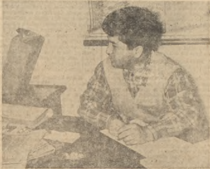
Aziz Nesin Velut Yazar..

Şimdi bütün bu umumî laflardan sonra gelelim Mahmut ile Nigar adlı kitaba, Mahmut ile Nigârda Aziz Ne-sinin 14 hikâyesi var. Ondördü de da-ha evvel muhtelif yerlerde yayınlan-mış, sonradan bir araya getirilmiş hi-kâyeler. Yani Aziz Nesinin tiryakisi