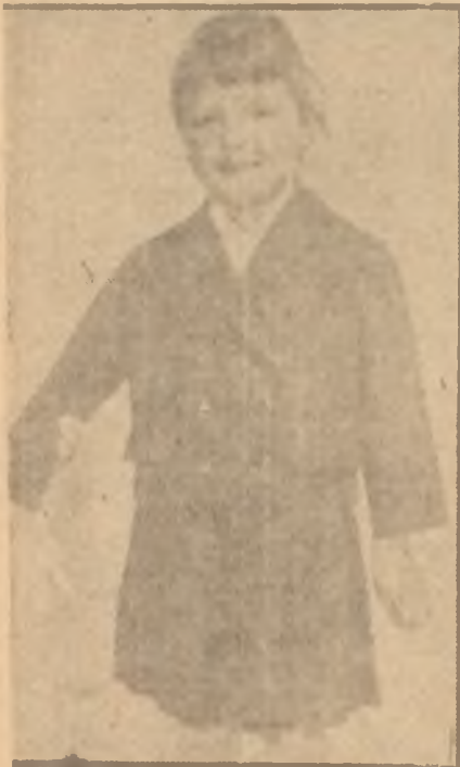
Okul çağında çocuk

A na ve babaların bilgisizlik yüzünden çocuklarına karşı hatalı davranışları, onların ileride kötü huylar edinmelerine, bir takım kompleksler içinde bulunmalarına sebep olmaktadır. Her hareketi ve her sözü hesaplamak, ana ve babanın küçük bir alışkanlığı olmalıdır. Çocuk yetiştirmek hususunda denenmiş kaidelerin dışına çıkmak, onları heves ve hırsla idare etmek "Çocuğum değil mi? istersem döverim, istersem severim." mülahazasıyla fikir yürütmek sadece bençilik olsa gerek. Çocuğum bu gündünden mesul olmayı idrak eden ana ba-