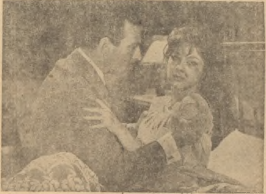
"Yalnızlar Rıhtımı"ndan bir sahne

Yalnızlık duygusunu hayatlarındaki boşluğu birbirlerine açıkça söylemelerinden anlarız. Filmde karakter derinliği diye bir unsur aramak hata olur. Karakterlerin geçmişini incelemek veya olaylar karşısında seçtikleri hareket tarzını araştırmak için ne rejisör, ne de senarist seyirciye