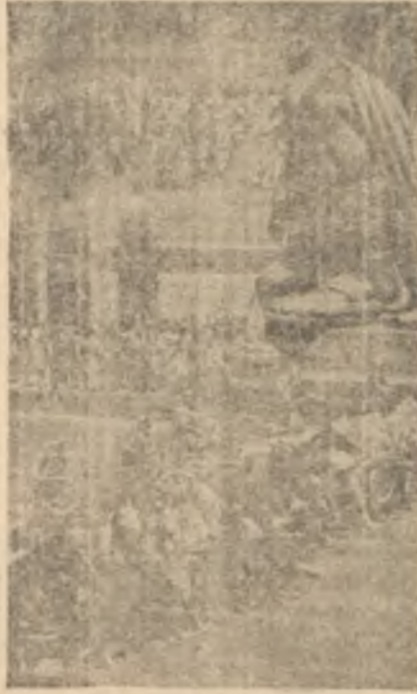
Kalabalık bir sahne

Günlük hayatta filmcilerin önüne çeşitli meseleler çıkar. Bu meselelerin bazıları halledilir, bazıları da film çevirenlerin başına türlü çoraplar örer. Filmciler bilirler ki bu meselelerle uğraşmak meseleğin başlıca şartlarından biridir. Bugün Hollywood'lu filmcilerin önüne günlük meselelerden bambaşka bir mesele daha çıkmış bulunuyor. Bazılarına göre bu mesele şimdiye kadar karşılaşılanların en korkuncudur. Hollywood bundan on veya onbeş sene sonra çevrile-