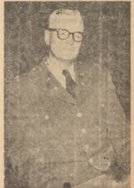
Albay Morris Perhis.. ve turçu

"Vazifeli arkadaşlar.. Türk dostlarımıza sempatik görünmeğe çalışınız ve hareketlerinizde dikkat ediniz.."