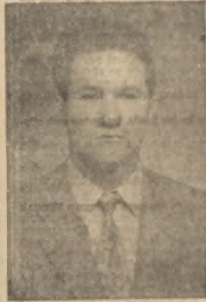
Kurtul Altuğ Kıran Şah olsun...

İkinci noktaya gelince, dāvayı ceza kanunu zaviyesinden mütalâa etmek lâzım gelirdi. Bir dış politika mevzuuna taalluk eden makalenin içinden sureti mahsusada seçilip çıkarılmış cümlelerle hakaret unsurunun mevcudiyeti veya ademî mevcudiyeti