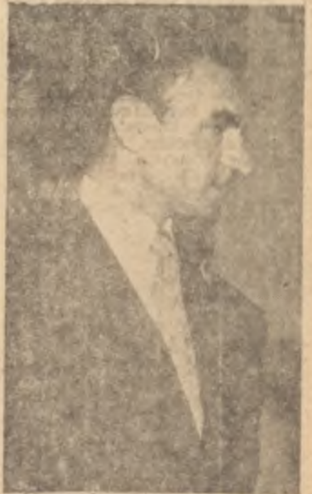
Şah Pehlevi Yazıya kızan

Bunun üzerine Dış İşleri bakanlığımız Büyük Elçiye Türkiye'de böyle bir usulün bulunmadığını kibarca bildirmiş arzu edildiği takdirde dâva açılabileceğini belirtmiş, bu suretle meşhur ŞAH - AKİS dâvası açılmıştır.