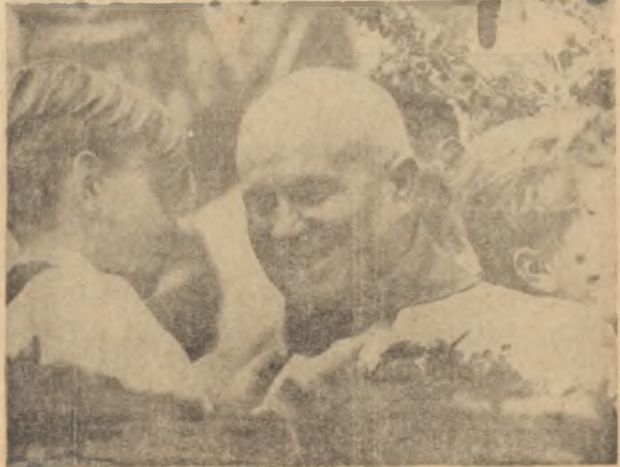
Krutçef Amerikan çocuklarıyla birlikte

Vientiane - Laos başkenti- hava alanına inen dev uçağın kapısı açıldı. Hostes, lüks mevkiden çıkan bir adamın merdivenlere yürülmesi için geri çekildi. itibarlı zat merdivenlerden indi. Vientiane, hava alanına sıralanmış bekleyen 100 Laoslu dilber Havailer misali ellerindeki çiçek demetleri ile uçaktan inen adamı karşıladılar. Merasimin ikinci kısmı, Laos Başbakanı Phoul Sananikone,