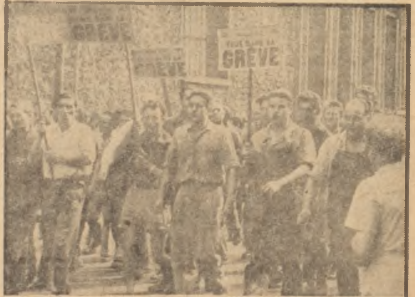
Grev yapan işçiler