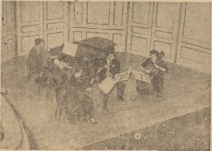
Misafir Oda Müziği topluluğu