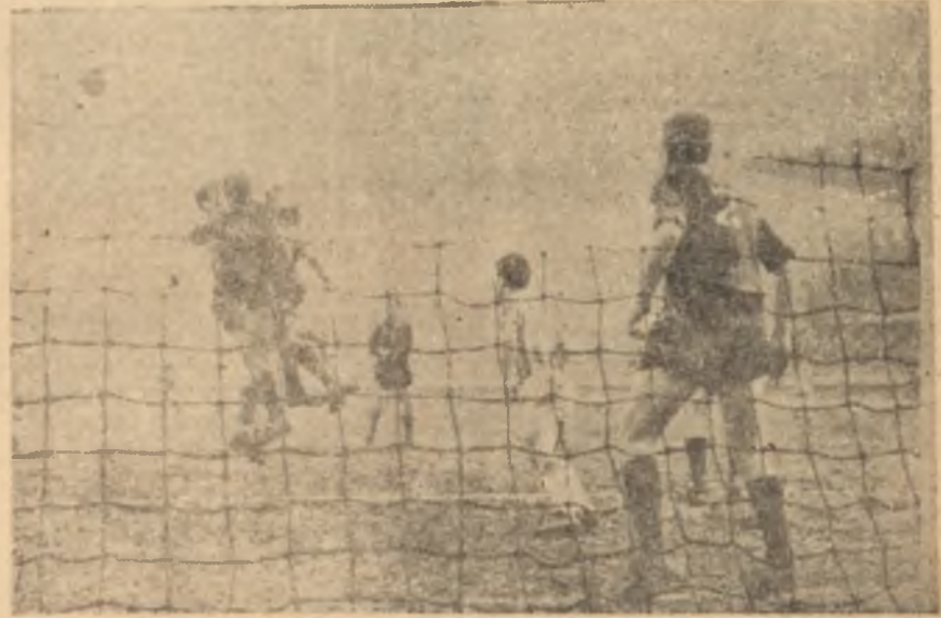
Fenerbahçe - Karagümrük maçı