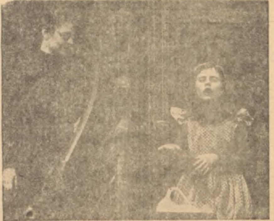
"The Miracle Worker"den bir sahne

Türkiye Millî Talebe Federasyonun tertiplemediği ve İstanbulda, Yeni Tiyatroda 13 kasımdan beri devam eden, 20 kasımda da sona erecek olan Dünya Talebe Tiyatroları Festivali