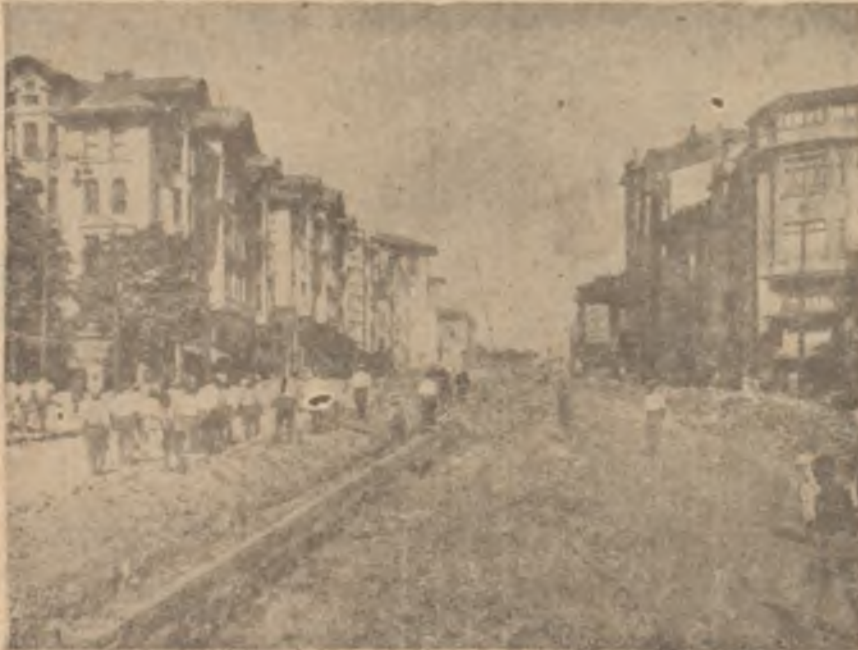
İstanbulda İmar faaliyeti

Belediye teşkilâtını herşeyden evvel bir tavsiyeye ihtiyacı vardı. Ama bu nereden başlayacak nerede bitecekti. Fen, İmar, Yollar, Tamirat, Sular ve İ. E. T. T. müdürlüklerinde