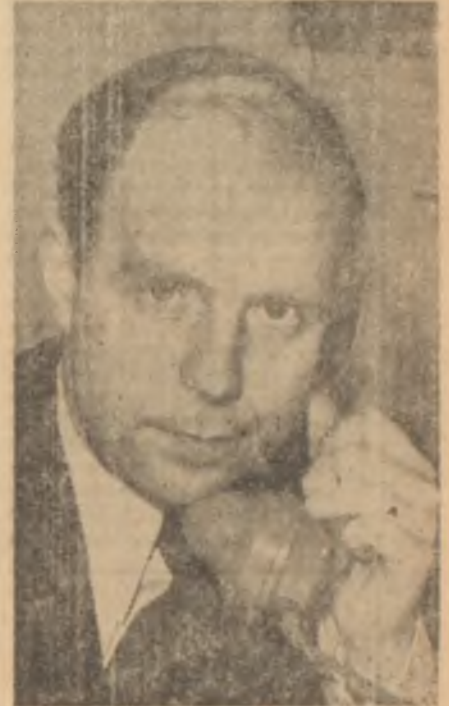
Iain Macleod Liberal Macleod

Kabinede başka yeni sima yoktur. Buna mukabil iki kişi kabineyi terketmektedir. Bunlardan biri Millî Eğitim Nazırı Geoffrey Lloyd, diğeri de Müstemlekeler Nazırı Lennox-Boyd'dur. Lennox-Boyd, Kıbrısta kan dökülmesi, Kenya ve Merkezî Afrika'daki keyfi davranışlarından dolayı Muhalefetin ağır hücumlarına uğruyordu. Kenyada 10 Mau Mau ha-