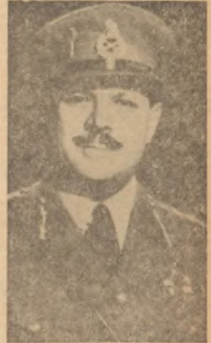
General Eyüp Han

Eisenhower'ın bu ziyareti yapıp yapmayacağı henüz meçhuldür. Eisenhower, önümüzdeki yaz başında Moskova dönüşü, Hindistanı ziyareti arzulanmış açıklamıştır. Pakistan, Eisenhower'ın Hindistanı ziyaret ederse, mutlaka Pakistana da gelmesi hususunda ısrar etmektedir. Bu arada Eisenhower'ın Tahrana da uğraması muhtemeldir. Şimdilik İranın Amerikadan olan şikâyetlerini paylaşan Pakistan Cumhurbaşkanı Eyüp Han, ortada endişe edilecek bir şey olmadığını anlatmak maksadıyla Tahrana gitmektedir.