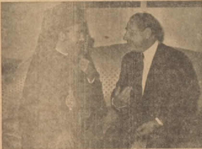
Başpiskopos Yakovas ile Başbakan Menderes

Başbakan, Cuma sabahı New York'a döndü. Öğle yemeğini, Rum Sinema kralı Skouras'ın davetlisi olarak yedi. Başpiskopos yakovas bermutad ziyafette hazır. Yemekte, İngilizce, Yunanca ve Türkçe olmak