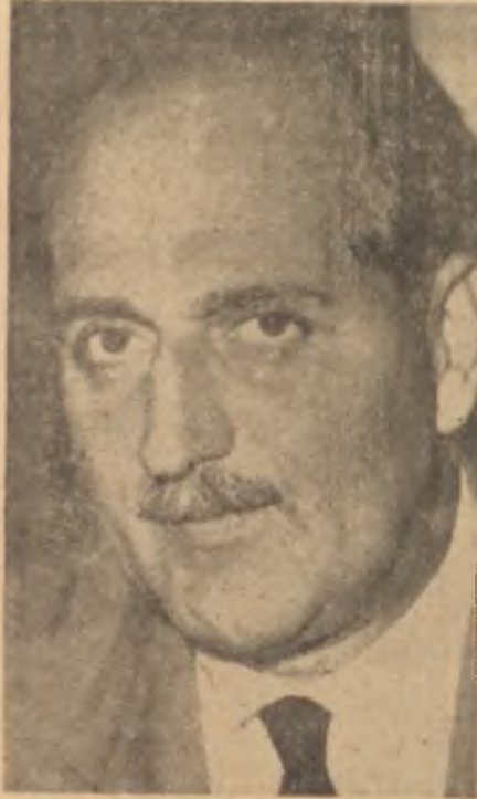
Fatin Rüştü Zorlu Organizasyondan kalkış not

çinde şehre hareket edildi. İki hafta evvel Pazar günü başlayan yolculuk bu suretle sona eriyordu.