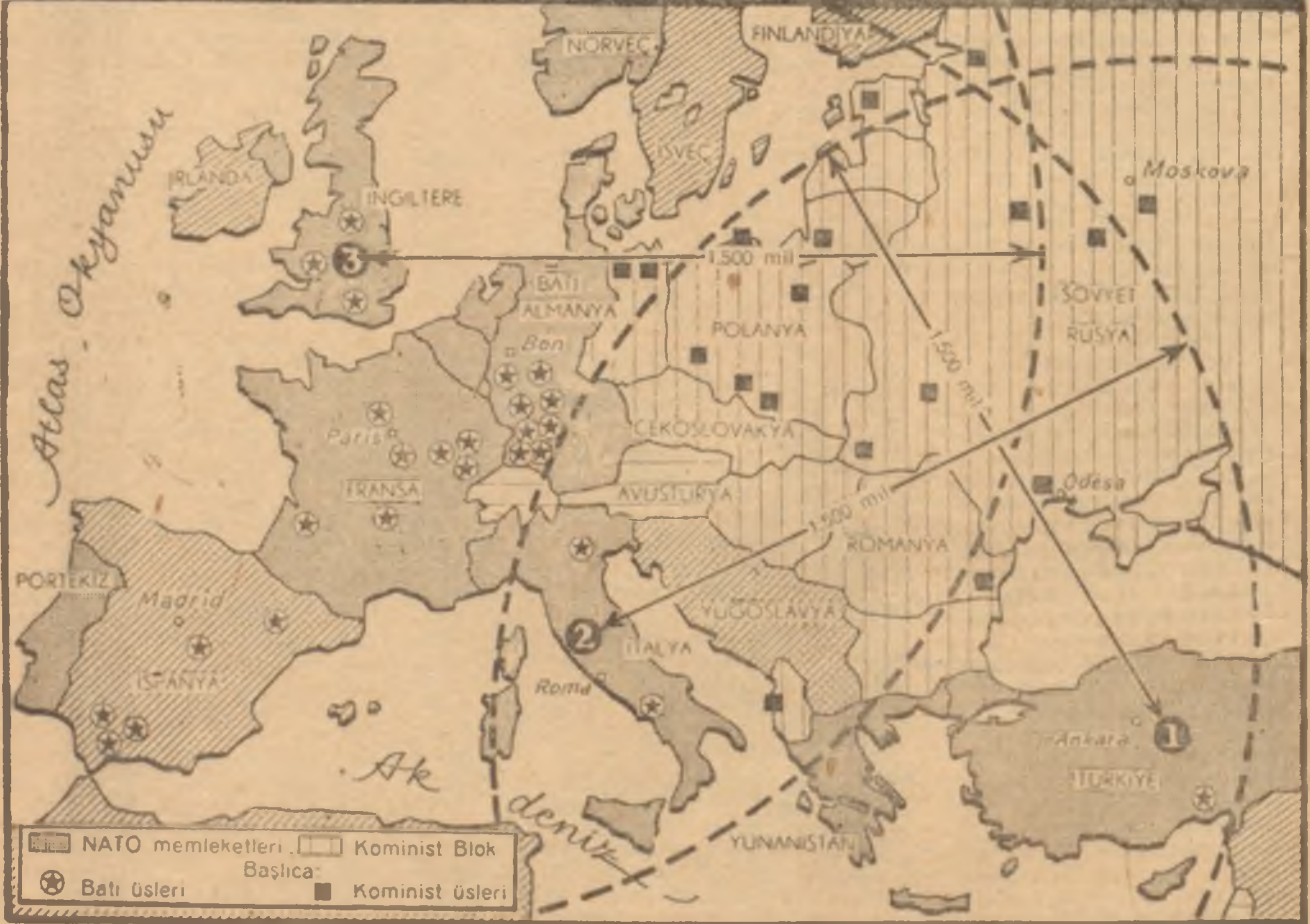
Türkiye, İtalya ve İngilteredeki üslerden atılacak füzelerin tesir sahaları