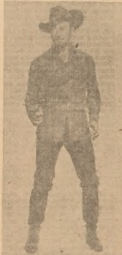
Errol Flynn Maceralar kralı

Sinemaya başlaması da yine bir tesadüf eseri idi. Moresby limanındaki bir meyhanede Herman Erben adlı bir kameracı ile tanıştı. Erben Yeni Kaledonyada bir dokümanter çevirecekti, Flynn de peşine takıldı. 1934 te prodüktörlüğe başlayan Erben, Avustralyada çevirdiği ilk filmi "In the Wake of the Bounty"nin başrolünü Flynn'e verince, hiçbir meslekte uzun zaman tutunamayan Flynn, belki de hayatta en çok lüzumlu gördüğü bol parayı sağladığından olacak 25 yıl bu meslekte kaldı. Londrada birkaç piyeste oynarken, Warner'in bir yıldız avcısı kendisini keşfedip Hollywood'a götürdü. İlk büyük başarısı Rafael Sabatini'nin macera romanından Michael Curtiz'in çevirdiği ve Olivia de Havilland ile Basil Rathbone'un da oynadıkları "Captain Blood -Kanlı Kaptan"dı. Bunu yine çoğunu Michael Curtiz'in rejisörlüğünde ve Olivia De