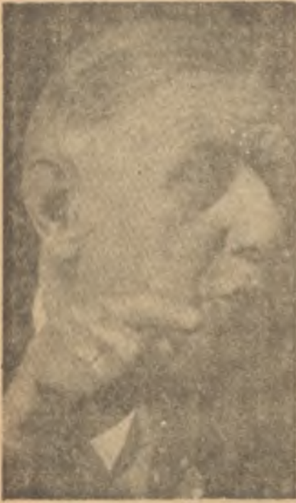
General de Gaulle