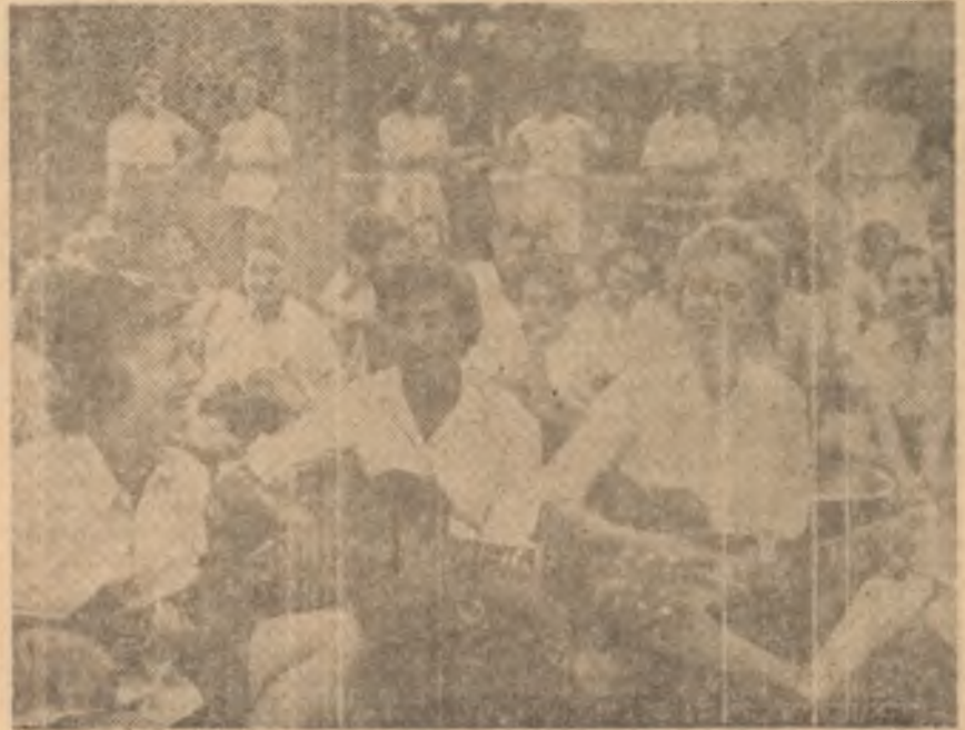
Genç kızlar eğleniyor