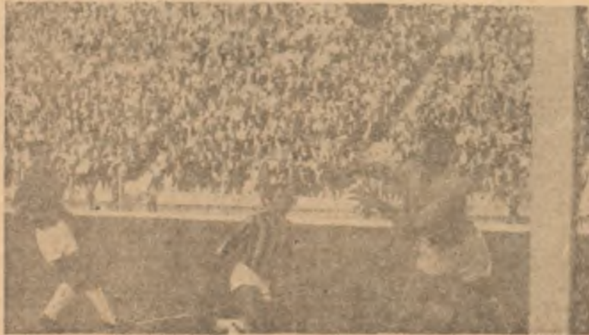
Fenerbahçeliler Hacettepe kalesi önünde