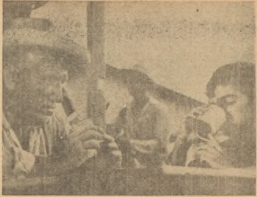
"İhtiyar adam ve Deniz" de Spencer Tracy

"İhtiyar adam ve deniz", Hemingway'in birçok eserlerinde yer alan kara ve deniz avlarından biri üzerine kurulu. Ama, ünlü bir avcı olan