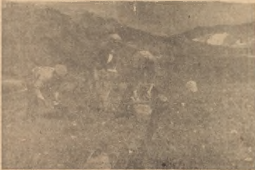
Tarlada çalışan çiftçiler

C. H. P. Kadıköy kongresinde konuşan, İsmail Rüştü Aksal, enflasyon şampiyonluğundan bir solukta istikrar şampiyonluğuna atıyan D. P. İktidarının, son bir yıllık iktisadi politikasının kısa bir bilançosunu yaptı. C. H. P. Genel Sekreterine göre, iktisadi ve mali durum nezaketini muhafaza etmekteydi. Fiyat yükselmeleri eski hızını kaybetmekle beraber henüz durdurulan amıydı. Birçok istihsal kollarında duraklama, hatta gerileme vardı. İhracatta bir gelişme yoktu. 1959 un ilk aylarında ihracatta mülahede edilen nisbi artış, 1958 in son beş ayında ihracatın tamamen durmasının neticesiydi. Bu sebeple normal olarak, 1959 de yapılması gereken ihracat 1959 da gerçekleştirilmişti. Ashnda ihracatta bir artış yoktu. Nitekim Ağustos 1958 den itibaren geçen bir yıllık devrenin ihracatı ele alınırsa ancak 300 milyon doları, yani 840 milyon lirayı buuyordu ki, bu ihracatta bir gelişme olmadığının açık deliliydi. İthalatta da başlangıçta İddia edilen gelişme vuku bulmamıştı. Maamafih ithalat mevzuunda asıl mühim nokta, gelecek yılların hangi döviz imkânlarıyla karşılanacağı hususunda bugünden haklı şüphelerin belirmesi idi. Önümüzde muazzam düş