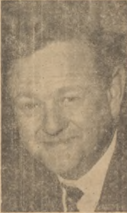
Lord Hailsham Çalışmanın mükâfatı

Şimdi Amerikan halk efkârı, memleketin demokrasi müdafiliği vasfına zarar verebilecek hâdiseler karşısında daha hassas davranmaktadır. Sovyetlerin teknik sahadaki zaferlerinden sonra, Amerikayı dünya nazarında tercihe şayan gösterebilecek başka şey olarak insan haysiyetine saygı esası kaldığına göre, Amerikalıların bu prensip üzerinde esikisine nisbetle gitgide daha fazla