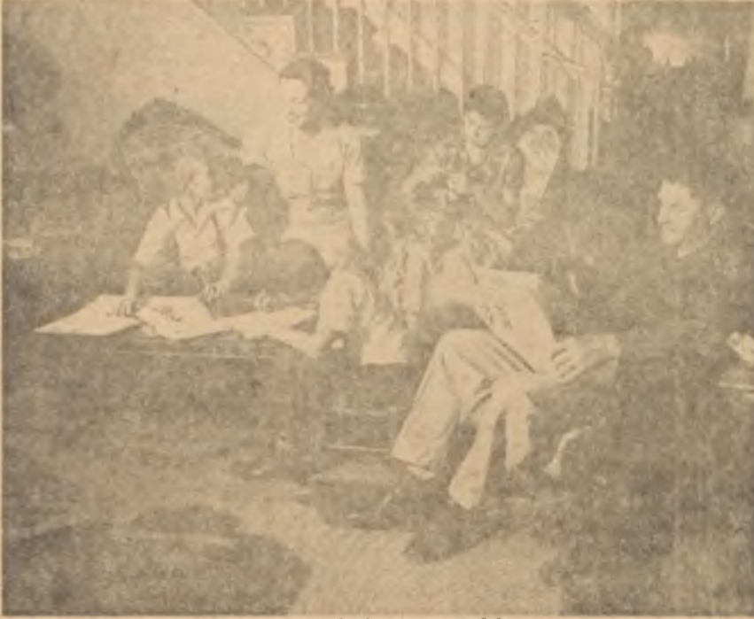
Ana, baba ve çocuklar "Kol kırılır, yen içinde"

İt şü ki kötü beslenen kimselerin saçları kuvvetini kaybeder ve dökülür. Fakat ilmin bugünkü seviyesinde bu hususta da fazla bir şey söylemeye imkân yoktur. Fûze çağında, tıbbın insanları ebedî bir hayata kavuşmak için ümitli tecrübeler yaptığı bir çağda, tırnaklar hakkında fazla bir şey bilinmemektedir!