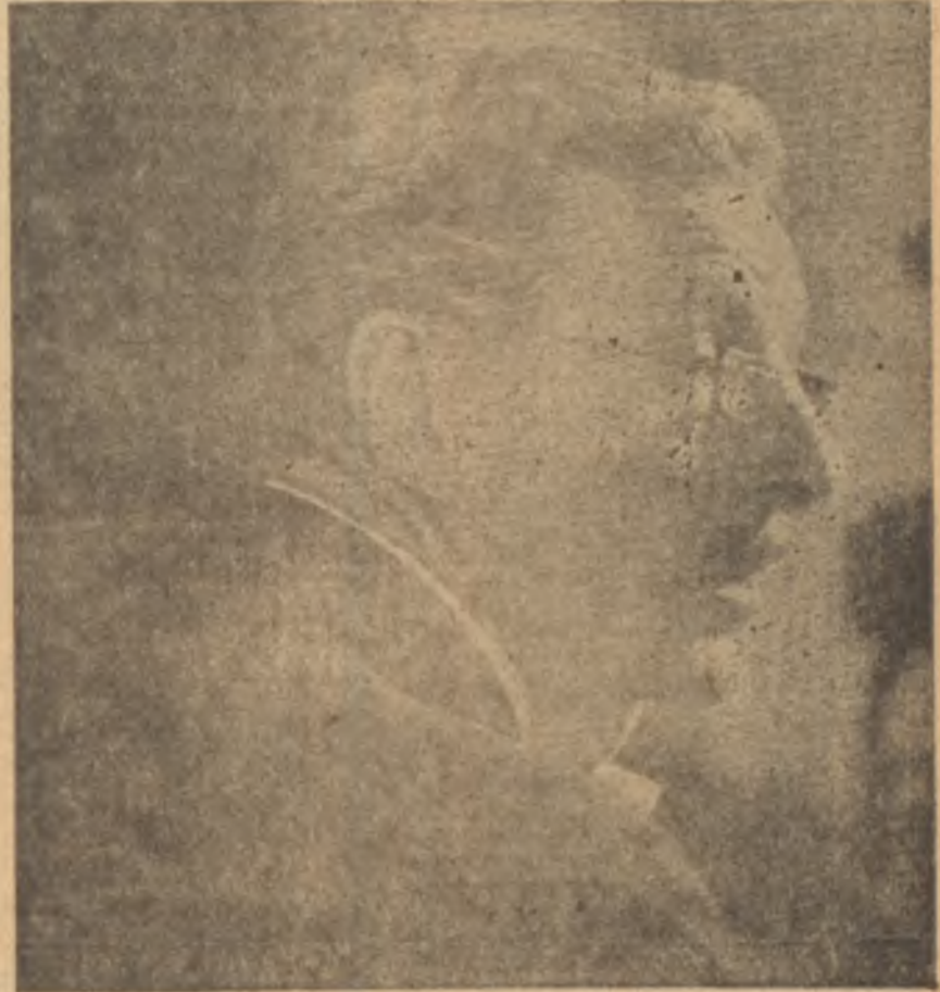
"Den ve Aray"da Danny haye Traji - komik rol

kerin'in isyankâr tutumunu başarıyla anlatıyor. Ronald Neame, Joyce Carey'nin tanınmış romanından adapte ettiği "The Horse's Mouth -Gerçeğin ağzı"nda, egzantrik, muhteris bir ressamın acı tatlı hâdiselerle dolu hikâyesini, bilhassa bu hikâyeye ve tipe inanan Alec Guinness'in her zamankinden bağarılı oyunuyla ortaya koyuyor. Mevsimin en verimli rejisörleri olan Don Chaffey ile J. Lee-Thompson'dan birincisi, adı bile İngiliz sansürlerini yerinden hoplatan "A Question of Adultery -Bir zina vak'ası"nda sun'î ilhak meselesini oldukça zevksiz bir şekilde ele aldıktan sonra "The Man Upstairs -Üst kattaki adam"da büyük bir apartmanın en üst katında tek başına yaşayan bir insanın apartmanın diğer kiracılarıyla olan münasebetlerini, insanların birbirine karşı beslediği kayıtsızlık, düşmanlık veya merhamet, dayanışma hislerini alaka verici bir şekilde inceliyor, "Danger Within -İçerideki tehlike"de de 1943 yılında kuzey İtalyadaki bir esir kampında bir kaçış planı etrafında dönen heyecanlı bir hikâyeyi anlatıyor. Lee-Thompson ise, her zaman olduğu gibi, birbirinden apayrı mevzulara el atarak "Ice Cold in Alex -İskenderiyede buz soğuğu"nda Almanların 1942'de Libyaya hücumları sırasındaki bir savaş ve