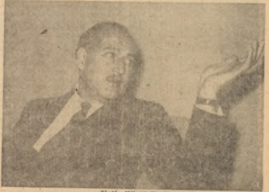
Fatih Rüstü Zorlu