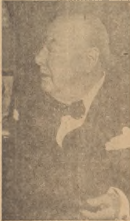
Churchill Savaş atı!

Seçimler 8 Ekimde, 630 koltuğun doldurulması için yapılacaktır. İngilterede dar seçim bölgesi sistemi