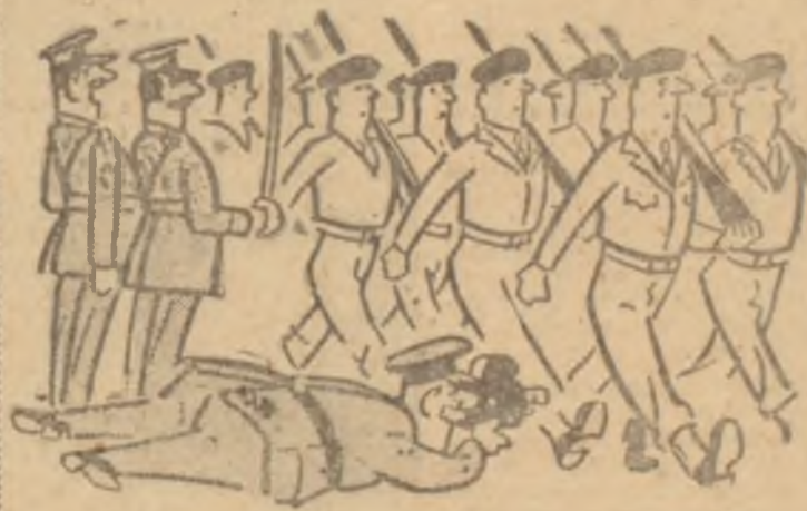
— Biliyorsun, General film çekme heveslisidir