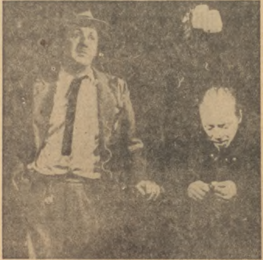
"Hughie"nin Stokholm'deki temsilinden

nun 25 Ağustosta başrollerini John Gielgud ve Margaret Leighton'un oynadıkları "Much Ado About Nothing" takibetti. Böylece Chambridge Tiyatro Festivali de kuruluşundanberi en parlak devrini yaşamış oldu. Şimdi Amerikan tiyatroyla alakalı çevreleri Bostonun Sanat Merkezi Tiyatrosunun memleket içinde bu neviden yani, elinden devletin tuttuğu ve ticarî endişelerden çok sanat endişesinin yer aldığı diğer tiyatroların açılmasına önayak olmasını temenni etmektedirler. Zira hususî teşebbüslerin Amerikan sahnelerinde sadece ticarî bir endişeyle hareket etmelerinin Amerikan tiyatrosunu ciddi olarak tehdit eden bir tehlike haline geldiğini hissettirmektedirler.