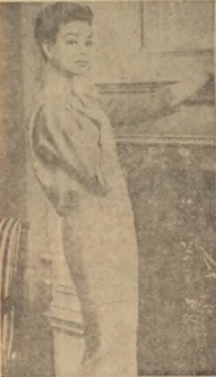
Genç kız kıyafeti Düğman: Gösterişli.

Fakat akli başında, bilgili anneler "şımartılmış bir küçük kızdan, bed- baht bir kadın doğar" diyen Fransız ata sözünü bir an akıldan çıkarma- lılardır ve ilk gençlik yıllarında itinalı hareket ederlerse onsekiz ya- şından sonra kızlarının zaten sağlam zevki ve şahsiyetli olacağına inan- malıdırlar.