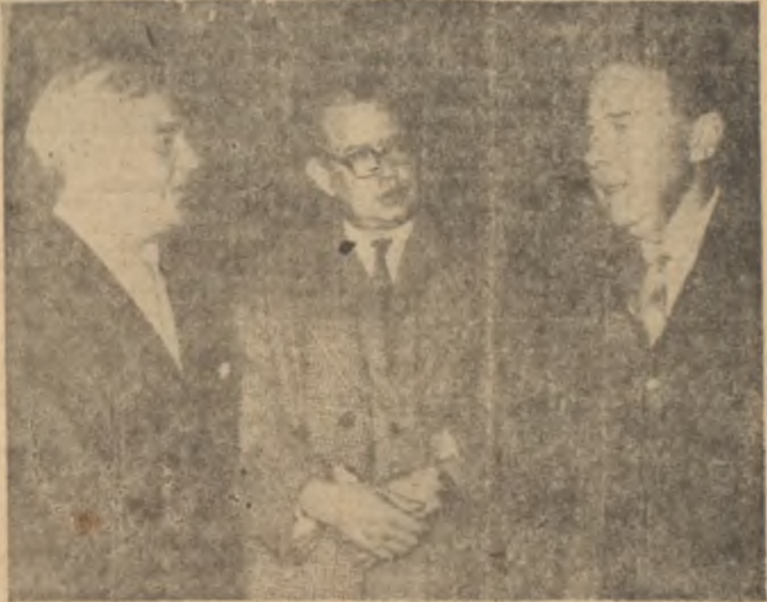
Bevan ve Gaitskell kampanyanın başında

İşçi Partisinin en güvendiği silâh, dış politikadan çok, İngilterede mevcut sosyal eşitsizliklerdi. Dünyayı hayran eden İngiliz demokrasisinin başında bulunan hükümetin üyelerinin hemen hepsi, asilzâdelere mahsus Eton Okulundan yetişmiş "Prens çocukları" idi. Sekiz yıllık Tori idaresinde sosyal adaletten eser kalmamış, zengin daha zenginleşmiş, fakir daha fakirleşmişti. Ancak iş-