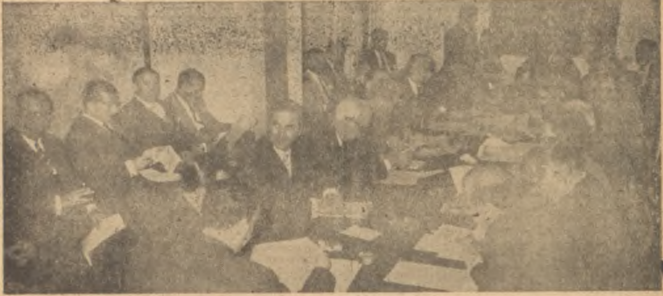
İnönü'nün başkanlığında toplanan C. H. P. Meclisi