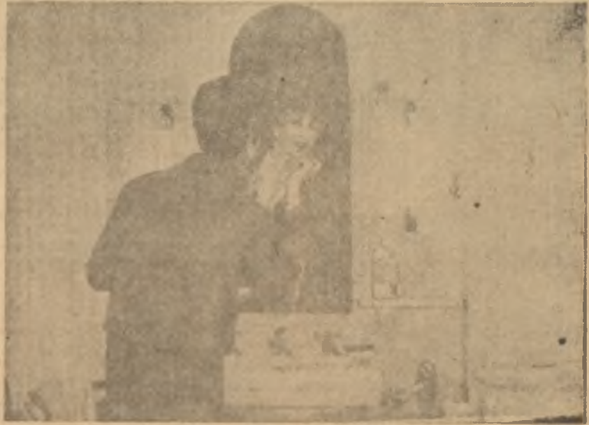
Banyo dairesindeki kadın Güzelliğin yolu buradan geçer

Sıcak su ve sabunla yıkandıktan sonra, kabılsa, bir de soğuk sudan geçmek vücut canlılığı bakımından mühimdir. Böylelikle kanın dolaşımına hız verilmesi ve ciltte bir renk parlaklığı, canlı bir görünüş temini mümkündür. Eğer soğuktan çekinliyorsa, ayakların sıcak su dolu bir kaptaki bulundurulması üşümenin önüne geçer. Bu iş biter bitmez ayakları sıcak su kabından çıkarıp soğuk suya tutmak, sonra sıkıca ve öğüştürerek kurulamak bir çift yün çorap çekmek yalnız ısıtmakla kalmaz, ayrıca soğuk almayı da önler. Ayak temizliği gerek nahoş kokuları yok etmek, gerek kanı harekete getirmek bakımından çok lüzumludur.