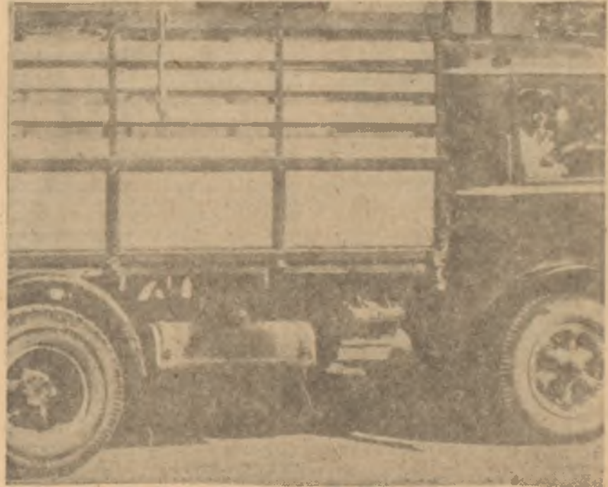
Yol ortasında bırakılan bir kamyon

C. H. P. Heyeti bu ani bahar havasının altında neler yatabileceğini düşünemeyecek kadar saf değildiler. Fakat devleti temsil eden bir adamın teminatını teminat saydılar. Geyikliye gitme kararı alındıktan sonra "Da-