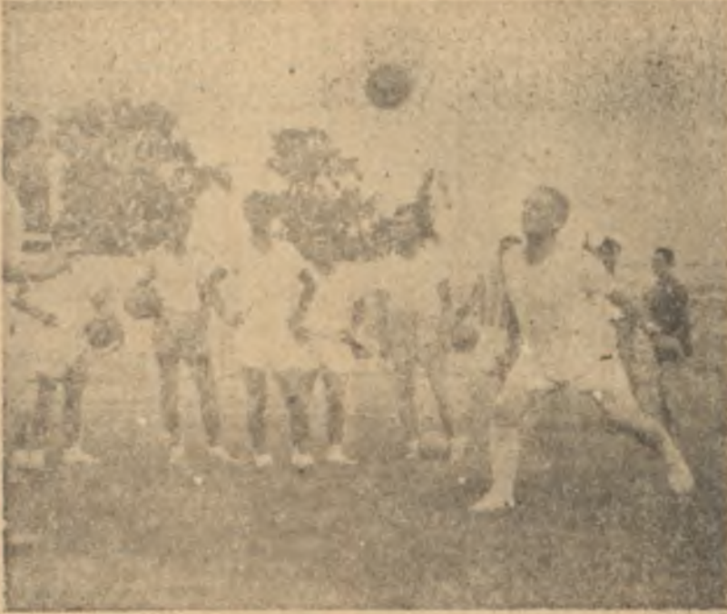
Molnar, Fenerbahçelileri çalıştırıyor