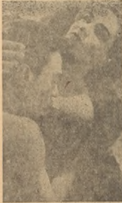
"Tepedeki oda" "Öfkeli" rejisörler

İngiliz sinemasının hastalığına yol açan mikroplar tahlil edildiği vakit, bunun bilhassa üç çeğidin en büyük rolü oynadığı ortaya çıkmaktadır. Muhafazakârlar hükümetin sinemaya karşı tutumu ilk iktidarları