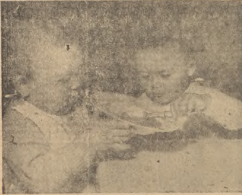
İki kardeş sofrada Komplekslerin tohumu ekiliyor

gun nefretini kazanmamıza yarar. Bu küçük insanların nefret edebileceği, kin duyacağı, hatta sevgisini esirgileyeceği küçük bir karşı koyma şeklinde düşünülürse de, küçükken alınan yaralar derin olur, ileri yaşlarda izleri silinmez.