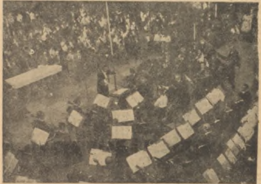
Cumhurbaşkanlığı Senfoni Orkestrası Balıkesirde

verilen her şehir, orkestrayı en kısa zamanda tekrar aralarında görmek için şimdiden hazırlıklara başlamıştır. Bu arada diğer şehirlerden de arkası kesilmeyen talepler yağmaktadır. Meselâ orkestra Aydında konser verirken Nazilli ve Denizliye de davet edilmiş, fakat zamanın müsaadesizliği yüzünden bu davetlere bu yıl iocbete imkân bulunamamıştır. Bu sebeple başlamak üzere bulunan yeni mevsimin sonunda orkestranın gelecek yaz çıkacağı ikinci turnede daha geniş bir program tatbik edilecek ve daha çok şehirde daha çok konser verilecektir. Tabii bu, orkestradan bu yıl esirgenmeyen yardım ve kolaylıkların gelecek yıl da gösterilmesine bağlıdır. Aksi halde atılan iyi niyetli ilk adım, bir son adım olarak kalmaya mahkûm olabilir. Cumhurbaşkanlığı Senfoni Orkestrası mensupları bütün gücü ile bu hizmete hazır olduklarını ilk gezideki sevkle-