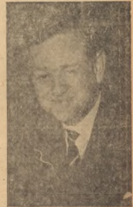
Lord Hailsham "Belden aşağı vurmak yok!"

Velhasıl seçim kampanyasının kızıştığı şu günlerde, Majestelerinin İktidar ve Muhalefet Partilerinin her ikisinde de iyimser bir hava hâkimdir. Fakat umumî kanaat, yarışın favorisinin Muhafazakârlar olduğu merkezindedir.