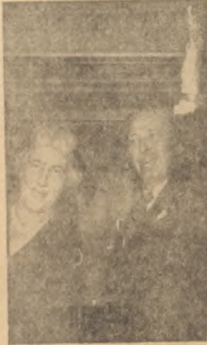
Macmillan'ların kampanyası İşler yolunda

hâkimdir, yani her seçim bölgesi bir tek milletvekili çıkarır. En çok rey alan aday, o bölgenin milletvekili seçilir.