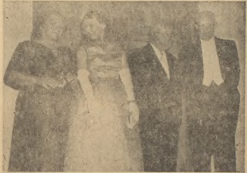
Eisenhower'ler ile Krutçef'ler bir arada

San Fransisco'da havanın birdenbire değişmesinin hususî ve umumî sebepleri vardı. Hususî sebepleri başında hiç şüphesiz Los Angeles ve San Fransisco arasındaki rekabetin rolü vardı. Los Angeles soğuk davranırsa, rakibesi San Fransisco sıcak davran-