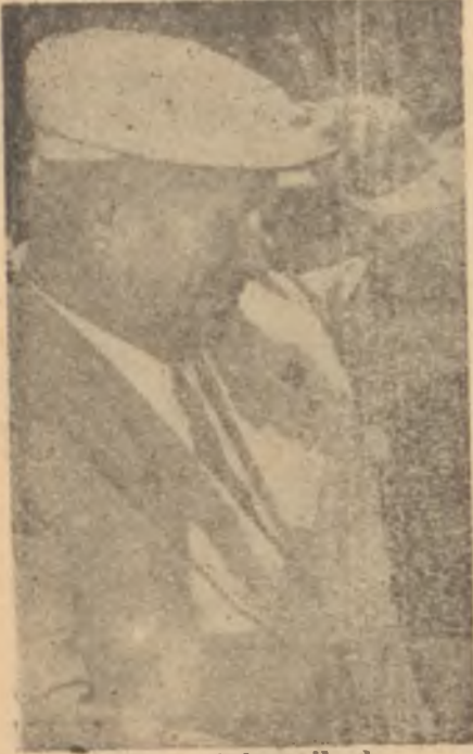
Krutçef Amerikada İsmi: Nikky Krutçic!

te tezahürat ta vardı. Fakat, polis "onun elleri kanlı bir katil olduğunu unutmama" tarzındaki afişleri toplattı. Krutçef, Pittsburgh'da çelik fabrikaları için makineler yapan bir fabrikayı gezdi. Fabrikada ona 39 santim değerinde plüro hediye eden bir işçiye 40 dolarlık saatini çıkarıp verdi. Fabrika idarecilerine "bu makineleri bize satmıyorsunuz?" diye hesap sordu. Sanayi şehrinde günün hadisesi K'nın hayatında ilk defa olarak fabrikada Coca-cola içmesi oldu. Kâğıttan bir bardak içinde sunulan Coca-cola'yı içerken K, resmi misahmandarı çilekes Henry Cabot Lodge'a takılmaktan kendini alamadı ve ona "kapitalist, bedava bir Coco-Cola içiyorum" dedi. Lodge, nazikane "Nasıl beğendiniz mi?" diye sordu. K, "pek beğenmedim, çok tatlı" cevabını verdi. Salondaki biri derhal atılarak "İsterseniz votka verelim" dedi. K, lafın altında kalmadı. "Votka için hava çok sıcak. Siz kapitalistler bizim her dakika votka içtiğimizi düşünürsünüz, değil mi?" cevabını yaptırdı. Aynı günün akşamı K şerefine verilen ziyafette, yemekten evvel bir papazın dua okumasını tatlı tatlı dinledi. Bâzılarına göre dua okunurken onun da dudakları kıpırdamaktaydı.