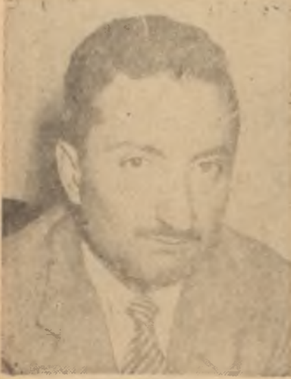
Bülent Ecevit Şaklayan çamar

Geride bıraktığımız Pazar günü Dünya gazetesinde, Türk edebiyatında mühim bir yeri olan Falih Rıfkı Atayın imzasını taşıyan psika-