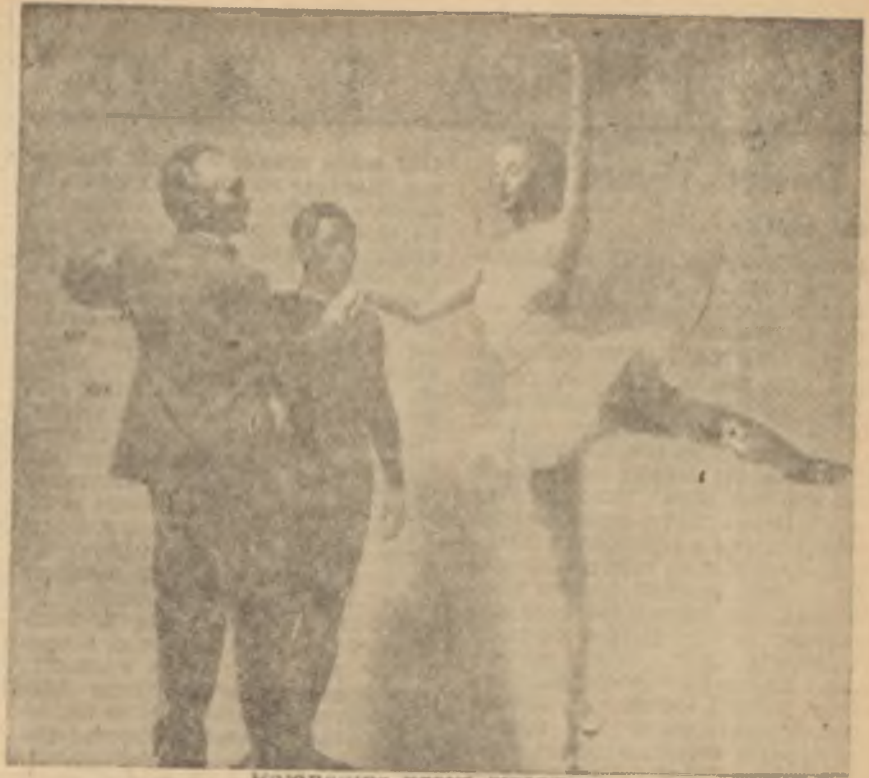
Balanchine prova sırasında