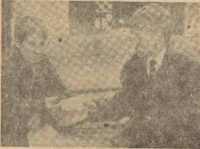
"400 darbe"nin iki küçük oyuncusu