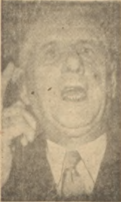
General de Gaulle