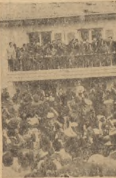
İnönü evinin balkonunda.

Bu gün 75 yaşında bir Muhalefet lideri olarak babam, her zamankinden fazla çalışıyor. Çıktığı yurt gezilerinde, bulunduğu her yerde, halkın yaşlı genç herkesin ona gösterdiği muhabbet ömrünün en büyük