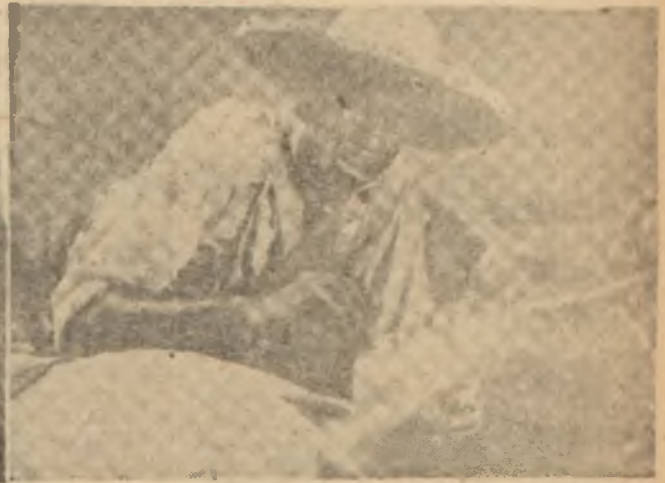
"Les tripes au Soleil"