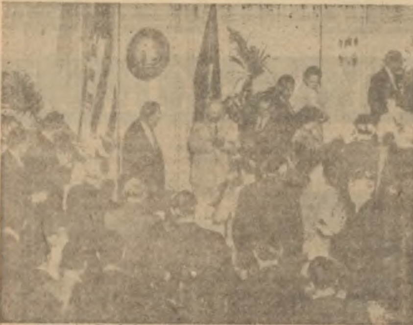
Sovyet Başbakanı Washington'da Basın kulübünde

Eisenhower ve diğer Amerikalı resmî şahsiyetler, şimdiye kadar "müzakere yok, müzakereler Dörtü Zirve Toplantısında yapılacak" demişlerdi. Fakat şimdi Eisenhower yeni bir görüşle ortaya çıkmaktadır. Nitekim Perşembe günü, basın toplantısında İko, keskin bir viraj alarak