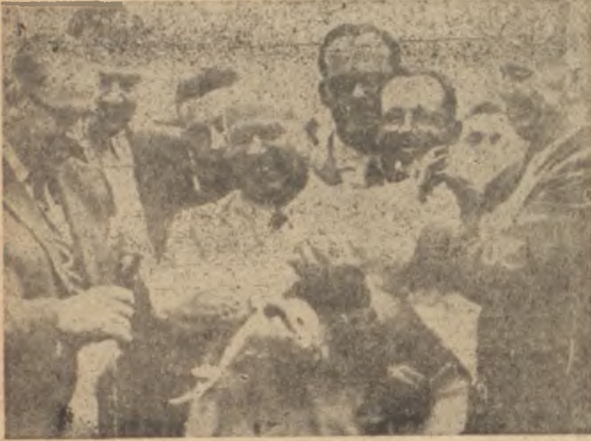
Krutçef Ziraat Enstitüsünde