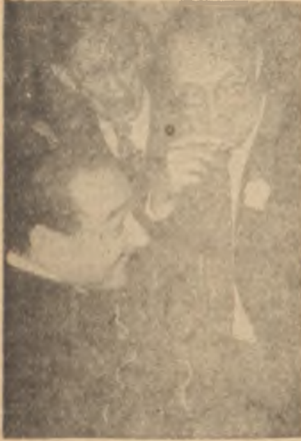
Menderes - Prens Bernhard