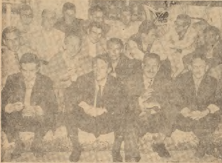
"Yeni Dalga"nın bir kısmı

"Yeni dalga"dakilerin çoğu ilk eserleriyle dikkati çekmiş, ikinci veya üçüncü eserleri, birincinin verdiği ümidi kırmamış sinemacılar. Marcel Camus, "Mort en fraude -Kaçak-