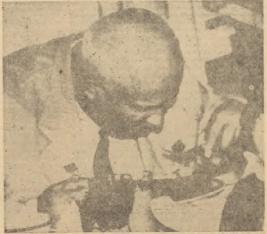
Krutçef Amerikada yemekte Dünyayı yutacak kadar büyük bir iştihali..

Hava meydanındaki merasımden sonra Eisenhower ve misafirler, Rus