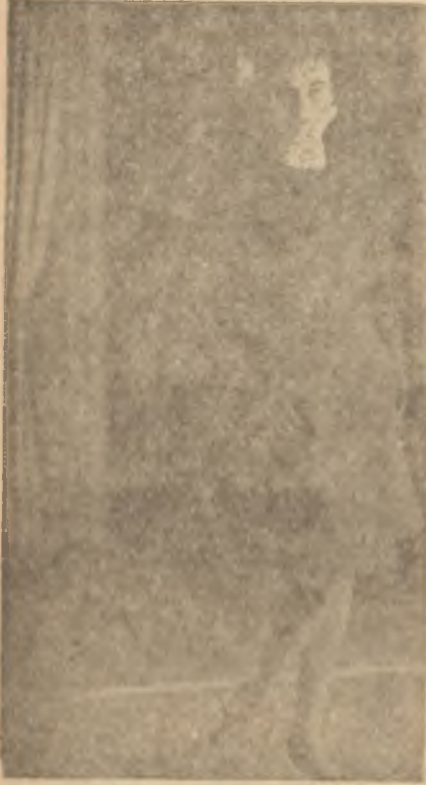
Dior'un yeni hatları Anna Karenin!