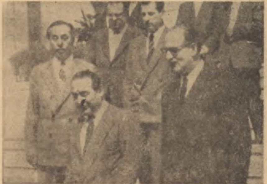
Menderes Vilâyetteki toplantıdan çıkıyor