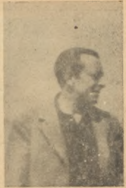
J. d' Oriola

İlk gün seyircileri hayal sükkütuna uğratan olimpiyat şampiyonu J. d' Oriola Cumartesi günü klas ve hürnerini göstermek fırsatını buldu. Önce kendisi gibi Fransız olan C. Mo-