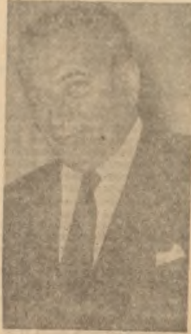
Refik Koraltan Zemane uydu

Ayhan Yetkiner meselesi de, İçişleri Bakanına gazeteciyi döven mütecavizler hakkında kanunî takibata girişilmesini isteyen bir telgraf çekilmesiyle halledildi.