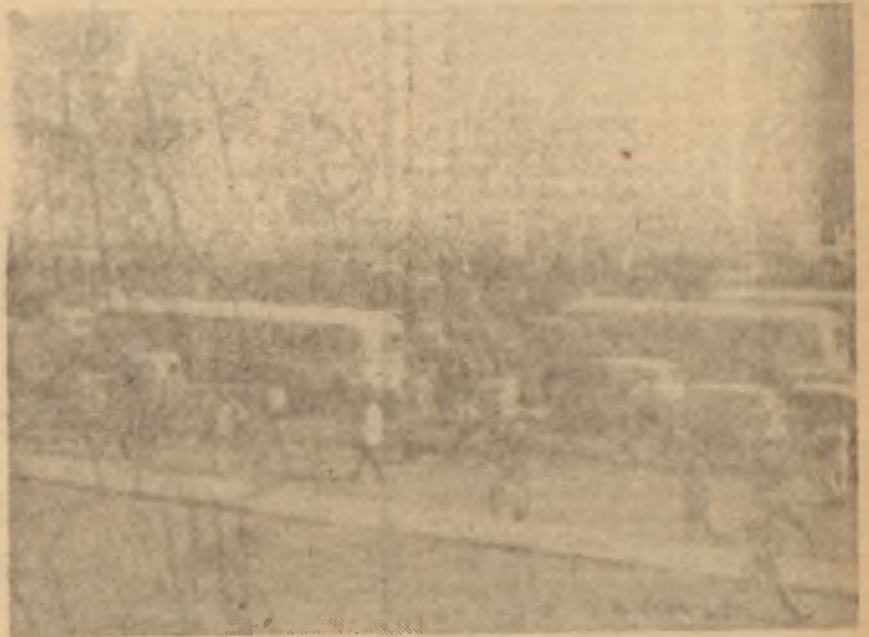
Trafiğe kapatılan köprüde vasıtaların hali

Basın toplantısı Perşembe günü akşam üzeri Hilton'da yapıldı. Başbakan Segni ve Dışişleri Bakanı Pella koyu renk elbiseler giymişlerdi, Ciddi idiler. Segni çok kısa konuştu ve gazetecilerin suallerine çok kısa cevaplar verdi. Ama ne demek istediğini anlamak zor değildi. Segni, üç yıllık yatırım programı mevzuunda sorulan bir suale "Üç yıllık yatırım programı halen tetkik edilmekte olan bir mevzudur" cevabını verdi. Müşterek Pazar meselesinde de "müzakereler yapılmaktadır. Şimdilik buna ilâve edilecek bir şey yoktur" demekle yetindi. Halbuki Erhard bula, hiç değilse basın toplantılarında, bu iki mevzu da çok daha cömert davranmıştı! Gazetecilerin "Yeni yardım var mı?" suali de "az gelişmiş memleketlere yardım mevzuuna umumî surette temas ettik" tarzında geçtirildi. Baklava tepsi boş gelmişti. Resmî tebliğ de bu boşluğu aksettirmekten başka bir şey ifade etmiyordu. Tebliğde ne yatırım programına, ne de Müşterek Pazar meselesine yer veriliyordu!