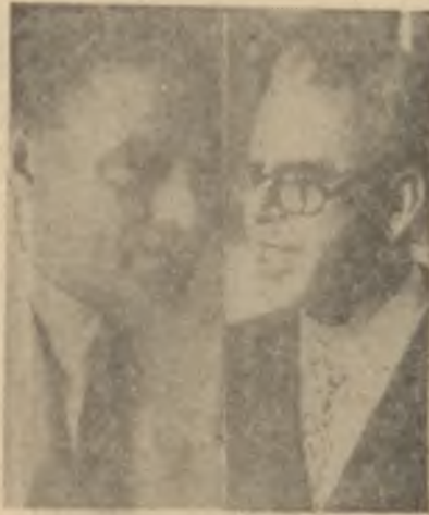
Ağaoglu - Ataman

Geçen haftanın ortasında, sayımlar dolayısıyla İstatistik Umum Müdürlüğü'nün muvaffak Umum Müdürü Şefik İnan, nüfus artışı hakkında alâka çekici izahat verdi. Bu izahata göre, nüfusun en hızlı arttığı memleket Türkiyedir. Nüfus her yıl binde 30 artmaktadır. Nüfus artışının çok hızlı gittiği düşüncesiyle, çocuk aldirmanın serbest bırakıldığı Japonya'da dahi yıllık nüfus artış nisbeti ancak binde 16'dır. Bu yüzden 1950'de 20 milyon 947 bin olan Türkiye nüfusu 1955'de 24 milyon 122 bini bulmuştur. 1960'da 27 milyon 619 bine erişeceği tahmin olunmaktadır. Yani 5 yıl zarfında nüfus 3,5 milyon kişi çoğalmaktadır!