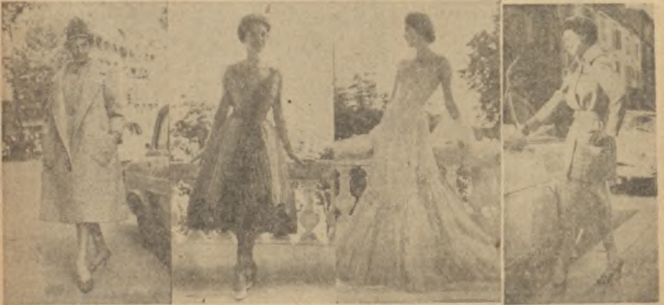
1959 - 1960 sonbahar ve kış modasında Paris yenilikleri

Evinize gelen misafirler arasında "Ah, bir kalkıp gitmeyi akledibilse!.." diye gözünün içine baktıklarınız olduğu gibi, size daha sık gelmesini arzu ettirecek kadar hoşsohbet, nazik ve sevimli misafirleriniz de olmuştur. Fakat kendinizin anıtlarınız arasında nasıl karşılandığınızı, iyi mi, yoksa kötü mü bir misafir olduğunuzu, düşünmek zahmetine katlanmamışsınızdır. Halbuki misafirlik bir sanattır. Tıpkı ev sahipliği de bir başka sanat olduğu gibi... Bunların arasındaki fark, birincisi ne kadar çok ihmal ediliyorsa, ikincisine o kadar fazla ehemmiyet verilmesidir.