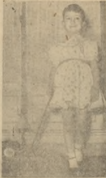
Oyun çağında çocuk

Küçük yaşlarda edinilen mesuliyetsizlik ve beceriksizlik ileri yaşlarda da kökleşmiş birer alışkanlık olarak kalır. Bazı anneler giyim, yemek ve doyumak hususunda çocuğu itimat etmezler, kendileri bu işleri yaparlar. Bazı anneler ise bununla da kalmayıp, çocuğu oyun imkânı bile vermeyecek şekilde titiz olurlar ki, umumiyetle pısrık, çekingen ve beceriksiz çocuklar böyle yetişenlerdir. Meselâ, bir kır eğlencesinde bile terleyecek diye oyun oynamasına izin verilmeyen, dereye ayağını sokmak isteyince "karnın ağrı" diye önlenen, düşerse "ben sana demedim mi? Doğru dürüst otursana" diye ikaz edilen ve çocuk olduğu daima unutulmuş bir çocuğu bir bardak suyu döke saça getirdi diye, okul kitaplarını bir türlü muhafaza edemiyor diye, şikâyetçi olmak haksızlık değil midir? Gilyinirken, beslenirken, oynarken bir takım işler yapmağa ve dikkat etmeğe alışan çocuk, bu dikkati devamla olarak gösterecektir. Ama biri tarafından idare edilmeğe alıştırıldıysa, bunu her zaman bekliyecek, bulamayın-