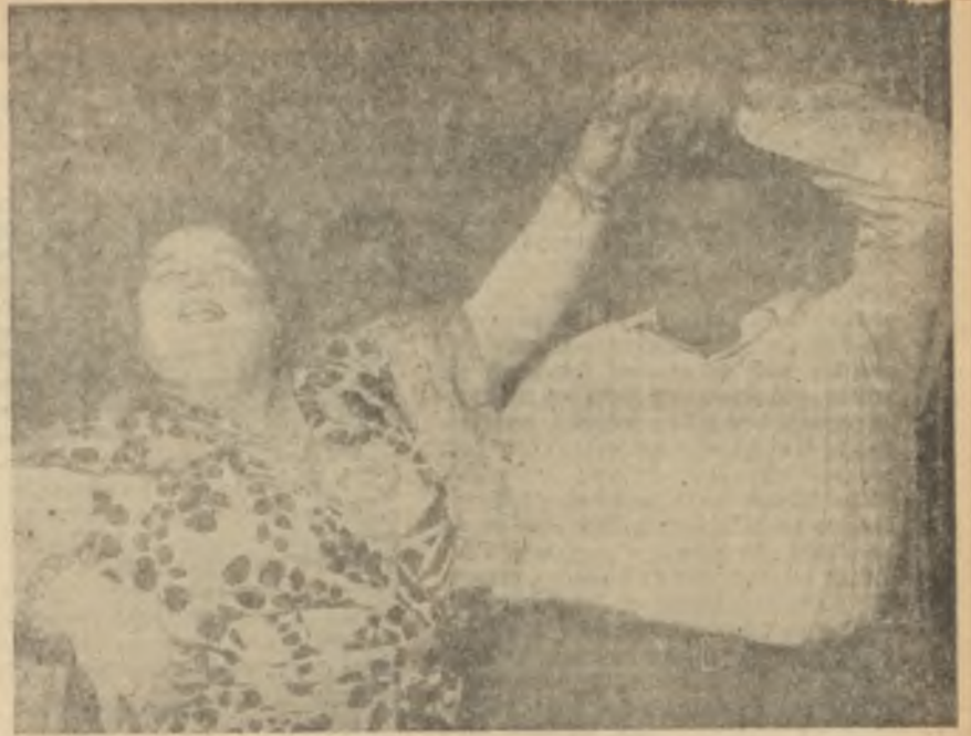
Şişmanlıkta rekor kıranlar Şeker hastalığına davetiye