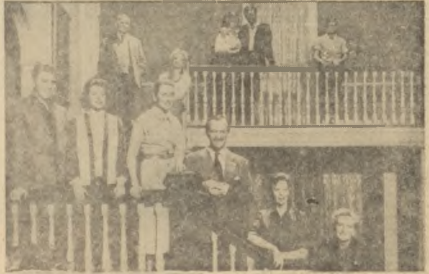
"Ayrı masalar"ın oyuncularını

William Wyler, listenin en iyi kovboy filmi olan "The Big Country -Büyük ülke"de bir yandan Goerge Stevens'in "Giant"ındaki destan havasını bir yandan da kendi eseri olan "The Friendly Persuasion -Kan dökmi yelim"deki barışçı tutumunu biraraya getirmeye çalışıyor, fakat buna an-