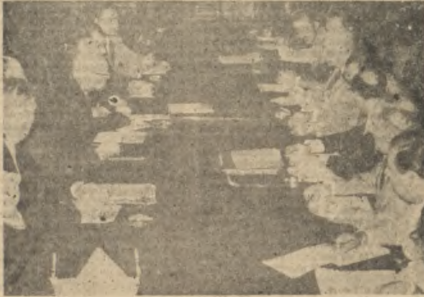
Son O. E. C. E. heyeti ile yapılan müzakere

Doktor Küçük geçen haftayı Ankara'da Başbakanlıktan telefon beklemekle geçirdi. Kıbrıs liderleri Türkiye'ye gelişinde bu telefonu beklemlerdi. Telefonu boş yere beklediği görülmüştü. Ama bu sefer Bulvarı Palasta kalan Küçük, sık sık Başbakanlıktan arandı. Başbakan bazar gecesinde geç saatlerinde çağırıldı.