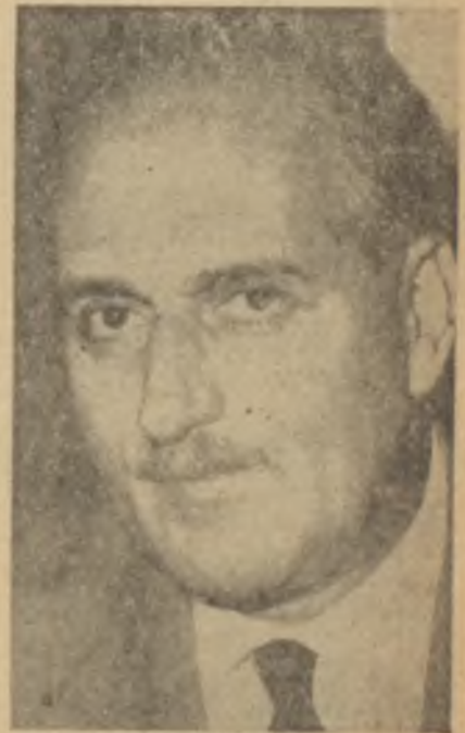
Fatin Rüştü Zorlu