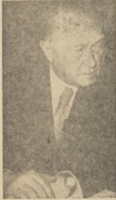
Adenauer Prestij peşinde

Üç dört saat süren gündemsiz Paris konuşmalarında, General de Gaulle yeni plânın esaslarını Eisenhower'e anlattı. Fakat ikna edilmeye hazır Eisenhower'ı ne dereceye kadar ikna edebildiği meçhuldür. Resmî tebliğ "Afrika ve Kuzey Afrika meselelerinin oldukça geniş bir şekilde konuşulduğunu" söylemekle yetinmektedir. Liberal tasavvurları hakkında General de Gaulle'ün Eisenhower'ı ne dereceye kadar ikna edebildiği, Birleşmiş Milletlerde Cezayir meselesi görüşülürken anlaşılacaktır. Amerika gibi Türkiyenin de Cezayir meselesinde reyini nasıl kullanacağı bir merak mevzuudur. Türkiye NATO tesanüdü uğruna başlangıçta Fransayı desteklerken, bazı Arap memleketlerini de memnun etmek zarureti ortaya çıkınca çekimser kalmayı tercih etmişti. Fakat bu yıl iktisadî sahada O. E. C. E. "İşbirliği" ve Müşterek Pazara girme talebi dolayısıyla, Cumhuriyet Hükümeti Fransız Hükümetini gücendirmeyi asla göze alamıyacak durumdadır. Fakat Arab Dünyası ile münasebetler bakımından da, Fransa'nın dümen suyundan gitmek çok hoş bir iş değildir. Eğer Amerika, Fransanın arzusu hilâfına Cezayir meselesinde çekimser kahrına, Türkiyenin tercih