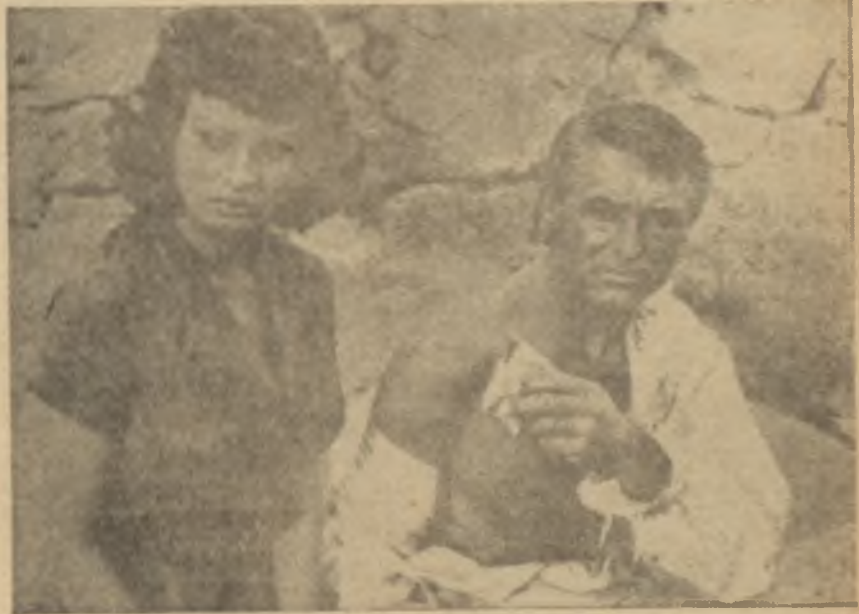
"Gurur ve ihtiras"ta S. Loren ve C. Grant