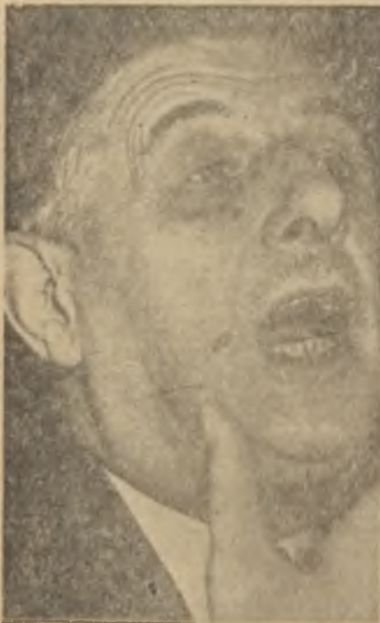
General de Gaulle

Opera civarına yaklaşıırken, protokol icabı motörün yerini at aldı. Motosikletlerin vazifesi atlı muhafızlara devredildi. Ike ve De Gaulle de otomobili bırakarak atlı arabaya bindiler. Asfalt ve parke yollar üzerinde at nallarının çıkardığı sesler arasında katile 65 dakikada, Ike'in kalacağı Quai d'Orsay'e geldi. Halbuki Ike'in hava meydanından helikopterle taşınan bagajları beş dakikada Quai