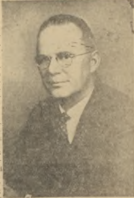
Fletcher Warren New York Times'ten selâm!

Kitabın müellifleri, fikirlerine dellil olarak Seylandaki Amerika elçisinin düştüğü bir hatâyı belirtmektedirler. Temasını sadece iktidarlara kuran ve memleket, millet