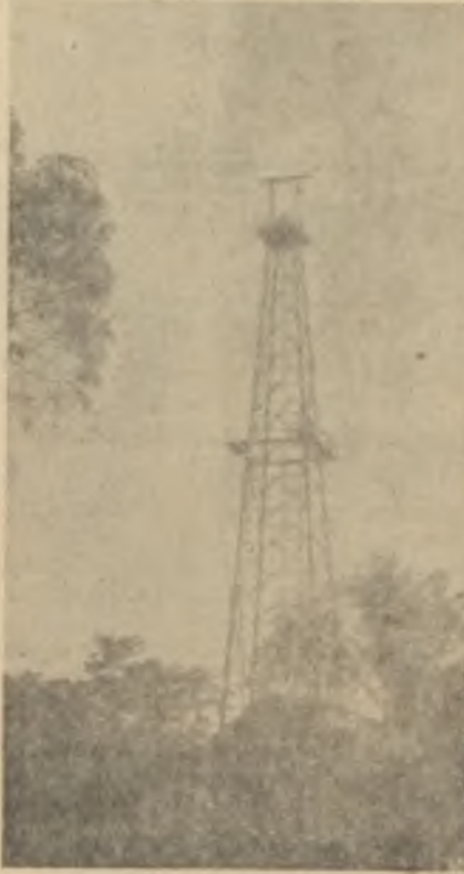
Bir petrol kuyusu