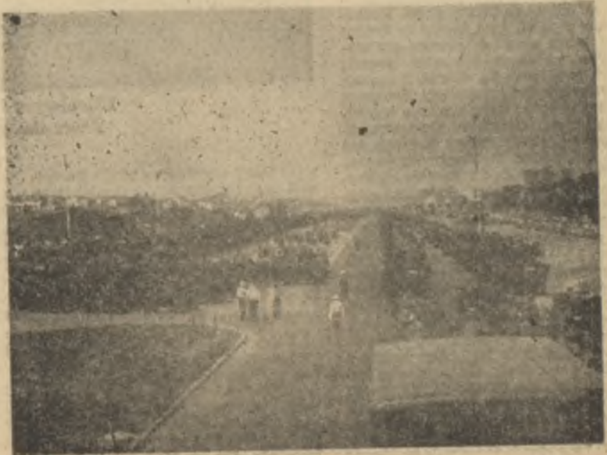
Vatan Caddesinde resmigeçit Sağı solu işçi Sigortalarının!

Ücretlerinden kesilen paraların ancak cüzi bir kısmı işçilere dönmektedir. Bu işin sosyal yönüdür. Meselelerin bir de iktisadi yönü vardır. O da bu mecburi tasarruf kaynağının en verimsiz ve en mânasız yatırımlara gitmesidir.