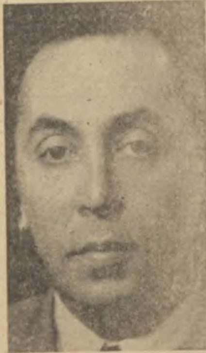
Dr. Namık Gedik

Aslında, Dr. Namık Gedik'in eyalet fikrini ortaya atması bir sürprizdi. Nitekim, haber Konyadaki muhabirleri tarafından İstanbul gazetelerine bildirilir bildirilmez yazı işleri müdürleri Ankara bürolarına mese-