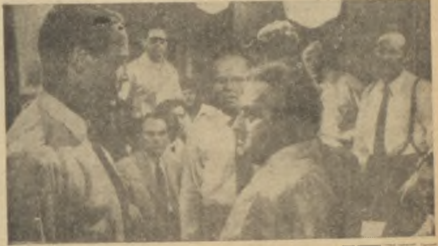
"Oniki öfkeli adam"dan bir sahne

« B eklenmiyen şahit"teki ciddi havanın aksine Lubitch'vari bir komedi havasının hâkim olduğu ve yine Wilder'in elinden çıkan "Love in the Afternoon -Ariane, Öğleden sonra aşk" da, ancak yarım bir başarı sayılabilir. Bu başarı da yine daha çok oyunculara dayanıyor. Claude Anet'nin romanından adapte edilen "Ariane", yaşlı bir çapkın, bunu gözetlemek için tutulan bir özel detektif ve detektifin kızı üzerinde kurulmuştur. Yaşı bakımından Gary Cooper, yaşlı çapkın rolüne tam uygun düşüyorsa da eski komedilerindeki alışkanlığını burada bir hayli kaybetmiş görünmektedir. Buna karşılık, bir baskasının hesabına Cooper'in çapkınlık maceralarını rapor