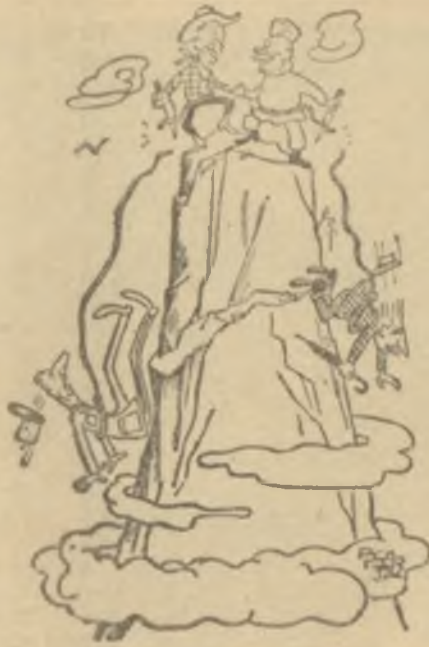
— Le Canard Enchaîné'den —

NATO üyesi bulunmayan bir memleketin dışişleri bakanının Eisenhower tarafından kabulü, NATO dışişleri bakanlarından bazılarını prestij sebepleriyle, Ike ile randevu temini için teşebbüse sevketti. Sözü dinlenmeyen ufaklardan olmaya asla rıza göstermeyen İtalya, uzun ısrarlardan sonra arzusunu gerçekleştirdi. İtalyan Başbakanı Segni ve Dışişleri Bakanı Pella, Pariste Eisenhower ile konuşabildiler. Krutçef'le mülakatından evvel Eisenhower'le görüşmeye çalışan memleketlerden biri de Türkiye'dir. Türkiye'nin NATO Daimi Temsilcisi, Eisenhower'ın Avrupa seyahati haberi duyulur duyulmaz, NATO Konseyinin Başbakanlar kademesinde toplanmasını temine çalışmıştı. Bu gayretler netice vermedi ve Başbakan Menderesin Parise gitmesi mümkün olmadı. Mamafih Cumhuriyet Hükümeti Eisenhower'le görüşmek fikrinden vazgeçmemişti. Parise giden Dışişleri Bakanı Zorlu bir mülakat teminini kendine iş edindi. Hattâ birara bunda muvaffak da oldu. Çarşamba günü, Amerikalı resmi şahıslar,