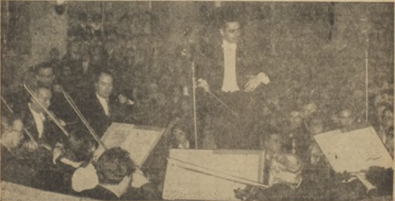
Cumhurbaşkanlığı Filârmoni Orkestrası bir üniversite konserinde

Orkestra üyeleri için uçaklarla yapılan böyle bir konser seyahati, dünya kadar rüyada bile görülemiyen müstesna bir hâdiseydi ve bu fırsatın lâ-yık olduğu şekilde değerlendirileceği muhakkaktı.