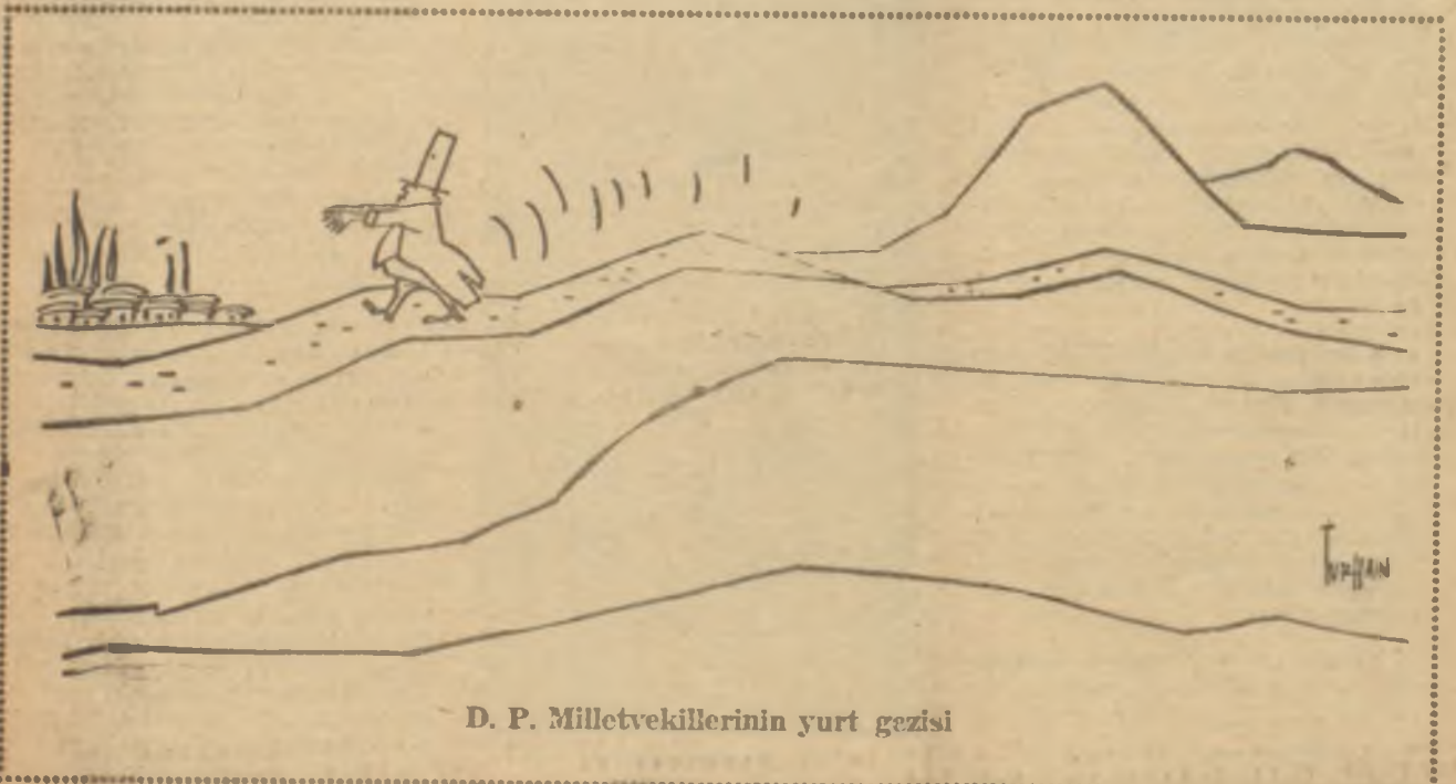
D. P. Milletvekillerinin yurt gezisi

Heyetlerle müzakere geçen Çarşamba günü akşam üzeri Dışişleri Bakanlığında başladı. Para Fonu Heyeti ayrıca Maliye Bakanlığında çalışmalar yaptı. Vakit kazanmak için, mütehassıslar istedikleri bazı dosyaları, otellerinde incelediler. Türk heyetlerinin başkanları Hasan Işık ve