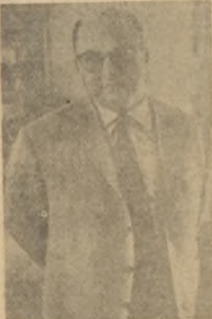
Perez Jimenez Tutulan adam!

hakkındaki fikirlerini iktidarın gözükleri le edinen bu elçi dostlarının, yapılan ilk seçimde, Parlâmentodaki 101 azalıklardan sadece 8 tanesini muhafaza edebildiklerini görünce şaşkına dönmüştür. Bir Amerika