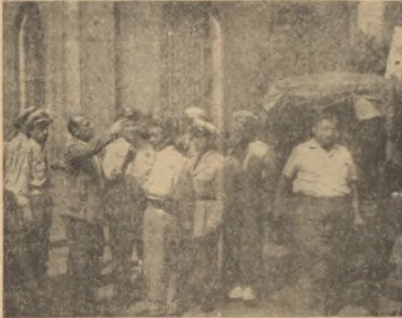
T. M. T. F. binası etrafında polisler