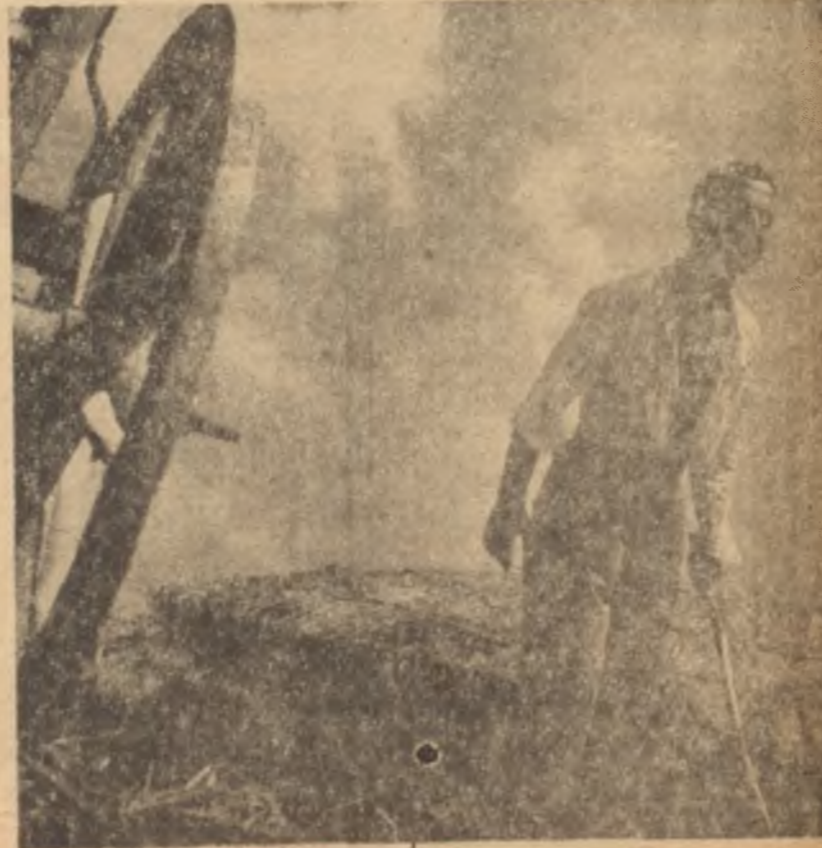
"Namus düşmanı"ndan bir sahne

sansür daha doğmuştur: Sinemacının kendi kendini sansürü... Bir senaryocu, bir rejisör daha kalemi eline alır almaz ilk düşüneceği şey mevzuunu nasıl geliştirmek, şahıslarını nasıl seçmek, hâdiseleri nasıl sıralamak değil, bunları sansürün hoşına gidecek en uygun şekilde nasıl sokabileceğidir. Falanca sahneyi gözünün önüne getirdiği vakit sansürün buna ne diyeceğini, filanca sahnenin hangi sansür üyesinin hoşuna gittiğini hesaplamaya çalışır. Ama bu hesabı çok kere yanlış çıkar; bütün iyiyi niyetine rağmen kendini sansür nizamnamesine göre "ayarlamak" için sarfettiği gayretler ekseriya boşşa gider. Zira ortada sansürün kullanıldığı belli bir ölçü yoktur. Gerçi sansür nizamnamesi, beyaz perdeye neleri göstermekten hoşlanmadığını 7 nci maddesinde on fıkrada halinde sıralamıştır. Ama bu "on buyruk"un "evamir-i aşere" ile benzerliği sadece sayı bakımındandır, kesinlik bakımından değil! Gerçekten de "evamir-i aşere"de "öldürmeyeceksin", "çalmıyacaksın", "zina etmeyeceksin"... şeklindeki kesin ifadeler yanında Sansür Nizamnamesinin on buyruğu top gibi yuvarlanabilir, lastik gibi uzayıp kısalabilir, havanın rutubetine göre değişikliklere uğrar