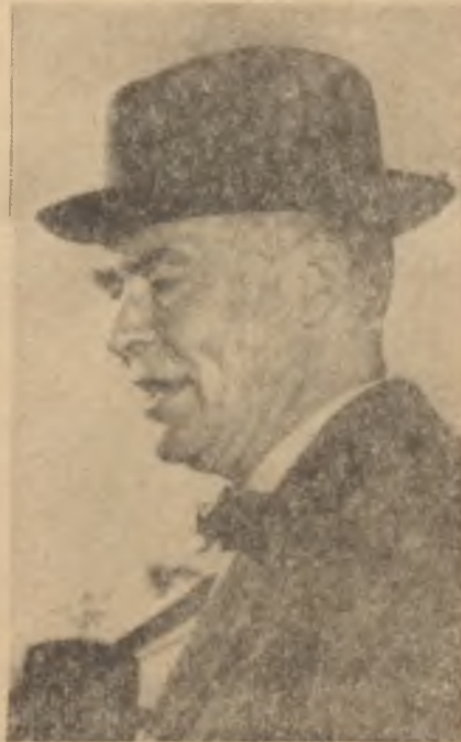
Christian Herter Büyüklüklerin en büyüğü

Dışişleri Bakanı Zorlu ile Batılı üç dışişleri bakanının ayrı ayrı görüşmeler yaptığı sırada, İkinci Cenevre Konferansı başlamış bulunuyordu. Konferansın ilk günleri hiç de ümit verici olmadı. Batılıların planı, Berlin meselesinde geçici bir anlaşma elde etme noktası etrafında toplanıyordu. Bu anlaşma, Batılıların Berlin üzerindeki hakları üzerinde hiç bir değişiklik yapmıyacaktı. Sonra Rusya, Batılıların başları üzerine Damoklesin kılıcı gibi sallandırdığı "Anlaşmazsanız, 18 ay sonra Doğu Berlini Doğu Almanya hükümetine terk ediyorum" tehdidinden vazgeçmeliydi. Ama Rus Dışişleri Bakanı Gromyko, bu mevzularda tâvize yanaşmadı. Doğu ve Batı Almanya temsilcilerinden müteşekkil bir komisyon teşkilini ve bu komisyonun Almanyanın birleştirilmesini hazırlayacak müşahhas teklifler getirmesini istedi. Teklif, Adenauer'i kızdırmaktan çekinen Batılılar tarafından hiç değilse açık toplantılarda şiddetli bir muhalefetle karşılandı. Hele Rusyanın Cenevredeki gizli toplantılara, Doğu Almanya temsilcisinin de katılmasını istemesi havayı bishittün bulandırdı. Hâlen Dortler, dışişleri bakanlarının kaldıkları villalarda verilen bol şampanyalı, şaraplı ziyaretler es-