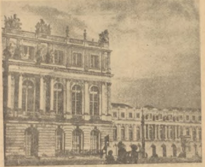
Versailles sarayından görünüş Sosyeteye ilk adım!

Bu biraz hususi mahiyet taşıyan toplantıların genç kızlara müstakbel eşler yaratmakta olduğu farkedilir. Çalan telefonlar, yapılan davetler, birinci çıkış, bunu takip eden ikinci, üçüncüsü hep bu yoldadır ve bu arada en mühim olan nokta, genç kızın artık karar verme mevkiine ulaşmış bulunmasıdır. Yani seçim ve karar kendisine aittir. Genç kızın bu devresinin aileye yahut bizzat kendisine biraz pahalıya mal olacağını kabul zaruridir. Zira sosyete ile birlikte karşısına Moda ve Zerafet de çıkmış gelmiştir. Bu hususi partilerin müdavimleri arasında erkekler daha az masraflı bir hayat yaşarlar. Öyle ya, nihayet iyi dikilmiş bir emokin, onların işini halleder. Mevsime göre bir kaç iyi seçilmiş elbise kendilerine rahatlık yaratır. Halbuki genç kız, saç tuvaletini düşün-