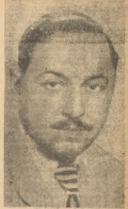
Tennessee Williams Gene de fena değil

Bununla birlikte seyircinin bir takım haksızlıklar ettiği de olmuştur. Brendan Behan'ın "Client du Matin" isimli oyunu, işte bu haksız-