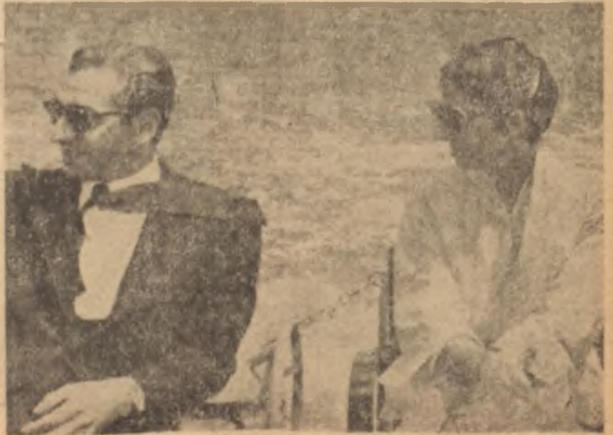
Şah ve Süreyya mesut günlerinde

Fransız gazetecilerin bildirdiklerine göre, Şah eski karısı üzerindeki himayesine âdeta baba sevgisini andıracak bir rikkatle devam etmektedir. Roma dedikoduları üzerine, Şahın emriyle gönderilen maliye uzmanları müstakbel zevcin sabık kraliçeyi malî bakımdan temin edip edemeyeceğini araştırmışlar, vaziyeti mufassal bir raporla Tahran'a bildirmişlerdi. Şahın "sabık zevcem istediği kimseyle evlenmekte serbesttir" şeklindeki tebliğini yayınlaması da işte tam bu sıraya rastlamaktadır. Süreyya, bu tebliğin edasında bir müsaadeden ziyade bir ihtar saklı olduğunu sezmemişti. Genç