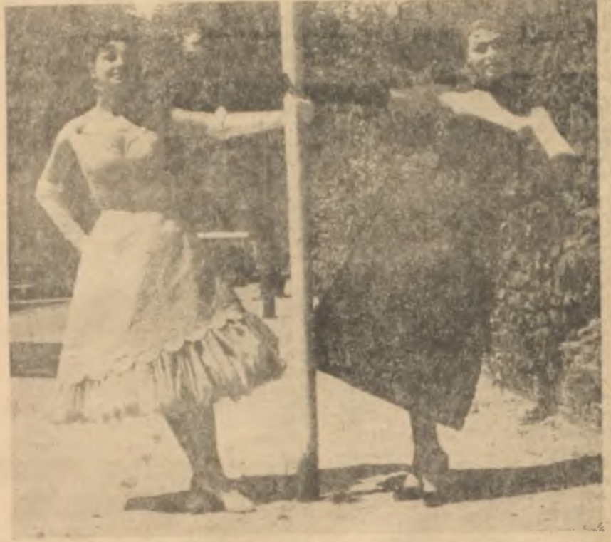
Uzunlu kısa, kısayı uzun gösteren moda Terzi mucizesi!.