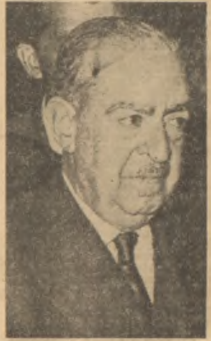
Ahmet Emin Yalman

Görüşmenin yapıldığı ay Mayıs. Meşhur af, şimdi Kasıma kalmış bir ümit. Yani, altı ay! Haklı çıkan İnönü. Acaba Muhalefet lideri yalnız temaslara değil, böyle temaslara elde edilmek istenilen gayeye de hangi üzere, işareti, Yalmana o kahkahasından daha iyi nasıl izah edebilirdi?