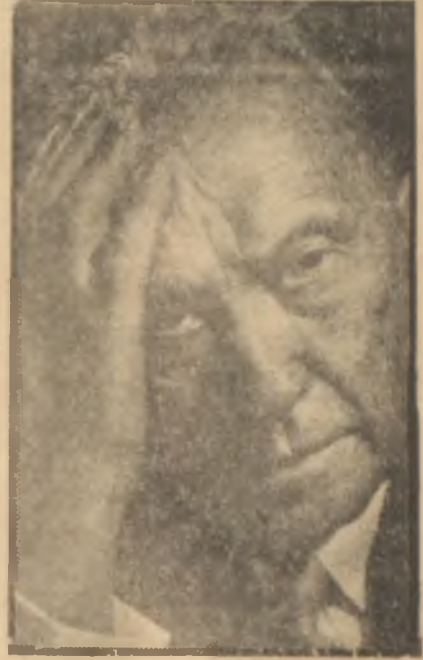
Conrad Adenauer Zirveye tırmanıyor

jini kurtardığından memnun olarak Romaya döndü. Ama bu arada Türk Dışişleri Bakanı Fatin Rüştü Zorlu'nun Üç Büyüklükler tarafından davet olunmadan Pazartesi sabahı Cenevreye geldiği görüldü. Montreux'de göl kenarındaki Palace Hotel'e yerleşen Zorlu'nun seyahat programı bile belli değildi. Maamafih Zorlu, "küçüklerin hâmisisi" rolünü pek benimseyen Fransız Dışişleri Bakanı Couve de Murville tarafından Sah günü öğle yemeğine çağırıldı. Daha sonra Brentano, Lloyd ve Herter ile Zorlu'nun görüşmeleri temin edildi. Zorlu, Çarşamba sabahı Brentano ile görüştü. İngiliz Dışişleri Bakanı Selwyn Lloyd ile aynı gün öğle yemeği yedi. Akşam üstü de Amerikan Dışişleri Bakanı Herter'i gördü. Anadolu Ajansı, bu temaslara "çok faydalı" olduğunu bildirdi. Zorlu Batılı üç dışişleri bakanına herhalde daha geçenlerde Amerikada Colgate Üniversitesinde açıklaştığı görüşlerini tekrarladı. Doğu-Batı arasındaki buzların çözülmesinin Amerikan savunma ve dış yardım gayretine ters edileceğini düşünen Türk Dışişleri Bakanı, Amerikalı Gazeteci Alsop'un bir fikrine iştirak ederek, Rusların Batılıların dikkat nazarını Cenevreye çevirip Orta Doğu ve Afrika'da rahatça icrayı faaliyet etme gayesini güttüklerini belirtti. Rusların hedefi Afrikadaydı. Afrika yolu da Orta Doğudan geçiyordu. Orta Doğunun kalesi Türkiye idi. Türkiye kuvvetli olmalıydı. Tabii ki bütün bu mülâhazaların varis noktası, ismi açıkça söylenmese bile "dış yardım"dı. Zeki Türk Dışişleri Bakanı, bütün yolları Romaya çıkartmasını