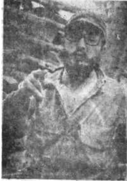
Fidel Castro Hesap - Kitap!

Castro'nun ihtilâlden sonra Amerika aleyhine söylediklerinde tamamen samimi olduğuna ve hakikaten Amerikan dış siyasetinden farklı bir tarafsızlık siyaseti gütmek istediğine dair elde kuvvetli deliller vardır. İhtilâlin hemen akabinde Amerikan dostu görünmek. Amerikan demokrasisinin Kübadaki kurtarıcısı olarak ortaya çıkmak Castro'yu Washington'un gözünde hayli yükselteceği muhakkaken, idealist ihtilâlcinin açıkça konuşması ancak işlenen hataları olduğu gibi gösterebilmek endişesinden doğmuştu. Bugün de, Castro aynı şekilde düşündüğünü sakla-