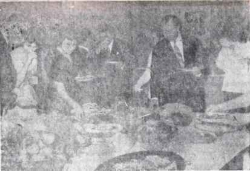
ve Gedik İsviçrede elçiliğimizdeki ziyafette