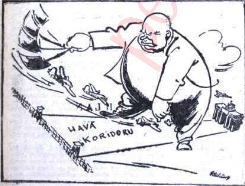
KRUTÇEF — ŞURADAN GEÇİNİZ!..

Batı Almanyanın şimdiye kadar ki tutumu, Bonn hükümetinin Sovyet niyetlerinden açıkça şüphe ettiğini ve yapılacak müzakerelerden pek bir şey beklemediğini ortaya koymuştur. Fransa da aynı görüşe katılmaktadır. Buna karşılık, Washington'un görüşünde hafif bir değişiklik vardır. Amerikan hükümeti, Sovyetlerin iyi niyetlerinden şüphe etmek bakımından Bonn ve Parisle tamamen hem-