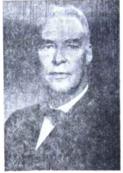
Christian Herter Bir başka hasta

Zirve toplantısı hazırlıkları için 11 Mayıs'ta Sovyetlerle bir masaya oturacak olan Batılılar hâlâ müşterek bir görüşe varabilmiş değillerdir. İki