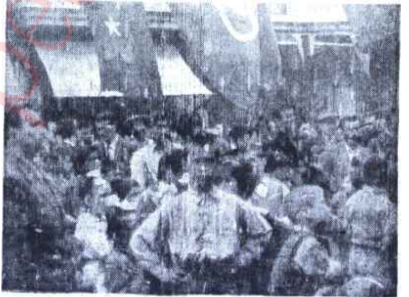
İstanbulda Vatan Cephesi ocağı açılıyor

Aygünün hücumunun gösterdiği tek hakikat, C. H. P. de başlayan en ufak bir hareketin dahi D. P. binasının temellerini sallandırmaya kâfi geldiği, idarecilerinde tarifsiz bir telâş uyandırdığı idi. Kurbanoğ-lunun Elâzığ'da. Yardımcının Diyar-