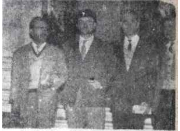
Halulu, hapishaneye girdiği gün

Ama jandarmanın böyle "kuru glirültü"lere karınım tok olduğu görülüyordu, kesip attı: "Arkadaş! Sen elini uzatıyor musun, uzatmıyor musun? Hasta-