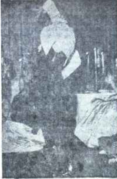
Meşhur dansör Antonio

Y eşil Akdenizde nefis geçeceği sanılan dönüş yolculuğunu, Valansiyadan hareketten 4 saat sonra başlayan "görülmemiş" bir fırtına bozdu. Fırtına 9 derece şiddetindeydi ve gemi 35 derece meyil yapmıştı. Gerçi