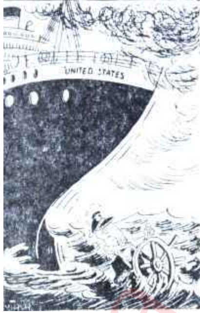
Vicky'nin karikatürü Dulles'siz Eisenhower

Şimdi Walter Reed hastahanesinde ölümle pençelesen adamın, komünizm karşısındaki mücadelesi şu esaslara dayanıyordu: "Bir defa, bugünkü hayatta, komünizm kötülüğü, Batı medeniyeti de iyiliği temsil etmektedir. İyile kötü arasında mücadele eninde sonunda iyiliğin lehine sona erecektir ve Batılılar bu galibiyeti elde etmek için bütün kozlara sahiptirler. Eksikliğini duydukları tek şey, kuvvetli bir imandan ibarettir. Batı cephesinin dayandığı iyilik esası bu kadar kuvvetli olduğuna göre, onunla beslenen ruhların hareketsiz ve pasif kalmaları, herşeyden korkmaları için hiçbir sebep yoktur. Batı dünyası, statik kalmamalı, daima dinamik olmalıdır." Bu esaslardan hareket eden Dulles, tatbikatta, iki blok arasındaki tarafsızlığı "gayri ahlâkî" bulmaktaydı. İyi ile kötünün mücadelesinde tarafsız kalmak iyilik tarafını seçmemek ve dolayısıyla kötülüğe karşı cephe tutmamak demektir. Dulles, Avrupa ve Asyada Sovyet hâkimiyeti altına giren topraklardaki olup bitiyi de, yine aynı esaslardan hareket ederek, tanımiyordu. İyilik, bir gün oralarda da galebe çalacak ve esir milletler hürriyetlerine kavuşacaklardı.