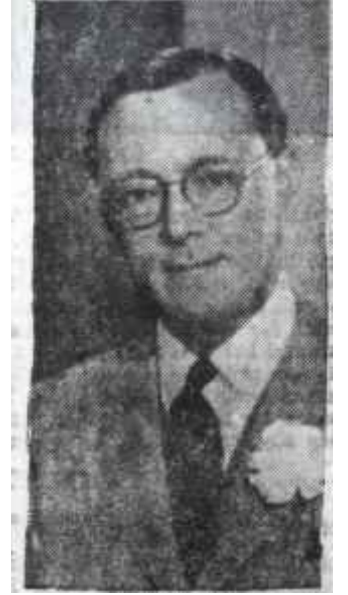
Prens Bernhard ... ve bir daha!

mevzuların başında "Basın Hürriyeti" gelmektedir. Enstitünün yaptığı ilmi; e-tüddler, bilhassa gazeteciler arasında büyük alaka uyandırmakta ve gazetecilik mesleğinin gelişmesini temin eden temel gıdanın hürriyet olduğunu ortaya koymaktadır. Enstitünün araştırmaları göstermiştir ki, nerede hürriyet varsa orada basın gelişmekte, nerede hürriyetler kısılmışsa orada da basın gerilemektedir. Enstitünün tarafsız ve sırf mesleki gayelerle yaptığı araştırmaları sonunda vardığı bazı neticeler, bir taifem memleketlerin idarecileri arasında hoş karşılanmamış, hattâ merhum Somuncuoğlu gibi bunu içiş-