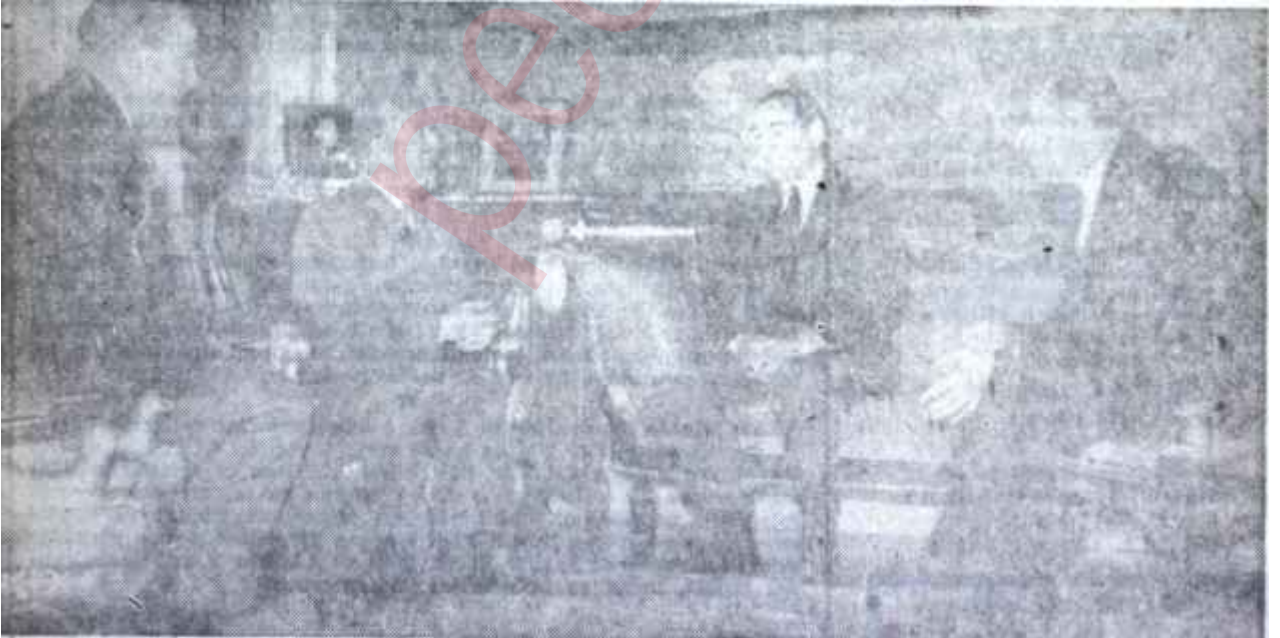
Menderes, Pardo sarayında General Franco ile karşı karşıya Tebessümde iktisat!..