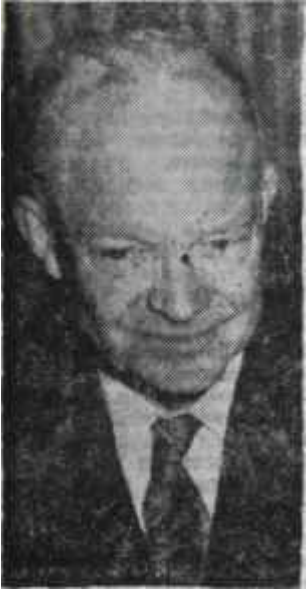
Eisenhower Bir misal...

İnönünün katılma hususunda kati kararını almaya çalışıldığı şu günlerde, Berlinde yapılan ; Sekizinci Umumi Heyet toplantısı için, Beynelmillel Basın Enstitüsü son hazırlıklarım tamamlamak üzeredir. Dünyanın dört bucağındaki çeşitli milletlerden bin kadar gazetecinin. üye bulunduğu Enstitünün meşgul olduğu