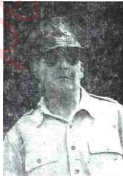
General Mac Arthur İşi açan oymuş!

mamaktadır. Fakat şurasını da unutmamak gerekir ki, Amerikanın nüfuz sahasına dahil olan ve iktisadî bakımdan "büyük komşu"ya şiddetle muhtaç bulunan bir devletin de tek başına bir yol tutabilmesi hemen hemen imkânsızdır. Dünyanın başka köşelerinde belki başarılabilir olan böyle birisi. Amerikanın burnu dibinde yapmasını Castro'dan beklemek, küçücük Kübanın imkânlarını fazla mübalâğa etmek olur. Fidel Castro'nun muvaffakiyeti, Amerikan nüfuzundan tamamen sıyrılmakla değil, bu nüfuzu makûl hadler içinde tutabilmekle kendisini gösterecektir.