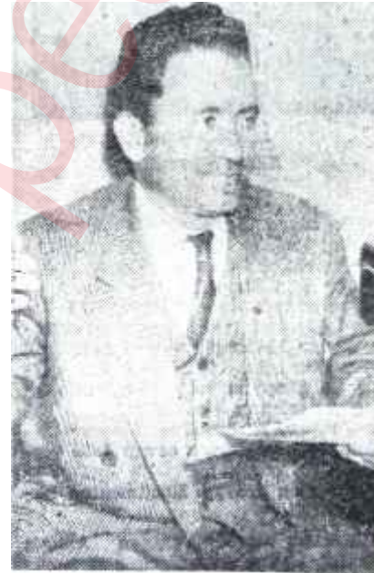
Mehmet Toprak Yüreği götürmedi

Kurum Umum Müdürlüğü, başlangıçta Kaymakamın bu müracaatını dikkate aldı ve tediyeyi durdurttu. Fakat... bir müddet sonra mahallî kombinanın aracılığı ile bir mektup aldı. Mektup "Nevşehir Mebusu Hasan Hayati Ülkün" imzasını taşıyordu. Ülkün, Kurumun muamele-