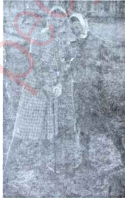
Genç kız kıyafetleri

Giyinmek herşeyden evvel seçmesini bilme ve dayanır, seçmesini bilme ise herşeyden evvel bazı yeniliklere ve cazip şeylere "hayır" demeyi bilmekle mümkündür. Normal olarak, bir genç kız her gördüğü yeniliği sever ve ister. Beğendiği bir artiste benzemek veya muhitte hoş giden bir kadını taklit etmek arzuları arasında, şahsiyetim ancak zamanla bulur. İşte bundan sonradır ki genç kıza kendisine yakışanı ve yaşadığı hayata yaraşanı ayırt etmesini öğrenecektir. Bu hususta bir genç kıza nasihat verecek olan kimse annesinden ziyade, onun bu mevzuda itimadını kazanmış olan bir aile dostu olmalıdır. Çünkü çocuklar gelişme çağında, normal olarak, şahsiyet mücadelesi geçirir ve vara yoğa karışan annelerine karşı, haklı veya haksız bir takım mukavemet hissi beslerler.