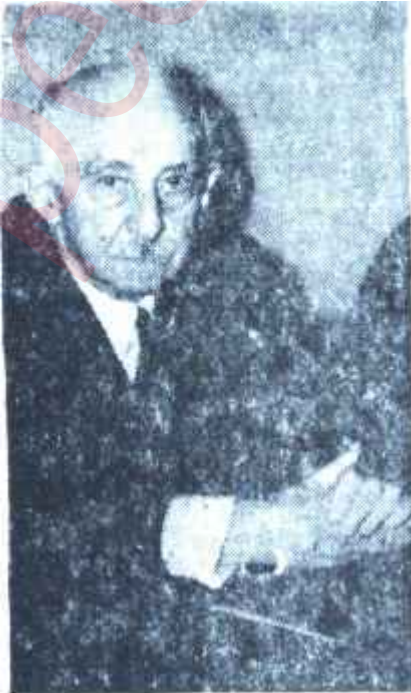
İnönü basın toplantısında Beklenen tok ses

Başbakan, İsfendiyarın en iyi fırsatları kaçırmasına sinirlendiği bir sırada, son günlerin kahramanı Necip Fazıl Kısakürek, İstanbul Toplu Basın Mahkemesi tarafından 12 ay hapse ve 3 bin lira para cezasına mahkûm edildi. Büyükoğru bir ay kapatılacaktı. Mahkûmiyet kararı, 21 Haziran 1956 tarihli Büyükoğru da çıkan "Menderesin Kalesi" yazısıyla ilgiliydi. Dâva Fuat Köprülünün muvafakatiyle açılmıştı. Mahkeme evvelâ Necip Fazılı 14 aya mahkûm etmişti. Fakat Çarşamba günü Temyizin bozma kararına uyan mahkeme cezası 12 aya indirdi. İkinci Ağır Ceza Mahkemesince itihaz olunan tecilli altı aylık bir mahkûmiyeti daha olan Necip Fazılın cezası 18 aya yükselmektedir. Bunun dışında Toplu Basın Mahkemesi Büyükoğrunun sahibinin tevki-fine karar verdi. Polis, onu arama-ya koyuldu.