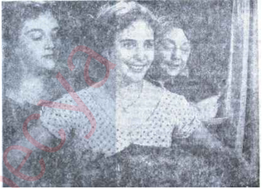
Maria Schell "Gervaise"de

gönül eğlendirmekte. Nitekim bir gün kadıncağızı iki çocuğuyla bırakıp kadınların biriyle kaçırıyor. Gervaise'in önceleri şanslı yaver gidiyor. Bir ayağının topal olmasına ve iki çocuğuna rağmen Coupeau adlı cahil fakat temiz yürekli bir dam işçisiyle evleniyor. Şimdi bütün gayreti, başında kendisinin bulunacağı bir çamaşırhane açmak. Bu emeline tam erişecekken Coupeau'nun damdan düşüp bacağını kırması ve uzun zaman çalışamaz hale gelmesi tembelliğe ve içkiye alışması için bir vesile* oluyor. Çamaşırhane aile dostlarının yardımıyla açılıyor ama, Coupeau'nun içkiye yatırdığı paralar yüzünden ailenin iki yakası bir türlü bir araya gelmiyor. Coupeau'nun çamaşırhanedeki kızlara el şakası