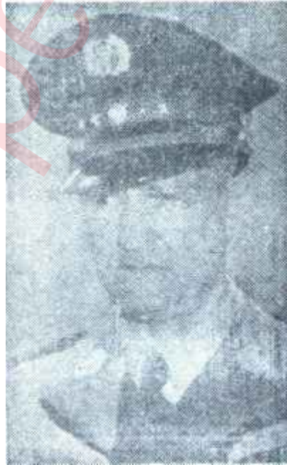
Gustavo Rojas Pinilla

Güney Amerikalıları Washington'a düşman eden şey, şimdiye kadar memleketlerine hâkim olan rejimler karşısında Amerikan hükümetinin takındığı tavır olmuştu.