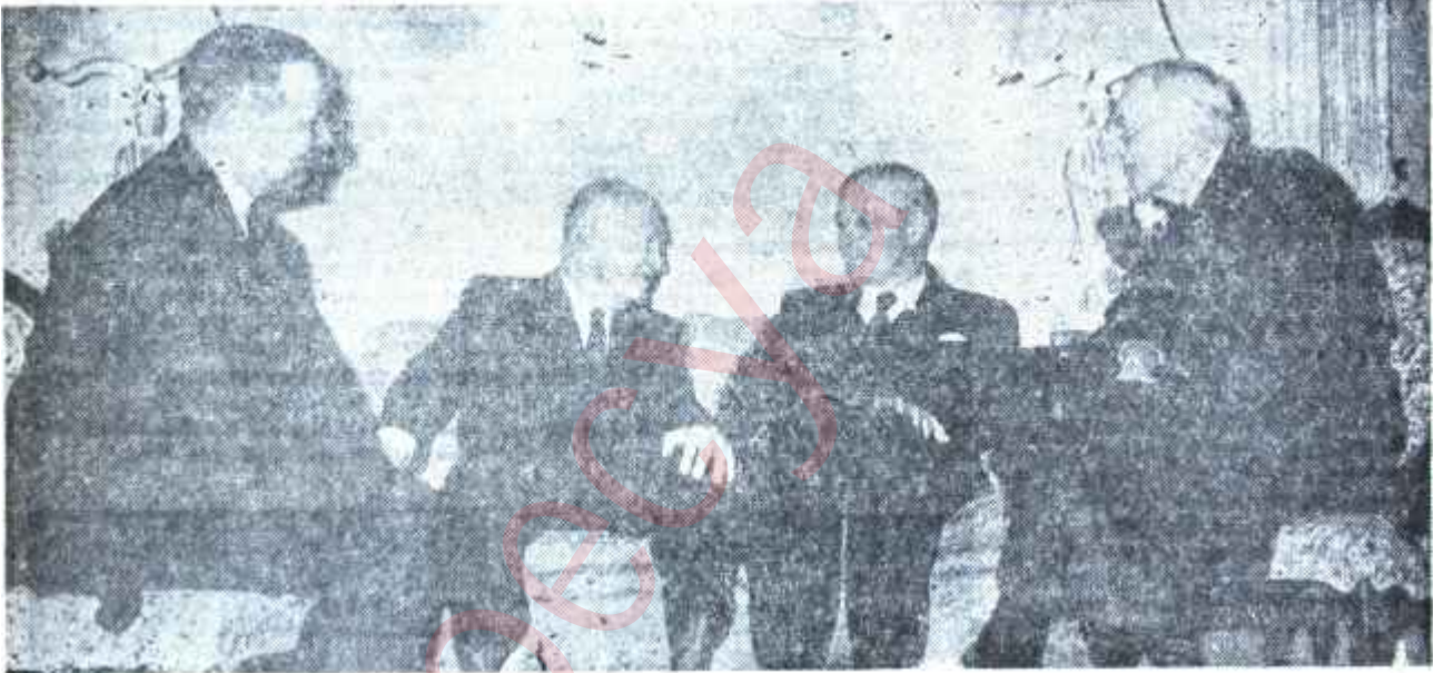
Lloyd - Eisenhower - Macmillan - Dulles

ziyaretini yapmayı da ihmal etmedi. Midesindeki kanseri radyoaktiviteyle tedavi ettiren Dulles. hasta yağından kalkıp toplantılara katılmayı ve Batılılara hazırlanan tuzakları yumuşak kaibli Macmillan'a iyice anlatmayı çok istiyordu ama, doktorlar müsaade etmediler. Mamafih, hastahanedeki "nezaket" görüşmesi tam 57 dakika sürdü. Dulles, iyice hazırlanmadan zirve toplantısı yapmanın Rusların ekmeğine yağ sürmek olduğunu ve Berlin meselesinde gerilemenin vahim neticeler doğuracağını iddia etti. Soğukkanlı Macmillan, eskiden beri duya duya ezberlediği bu sözleri sonuna kadar dinledikten sonra, kendi düşüncelerini sıralamağa başladı. Bir defa, zirve toplantısının Ruslar tarafından propaganda fırsatı olarak