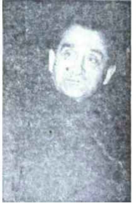
Pierre Mendès - France