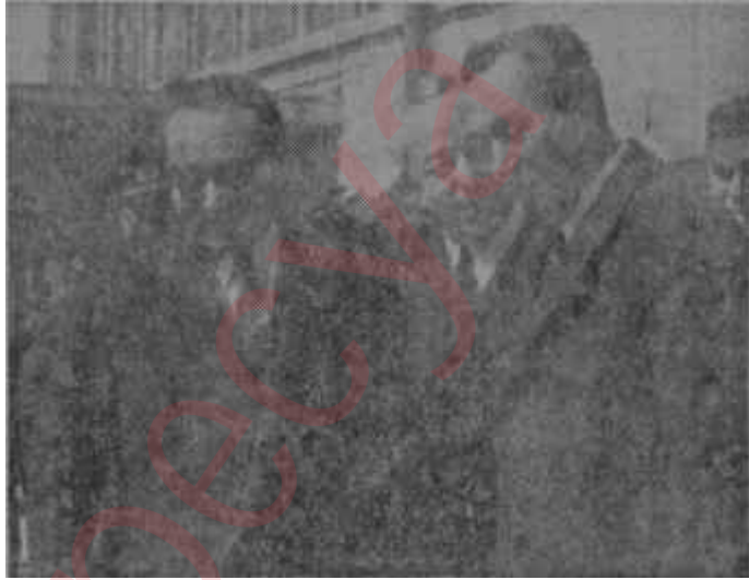
Menderes - Benderlioğlu - Gedik

Aradan seneler geçmiş, yıl 1959 olmuş ve din istismarı yeniden şiddet kazanmıştır. "Yeşil neşriyat" ölçüyü kaçırmış, tekbirler okunmuş cüppeli imamlar ocak açılışlarında bulunmuştur. İktidarın bu mevzuada 1953 teki hassasiyetini göstermesini beklersiniz, değil mi? Fakat bayır! Savcılardan ve hâkimlerden önce fikir beyan etmekte bir mahzur görmeyen İçişleri Bakanına göre bunlar "ara sıra zuhur eden münferit ve hatta bir kısmı kanun nazarında suç dahi sayılamıyacak mahiyetteki bazı taşkın hareket ve beyanlar"dan ibarettir!