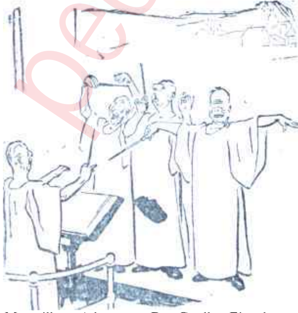
Macmillan - Adenauer - De Gaulle - Eisenhower