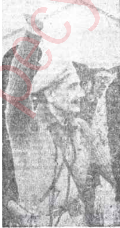
Albay Grivas Pardon, General!..

Türkiyede zihinler Kıbrıstan irtica mevzuuna dönerken bu haftanın başında Yunanistanda Grivas bayramı devam ediyordu. Atınaya gelir gelmez generalliğe terfi ettirilen çeteci Yorgi Grivas, geçen cumartesi Yunan Kralı tarafından kabul edildi ve bu suretle kabul merasimleri de sona ermiş oldu. "Kıbrıs Kahramanı" saraydan çıkarken göğsündeki madalyaların sayısı epeyce artmış bulunuyordu. Kral Paul, çetecinin göğsüne dördüncü Yorgi Nişanının Büyük Haçı ile Kahramanlık Nişanının Altın Haçını takmıştı. Bilhassa bu son madalya pek mühimdi, zira Yunanistanda Altın Haçı taşıyan ancak dört kişi daha vardı ve onlar da İkinci Dünya Harbinde gördükleri hiz-