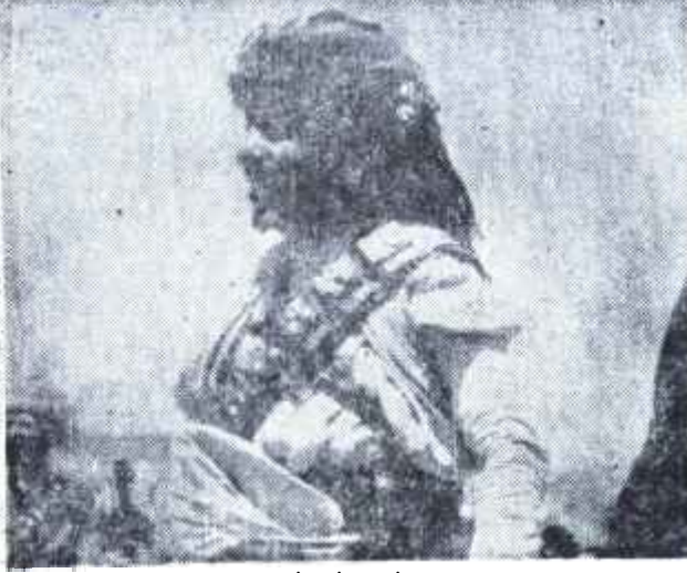
YEMENLİ BİR SİLAHŞOR

devlet için aşiretlere yardım ölçüsünün tahammül edilebilir bir miktarda olabileceğini öğrenmiştim. İmam Yahya, benim beyanatımdan memnun ve müsterih olduğunu ifade etti. İstanbula ihtilâfın hallolunduğunu yazacağımızı söyledim, muvafakat etti. Veda ederek, oturduğum yere gelmek üzere ayrıldım.