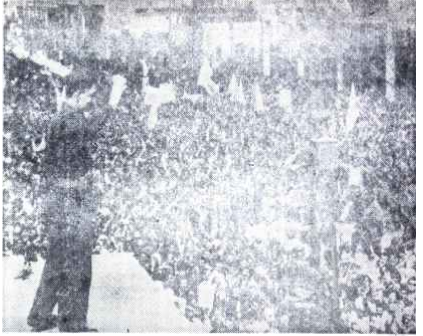
General Kasım Bağdatlıları selâmlıyor

El Ezher külliyesinin başında bulunan Şeyh Mahmud Şaltüt, geçen hafta meşhur El Ahrâm gazetesine verdiği beyanatı: "Kasım, yabancıların peşinden ayrıl, Araplara ve Allaha dön!" sözleriyle bitirdi. Sonra, Kahire gazetelerinde, Kasım'ın halkın gözünde küçük düşürecek, kâfir gösterecek haberler neşredilmeğe başlandı. Güya, Bağdatta Kasımın önünde geçit resmi yapan nümayişçiler ellerindeki Kur'an nüshalarını yırtıp parça parça etmişler, sayfaları ayakları altına almışlardı. Musulda camiler yağma edilmiş, hocalar öldürülmüştü. Bu gibi sayialar, tabii, halkı galeyana getirmekte gecikmedi. Geçen hafta sonunda. Şamda, bizzat Nasırın da bulunduğu bir miting sırasında, başlan sarıklı hocalar kafirler aleyhinde beddualar okudular. şeytan icadı rejimleri devirmek için mücadele edeceklerine yemin edip Kurana el bastılar.