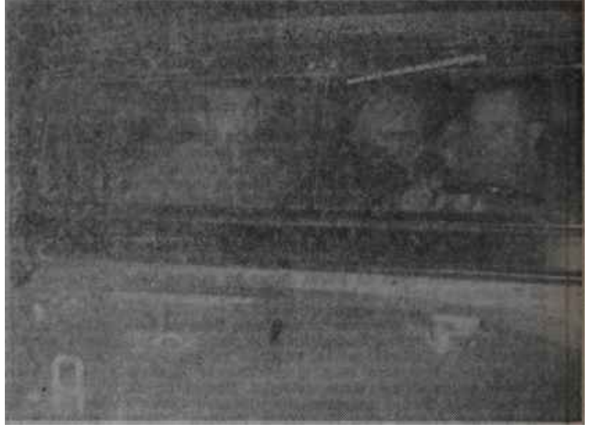
Bahailer Birinci Şubeye götürülüyor Basına kolaylık!..

Bahaullah, işte Babın haber verdiği bu yeni peygamberin kendisi olduğunu iddia eden adamdır. Bab 1851 de öldükten sonra ortaya çıkmış ve 1863 te peygamberliğini ilân etmiştir. İddiasına göre, onun gelişi, o zamana, kadârki bütün peygamberlerin ikinci gelişine tekabül etmektedir ve bu gelişle o, bütün ihsanları birleştirecek bir din meydana getirmektedir. Bahaullahın konuşmaları ve risaleleriyle yaymağa çalış-