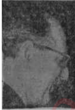
F. Rüştü Zorlu