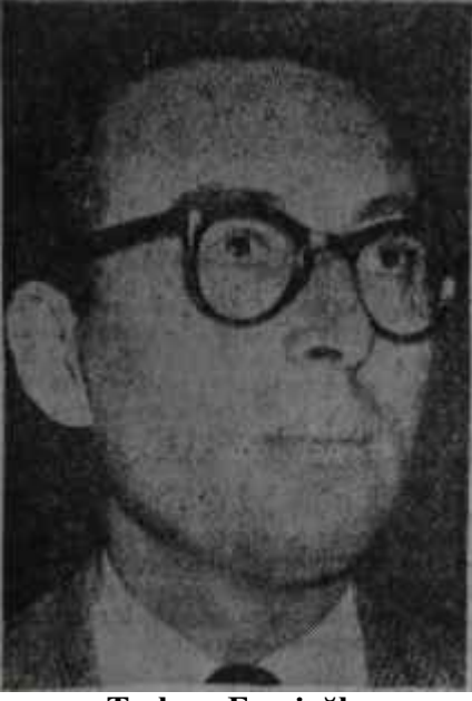
Turhan Feyzioğlu Yardımcıya ihtiyacı yok

yı bastı. Zira beş yıl sonraki Zaferde aynı vaadin tekrarlandığını hatırlamıştı. Hakikaten 1953 yılının ilk günü çıkan Zaferde, manşette "İlk tedrisat dâvası sür'atle hallediliyor. Millî Eğitim Bakanlığı memleketimizde yıllar boyunca ihmal edilen mecburî ilk tedrisat mevzuunu iktisadî kalkınma hamilelerine muvazi olarak sür'atle halletmek maksadıyla Harekete geçmiş ve üç yıllık bir ilk tedrisat plânı hazırlamıştı. 1,5 yıllık mesainin neticesi olan plânın 1953-1954 yılından itibaren tatbikine başlanacaktır" haberi veriliyordu. Tam beş yıl sonra 31 Ekim 1958 tarihinde Zafer, tekrar aynı mevzuu ele almakta ve "İlk öğretim kanun lâiyhasının hazırlandığı, B. M. M. nin önümüzdeki içtimainaya yetiştirileceğini" müjdelemektedir. İhtimal Zafer 6 yaşına basan bu haberi önümüzdeki yıllarda da verecektir. Ama bundan dolayı iktidar organını kınamak lisanıdır. Zafer, nihayet yukarıdan gelen bir haberi sütunlarına geçirmektedir. Menderes hükümetlerinin gelmiş geçmiş Millî Eğitim Bakanlarının yıllardır aynı sözleri tekrarladığı düşünülürse, Zaferin beraatine tereddütsüz hükmetmek lâzımdır.