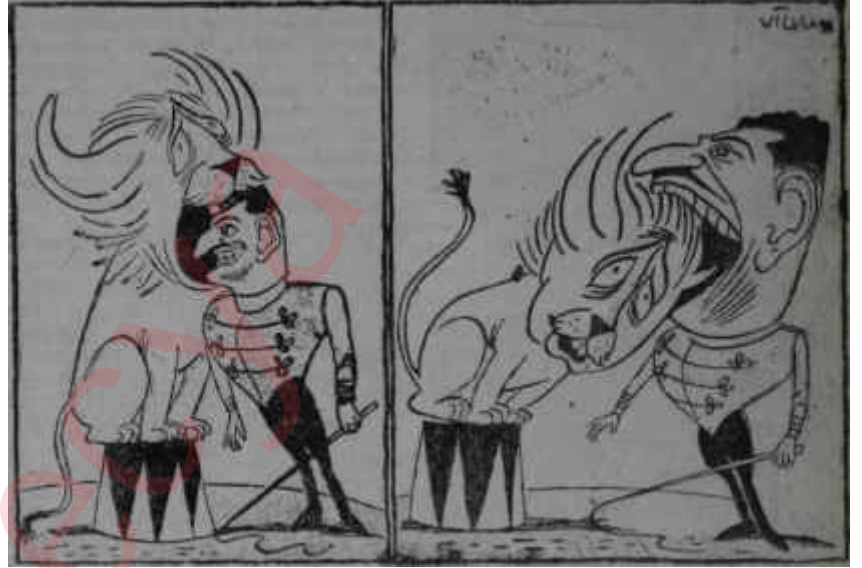
Vicky'nin çizgileriyle MacMillan ve Nâsır

Herşey tamamlandıktan ve hafta sonunda da imza merasimi yapıldıktan sonra, anlaşmanın metni