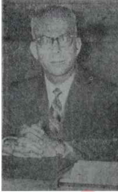
Sebati Ataman Nurlu rüyalar

İkinci taksidin Ocak içinde tediyesi lâzımdı. Fakat Batı Almanya Meclisi Bütçe Encümeni, harb içinde müsadere edilen Alman mallarını Türkiyenin hâlâ iade etmemesini ve Federal Hükümetin yardımıyla alınan malları Türkiye Alman