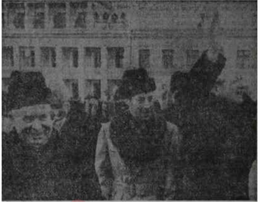
MacMillan Moskova'da Krutçef ile Turizm!

Bağdat Paktı dolayısıyla, İnanla Amerika arasında askerî andlaşma imzalanacağı haberleri üzerine, Ruslar tekrar bu maddelerden bahsetmeğe başlamışlardı. Amerika İran topraklarında füze rampaları ve üsler kurduğu takdirde, Rusya için askerî mücadeleyi icabettirecek hukukî vaziyet ortaya çıkmış olacaktı. İran son hareketiyle, şimdiye kadar ki dedikoduları da dolambaçlı bir şekilde teyit etmiş, olmaktadır. Amerikayla imzalanacak ittifak andlaşması demek ki sadece "tedafüi" hükümler ihtiva etmemekte Rusları kuşkuya düşürebilecek bir takım füze ve iç mevzularını da içine almaktadır. Herhalde, Rusların bir gibi tertiplerden şüphelenip İrana yürümleri ihtimâlini ortadan kaldırmak arzusu, Tahranlı devlet adamlarını böyle bir karar almağa sevk etmiştir. Fakat -Sovyetler bakımından 1921 anlaşması hâlâ yürürlükte olsun olmasın- Moskova'yı tahrik edecek bir adım atılmıştır ve Şahin tahiti uğruna dünya tekrar heyecanlı günler geçirmek zorunda bırakılmıştır.