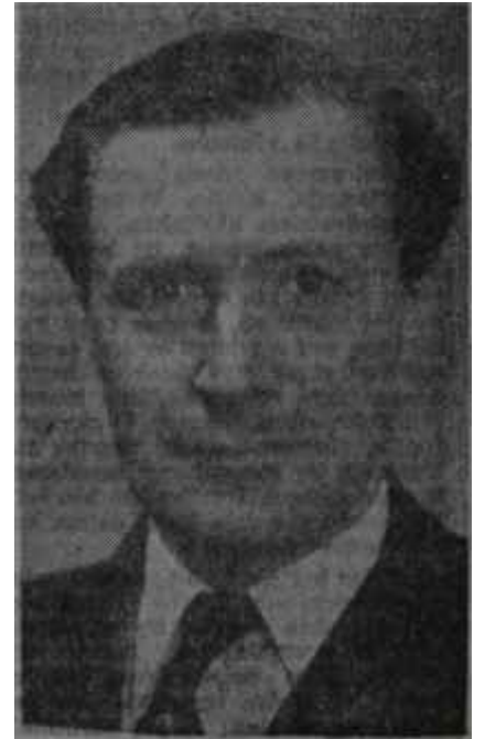
Duncan Sandys "Al kızları askere..."

Soğuk harbi soğukkanlı usullerle devam ettirmek taraftarı olan İngiliz halkı, böylece bu tutumunun mükâfatına yavaş yavaş kavuşmaktadır.