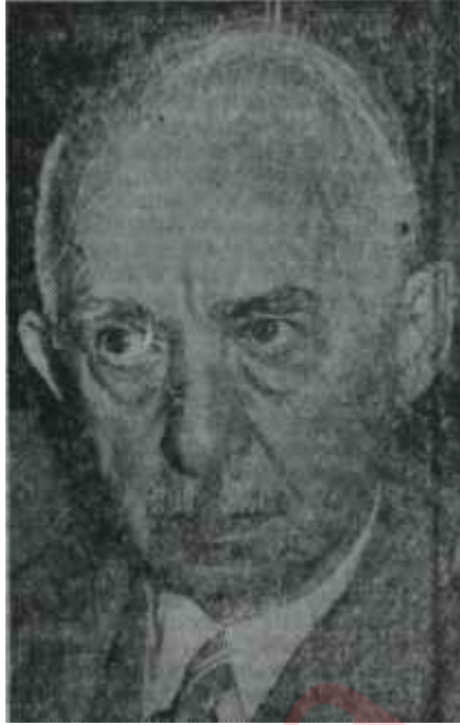
İsmet İnönü Bir vatanperver

ra bir değışiklik bekleyenleri haklı çıkaracak bir işaret ise, henüz mevcut değildi. Bilâkis. Ankaraya geldiği günün akşamında Mecliste yaptığı konuşmada, Muhalefetin Londra anlaşması hakkındaki reyleriyle vatanseverlik derecelerinin delilini ortaya koyacaklarını söylerken kürsüde her zamankinden farksız bir Adnan beyin bulunduğu kimsenin gözünden kaçmadı. Gerçi "tarihte geçirdiği kazadan sonra kendini ilme vererek ölmezler arasına geçen bir Pascal misali vardı; ama meselâ meşhur bombalı suikastten sonra da zerre kadar değışmeyen Flitlerden veya Tevfik Fikrete "Bir lâhzai teahhür"ü ilham eden hâdiseden sonra da yolundan dönmeyen Abdülhamit II. den bahseden gene tarihti.