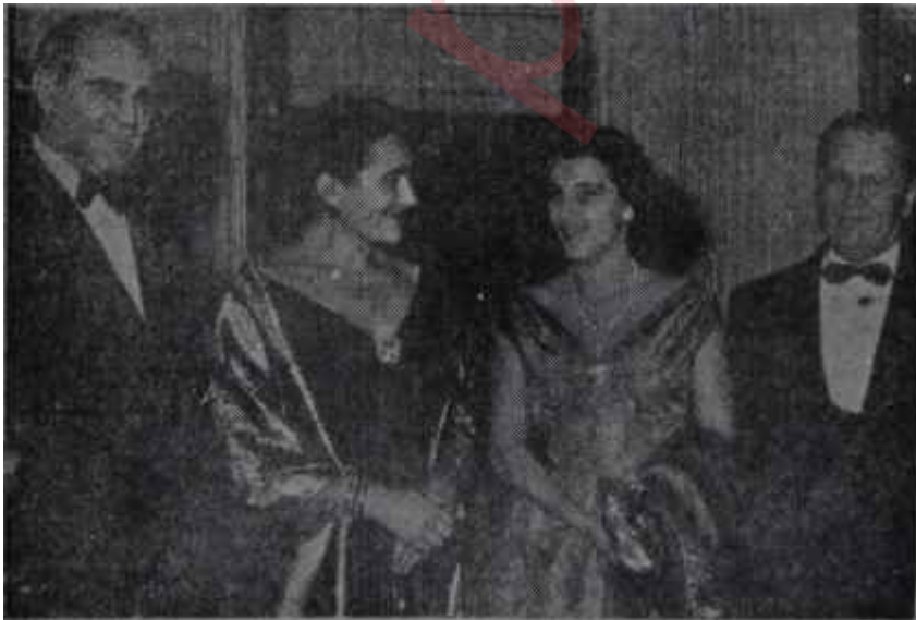
Karamanlisler ile Tito'lar Hayal için vahit erken

İngiliz Hazine Bakanlığının İktisadî İşler Müsteşarı ile Mısır İktisat Bakanının geçen hafta sonunda Kahire hava meydanındaki dostça el sıkışmalarını seyredenler, gayriihtiyari, iki buçuk yıl önceki hâdiseleri hatırladılar. Süveyşin devletleştirilmesinden ve bilhassa İskenderiye harekâtından beri Mısırlıların İngilizlere karşı duydukları nefreti artırdı bazı mali pürüzler de vardı. Bir defa İngiltere, kendi bankalarında, bulunan Mısra ait 280 milyon dolarlık