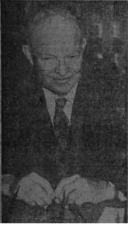
Eisenhower masa başında Dullara mektup yazıyor