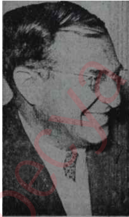
Kasım Gülek Arife tarif gerekmez

Ekspozenin ikinci kısmını "gezdiğim ve gezmek istediğim memleketler" teşkil ediyordu. C. H. P. sözcüsü, 80 günlük dünya turuna çıkmış gibi -tâbir. Fatin Rüştü Zorlunundur- ismini bildiği bütün memleketleri, başlarına bazı sıfatlar da ekliyerek saydı. Gana, Gine, Nijerya ve Kongo'dan "bizden ders alacak memleketler" diye bahsetti. Japonyaya "ders alabileceğimiz bir memleket" sıfatı verilmişti. Sözcü, Japonyada bulunduğu sırada harf inkılabı mevzuunda konferanslar verdiğini hatırlatmayı da unutmadı. "Çok yakından tanıdığım" Kore,