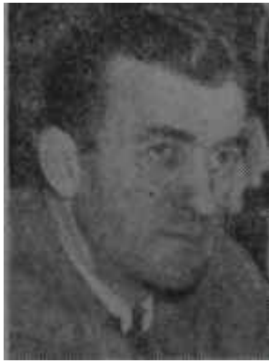
Fatin Fuat Tözer