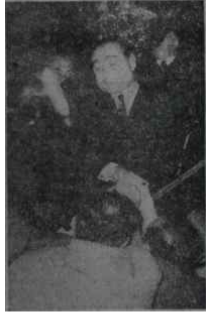
Menderes uçaktan iniyor Göz şarptan an

Her halde böyle mevzularda dikkatli olmak herkes için, her bakımdan sadece faydalıdır.