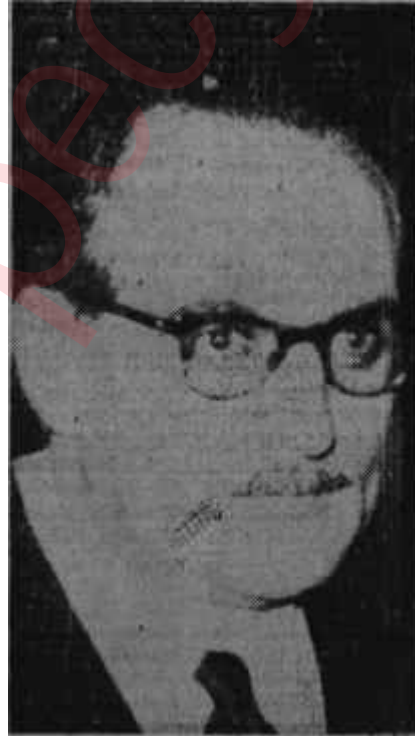
Fatin Rüştü Zorlu Zafer peşinde

Nüvit Yetkinin söz almak için çırpınması, kürsüye doğru ilerlemesi fayda vermedi. Kıbrıs anlaşmasını