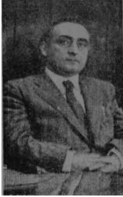
Yardan mı, serden mi?