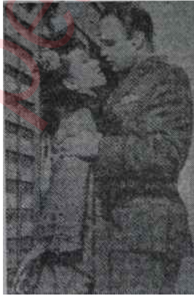
Marlon Brando "Sayonara"da

Bir Japon revüsünden çok Amerikan revüsünü andıran Matsubayashi için Japon kızları seçilmesine itina edildiği halde, Japon kültürünün en ehemmiyetli unsurlarından biri olan Kabuki tiyatrosunun başyıldızı olarak Güney Amerikalı Ricardo Montalban'ın seçilişi ayrı bir tuhaftır. Bunun tek izah tarza, uzun