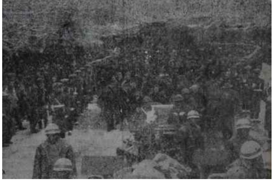
Ankaradaki hazin merasimden bir görünüş

Bakanın sözlerini hayretle dinleyen C.H.P. lilerden çoğu, onun samimiyetine olan itimatlarını kaybeder gibi oldular, Banları da "Canım, adam istiyor ama, yapamıyor işte" dediler. Ama Bakanlık birşeyler is-