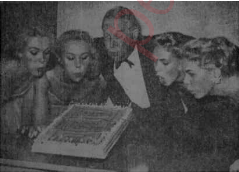
Maurice Chevalier dört dilber arasında

"— Bu fikrinizi sakın her yerde açıklamayın" diye rica etti. Ciddi bahisleri şakalar takip etti. Tel sokağındaki lokalden geç vakit çıkarlar