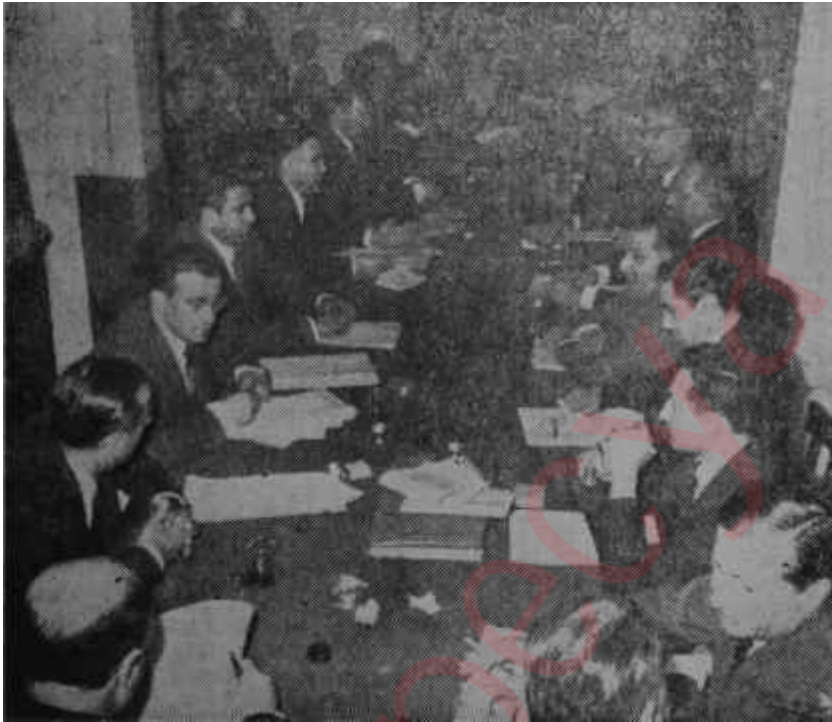
Yeni seçilen C. H. P. Meclisi toplantı halinde