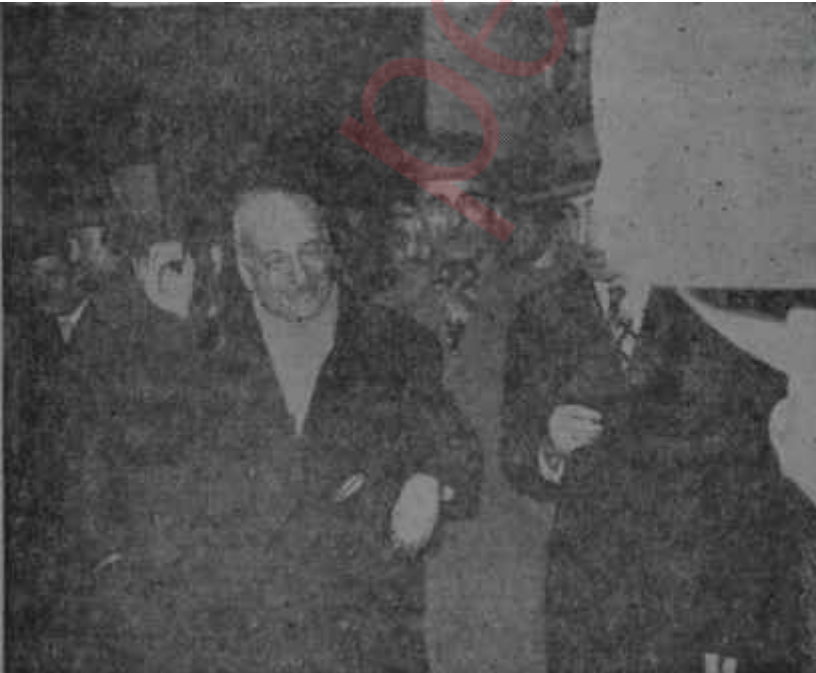
Faik Ahmet Barutçu Ankarada karşılanıyor.