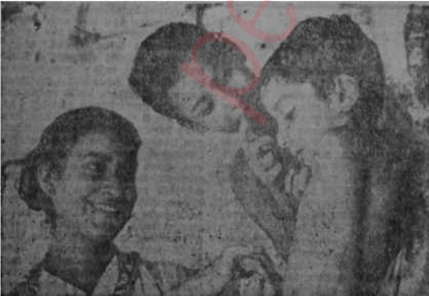
"Pater Pançali" den bir sahne