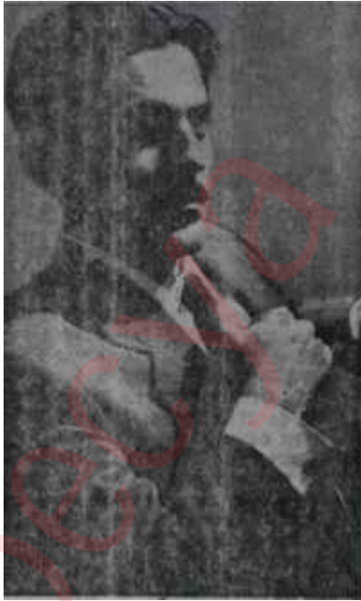
Ümit Yaşar Oğuzcan

G ünümüzün en velût şairlerinden biri olan Ümit Yaşar Oğuzcan, hemen hemen bir kitaplığı dolduracak kadar çok olan şiir kitaplarının arasına bir yenisini daha kattı: Beni Unutma. Ancak Beni Unutmanın şairin diğer kitaplarından bir farkı var. Ümit Yaşar şimdiye kadar her mevsim bir yeni şiir kitabı hazırlar ve onu neşrederdi, bu sefer yayınlanan kitabı ise bu kaideyi bozuyor. Şair şimdiye kadar yayınlamış olduğu şiir kitaplarından yedisinden -evet