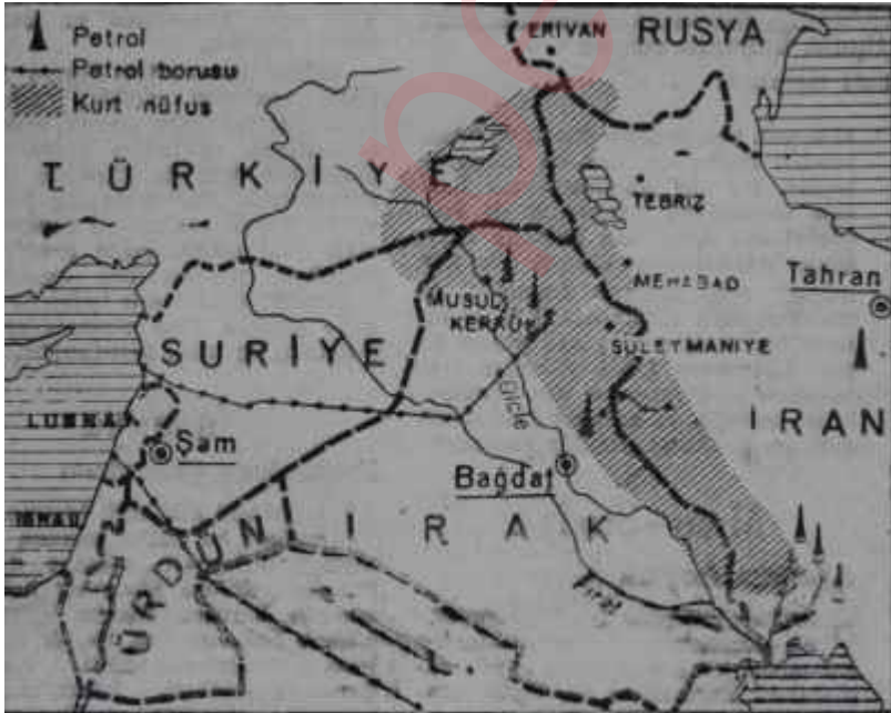
Barzanînin rüyasını gördüğü Kürdistan!

Bir zamanlar müstâkil Kürt Devletinde cumhurbaşkanlığı etmiş olan adam, şimdilik aynı hareketi tekrarlamak niyetinde değildir. Bugünlerde bütün gayretlerini, İraktaki