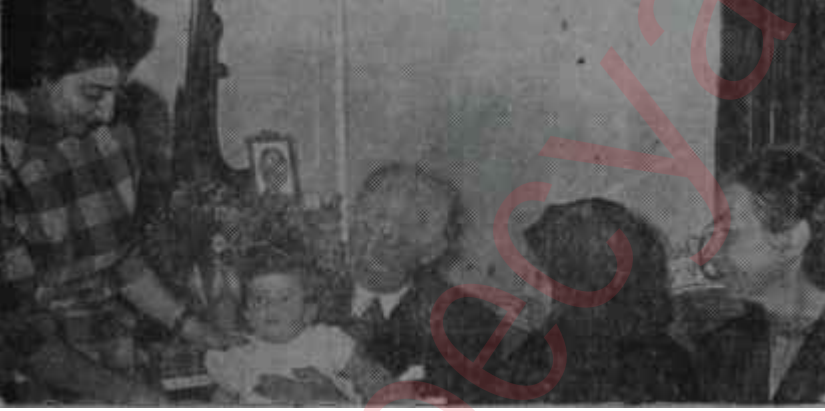
İnönü, annesi, eşi, kızı ve torunuyla bir arada