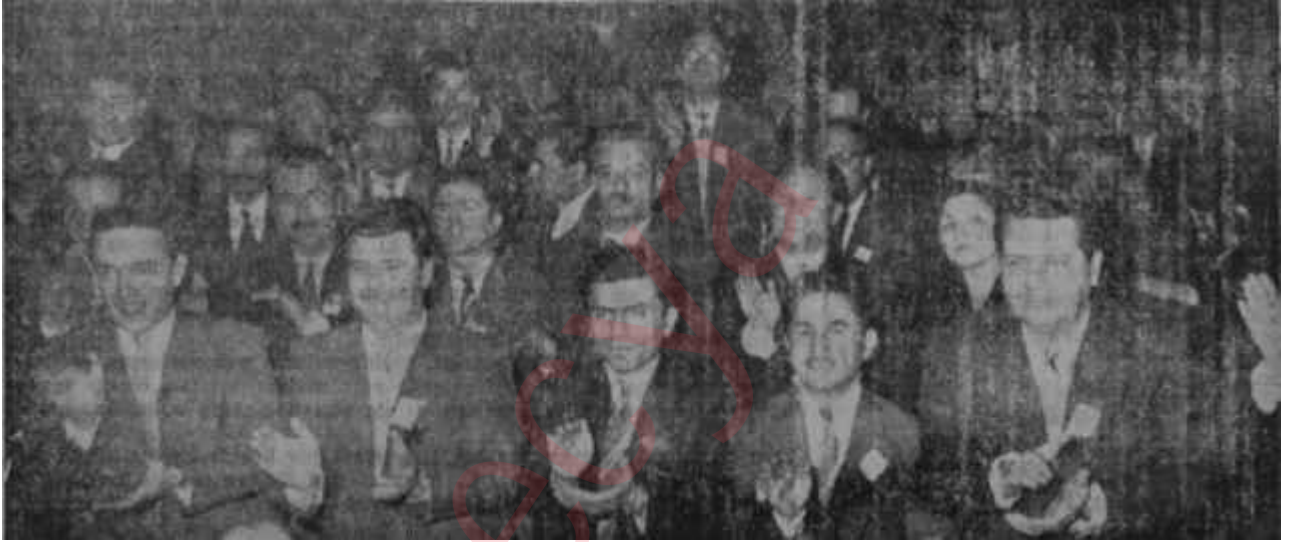
Alemdar Sinemasında toplanan XIV üncü C. H. P. Kurultayı delegeleri

Tüzük ve Genel Sekreter meselesi, C. H. P. içinde ikilik yaratan eski bir dertti. Mutlaka halli lazımdı. Hele son günlerde mesele o kadar çatalaşmış ve parti içinde o derece huzursuzluk yaratmıştı ki Genel Başkan İnönü, ister istemez bu işin hallini üzerine almıştı. Nitekim Salıy Çarşambaya bağlayan gece, C. H. P. Genel Merkezinin birinci katında birbirine geçme iki odadan ibaret salonda toplanan Kurultay Tüzük Komisyonu üyelerinin etrafında oturdukları üzeri yeşil çuhalı masanın başında İnönü bulunuyordu. Ko-