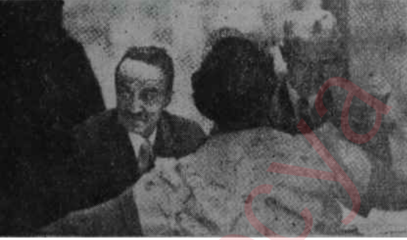
Mikoyan dostu Mençikofla kahvaltı ediyor

Ancak, bu tavır Barzaninin niyetlerini tamamen değiştirdiği mânasına alınmamalıdır. Kürtlerin lideri Irakta, Suriyede, Türkiyede ve İranda yerleşmiş bulunan Kürtlerin dört buçuk, hattâ beş milyonluk bir kütle teşkil ettiklerini unutmamakta, bir gün onları birleştirerek büyük bir Kürt Devleti kurmak hayalini aklından çıkarmamaktadır. Son yıllarda meşhur İngiliz gazetesi News Chronicle'a verdiği beyanatın şu kısmı hakikaten manidardır: "Kürt kütlesini birbirinden ayıran sınırlar tamamen sunidir; Kürdistan bölünmez bir bütündür ve gün gelecek, o suni sınırlar teker teker parçalanacaktır".