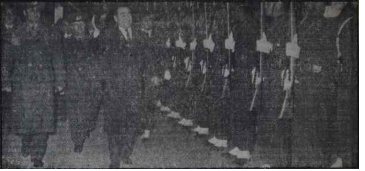
Adnan Menderes ihtiram Kitasını teftiş ediyor İşte, NATO'nun hakikî arslanı

kurulması için dekoratör veya nikâh memuru beklemeye tahammülü yoktu. Mühim olan hareketti, ruhtu. De kor pek âlâ sonradan da gelebilirdi.