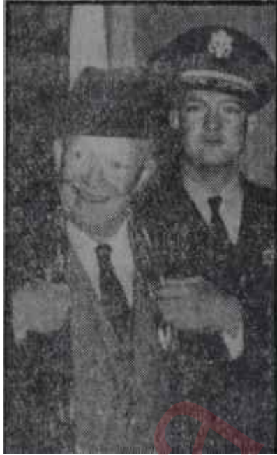
Ike NATO Toplantısına gelirken Umdüğüm bulamadı

NATO'nun en yüksek kademede yaptığı toplantının başlıca konularından birini askerî meseleler teşkil etmişti. Rusyanın kıt'alararası balistik füzesini başarı ile tecrübe etmesinden sonra hür dünya ile Sovyet bloku arasında açılan mesafeyi kapatmak için Amerika, NATO devletlerinin topraklarında orta menzilli füze üsleri kurmaktan başka çare göremiyordu. Halbuki İngiltere, Türkiye ve Hollanda hariç, diğer NATO üyeleri toplantı sırasında topraklarına orta menzilli füze üslerinin kurulması hususunda hiç de istekli görünmemişlerdi. Hatta ötedenberi Avrupalı Rusya karşısında en müfrit davranışlı devlet adamı olmakla