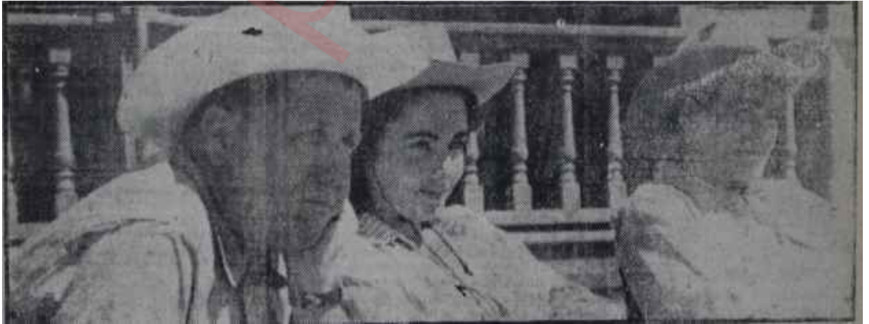
George Stevens, E. Taylor ve R. Hudson'la Bir büyük rejisör

"Dev" ile Stevens'in Amerikan cemiyetinin kuruluşundan bu yana gelişmesini gösteren eseri tamamlanmış olmaktadır. Bilindiği gibi "Shane - Vadiler Aslanı", batı eyaletlerine ilk göçleri, toprağa yerleşmeyi; "A Place in the Sun - İnsanlık Suçu", modern Amerikan cemiyetinin meselelerini ortaya koyuyordu. "Giant - Dev" ise, bu iki devreyi birbirine bağlayan gelişme devresini göstererek, Stevens'in eserini bütünüyor..