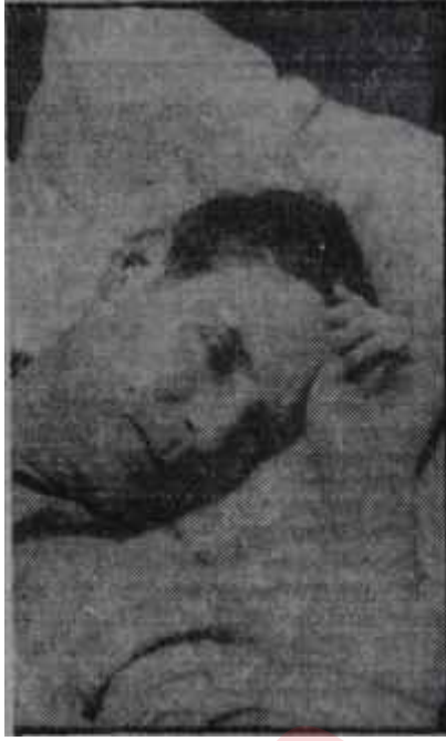
Migrenli bir hasta Yarımı bütününden beter

Bu hastalarda daima sinir sisteminde düzensizlik, distoni vagosenpatik, birçoklarında muhtelif hormon bozuklukları, kadın ise aybaşlarında intizamsızlıklar görülür. Bazıları da allerjik yapıldırlar. Kendilerinde çeşitli allerjik hastalıklar, asma, ürtiker, ot, nezlesi, gibi araz teşbit edilir. Migrende irsiyetin rolünden de söz açanlar vardır. Elektroensefalografi ile ve ailevi anamnezin tetkikiyle sar'a ortaya çıkarılabilir. Bütün bunlar bir tarafa bırakılırsa, migrenli hastalarda beyin damarlarında aşırı bir reaksiyon kabiliyeti bulunduğu ve muhtelif faktörlerin tesiri altında bazen damar büzüşmesi, bazan da damar genişle-