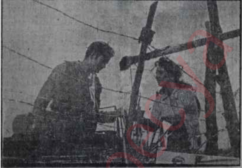
"Devlerin Aşkı"ndan bir sahne

Öte yandan Jett Rink, önüne geçilmez, tehlikeli bir kudret olmuştur. Stevens, onun körkütük sarhoş hâlde otomobiliyle bir başka otomobile çarpışını, bununla kalmayıp sahibini de dövdüğünü gösterdikten sonra hemen arkasından gelen bölümde, bir gazette Jett Rink'in hastahane yaptırdığı haberine geçerek madalyonun iki yüzünü birden ortaya koyuyor. Jett, parasıyla etrafına senatörleri, valileri de toplamayı, onları nüfuz ve tesir sahasına almayı başarıyor. Sanayileşme, şahsî teşebbüs aşın ferdi-