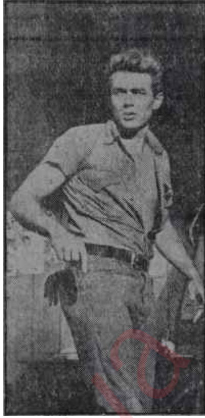
J. Dean "Devlerin Aşkı"nda En son oyunu en iyi oyunu değildi

Stevens, ırk düşmanlığının çürük temellerini de teşhir etmekten geri kalmamaktadır. Benedict, çiftliklerinde çalışan Meksikalıların bakımsız ve sefil hayatlarına çeki düzen vermek için doktor bulmaya çalışan karısını boşamakla tehdit ediyor. Fakat o Meksikalıların çocukları, Benedict'in topraklarını korumak için İkinci Dünya Savaşında can veriyorlar. Cenaze merasiminde Meksikalı küçük çocuklar Amerikan milli marşını söylüyorlar. Üstelik herşeye rağmen Benedict'in torunu da bir Meksikalı oluyor. Bu belki her ırk düşmanı Amerikalının başına gelebilir. Nitekim film, Benedict'in biri Anglo-sakson sarışın, öbürü Meksikalı esmer iki torununun, Stevens'e mahsus o nefis zincirleme geçmeyle birbirine bağlanan görüntüleriyle bitiyor. Böylece iki ırkın birlikte yaşaması ve birbirine karışmasının kaçınılmaz bir başka gerçek olduğu kuvvetle duyuluyor.