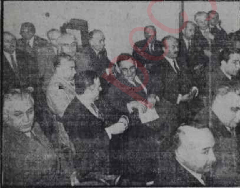
C. H. P. İl Başkanları toplantı halinde

İl başkanları cumartesi gecesi Parti ileri gelenleriyle birlikte Klüp Ambasadörde yemek yediler. İnönü de yemekte hazır bulunuyordu. Hususî sohbetler resmî görüşmeleri takip etti. Teşkilât Merkezden memnun değildi. Memnuniyetsizlik İsmet İnönüye kadar çıkmıyordu ama, o nun hemen altından başlıyordu. Niçin hareketsiz kalınıyordu? Seçmenin ekseriyeti reyini Muhalefete' vermemiş miydi ve Muhalefetin 1 numaralı temsilcisi C. H. P. değil miydi? Milletlin pinekleyen bir Muhalefet mi istediği sanılıyordu? Evet, Muhalefet vazifesi hâlâ kolay değildi. 1957 zaferine rağmen -zira C. H. P. liler son seçimleri bir zafer telâkki ediyorlardı. orada burada tazyikler oluyordu. Fakat bunları 1954 tazyikiyle mukayese etmek dahi müminin değildi. Bu sefer bir Server Somuncu-oğlu veya bir Nihad Erim çıkması son derece zordu. Ama Teşkilât gibi. Merkezin de kendisini toplaması lâzımdı. Bir çiçekle bahar olmuyordu. Ankaradakilerin bilmesi lâzımdı ki yurdun dört bir tarafındaki C. fi. P. lilerin bir Araştırma Merkezinin