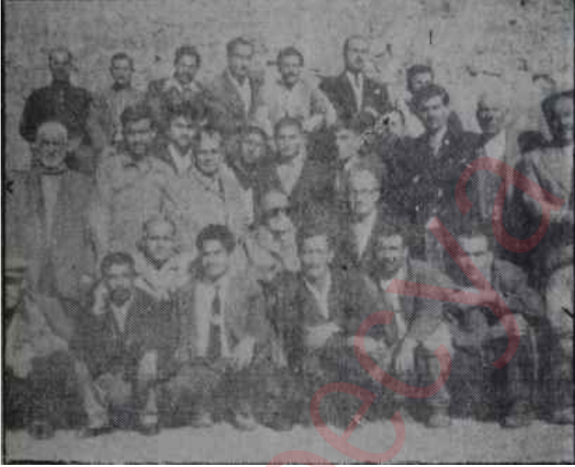
"Gaziantep sanıkları" Yozgat hapishanesinde Ah şu geride kalanlar olmasa!

Hapishanedeki günleri büyük bir yeknesaklık içinde geçiyordu. Altık buradaki havaya alışmışlardı. Kâh top oynuyorlar, kâh mahkûmlarla