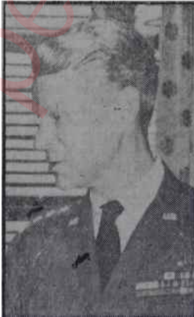
General Norstad İki cami arasında,..

tanınan Adenauer bile, böyle bir talebi kabul etmeden önce uzun müddet düşünmek gerektiğini ileri sürüyordu. Danimarka ve Norveç Başbakanları da Amerikan talebinin şiddetle aleyhindeydiler. O kadar ki, onbeş devletin Dışişleri Bakanları Konseye sunulacak nihai teliği tesbit