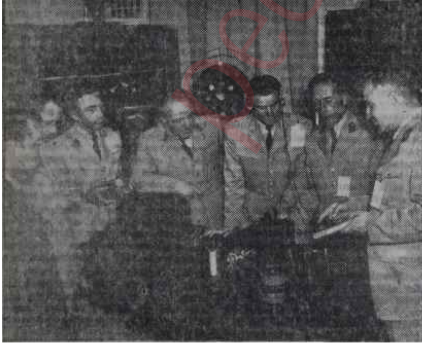
A.B.C. eğitimi gören subaylarımız Herşeyin başı; fitrî ve irsî kabiliyet

Klasik silâhlar dışındaki savaş teknik ve taktik eğitimi için ordumuzdaki gayret ve faaliyetler, bilhassa NATO'ya girişimizden bu yana hızlanmıştı. Bir kaç yıl önce, Genelkurmay Başkanlığına bağlı olarak, A.B.C. "Atom, Biyoloji ve Kimya Dairesi" kurulmuştu. Bu alandaki çalışmalara, böylece daha derli toplu bir istikamet veriliyordu. Atom, Biyoloji ve Kimya harp silâh ve vasıtalarına karşı savunmada, teknik ve taktik eğitiminin sağlanması hususu, silâhlı kuvvetlerimiz kadar hal-kımız için de büyük bir ihtiyaç olarak görülmekteydi. Bu düşünceyle Ankaranın banliyösü Mamakta bir öğretim müessesesi açılmıştı. Bidayette bu müessesenin adı, "Özel Silâhlar Okulu" idi. Görülen lüzum üzerine, "Nükleer Silâhlar Okulu" ve "Kimya Okulu" adlarıyla iki müesseseye ayrılmıştı. Birinci okul münhasıran Ordu personelinin, diğeri ise daha ziyade sivil personelin eğitimiyle uğ-