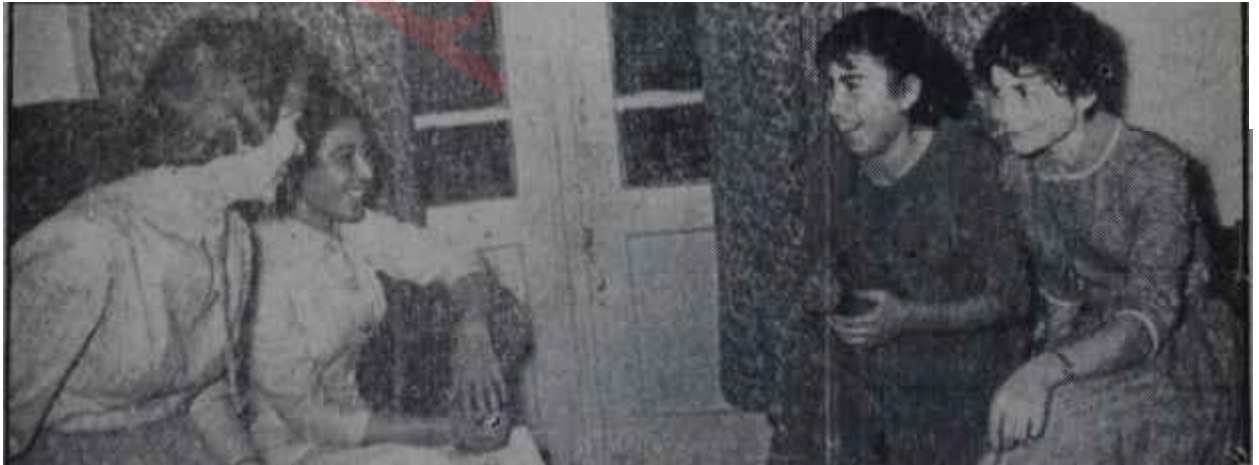
Soroptimistlerin yeni açtıkları "ev" in ilk sahipleri Üç nal ve bir at!..

İşte üç nal elde edilmişti. Şimdi iş ata kalmıştı. At bahçe içinde şirin bir evdi. Ankara Soroptimistleri böyle bir eve sahip olup yurdu oraya nakletmeyi hayal ediyorlardı. Ama doğrusu, bu klüp üyeleri hayalleri hakikat yapmasını biliyorlardı.. Kısa bir zaman sonra bu hayallerini de hakikat haline getireceklerdi.