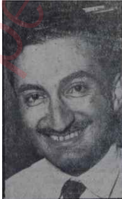
Bülent Ecevit Zarf ve mazruf