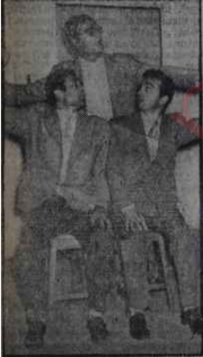
"İkili Sistem"den bir sahne Sistem iki ama, Üniversiteler üç

Aradan günler geçti. Federasyon festival hazırlıklarını tamamladı. Festivalin başlamasına az bir zaman kalmıştı. Bu sırada Yale'den üçüncü bir mektup çıkageldi. Bu mektupta Yalenin Türkiye'deki amatör tiyatro çalışmalarını büyük ilgiyle karşıladığı söyleniyordu; gerçekten de memleketimiz gençliğinin bu sahadaki çalışmaları bütün memleketlerde olduğu gibi Amerikada da müsbet etkiler uyandırmıştı, Çünkü Gençlik Tiyatrosunun Erlangendaki iki festivalde oynadığı "Yarın Çok Geç Olacaktır" ve "Boş Beşik" Ankara Üniversiteler Tiyatrosunun Saarbrücken Festivalinde oynadığı "İkili Sistem" ile Teknik Üniversite Tiyatrosunun Birinci İstanbul Festivalinde oynadığı "Ayyar Hamza" bu festi-