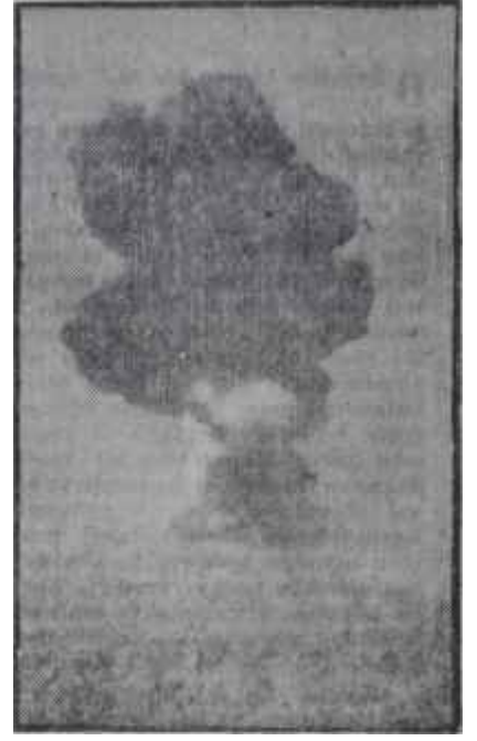
Atom taklidinin infilâkı ' Taklidi böyle olursa

stoku yapmak, diğeri ise; Başkomutanlığın emrine orta menzilli balistik füzeler vermektir. Doğrusu, tedbirler ve Rusların anlayacağı bir şekilde alınmıştı. Her şey güzeldi, ama, bu işin tatbikatı nasıl olacaktı? Tebliğ'in bununla ilgili kısmı, hiç de ümit verici sayılamazdı. Atom ve hidrojen mermi çekirdekleri stoklarının ve balistik füzelerin yerleştirilecekleri mahaller ve bunların hangi şartlar içinde kullanılacakları, doğrudan doğruya ilgili devletlerle varılacak anlaşmalar sayesinde tâyin edilecektir deniliyordu. Çok güzeldi ama, askerî makamların kurulmasında zaruret gördükleri üslerle doğrudan doğruya ilgili devletler ya buna razı olmazlarsa? Nitekim, uzun zamandan beri falso lu sesler çıkmaktaydı. Meselâ, Skandinav memleketleri ve Yunanistan, sınırları içinde füze üslerinin kurulmasına razı olmadıklarını her vesileyle ifade etmekten çekinmiyorlardı. Şimdi, bir de atom ve hidrojen çekirdeklerinin stokları meselesi ortaya çıkmıştı. Bilhassa, adı geçen memleketlerin buna kolayca razı olacaklarını beklemek biraz safdillik olurdu. Bu şartlar karşısında; askerî gücün müessiriyetini arttırmak tedbiri, henüz işin başlangıcında ek-sik ve sakat doğuyor demek, hakikatin tam ifadesiydi. Buna mukabil, bilhassa Türkiye güdümlü mermilerle teçhiz edilmesini ötedenberi talep ediyordu..Nihayet, konferansta "Nike" ve "Honest John" güdümlü mermilerinin verilmesine rıza gösterdiği resmen ifade olunmuştu. O halde,