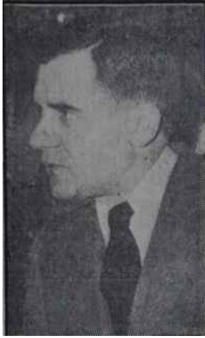
Andrei Gromyko Yeni komisyona havale

Geçen hafta içinde Rusların yeniden sertleşmeye başlayan hareketlerine Batılılardan gelen tek cevap, Başkan Eisenhower'ın yaptığı bir televizyon konuşması olmuştu. Bu konuşma sert olmaktan uzaktı ve hatta denilebilir ki, Rus idarecilerini daha da cüretlendirecek kadar yumuşak bir dille yapılmıştı. Başkan Eisenhower, hür dünyanın askeri gücünün komünistlerinkinden daha fazla olduğunu söylemekle beraber eğer Batılılar arasında bilgi teatisi yapılmazsa Amerikanın önümüzdeki yıllarda ilim alanında çok geri