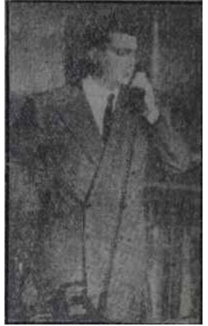
Ömrü uzun olsun

Geçen haftama içinde Fransadan gelen haberler, Coty'nin, aradığı a- damı nihayet -bulduğunu gösteriyor- du. Bu adam, Bourges-Maunoury