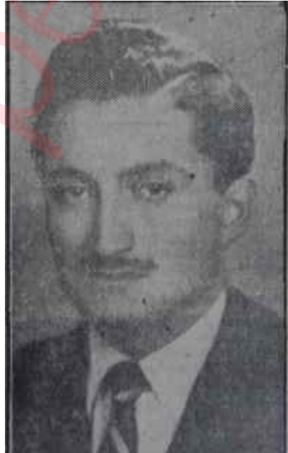
Bülent Ecevit Gençliğin ateşi

Üç genç partili Rüzgârlı sokaktaki binaya bir araştırma merkezi kurmak için gelmişlerdi. Partinin ileri