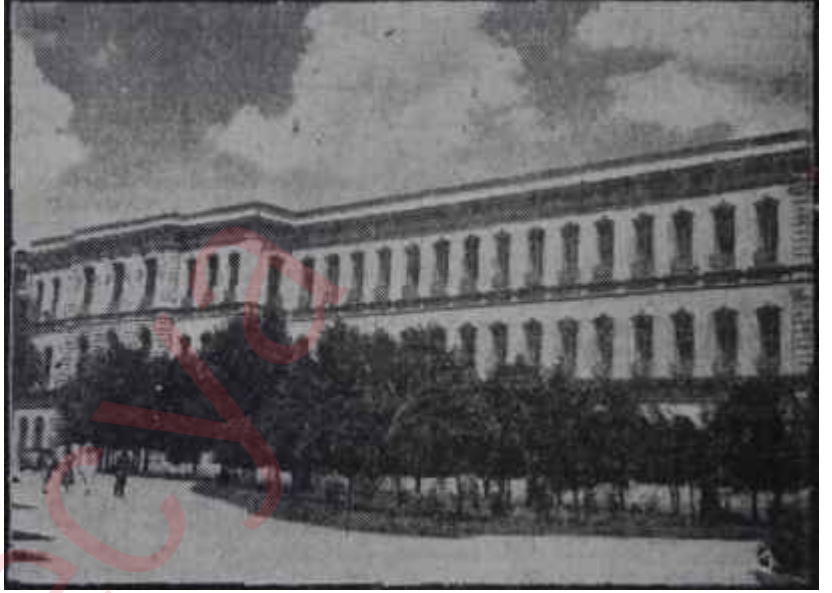
İstanbul Üniversitesinden bir görünüş