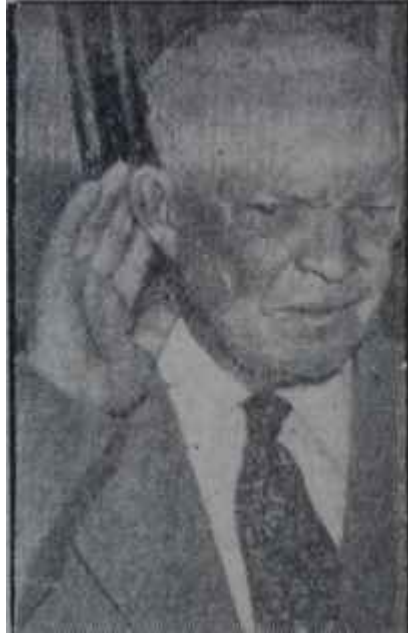
Başkan Eisenhower Sesiniz iyi gelmiyor

Amerikanın en yüksek kademeli idarecisinin söylediğine göre, Sovyetlerin son zamanlarda güdümlü mermi ve feza yolculuğu alanında elde ettikleri başarı Birleşik Amerikanın Sovyetler Birliğine karşı askeri alandaki üstünlüğünü kaybettirmiş değildi. Ancak, son Sovyet başarıları, Amerikalılar için gelecekteki ilmi araştırmalara büyük ehemmiyet vermek zaruretini hasıl ediyordu. Eğer Amerika, karşısında bulunan bu acil zarureti nazarı dikkate almazsa,