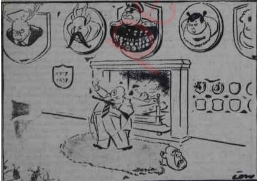
"Manchester Guardian" dan

Gaillard'ı kabineyi kurmağa da- vet etmesinden sonra vuku bulan gelişmeler, Fransız Devlet Başkanın- ın düşüncelerini haklı çıkarmıştı. Gaillard'ın Başbakanlığa getirilece- ğini duyan bütün mutedil siyaset adamları, bu kadar uzun süren bir buhranı sona erdirmek için onu mem- nuniyetle destekleyeceklerini bildiri- yorlardı. Nitekim, isimleri ileri sürülen diğer başbakan adaylarına yardımlarını esirgeyen bütün parti- ler-Poujade'cılar ve komünistler ha- riç- genç Başbakan adayı Gaillard'a, tam 38 yaşına bastığı gün, itimat be- yan ediyorlardı.