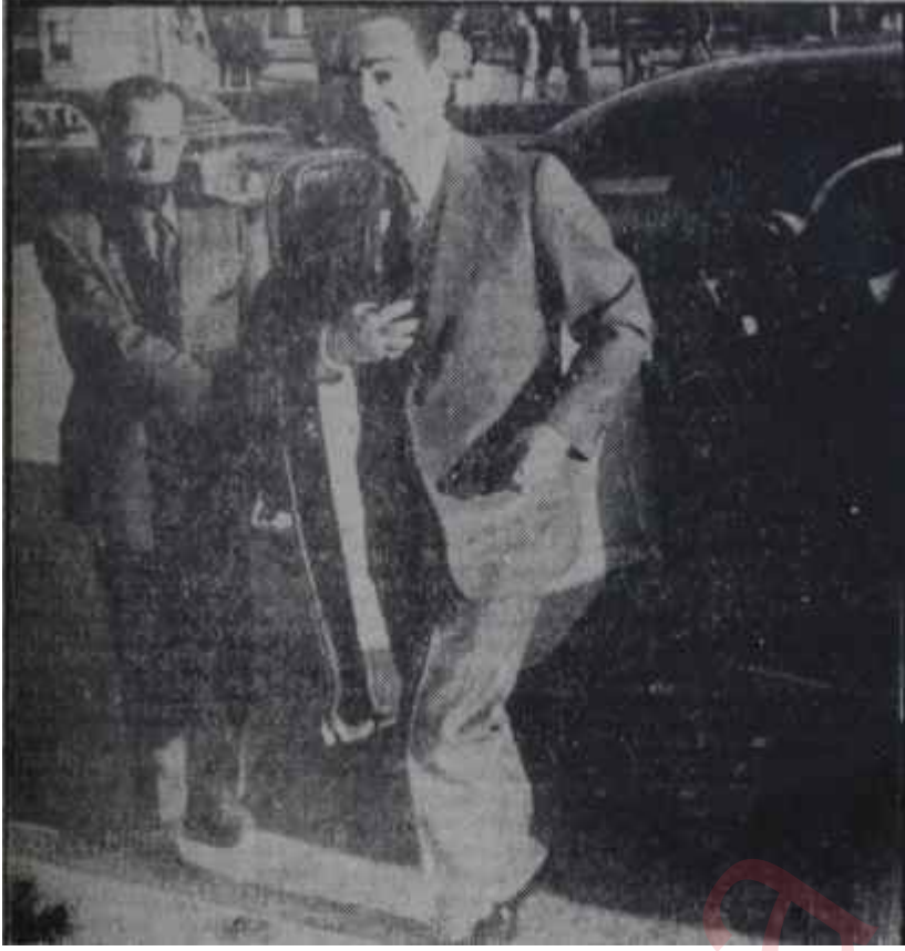
Başbakan adayı Menderes Gruba geliyor