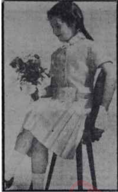
Bir "Jumper,, modeli

Bir çocuğun kişilik gardrobunu gözden geçirirken iklimi, piyasadaki imkânları göz önünde bulundurmak şarttır. Meselâ Ankarada ekseri kışın hatırı sayılır soğuğu vardır. Buna göre çocuklara ilk bakışta şık gelen kısa ve modern paltolar yerine daha ısıtıcı, daha uzun klâsik paltolar seçmek lâzımdır. Bu paltoların yakaları bu sene oldukça yukarıdan iliklenmektedir. Piyasadaki kumaş durumu da göz önünde tutulacak olursa meselâ ince bir kumaşı, amerikan bezi ile kaplayıp kalınlaştırmak veya astarla kumaş arasına müflon şeklinde pazen koymak pek âlâ mümkündür. Çocuk kaç yaşında olursa olsun, arada sırada giyinecek bir "yabanlık" takımı olmalıdır ve o küçük yaştan dik yakalı gömlek giyerek, kravat bağlayarak, icabedince biraz sıkıntıya girmesini bilmelidir. Arada sırada giyilecek elbise vasat bir kumaştan yapılabilir, çünkü çocuk nasıl olsa her gün büyümektedir. Buna mukabil çocuğun hergün giyineceği pantolonlar daima en sağlam, en yüksek kaliteli kumaşlardan yapılmalıdır. Bugünkü piyasada mevcut olan kaşelere rağbet etmek ve "serj"leri tercih etmek lâzımdır. Piyasada mevcut olan çizgili kadifeler de pantolon veya ceket yapmaya müsaittir. Bu sene yün sıkıntısı olduğuna göre, pazenlerden bol bol istifade edilecektir. Böylece bir, iki kolsuz süveterle kışın soğuşunu karşılamak mümkün olacaktır. Erkek çocuklar, son senelerde moda olan, değişik şekilli spor gömlekleri çok sevmektedirler. Bunları evde pantolon üze-