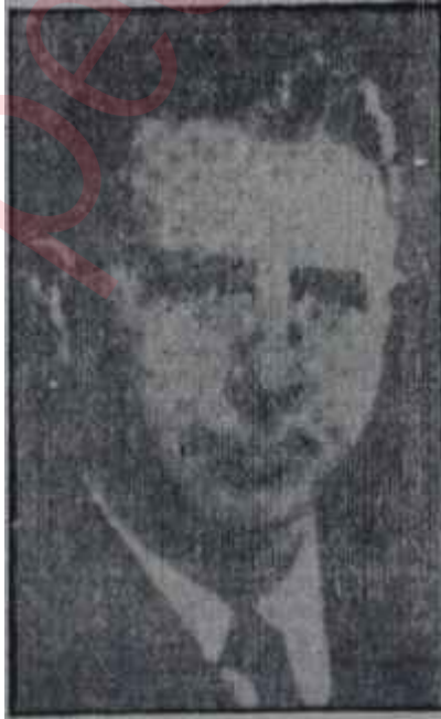
Dr. James R. Killian "İlmi Genel Kurmay Başkanı"