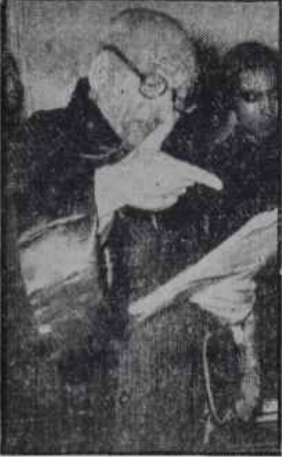
Barutçu avukat Dürüstlerin geçim yolu

sinin kendisini eskisi kadar serbest hissedemeyeceği muhakkaktı. Ama asıl kuvvet, milletin sempatisinin kendisinden tarafa olduğunu anlamış bulunmasıydı. 27 Ekim seçimleri bunu açıkça ortaya koymuştu: Millet , Mecliste demokratik rejimi müdafaa edecek kuvvetli bir zümrünün mevcudiyeti lüzumuna inanıyordu ve reyleriyle bunu temine çalışmıştı. Şimdi seçmen, Meclise gönderdiği 173 C. H. P. li milletvekilinden demokratik nizamın bütün müesseseleriyle teessüsü için gayret bekliyordu. Milletin kudretli bir Muhalefete bağladığı ümit buydu.