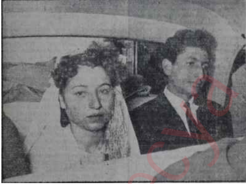
Gelin ve güveyi otomobilde

Kız evinde çarşı alışverişleri yapılırken, oğlan evinden yeni bir okutma çıkarılır ve misafirler "Bayrak cemiyetine" davet edilirler. Bayrak cemiyeti oğlan evinde toplanan erkekler arasında yapılır. Ortaya büyük simler içinde meyva getirilir. Bir hoca dualar eder, sonra davullar vurmağa başlar ve erkekler meyvaları yerler. Artık bundan sonra oğlanı evlendiren ağanın evi düğün evidir. Takatine göre, kiminde üç gün üç gece, kiminde de Kâzım yahut Haydar ağanın evinde olduğu gibi, yedi gün yedi gece devamlı surette misafirlere yemek ve içki ikram edilir. Davul ve zurnalarla civarın namılı köçekleri oynar. İnce çalgı adı verilen keman, ut, darbuka gibi sazlarla çengeller göbek atar. Bu arada kız evinde de hazırlıklar tamamlanmış, eşyalar denk edilmiş, kızın eline kınalar yakılmıştır. Kızın âna ve babasının suratları son derece asımlıdır. "Yuvadan kuşu uçurmak tadırlar." Derken, düğünün son günü oğlan evinden gelenler, köyün arazi durumuna göre; ya otomobil, kamyon ve traktörlerle, ya da atlarla, önlerinde davul ve zurnalar olduğu halde gelini almağa gelirler. Ellerinde bir bayrak, bayrağın ucunda da bir soğan vardır. Soğan aile hayatının tatlı geçmesi için bir tabuttur. Kız evinin önünde silâhlar atılır, halaylar çekilir ve sonra kız, oğlan evinin akrabaları tarafından anasının babası-