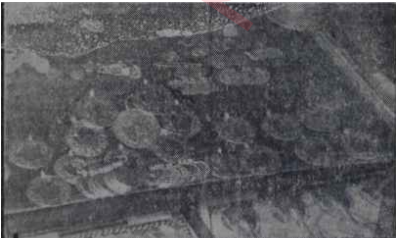
Sarraf vitrininde altınlar

Kemer sıkmaya namzet müstehlikler et yokluğuna da kendilerini alıştırmalıydılar. Hiç değilse seçimler arifesinde ete kavuşmuşlardı!