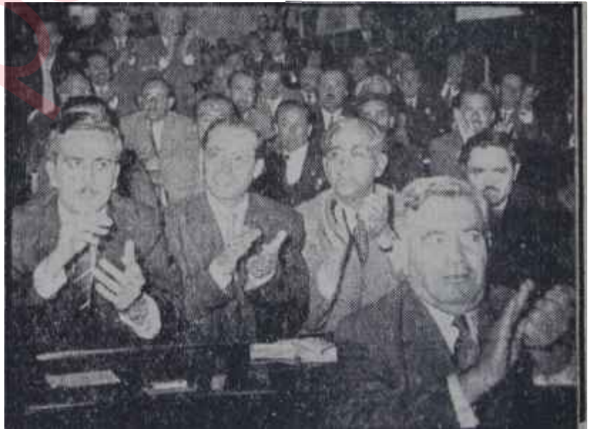
Mecliste muhalefet grubu

Birinci Dünya Harbinin sonunda, Mustafa Kemal Paşanın Anadoluya geçip milli mücadeleyi açma imkânlarını aradığı bir sırada, müta-reke hükümlerine göre terhis edilmiş 23 yaşındaki bir genç ihtiyat zabiti de, askere celbedilmesi yüzünden yarım kalan hukuk tahsilini tamamlamaya çalışıyor, Beyazıt'taki Darülfünunda bir imtihandan diğerine koşuyordu. İki ay içinde imtihanlar bit-