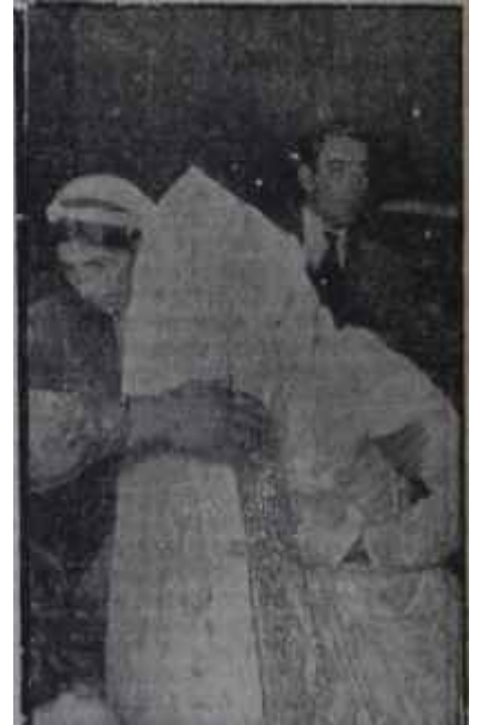
Gelinin yüzü açılıyor İlk görececek olan kaynana