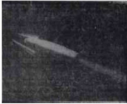
Orta kısım ayrılıyor geldiğine göre bu, Rusların kaçınıcı peyki?