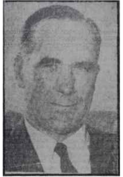
Sir Hugh Foot