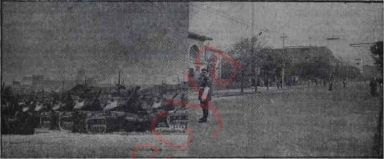
Meclisin açılış günü Ankaradan iki görünüş

Halbuki bu sırada radyolarımız, hem de dünya basınından seçmeler yaptıkları iddiasıyla 1957 seçimleri-nin manasını değişik şekilde anla-maya ve anlatmaya çalışıyorlardı. Millet ile D. P. nin ihtilafı oradan doğuyordu. İhtilâf sadece D. P. yi rahatsız etseydi, mesele azdı. Ama millet bu ihtilâfın derhal hallini ve İktidarın, kendisinden ne istendiğini anlamasını şiddetle arzuluyordu.