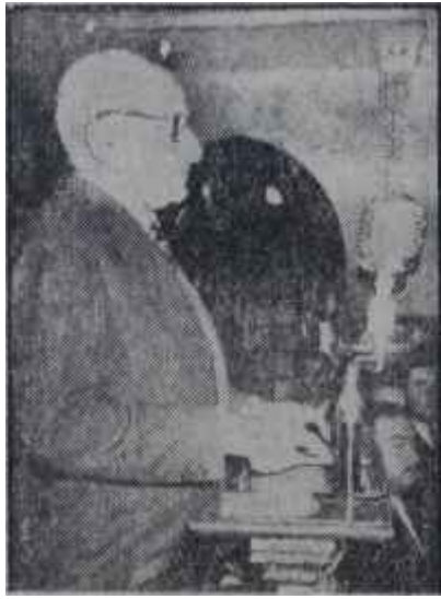
Barutçu yemin ediyor

D. P. nin memleket çapında bir sarsıntıya uğramış olduğunu kabule ise genel merkezde kimse yanaşmıyordu. Bu, elbette ki yem hezimetlerin habercisiydi.