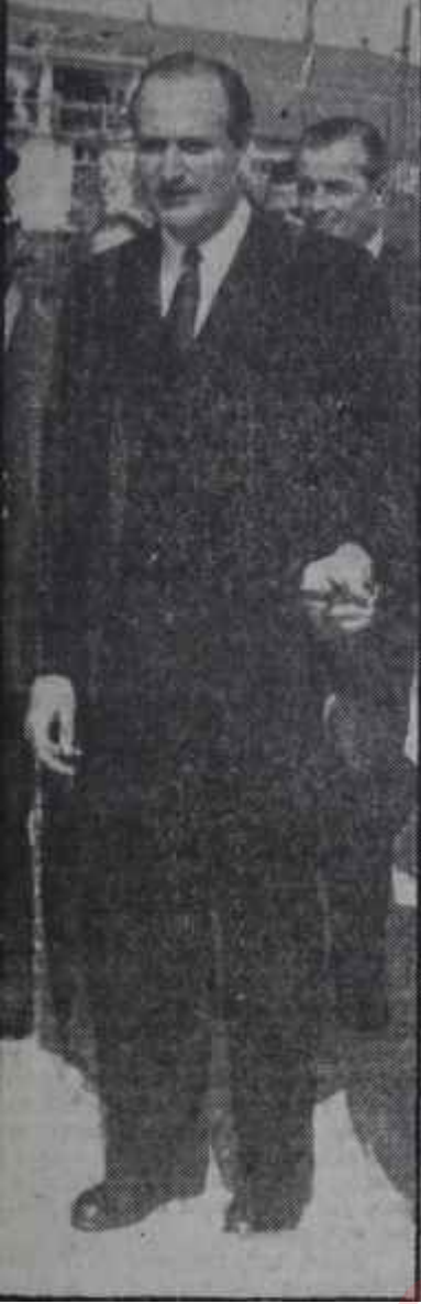
Fatih Rüştü zorlu

Beyefendinin ideal arkadaşlarından ikisi