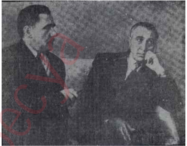
Gromyko ve Salâh Bittar

Park Sheraton Otelinin berber salonuna yüzü maskeli iki kişi girdi. Kapının tam karşısına gelen koltukta traş olan müşteriye doğru yönelen bu iki maskeli adam, berberi bir tarafa ittikten sonra, ceplerinden birer tabanca çıkardılar. Olup bitenleri, karşıdaki aynadan seyreden kısa boylu, orta yaşlı müşteri, ilk önce, bu adamların kendini güpegündüz ve New York'un en kalabalık bir semtinde vurmaya cesaret edemeyeceklerini sandığı için silâhına davranır gibi bir hareket yaptı. Ancak iki maskeli koltuktaki adamları aynı fikirde degillerdi. Berikinin elini cebine atmasına fırsat bile bırakmadan tabancalarını ateşlediler. Attıkları kurşunların ikisi koltuktaki adamın göğsüne, biri tam beynine, diğer ikisi ise araya girmek isteyen berberin e-