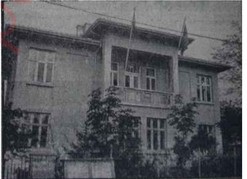
C. H. P. Genel Merkezi