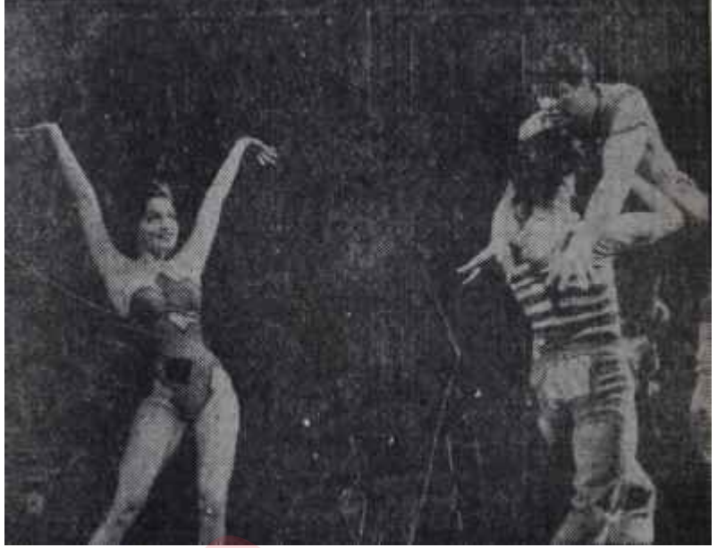
"Li'l Abner" adlı müzikal komediden bir sahne

"Gelinin- Muradı" genç rejisör Atıf Yılmazın ilk komedi denemelerinden. Daha evvel çevirdiği filmler arasında "Kanlı Feryat", "Beş Has-ta Var" gibi ağdalı melodramların, eserinin başlıca hususiyetlerini mey-dana getirdiği göz önüne alınınca bu ilk komedi denemesindeki aksama tecrübesizliğe; janr değişikliğine veri-lebilir. Teknik bakımdan kusurlar-ın çoğu ise, umumiyetle eli yüzü en düzgünce yerli filmler meydana ge-tiren rejisörden çok ona iyi bir ekip sağlı yamayan prodüktöre yüklenebi-lir. Fakat ne bu mazeretler, ne de filmin, başlangıçta sayılan meziyet-leri "Gelinin Muradı" ndaki başarısız-lığı unutturacak şeyler değildir. "Ge-linin Muradı", öbür yerli filmlerle karşılaştırıldığı vakit şu yahut bu lehte noktalar sayılabilir. Fakat 1957 yılının sonunda ölçü olarak yerli filmleri kullanarak varılacak iyim-ser bir hüküm seyirciyi de, sanatçı-yı da, tenkidçinin kendisini de yan-ıltmaktan başka bir işe yaramaz.