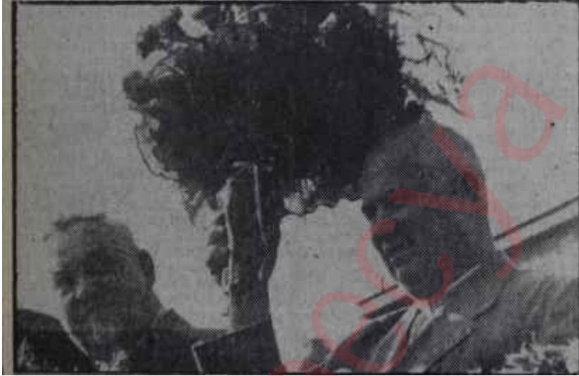
Krutçef ve Bulganin

Yorumcuların bir kısmı da Rusyanın elde ettiği neticeleri kâfi gördüğü için birden dunun değiştirmeye razı olduğunu söylüyorlardı. Geçen ay içinde cereyan eden olayların sonunda Rusya Arap âleminin "Sa-