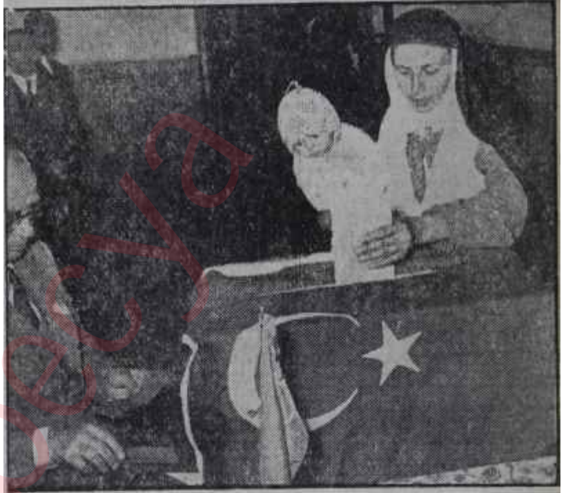
Oyunu kullanan bir anne Vatan vazifesi beşikten başlar

kıyıda yapmak zorunda kalırlardı. Nihayet parka bir hela, hem de güzel bir hela yapıldı fakat bir hafta içinde girilmez hale geldi.. Halk, burayı o kadar fena kullanıyordu ki cidden medeni bir şehre yakışmıyacak bir manzara meydana gelmişti.. Halbuki yanlış hareket edenlere intar etmek halka düşen bir vazifeydi.. Bunun gibi düzeltilecek, şekle sokulacak binbir tane derdimiz olduğu muhakkaktır. Fert olarak hepimiz cemiyet kaygusu, cemiyet sevgisi ile hareket edersek birçok aksaklıkların düzeleceği tabiidir.' Kirletilen bu sokak, tahrip edilen bir amme malı kadar memlekette husule gelen herhangi bir haksızlık, bir yanlış