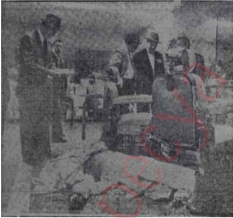
Anastasia berber dükkânında vurulduktan sonra Ecel traş dinlemiyor

Portekiz seçimlerinin diğer ülkelerde yarattığı akislere gelince, hür dünya devletleri bu seçimleri bir komediye benzetiyorlardı. Çünkü bu devletlere göre neticesi Önceden belli seçimler insanı ancak güldürebilirdi, o kadar.. Hür, dünya uzun tecrübeler sonunda her türlü kalkınmanın ancak demokrasi havası içinde gerçekleşebileceğini çoktan anlamıştı. Bunun aksine ileri sürülen iddialar, tarihin ortaya koyduğu hakikatlere aykırı olurdu. Bütün diktatör özentilerinin bu gerçeği kavramaları, hem de vakit geçirmeden kavramaları gerekiyordu. Aksi takdirde, ömürlerini akıntıya karşı kürek çekmekle geçirmekten başka bir iş yapmış sayılmazlardı.