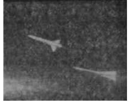
Birinci kısım ayrılıyor