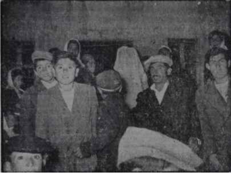
Gelin oğlan evine giriyor