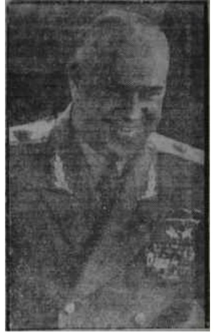
Mareşal Zukof Quo Vadis?

Ancak, Stalin'in ölümünden ve Rusyada "B" ile "K" ikizlerinin işbaşına geçmesinden sonra Tito'nun durumunda bir değişiklik göze çarpmaya başladı. Bu tarihten itibaren Yugoslavya'nın ana siyaseti Batı dostluğu değil, yeniden Rusya ile işbirliği olmuştu. Nitekim geçen haf-