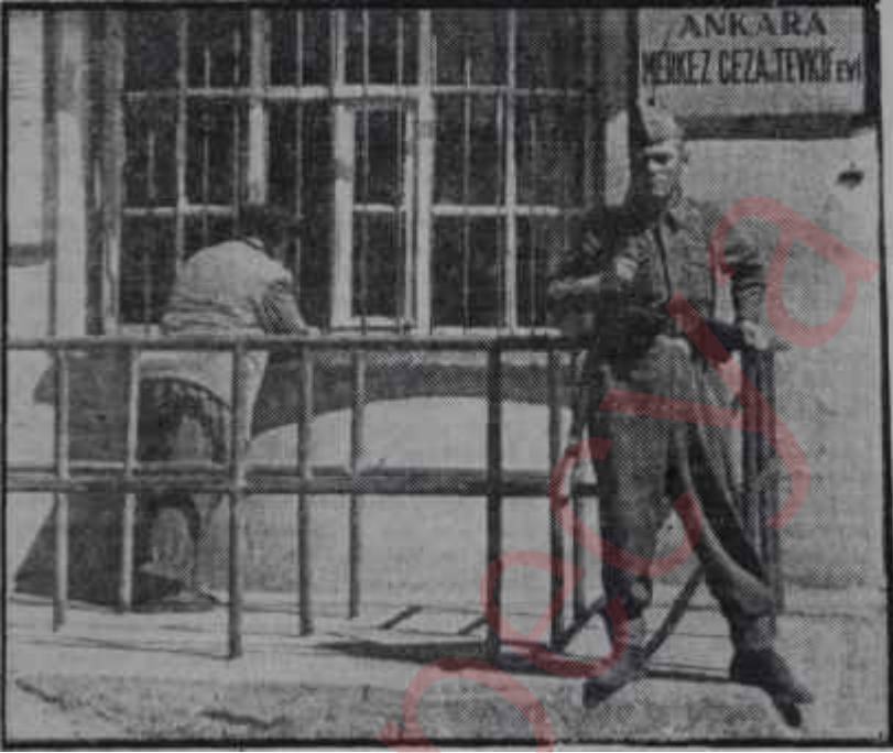
Ankara Cezaevinin kapısı Kapısı böyle olduktan sonra.

Savcıya göre Ankara Cezaevi Örneği bir durumdaydı. -Elhak! Cezaevinde dayak, küfür, zulüm ve iş-