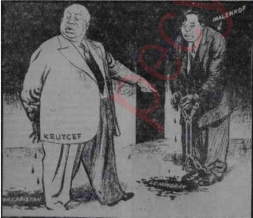
"Daily Mail'den 8.7.1957"

Polonya'ya gelince, Polonya da geçen hafta içinde bir yıldönümü yaşıyordu. Doğrusu istenirse Polonyalılar yıldönümü Macarlarinki gibi acıklı bir yıldönümü değildi ve son günlerde bazı yeni gelişmeler olmasaydı halk pekâlâ bunu büyük bir sevinçle kutlayabilirdi. Filhakika, geçen yıl bugünlerde Polonyalılar başlarına Gomulkayı getirmişlerdi. Gomulka o sıralarda Polonyada liberal bir idarenin sembolü olarak görülmüyordu ve onun iş başına gelmesi Rus tahakkümünden kurtulmaya atılmış ilk adım sayılmıştı. Ancak Rus tahakkümünden kurtulmak iste-