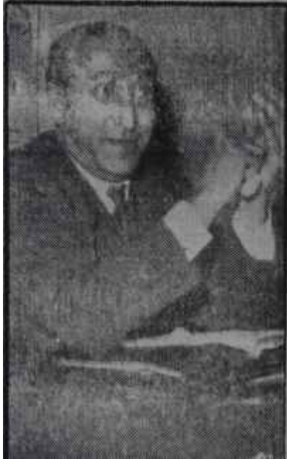
Osman Bölükbaşı Milletin Kurtardığı adam