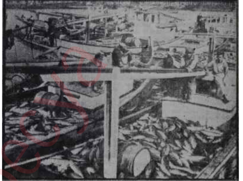
Denize dökülen balıklar

Lübnanın yeni Türkiye Büyükelçisi Halil Tacettin uçakla Beyrut-