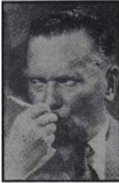
Mareşal Tito İki camiden biri

Kabineyi kurmayı başardığı takdirde Fransanın İkinci Cihan Sava-