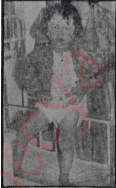
Sakat bir çocuk "Kızamık"çık kurbanı

Anestezinin gebe kadında çocuk ü-zerine kötü tesir yapacağından kor-karlar, İngalls'e göre anoksi fareler-de knjenitul lezyonlar yapmaktadır. Bu araştırmacıya göre öldürücü tesiri olan her madde muayyen bir dozdan Sonra ve fetal hayatın kritik bir â-nında verilirse malformasyon doğu-rabilir. Aynı araştırmacının şu deneyi de önemlidir: Fareleri özel surette hazırlanmış irtifa odalarına koyuyor. Bu odalar 9144 rakıma tekabül et-mektedir. Bu suretle hayvanlarda ok-sijen eksikliği anoksi ortaya çıkıyor. Gebe farelerin yavrularında bu anok-sinin malformasyonlara sebep olduğu görülüyor. Şu halde gebe bir kadını rakım değişikliklerine maruz bırak-manın ve yükseklerle götürmenin doğ-ru olamayacağı anlaşılıyor. Bunlara