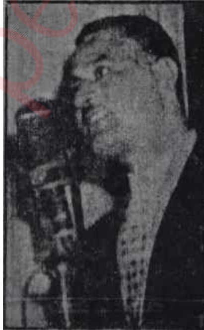
Cemal Abdülnasır Kaybolan liderlik ümitleri

B ilindiği gibi, NATO kuvvetleri, zaman zaman müşterek bazı tatbikatlar yapıyorlardı. Bu sayısının okuyucularımızın eline geçtiği sıra-