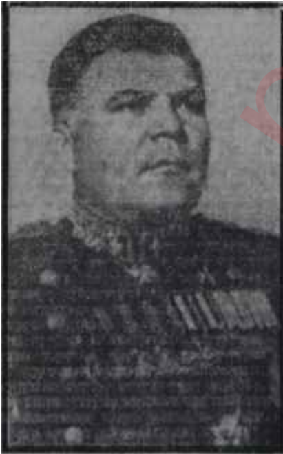
Mareşal Malinovsky Yeni şöret

Moskova radyosunun bütün dünyada ilgi ile karşılanan yeni havadis şuydu: S. S. C. B. Komünist Partisi presidiyumu Mareşal Zukof'u Savunma Bakanlığında uzaklaştırmış, yerine şimdihye kadar ismi pek fazla duyulmamış bir Mareşali, Malinovsky'yi getirmişti. Radyo, bu haberi, Mareşal Zukof'un Balkan devletlerinde yaptığı bir geziden dönme-