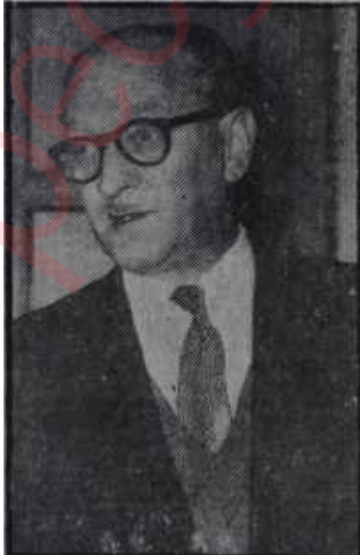
Guy Mollet Yeniliden yenilgiye

şı sona erdiği gündenberi iktidara gelen yirmi üçüncü - yirmibirincisi de oydu- Başbakan olacak Mollet, geçen hafta açıkladığına göre, işbaşına gelince önce mail durumu düzeltmeye matuf bazı tedbirler almayı, sonra da Fransız Anayasasında bazı değişiklikler yapmayı düşünüyordu. Bilindiği gibi, Bourges-Maunoury kabinesinin düşmesine sebep olan Cezayir Kanunu Cezayire federal bir sistem getiriyordu ve Fransız Meclisinde Fransız Anayasasına muha-