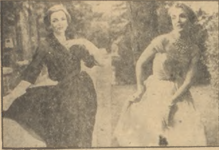
Zarif iki kokteyl elbisesi