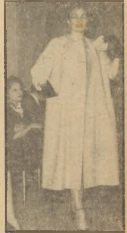
Sonbahar modası pardesü

Yaz tatilinden şehir hayatına dönüşecek olan şık kadınları Parisin şık "butik"lerinde cezbedecek birçok şık gece elbiseleri de vardı. Bunlar drapelî organza ve şifonlardan, pliseli saf ipeklerden yapılmış nefis modellerdi.