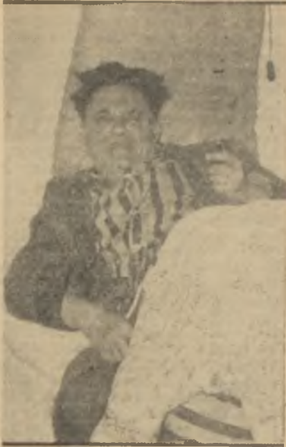
Ataç'ın son resmi

Tehlikeli Alâkalar, baştan aşağı karşılıklı yazılmış mektuplardan meydana gelmiş bir romandır. Roma- nın kahramanları olan ve 18 inci yüz- yılıda Pariste yaşayan şahısların kar- şılıklı mektuplaşmalarından meydana gelen bir roman, bu tip romanla- rın dünya edebiyatındaki ikinci ör- negidir. Laclos'un bu romanından da- ha önce gene aynı tipte ve hattâ mev- zu bakımından da Tehlikeli Alâka- lara benzeyen bir roman yazılmıştır. Söylendiğine göre, Laclos'un Tehlike- li Alâkaları yazdığı yıllarda, Fran- sada çok okunan romanlardan biri de, İngiliz Romancısı Richardson'un, (1765 - 1839) Clarissa Marlowe adlı romanı imiş. Laclos, kendi kitabında bu İngiliz Romancısının da sözünü eder. Muhtemeldir ki romanını yazar- ken bu İngiliz Romancısından fayda- lanmış. Ama şurası da muhakkak- tır ki Laclos'un Tehlikeli Alâkaları Clarissa Marlowe'den kat be kat ü- stündür. Laclos da bunu bildiği için o romanın adını etmekten çekinmemiş- tir.