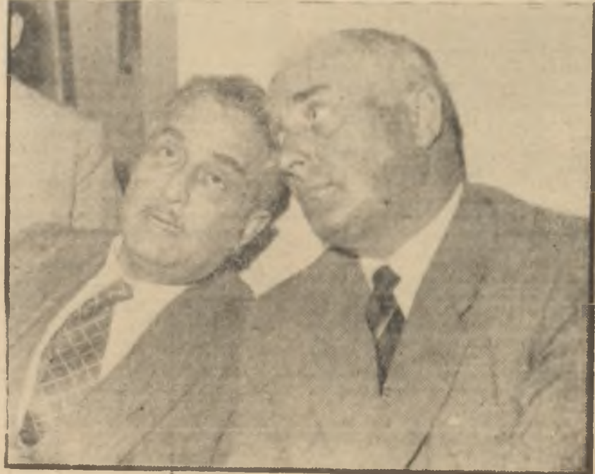
Migros kurucularından ikisi

Hani, şu hayatı ucuzlatacak olan meşhur Migros, bu hafta gene ga-