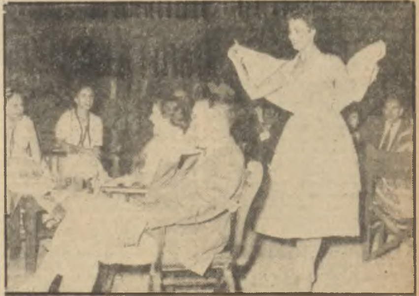
Rengârenk el oyalarıyla süslü krem organza tuvalet

lâyetlerde de defileler yapılmıştı ama koleksiyon hazır olur olmaz talep derhal mevcudu tükediordu ve ekseri İzmirden dışarı çıkmak mümkün olamıyordu. Fakat Derneğin satış merkezine ve defilelere gösterilen rağbet Dernek kurucusunu mesut etmeğe kâfi gelmiyordu. Gaye Türk kadınına Türk kumaşı giymeğe, çok az para sarfederek, kendi hususiyetlerinden istifade ederek şık olmaya