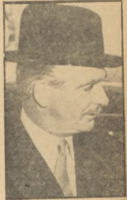
Sir Anthony Eden

Yorkshire Post'un bu talebi, doğrusunu söylemek gerekirse, çok ustaca hesaplanmış bir zamanda ileri sürülüyordu. Orta Doğu'da cereyan eden son ve yeni olaylar İngilizlere talihsiz Süveyş seferini unutturmak üzere bulunuyor, İngilizler arasında tekrar kuvvet siyasetine dönüşüne isteyenlerin sayısı gün geçtik-