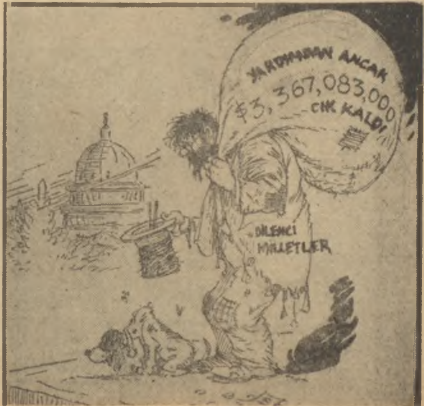
— ALLAH RIZASI İÇİN