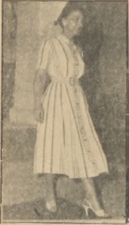
Ödemiş bezinden elbise