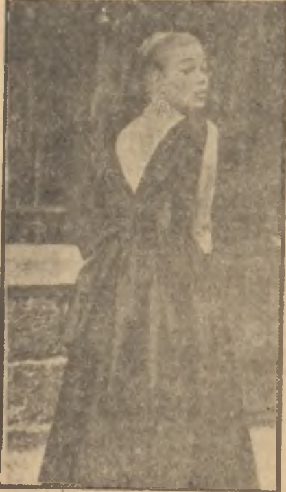
Son moda bir tuvalet

Güzel günler, bitti bitiyor derken Parisli büyük terziler Sonbahar