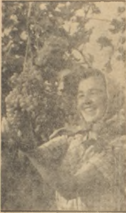
İhraç mallarımızdan üzüm