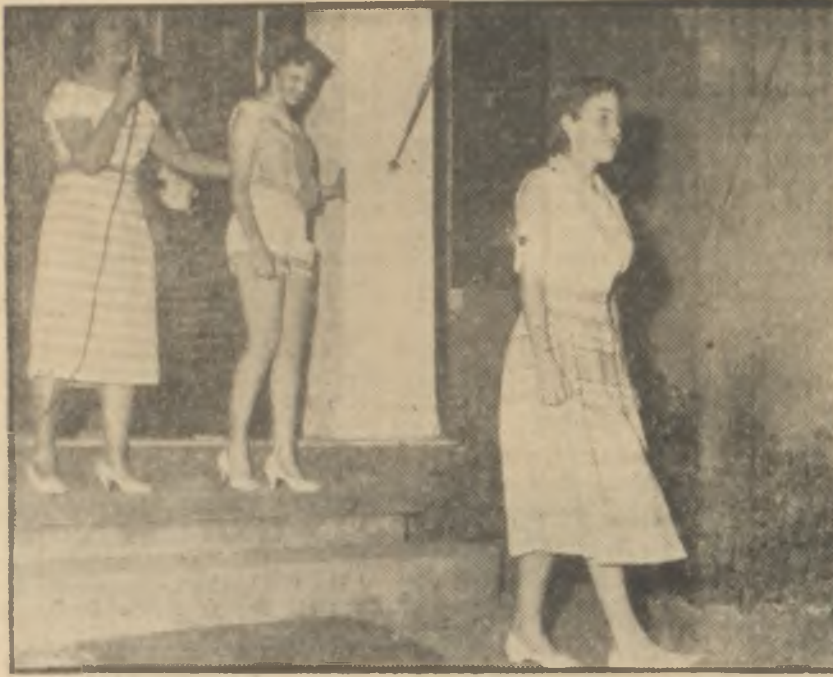
Dokumadan sort ve bluzu, önde de peştemal etek Ucuz, sade, rahat... ve şık