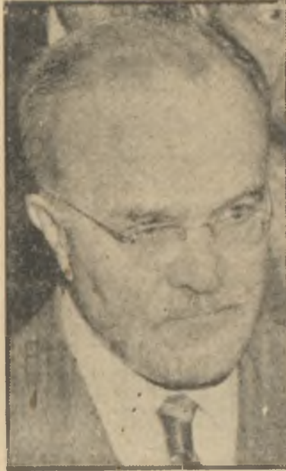
Molotov "Büyük Elçi"

Kısa boylu, çerçevesiz gözlüklerin arkasına saklanan keskin bakışlı Rus devlet adamının resimlerinin altına, bundan birkaç yıl öncesine kadar, "Dışişleri Bakanı" ibaresi konuyordu. Sonra bu resimler bir zaman için hiçbir Rus gazetesine konulmadığı gibi, Batılı basında da daha seyrek görülmeye başladı. Devlet adamının, kısa bir müddet için de