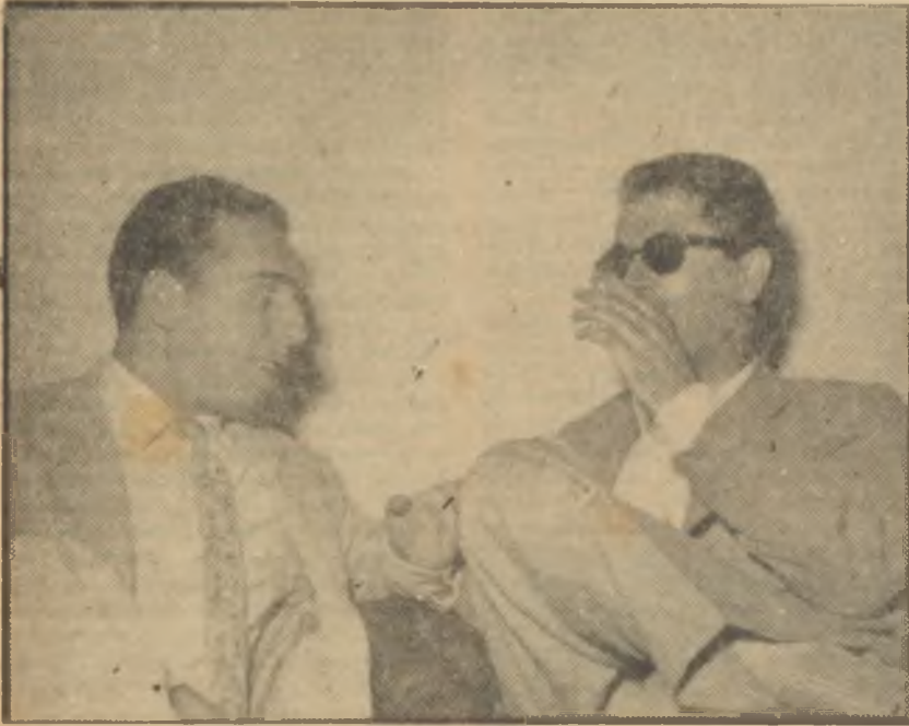
Halit Refiğ ve Nijat Özön