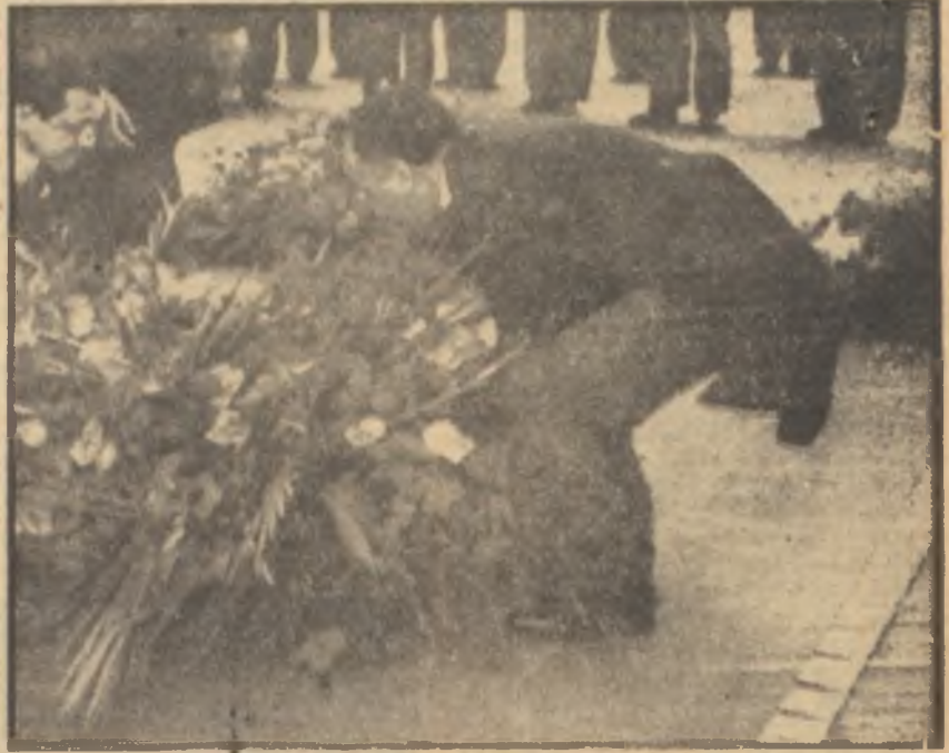
Suriye Savunma Bakanı Halid El Azm

Bundan başka, mesele uzadıkça sadece Amerikan - Suudi Arabistan