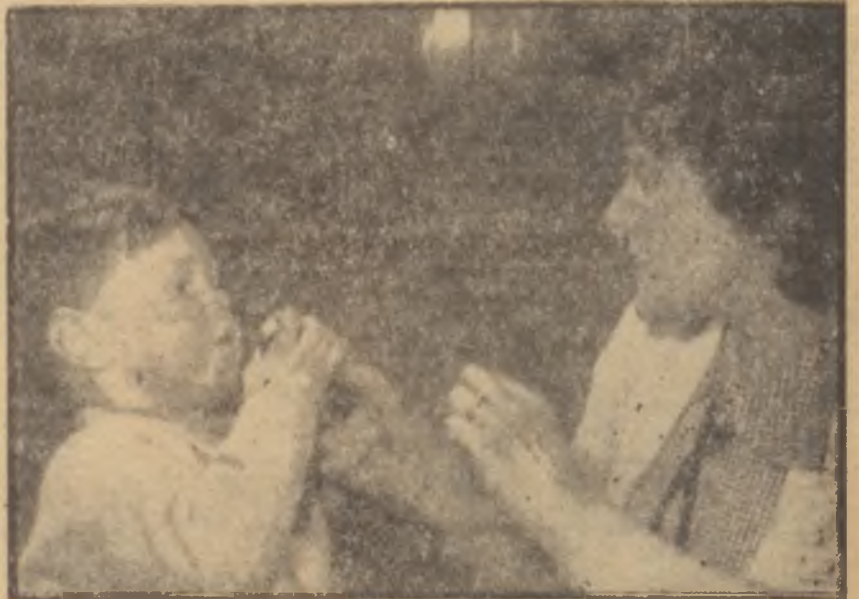
Çocuğunu terbiye eden anne

Günümüzün bütün hukukçuları, çocuk suçluluğunun önüne geçmek için herşeyden önce bu suçluluğun sosyal ve psikolojik amilleri üzerinde durmak gerektiği hususunda ittifak etmektedirler. Bu amilleri bertaraf etmek için ise önce aile müessesesini ele almak ve ona eski vazife ve itibarını iade etmek lazımdır. Filhakika, suç işleyen çocukların büyük bir kısmının ya aile bağları gayet zayıf olan, ya da hiç yeri yurdu bulunmayan zavallılar olduğunu istatistikler açıkça ortaya koymuştur. Aile bağı zayıf olan çocukların günahı hiç şüphesiz, herkesten çok ana babalardadır. Evsiz barksızlarının ise maalesef hepimizin sırtındadır.