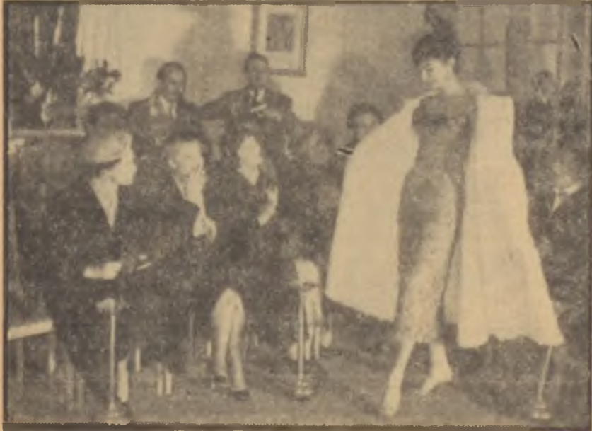
Bir defilede model beğenenler