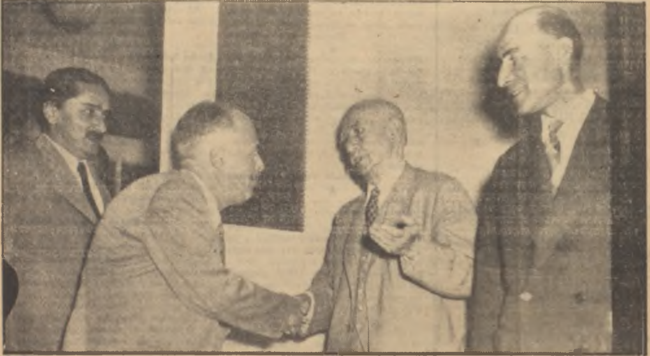
İnönü Heybeliadadaki evinde Arna ve Karaosmanoğlunu karşıyor

Bu haftanın başında temsilciler 73 numaralı evde toplandıklarında heyetlerin teşekkül tarzı derhal dikkati çekti. Akliselimi temsil eden üç liderin yanında memleket menfaatleriyle partilerinin menfaatlerini haklı bir ölçü içinde telife çalışmalarıyla tanınmış üç baş yardımcı vardı: Gülek, Güreli ve Arıçoğlu. Bu üç baş yardımcı İşbirliği mevzuunda şimdiye kadar itidalleriyle, iyi niyetleriyle kendilerini belli etmişler, fakat işi kendi partileri zaviyesinden mütalea lüzumunu da gözden kaçırmamışlardı. Aslına bakılırsa bu, onların biraz da vazifeleriydi. Heyetlerin "üçlüncü adam" ları ise Göle, Öktem ve Bilgin-