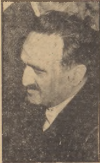
Mikoyan Sert ithamlar

Geçen hafta Çarşamba günü, öğleye doğru, Doğu Berlindeki Schönewald Hava Alanına TU - 104 tipi Rus yapısı büyük bir tepkili yolcu uçağı indi. Bu uçağın içinden çıkanları, ilk ağızda, uçak kapısının karşısına gelen duvara iştirilmiş kırmızı bir bez kuşak üzerine sarı harflerle yazılmış "Berlin en yakın dostlarını candan selâmlar" ibaresi karşılıyordu. Ancak uçaktan indikten sonra otomobillere binen bu "en yakın dostlar", meşhur Stalin Caddesi boyunca ilerlemeye başlayınca, "candan selâmlar"ın kırmızı bez kuşak üzerinde kaldığını anlamakta geçikmediler. Zira uçaktan inen misafirler geçtikleri bütün yollarda Doğu Berlinlilerin büyük kayıtsızlığı ile karşılaşmışlardı. Yol kenarında birikenler ise işlerinden zorla ayrılarak ellerine birer döviz tutuşturulmuş işçilerle, alelacele toplanılmış bir talebe kalabalığından teşekkül eden cansız ve ruhsuz bir kitleden başka bir şey değildi. Evet, eğer ha-