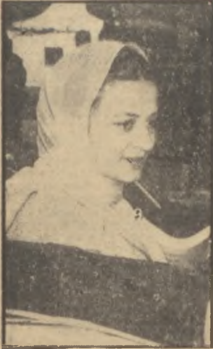
Kraliçe Dina Evlâd muhabbeti