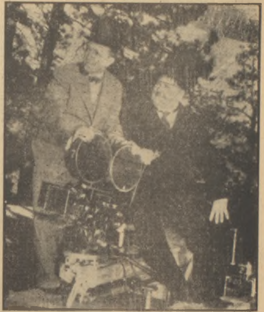
Laurel ve Hardy işbaşında

Laurel - Hardy çiftinin birlikte çalışması bir kaza sonunda başlamıştı. 1927 de, uzun zamandır oyunculuğu bırakmış olan Laurel, Hal Roach stüdyolarında komedi filmleri rejisörlüğü yapıyordu. Günün birinde, Hardy'nin baş komik olarak görüneceği bir filmin rejisörlüğünü üzerine aldı. Fakat film çevrilirken Hardy kızgını yağla kolunu yakınca Laurel istemiyerek oyunculuğa yeniden başladı. Hardy'nin bıraktığı yerden film devam etti. İkisini aynı filmde seyreden Hal Roach birlikte çalışmalarını, bir "çift" yaratmalarını ısrarla isteyince ikisi de neticeden pek şüpheli olarak işe başladılar. Fakat ondan sonra filmler birbiri ardından sökün etti. Eğer ikisinin müşterek bir ünlünlüğü varsa, hiç şüphesiz bunu daha evvel niye akıl etmediklerinden