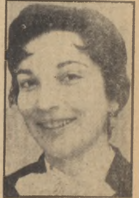
Suna Kan Konuşma yasağı!