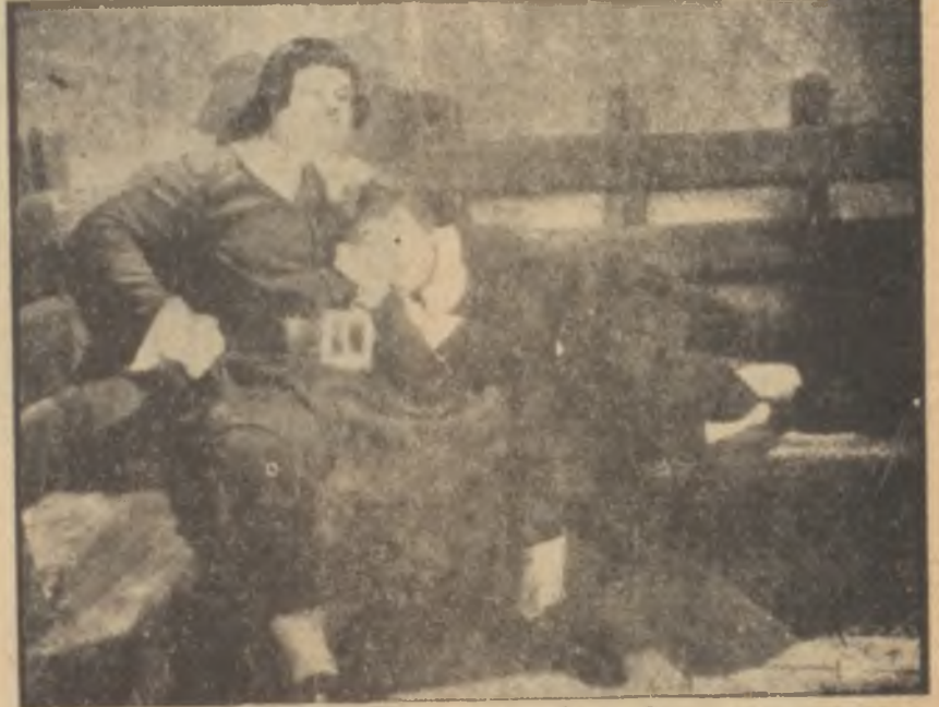
"Şeytan Kardeş" ten bir sahne

daha rasthyamadılar. Bunun üzerine stüdyolar arasında bir göçebe hayatı yaşamaya başladılar. Bir ara Roach ile iki film daha çevirmek imkânını buldular. "A Chump at Oxford-Laurel - Hardy Mektepte" ile "Saps at Sea - Laurel - Hardy Denizci" bunun neticesi olarak ortaya çıkmıştı. Ondan sonra yeniden göçebelige döndüler. "Great Guns-Laurel Hardy Gönüllü", "A Huntig We Will Go - Laurel-Hardy Hokkabaz", "Air Raid Wardens-Laurel - Hardy Pasif Koruma Memurları".. bu arada çevrilmişti. Fakat artık yolunda gitmeyen bir şey vardı. Filmleri eski tabiiyetlerini, tatlılıklarını kaybetmişti. Bir filmi baştan aşağıya kadar hiçbir sahne sırası değiştirmeden devamlı olarak çevirme âdetleri, büyük stüdyoların film çevirme teknikleriyle bağdaşmıyordu. Halbuki, Laurel - Hardy'nin