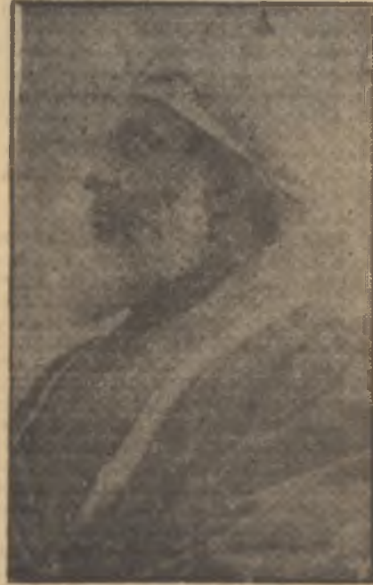
Ali Bin Galip Posta kaptırıyor

Fakat Ivanoviç Abel'in başlangıçta iyi gittiği anlaşılan işleri, bu Haziran içinde birden bozuldu. Amerikanın meşhur Muhaceret Dairesi memurları Rus asıllı fotoğrafçının vesikalarının tamam olmadığını tesbit etmişler ve kendisini, Birleşik Devletler topraklarında kaçunsuz ikamet etmek ithamı altında Texas'taki McAllen tevkifine yollamışlardı. Ivanoviç Abel kendisine yüklenen bu suçu bir türlü kabul etmiyor, masum olduğunu ispat etmek için gerekli makamlara başvuracağı yolunda tehditler sallamaktan geri kalmıyordu. Muhaceret Dairesi memurları biraz daha dikkatli bir tahkikat yaptıkları takdirde, Ivanoviç Abel'in bir yanlışlığa kurban gittiği gün gibi meydana çıkacaktı!