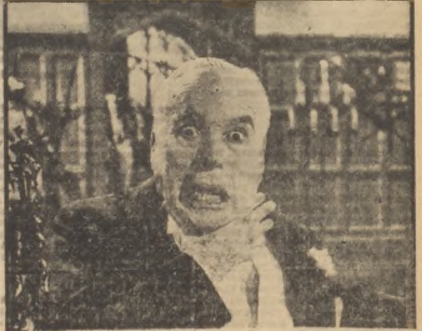
Charlie Chaplin "New York'ta bir Kral" da