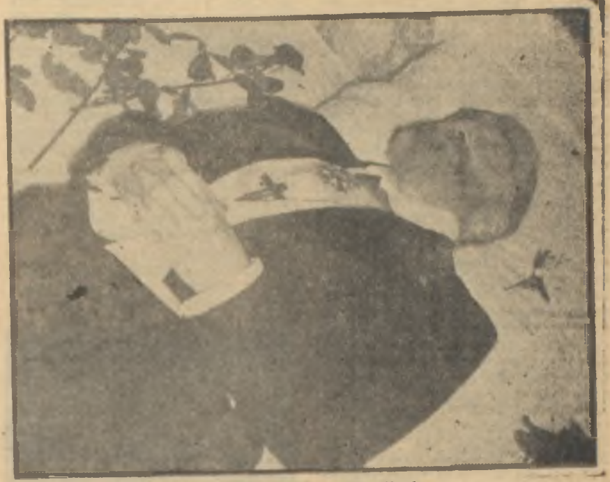
Sacha Guitry ölüm döşeginde

"Alabildiğine" Şairler Yaprakları yayınlarının hemen bütün kitapları gibi son derece zevkle hazırlanmış. Baskısından tertibine kadar, herşeyi ince ince düşünülmüş. Kapak resmi ve içindeki iki resim ressam Fikret Otyamanın kalemyle çizilmiş, son yılların bir hayli azalmış şiir yayınları arasında "Alabildiğine" başarılı sayılabilecek bir kitaptır.