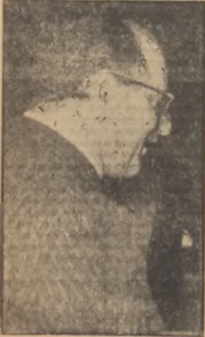
Fatin Rüştü Zorlu Geç oldu ama..