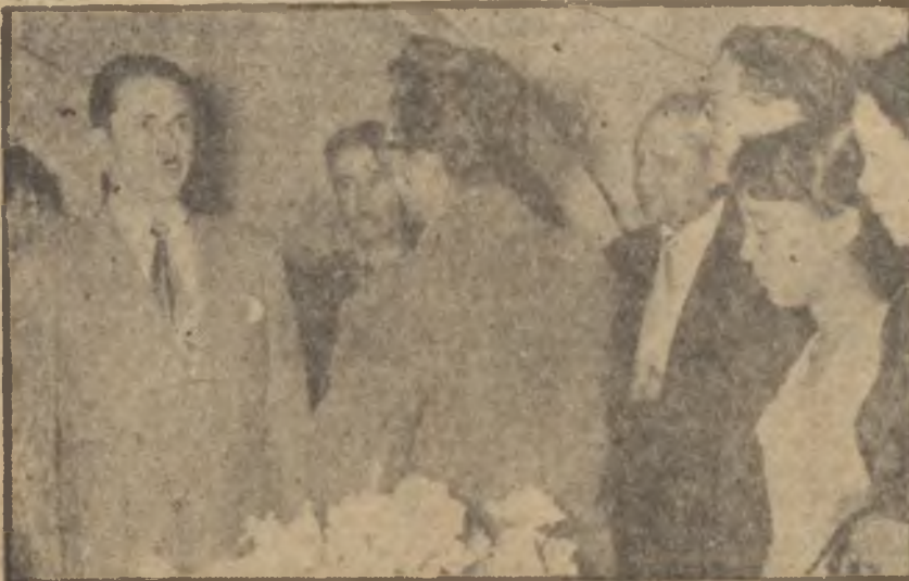
Castillo Armas taraftarları arasında

Geçen ayın başlarında yapılan seçimlerle kurulan yeni Mısır Millî Meclisinin çalışmaları, doğrusu, Nâsırın yaptığı konuşmadan daha önce başlamış bulunuyordu. Nâsırın açış konuşması yapacağı günün sabahında Krallığın ilgasından sonra geniş ölçüde tâdil edilen Kubbah Sarayın-