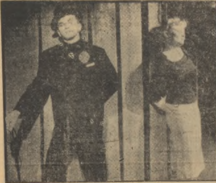
"L'Opéra de Quat' Sous" dan bir sahne