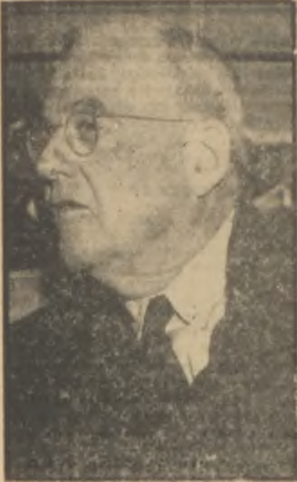
John Foster Dulles