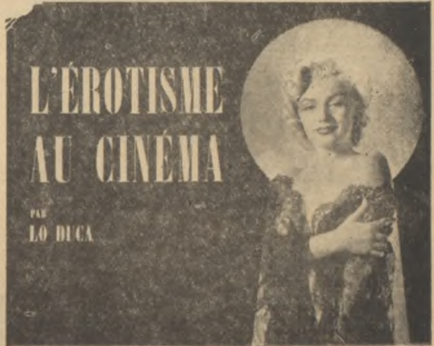
"Sinemada Şehvet" in kapağı

de la Femme dans le cinéma américain - Amerikan Sinemasında Kadın Efsanesi" adlı kitabında Jacques Siclier, şimdiye kadar Amerikalıların yaşamadıkları bir açıdan Hollywood filmlerinde "kadın"ın başlangıçtan günümüze kadar nasıl değişik şekillerde ele alındığını anlatıyordu. Kitabın adına ilâve edilen "De La Divine a Blanche Dubois" yazarın plânını açıklamaktaydı. Siclier'in kitabı, "ilâhî" Garbo ile başlayan "A Streetcar Named Desire - İhtiras Tramvayı"nın kadın kahramanı Blanche Dubois (Vivien Leigh) ile sona eriyordu. Bu arada Hollywood sinemasının, kadına kutsal bir mevki ayırmakla başlayıp korkunç bir kadın düşmanlığına varan seyri alâka çekti-