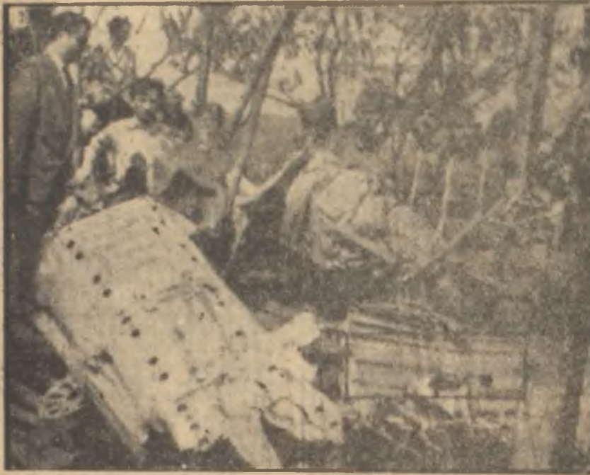
Bursaya düşen jetin hali Gökten inen ölüm