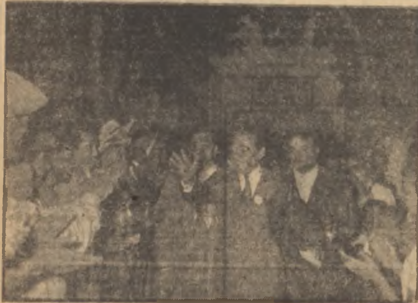
Adnan Menderes Çanakkale İI Kongresinden çıkıyor

T ek bir partilili hakimiyeti, demiyor, memleketi diktatörlüğe dö-türmektedir. Büyük bir çoğunlukla İktidara gelen C. H. P nin. tüki D. P. gibi hareket etmesi mümkündür. O halde yapılacak iş, bir partinin tek başına çoğunluğu elde etme ine mâni olmaktır. Montaguëu, hürriyetlerin garantisini kuvvetlerin bölünmesinde bulmuştu. Bu yeni teori, garantili İktidara İştirak eden partilerin çoğalmasında aramaktadır... Koalisyon hükümeti birçok Avrupa memleketinde, hiç bir parti tek başına çoğunluğu temle edemediği için zaruri olarak mevcuttur; fakat şimdiki kadar hürriyetler ve çok partili İktidar arasında bir münasebetin mevcudiyeti düşünülmemiştir. Bilakis koalisyon hükümetleri devamlı bir tenkid mevzuudur. Bu bakımdan yeni teori tamamıyla yerli mahdir. Bu yeni teori mesnedini herhangi bir mantiki izahıtan çok, tecrübede bulmaktadır. Bir asırlık hürriyet mücadelesi muvaffakiyetle neticelenmemiştir. İktidardan uzaktayken "didarı hürriyete" e kaside yazan siyasi gruplar koltuğu oturunca eski sevgilerini çabucak unutmuşlardır. Bu vefasızlığın sebebi nedir? Yeni teörinin taraftarlarına göre hastalık tek bir siyasi teşekkülün memleket mükadderatına hakim olmasından doğmaktadır. O halde tedavi, İktidara İştirak eden partilerin sayısını çoğaltmaktır! Bu suretle partiler