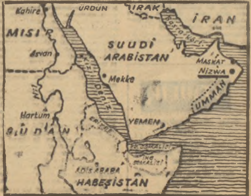
Petrol mücadelesinin sahasını gösterir harita

Orta Doğunun ufak, fakat yeraltı zenginlikleri bakımından çok mühim Maskat ve Umman Sultanlığındaki son karışıklık geçen hafta içinde çıkmış ve bir kere daha İngilterenin zaferi ile neticelenmiştir. Bilindiği gibi, bundan iki yıl kadar önce Maskat İmamı Galib Bin Ali sultana karşı isyan etmiş ve isyanın bastırılması ü-