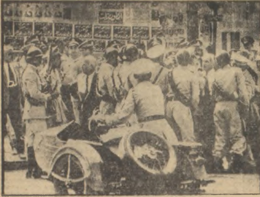
Mısır seçimlerinden bir görünüş