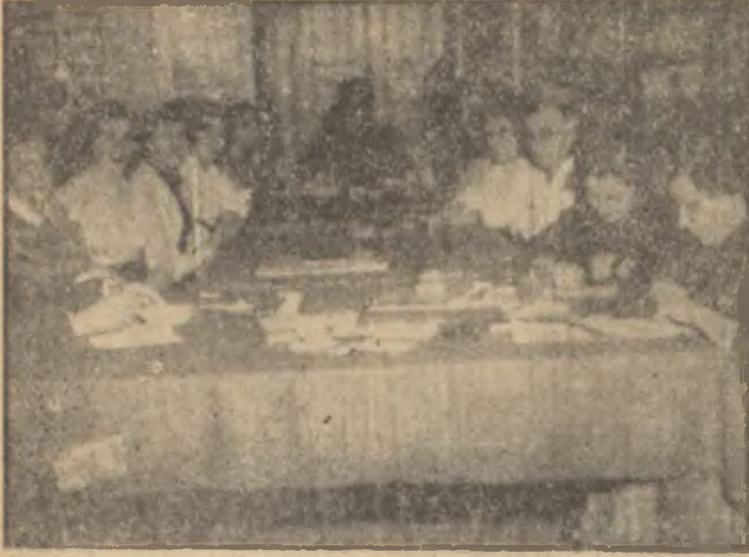
Topkapı Sarayında çalışan tezhipteçiler