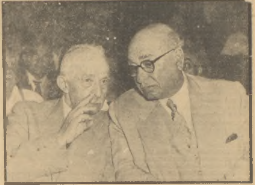
İnönü ve Günaltay İstanbul C.H.P. Kongresinde