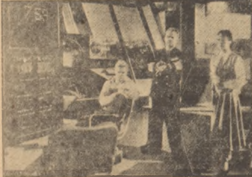
"Kızıl Seyyare Merih" ten bir sahne

Science - Fiction" ların dikkati çeken başka bir hususiyeti, atom ve hidrojen bombalarının patlatılması neticesinde meydana gelen radyoaktivitenin şimdiki ve gelecekteki tesirlerine geniş yer verilmesidir. Gerci bu mevzu, ikinci üçüncü derecede birçok filmlerde, eski korku ve dehşet filmlerinin "Science - Fiction" kılıfına bürünmesi şeklinde ortaya çıkmaktadır: Radyoaktif ışınlar bir canlı değişmesine sebep olur, bunun sonunda ortaya korkunç bir canavar çıkar. Film bu canavarın ortaya sal-