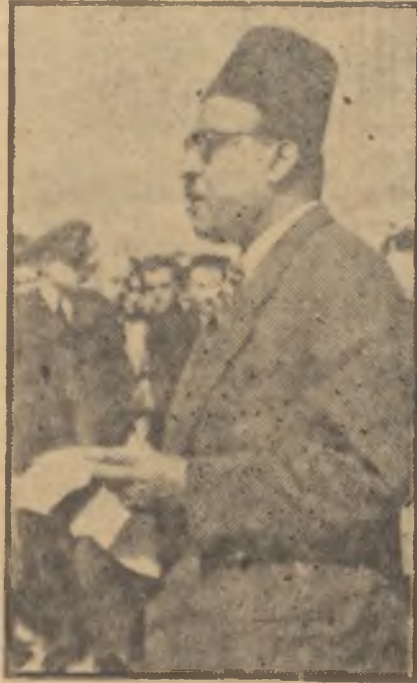
Abdül Rahman İstiklâl yolunda

Malezya Başbakan Abdül Rahman ile İngiliz Müstemlekeler Bakanı Lennox Boyd arasında Londra'da yapılan bu anlaşma geçen haftalar içinde Avam Kamarası tarafından tasdik edildiğine göre Malezya'nın bağımsızlığa kavuşması için Lordlar Kamarasının tasdikini ve 31 Ağustos tarihini beklemekten başka birşey kalmamıştır. Bundan böyle, Malezya Britanya Milletler Cemiası içinde hür bir devlet olarak yer alacak id-