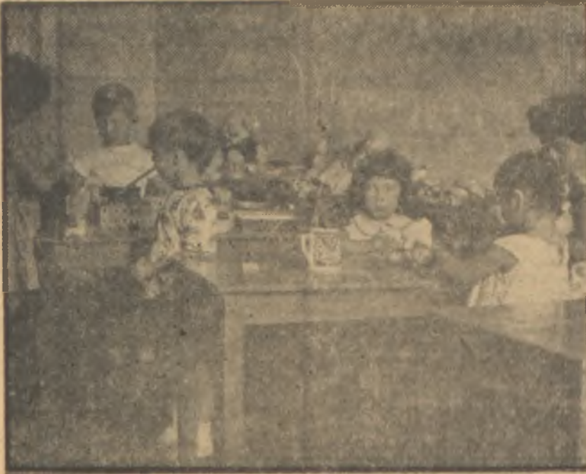
Oyun odasında geçen eğlenceli saatler Dağıtmanın değil toplamının zevki öğretiliyor

rinde ailelerinden alâka ve şefkat gören çocuklar her şeyi çabuk kapıyorlar, mesut oluyorlardı. Annenin daha çok gezmek, serbest olmak ve çocuğunu başından atmak için onu yuvaya göndermesi çocuk tarafından adeta seziliyor ve çocuğu bedbaht ediyordu. Yatılı talebenin, hafta sonu tatilini evinde, ailesinin içinde mesut geçirmesi lâzımdı. İnci Moran anne ve babanın çalışması gibi mühim bir sebep olmadıkça çocukların yatılı olarak yuvalara bırakılmasına taraftar değildi. Buna mukabil gündüzleri çocukların kendi akranları arasında gülererek oynuyarak bir şeyler öğrenmeleri, disipline alıştırmaları muhakkak ki çok faydalıydı. Çocuk devamlı bir alâka, sabır, bilgi ve devamlı enerji isteyen bir şeydi. Bir annenin bütün diğer işlerini bırakarak mütemediyen çocuğu ile meşgul olması tabii pek zordu. Bu işin yuvalarda, yetiştirilmiş öğretmenler tarafından yapılması muhakkak ki çok daha kolaydı.