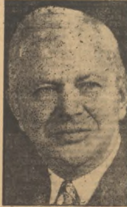
Charles Wilson Batının elçisi

Haber hiç te hayretle karşılanmadı. Başbakan Habib Burgiba'nın Cumhuriyet taraftarı olduğu çoktan biliniyordu. Burgiba, Atatürk inkılaplarının samimi bir hayranı idi. Tunusu modern bir memleket haline getirmeye iman etmişti. Çoktan beri Cumhuriyeti ilân etmek için münasip bir fırsatın zühurunu bekliyordu. İşte nihayet o gün gelmişti.