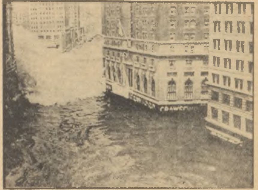
"Dünyalar Çarpışınca"dan su baskını sahnesi