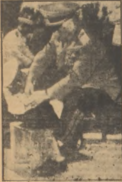
Mareşal Zukov Övülen hâsim