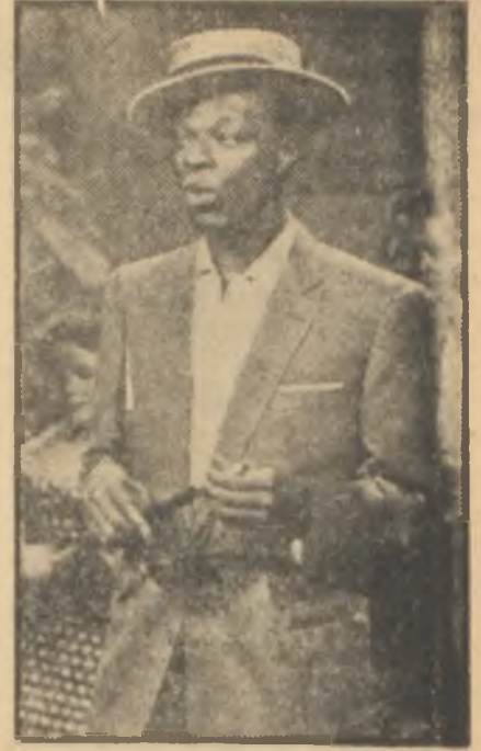
Nat King Cole İstenmeyen adam!

Sanatkar şimdi Los Angeles'te, Hancock Park'ta, İngiliz tarzında inşa edilmiş güzel bir evde, karısı ve