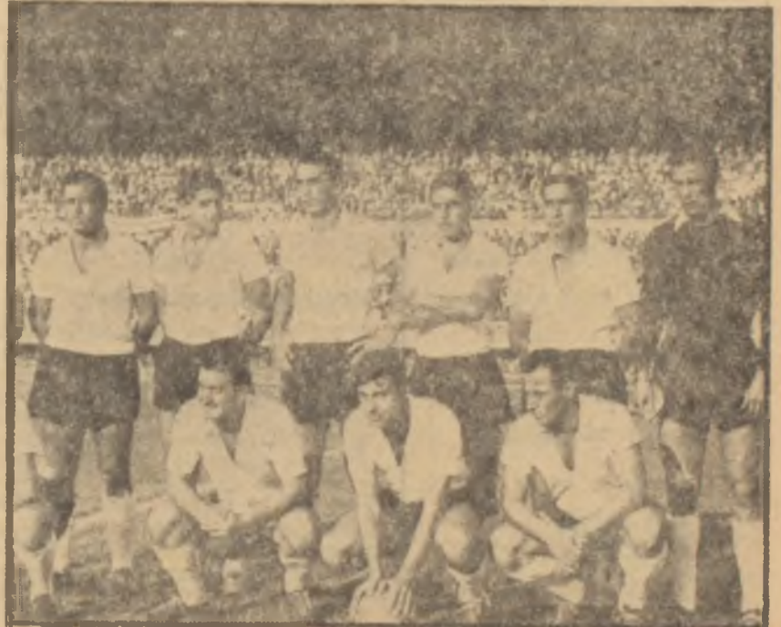
Beşiktaş Futbol Takımı