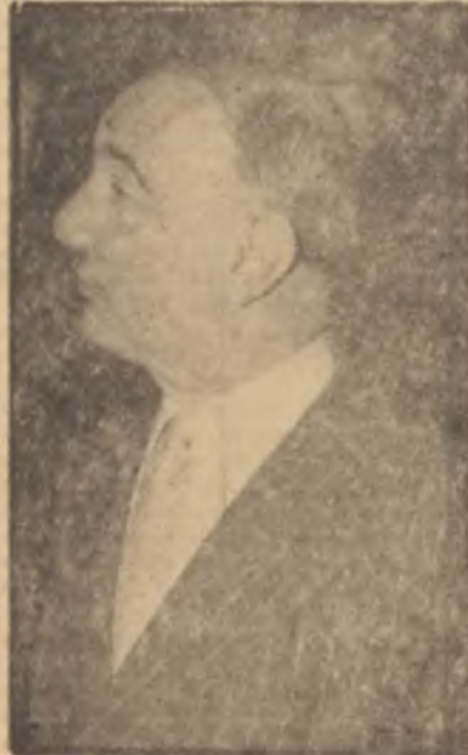
Prof. Fuad Köprülü Sarolistlerin kabusu

Seçimlerin yaklaştığı bu sırada Türkiye'nin üç büyük vilâyetinde üç adam işleri tedvir etme vazifesini üzerine almış benziyorlardı. Bunlar kendilerini "mültehasıs" sayıyorlardı. Müsterek tarafları üçünlün de aynı