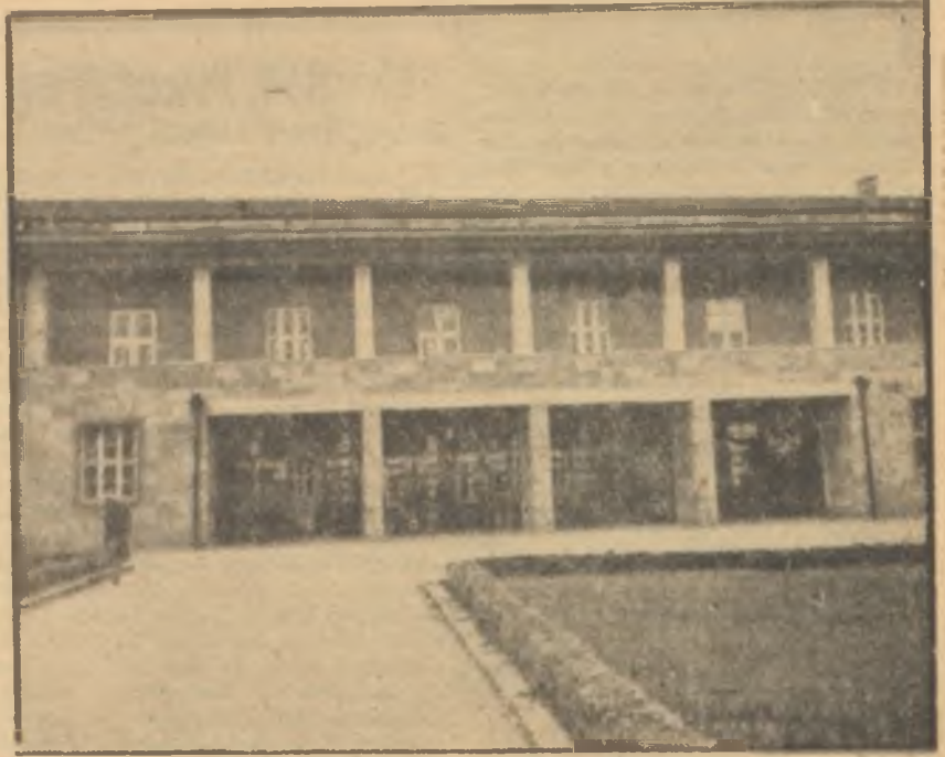
Devlet Konservatuvarından bir görünüş

Konservatuvar aleyhine olmakla beraber Devlet Tiyatrosunun açacağı bu stüdyonun faydadan uzak kalacağı düşünülemez. Madem ki Konservatuvar artık Devlet Tiyatrosunu besleyemez bir hale gelmiştir, müessesenin kanununun müsaade ettiği hudutlar dahilinde başının çaresine bakması elbette hakkıdır. Ancak merak değer bir nokta var: Acaba açılacak olan bu stüdyoda kimlere ders verecek, istikbalin sanatçıları kimler yetiştirecek? Şayet bunlar Devlet Tiyatrosu kadrosunda bulunan ve halen de Devlet Konservatuvarında öğretmenlik yapmakta olan sanatçılarsa Devlet Tiyatrosu Genel Müdürlüğü Stüdyoda ne gibi bir verim bekleyebilir? Şayet bu öğretmenlerin verecekleri tiyatro dersleri stüdyoya hariçten a-