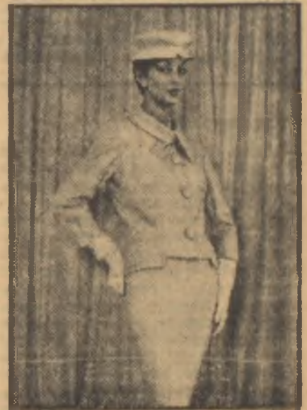
Bir yaz tayyörü Şehre inerken idem