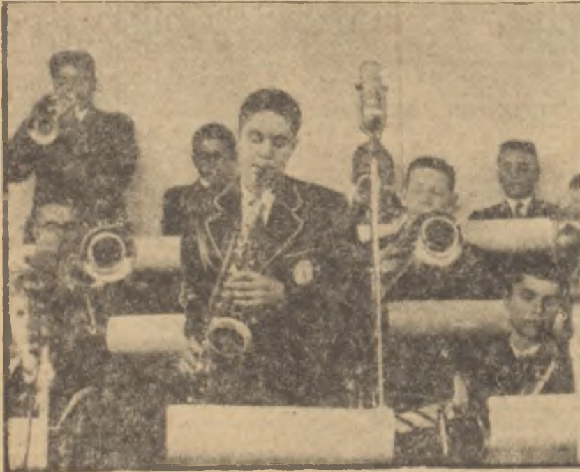
Newport High School'u caz topluluğu Ayakları yere değmiyor ama başları göklerde

Amerika'da, Rhode Island'ın Newport şehrinde ilk defa olarak 1954 yılında yapılan caz festivali, dördüncü yılında artık oturmuş, yerleşmiş bir müessesenin cehresini taşımaya başlamıştır. Bu yıl da Dizzy Gillespie, Louis Armstrong, Count Basie, Erroll Garner, Roy Eldridge, Gerry Mulligan, Dave Brubeck gibi bir çok caz yıldızı, evvelki hafta yapılan açılış töreninde hazırıldılar. O gece, cazın büyük adamlarından Louis Armstrong'un 57 yaşına basması şerefine