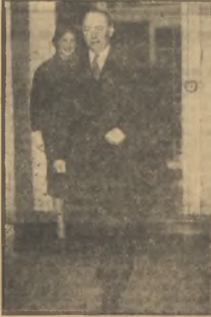
Thorneycroft "Az yiyimiz!"

Fakat enflasyon devam ediyordu. Maliye Bakanı buna başlıca sebep olarak gelirlerdeki artışı gösteriyordu. Ücretler boyuna artmaktaydı. Son yıl içinde maaş ve ücretlerdeki artış aşağı yukarı 900 milyon Sterling idi. Açıkta ki bu paranın satın alabileceği kadar mal bu devre içinde istihsal edilip arz edilemezdi. 900 milyon Sterling çok büyük bir para idi. Bununla şimdiki sağlık teşkilatı yeniden kurulabilirdi. Yahut bu, iki veya üç donanma demekti.