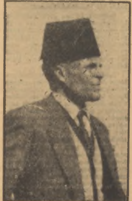
Habib Burgiba Atatürkün teâsi

İngiliz Avam Kamarası, geçen haftanın başlarında, eski müstemlekelelerinden Malezya'ya önümüzdeki 31 Ağustosun itibaren bağımsızlık veren bir kanun tasarısını oy birliği ile kabul etti. Böylece, bir zamanlar İngiliz İmparatorluğunun zengin ülkeleri