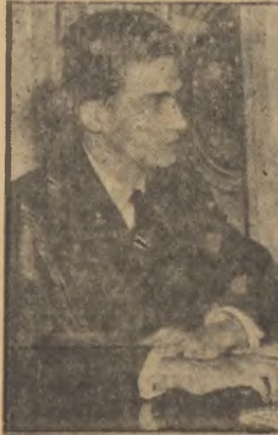
Prens Juan Carlos

İşte İspanya içinde yıldan yıla daha şiddetlenen bu muhalefet cereyanlarının geçen haftanın başlarında