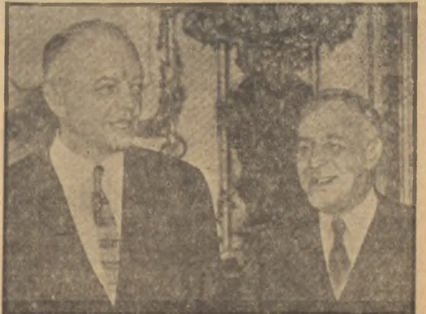
Harold Stassen ve Zorin

İşte geçen haftalar içinde Silâhsızlanma Tâli Komisyonunun bütün çalışmaları Amerikan teklifleriyle