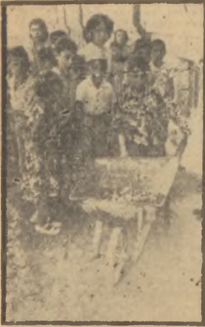
Kampın bahçıvanları Çiçekler herkes için

caba Kızılay çocuklara öğle yemeği verebilecek miydi? Gelecek ziyarette çocuklara yeni oyuncak modelleri getirmeği ihmal etmemeliydi.