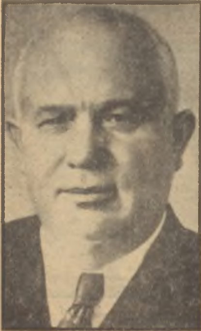
Nikita Krutçef Dizginleri topladı

Aynı tebliğ, Molotof, Malenkof ve Kaganoviç tarafından kurulan parti aleyhtarı grubu iç siyaset sahasında Krutçef tarafından teklif edilen zıral ve sını reformları baltalamış olmakla itham ettiği gibi, dış siyaset sahasında da bilhassa Molotof'u "milletlerarası gerginliği azaltmak ve dünya barışını takviye etmek hedefini güden yeni tedbirlere itiraz etmek"le suçlandırıyordu. Bundan başka Molotof'un Avusturya ve Japonya ile Rusya arasındaki münasebetlerin normalleşmesine mâni olduğu da iddia ediliyordu.