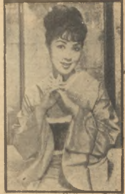
Machiko Kyo "Çayhane" de Göz ziyafeti

Yedinci Berlin Festivalinin insana pek büyük emniyet veren meşhur