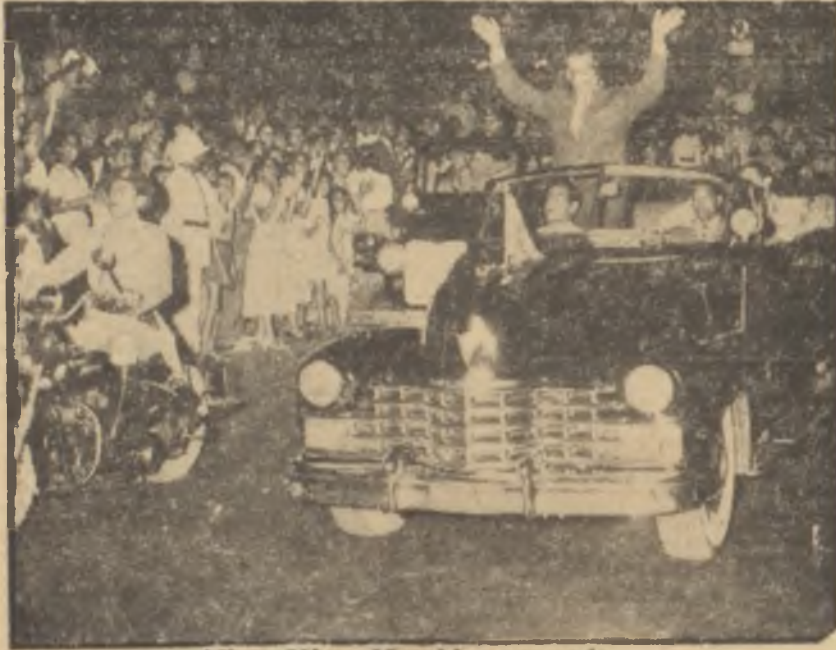
Albay Nâsır Mısırlılar arasında

Geçen haftanın sonlarında Albay Nâsır Batılı devletlere yavaş-