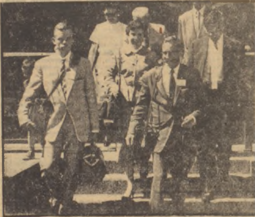
Çiftçi mübadelesi yoluyla gelen, Amerikalılar