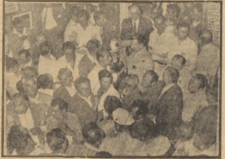
Beşiktaş Kongresinde hararetili bir an