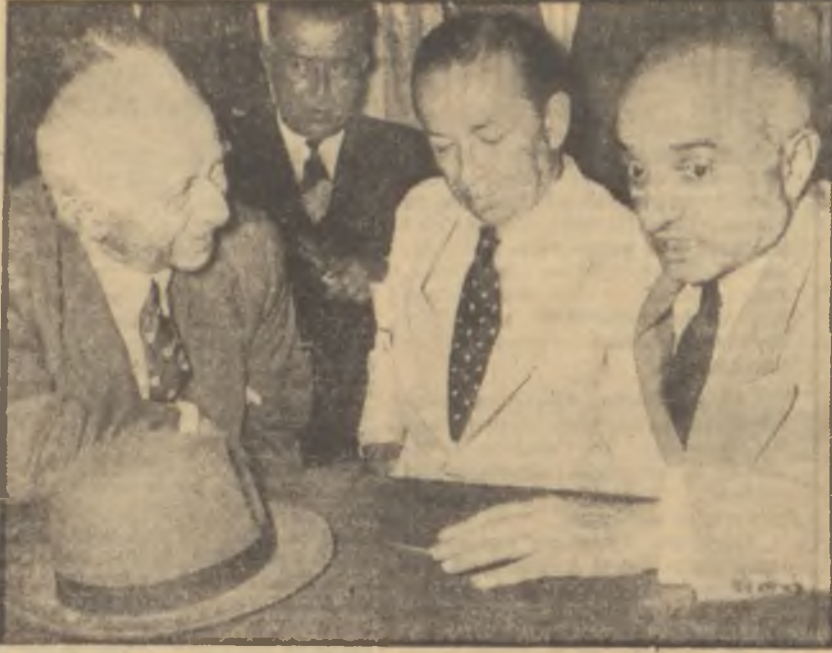
İnönü, Çelikbaş, Tahtakılıç C.M.P. Genel Merkezinde Küldü one koyma zamanı

kes gibi onlar da görüyorlardı ki Türk milletini "Bölükbaşı hadisesi"nde nasıl Osman Bölükbaşının arkasındaydı "Köprülü hadisesi"nde de yüzde yüz Orhan Köprülünün peşindeydi.