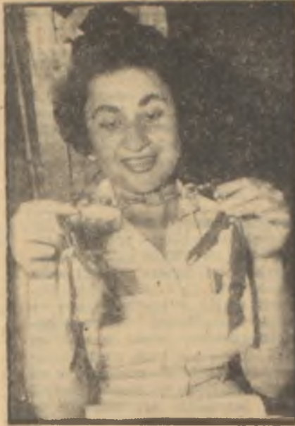
C.M.P. nin gazetecilere hediyesi