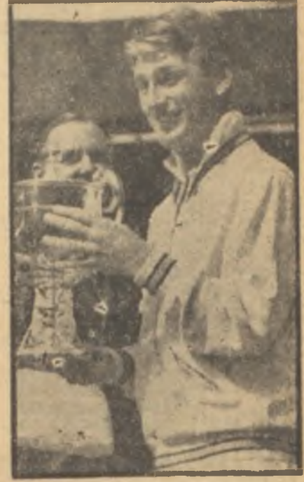
Lewis Hoad Hak edilen kupa

S ekseninci Wimbledon tek erkek finali oynanmadan önce dünya tenis basını filenin iki tarafındakileri şöyle tarif ediyordu: "Bir yanda Avustralyalı Lewis Hoad, 24 yaşında. Geçen sene Wimbledon finalinde, Ken Rosewall'u şahane bir maçla yenerik ünvanını elde etti. Çok kuvvetli bir fileci. For-hand voleleri tutul-