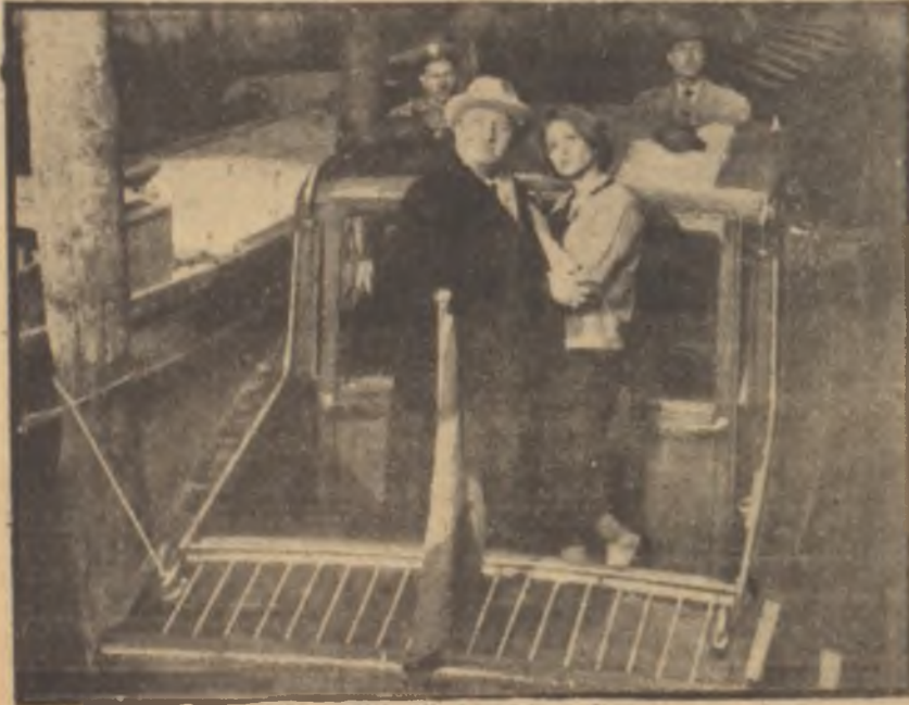
"Kim Biliyor?" den bir sahne Döviz kaçakçılarına Venedik sonu