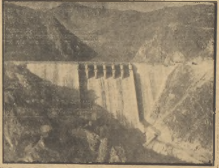
Sarıyar barajından bir görünüş