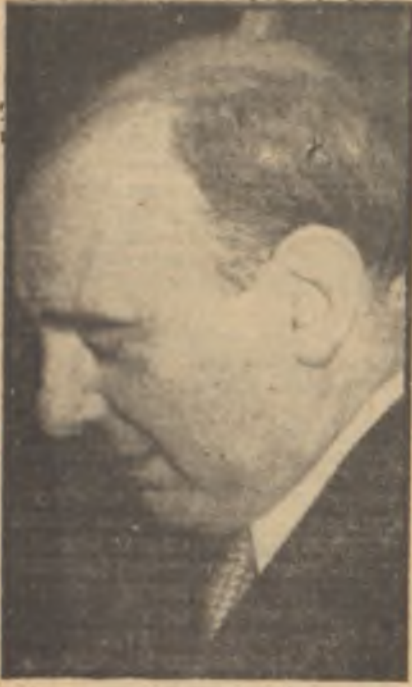
Fuad Köprülü Zamanı gelince...