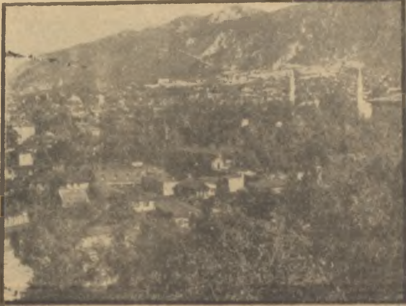
Bursadan bir görünüş Fırınlarnın bacası tütüyor ama...

Hakikatte ise ortada ne grev vardı, ne de greve teşvik bahis mevzuu idi. Bir defa Bursalı fırın işçileri işlerini bırakmadan günde 8 saat çalışmışlar, fakat sadece 8 saatten sonra çalışmayı, yani fazla mesal yapmayı reddetmişlerdi. Bu, işçilerin en tabii bir kanunî hakkıydı. Grev sayılamazdı. Ahmet Çakırın durumuna gelince, o sadece işçilerin fazla mesal yapmamak hususundaki istek ve kararları üzerine ve tamamen iyi niyetle işverenleri ve Belediye başkarnı "keyfiyet"ten haberdar etmişti. Şu halde Ahmet Çakır, niçin tevkif