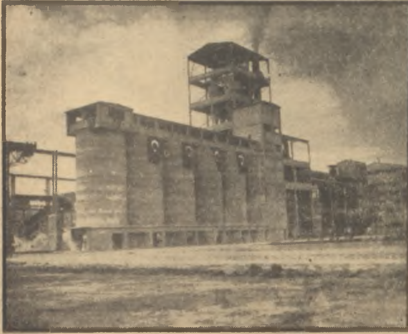
Yeni çimento fabrikalarından biri İstihsal kâfi derecede artıyor mu?

tan kaybetmesi pahalıya mal olmak- tadır.