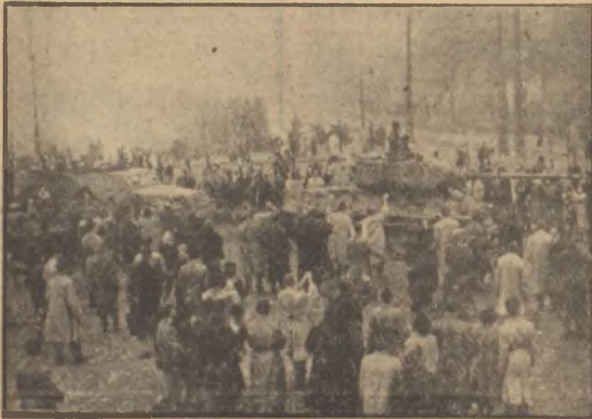
Macaristan hadiselelerinde Rus tankları

Rapor, "Çin halkı içindeki sınıf ve menfaat ayrılıkları" ismini taşıyordu. Demokrasi ile idare edilen memleketlerde hiç de garip karşılanmayacak bu isim komünist rejimde yayınlanan bir raporun başında bulununca, yadırganıyordu. Zira Marksist doktrine göre proleter saltanatının kurulmuş olduğu bir yerde artık sınıf ayrılığı, menfaat ayrılığı diye bir şey bahis mevzuu olamazdı! Sınıf ve menfaat ayrılıkları kapitalist rejimlere has bir özellikti ve proleter hakimiyeti kurulduktan sonra ortadan kalkardı. Halbuki Mao Tse-Toung, yayınlanan raporunda, proleter hakimiyetinin kurulmuş olmasına rağmen Çin'de bu gibi ayrılıkların ortadan kalkmadığından dem vuruyordu. Çin Devlet Başkanına göre, bu ayrılıklar bilhassa işçi sınıfıyla köylüler ve aydınlar arasında hüküm sürüyordu. Bundan başka işçi, köylü ve aydınların kendi aralarında da ayrılıklar vardı. Bu ayrılıklar her şeyden önce cemiyetin menfaatiyle fertlerin menfaati arasındaki çatışmalardan, sonra da memurların bürokratik davranışlarından doğuyordu. Ancak, Çinde sınıf ayrılıklarının olması bu ayrılıkla-