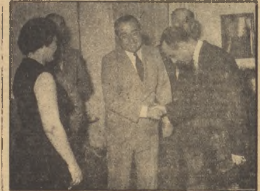
Menderes Mısır Elçiliğinde

Türkiye ve Arap devletlerinin dış politika görüşlerini uzlaştırmak çok güçtü. İsrailden Türk elçisini geri çekmek gibi jestlerle gülleryüz göstermek kimseyi aldatmıyacaktı. Arap dünyası ile Türkiye arasında doldurulması imkânsız bir uçurum vardı. Geçici flörtler "meyvasız" kalmaya mahkûmdu.