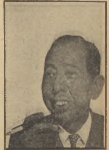
Kishi "U. S. go home!"

Japonların memleketlerinde Amerikan askerlerinin doluşmasından hiç hoşlanmadıkları bir vakiydi. Ame-