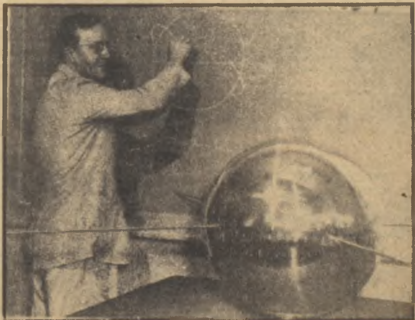
Amerikalıların suni peyki Roketlerin hazırlanmasını bekliyor

Jeofizik senesinin öteki büyük teşebbüsü suni peykerlerdir. Bu peykerler, 400-500 kilometre yüksekteki atmosfer tabakalarındaki hava durumu ve kozmik ışınlar, meteoritler, ultraviyole ışınlar gibi fiziksel şartların meydana çıkarılmasını sağladıktan başka ayrıca uzay yolculuğunun, aya ve seyyarelere gidişin ilk merhalesini teşkil ettikleri için haklı olarak bütün ilim efkârı umumiyesinin merak ve dikkatini üzerlerinde toplamışlardır. Amerikan ilim adamlarının ilk planlarına göre ilk suni peyk bu eylül ayı içinde atılacaktı. Fakat şimdi, bazı teknik güçlükler yüzünden, gelecek bahardan önce ciddi bir deneme yapılamıyacağı haber veriliyor. Suni peykin kendisi - 11 kilogramlık bir küreden ibarettir - ve içine konacak aletlerin hepsi hemen hemen hazırdır. Fakat bu küreyi arzın 400 kilometre üstüne çıkarıp orada arz etrafında onbinlerce kilometrelik bir hız verecek üç kademeli roket sistemi henüz iyice güvenilecek kadar geliştirilememiştir. Bu arada Rusyada da, aynı şekilde bir peykin göğe fırlatılması için çalışmalar yapılmaktadır. İlk peykin gerçekleştirilmesinde Amerikalıların önüne geçmek için Rus ilim adamlarının büyük gayretler sarfettikleri şüphesizdir. Ancak böyle uzun vadeli teknik teşebbüslerde, önce işe başlayan tarafın daima daha avantajlı olduğu düşünülürse, ilk suni peykin Amerikadan uçurulacağı tahmin edilebilir.