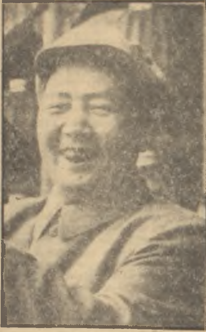
Mao Tse - Toug