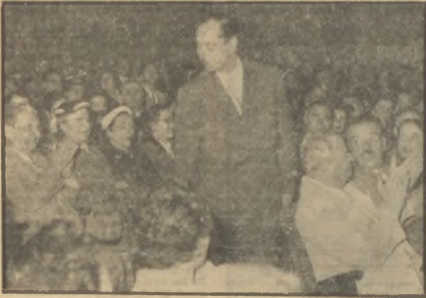
Muammer Karaca seyircileri arasında