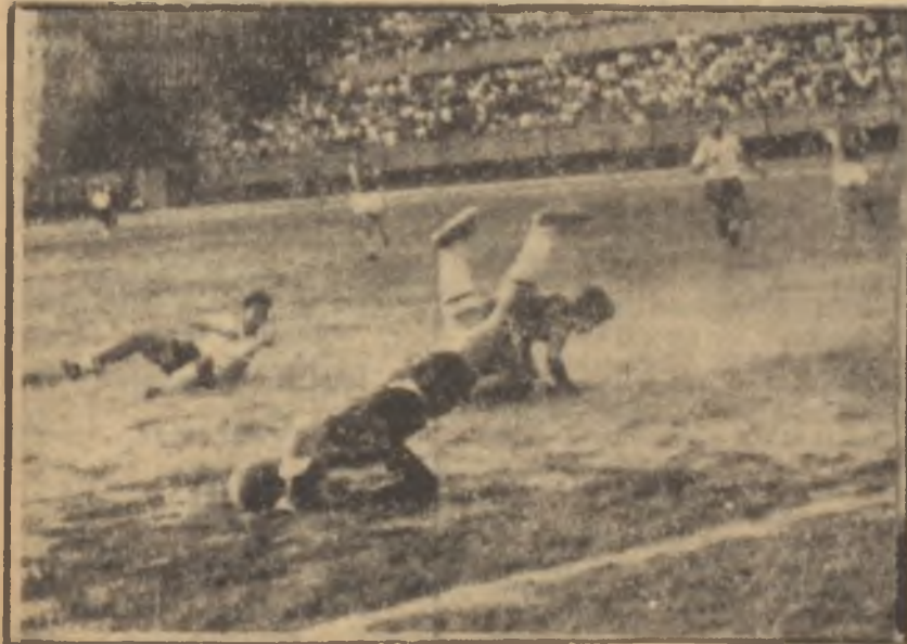
Galatasaray - Altay maçından görüntüs

Bir Türk hakeminin, çirkin teranelerle çınlayan sahalarımızdan çıkarak futbolun bir ilim olarak kabul edildiği memleketlerde maç idare et-