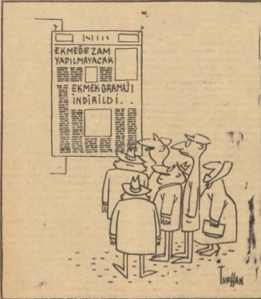
— EKMEĞİMİZLE OYNUYORLAR !

Fabrikanın yıllık imalât kapasitesi 4800 ton civarında olacaktı. Bu miktar, memleketimizin yıllık ihtiyacının yarısına tekabül etmektedir. Fabrika bir yılda 8 bin ton ham madde, 6 bin ton kömür, 2 milyon kilovat saat da elektrik enerjisi kullanacaktır. Hesaplar daha dayanıklı olan kok kömürlü yerine daha kolay ve daha ucuz bulunabilen linyit kömürüne göre yapılmıştı. Memleketimiz linyitlerinin evsafı bu işe uygun geliyordu. Elektrik enerjisi, umumî cereyandan ve muhtemelen Çatalağzı veya Sarıyazın temin edilecekti. İşte geçen haftanın son günü Tuzlada temel atılan ve inşaatı 1958 de tamamlanarak işletmeye açılacak olan Tuzla Porselen Fabrikası öyle ümit ediliyordu ki zaman zaman meydana gelen tabak kuyruklarının kopmasına sebep olacak ve şimdiye kadar porselen eşya için harice ödenen dövizler de yurttan kalacaktır. Fabrika sofralar, çay, kahve takımları, lavabo ve sair sıhhi tesisat eşyası, duvar ve döşeme fayansları ile izolâtör ve diğer elektrik porselenleri imal edecek; memleketin bu sahadaki ihtiyaçlarını karşılayacaktır.