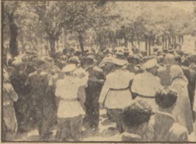
Saat 15'ten önce