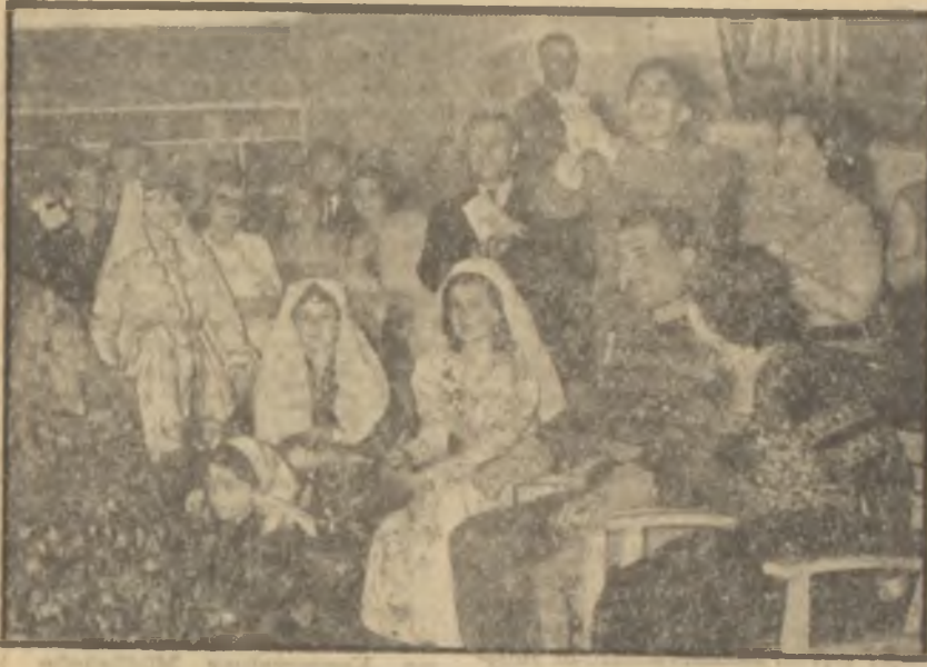
Tenis Klübünde Türk düğünü