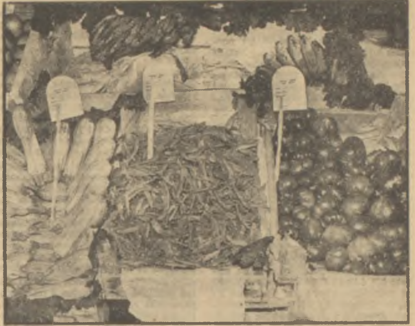
Manav tezgâhında sebzeler