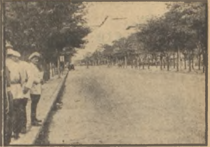
Saat 15'ten sonra