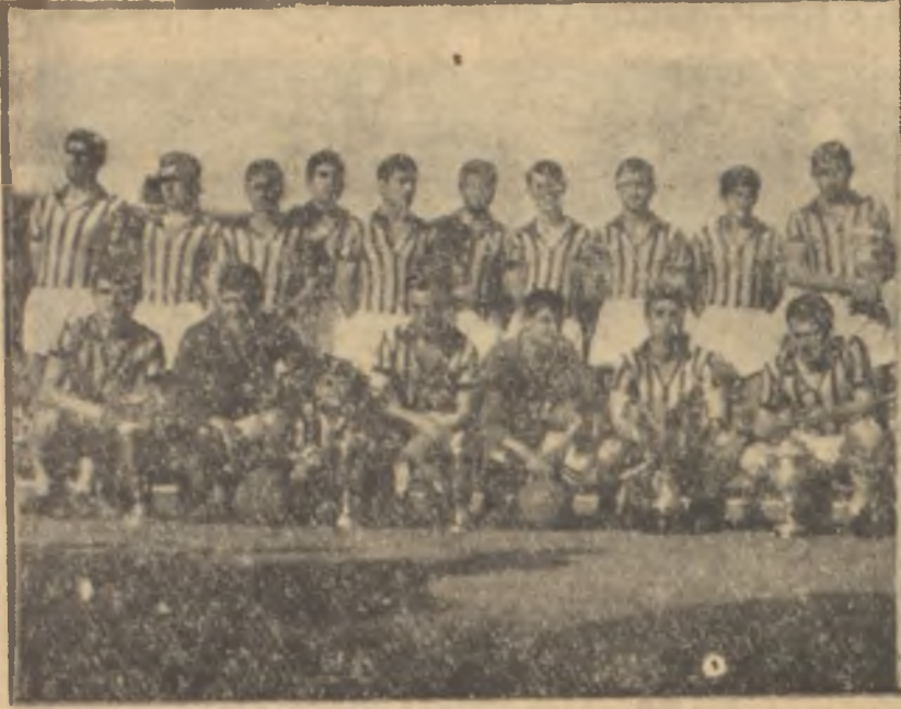
Lig şampiyonu Fenerbahçe takımı