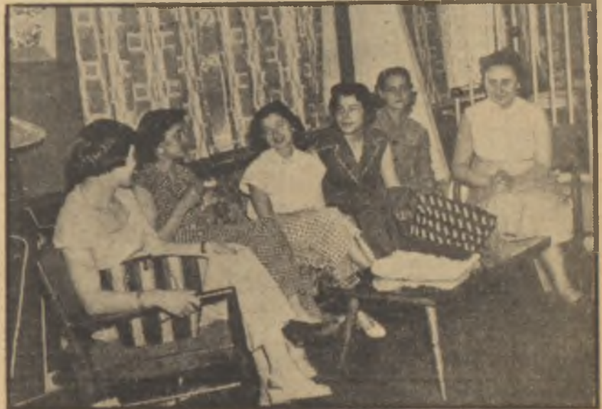
Bütçe hakkındaki konferansı dinleyenler

Cep harçlığı ailenin her ferdine verilmeli ve bu shada fertlere tam bir tasarruf hürriyeti bırakılmalıdır. Çocuk bile parasını kendi arzularına göre ve idare etmesini öğrenecek şekilde kendisi harcamalıdır.