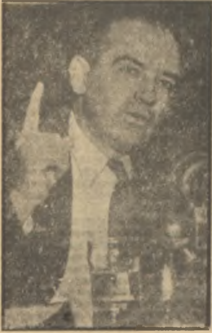
McCarthy İsmi kaldı yadigar