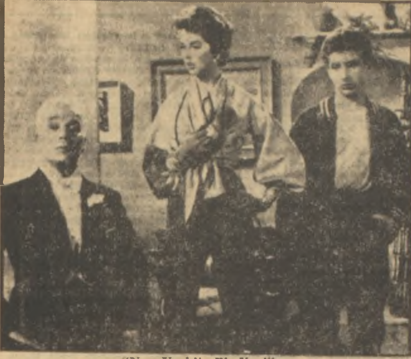
"New York'ta Bir Kral"