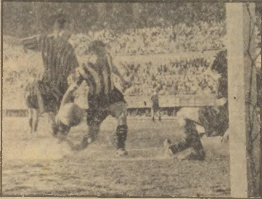
Beşiktaş 3 — Gençlerbirliği: 0

mondini'nin elinde sıkı bir çalışmayla İzmir Şampiyonluğundan sonra, Federasyon Kupasına da iştirak hakkını kazanan Altaylılar, geçen hafta son derece sıkı bir "Futbol harbi" ni 6-0 kazanmış bulunuyorlar. Kendi sahalarda Adananın sertten ileri Millî Mensucat takımı ile oynayan İzmirli, hadise dolu bir maçtan sonra rakiplerini farklı bir mağlûbiyete uğratmışlardır. Bununla beraber Altayın İstanbul maçları hadisesiz geçmeğe namzettir. Sadece iki revanşı değil, ikincilik prestijini ortaya koyarak şampiyonluk ümitlerini oynuyacak olan İzmirin siyah-beyazlıları Birinci Federasyon Kupası maçlarında ikinciliği kazandıkları takdirde her halde İzmirli sevince boğacaklardır. Sıcakların tesiriyle esasen güç seyredilen kupa karşılaşmaları sonuna ulaşırken, İzmir temsilcisininin