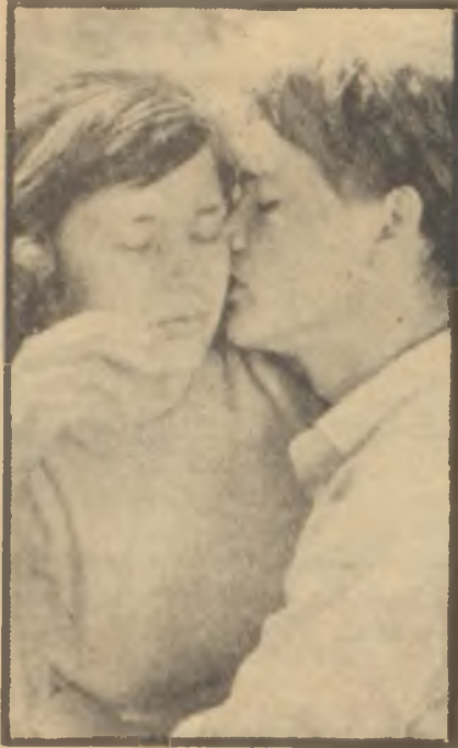
"Monika ile geçen yaz" Isveç usulü...

1954 Cannes Festivalinde armağan kazanan "Cronache di Poveri Aman-ti - Fakir Aşklar Hikâyesi" yle dik-kati çekti. Vasco Pratolini'nin İtal-yan faşizminin ilk yıllarındaki Flo-ransa'yı anlatan aynı addaki roma-nını neorealist bir üslûpla perdeye aktarıyordu. Neorealizmin "sol" ka-nadına mensup olan Lizzani aynı hu-susiyetleri, gazeteciler çevresini ele alan "Lo Svitato" sunda da gösterdi.