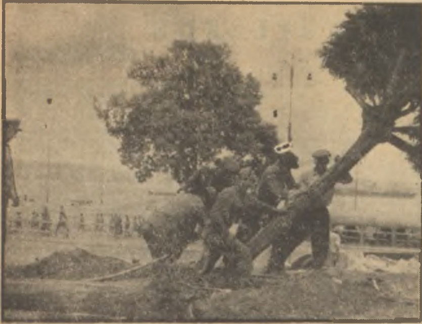
İstanbulun imarından bir görünüş