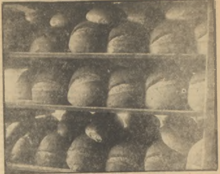
Büyük çoğunluğun esas gıdası: Ekmek Sabit fiyat, noksan vezin

Buğday fiyatlarındaki yükselme, fiyat artışlarına yeni bir hız verecekti. Artan fiyatlar dünya pazarlarında esasen parlak olmayan durumumuzu daha da müşkülleştirecekti. Primlerle yürütülmeye çalışılan ihracat, yeni primlere ihtiyaç gösterecekti. Türkiye Ticaret ve Sanayi Odaları Birliğinin son raporu, prim çıkmasına parmak basmıştı. Halen prim vermeden dışarıya hiç bir mal satılmak durumunda değildik. Halen sayısı 12 ve varan açık veya gizli, sabit veya mütehavvil prim usulü mevcuttu. İhracatımızın % 88 ini teşkil eden 24 kalem ihracat maddesi için ortalamaya % 25 prim veriliyordu. Odalar Birliği, elde sarîh malûmat olmadığı için muhtelif metodlara başvurarak prim miktarını hesaplamıştı. 1956 yılında ihracata 210-215 milyon lira civarında prim ödemiş. Hesap edilemiyen kalemler için 90-100 milyon