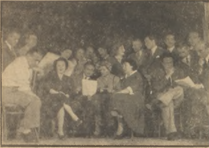
Şehir Tiyatrosunun eski bir turnesi