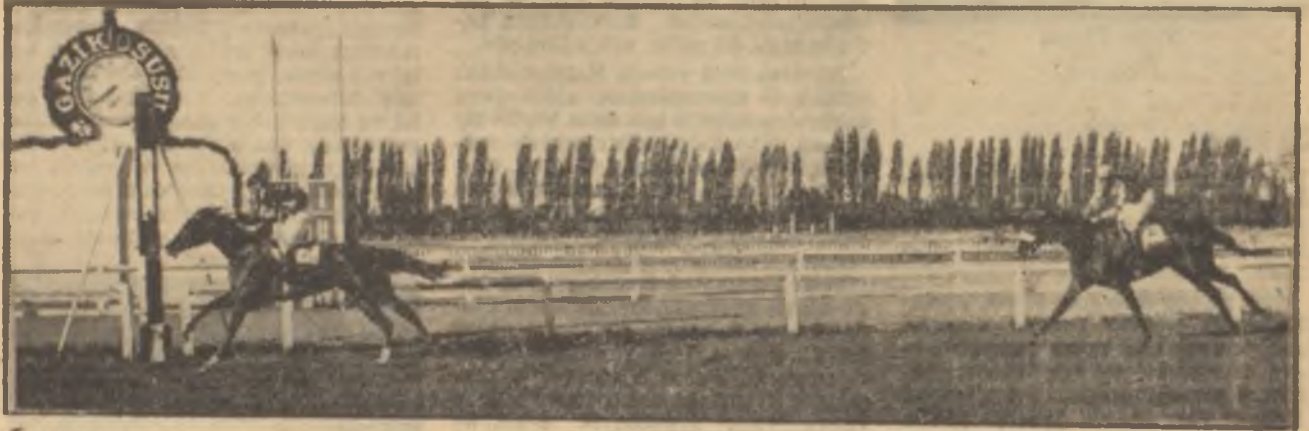
Mirage, Emelin önünde Gazi koşusunu rahatça kazanıyor

bu sene ihdas edilen bir sınıftı. Kocu hayatında bir varlık göstermeye muvaffak olamayan ve yarış pistlerine yeni çıkan safkan arap atlar bu gruba ithal edilmişlerdi. Bu muvaffakiyetsiz atların sayısı bir hayli kabarıktı ve C grubu yarışları en zevkli mücadelelere sahne oluyordu. Bu grubun yarışlarına az ikramiye ayrılması hem adaletsizlikti, hem elden bir türlü bırakılmayan "at neslini islah" bayrağına sadakatsizlikti. Gaye at neslini islah idiyse, çok sayıda vandaşın eline iyi cins atın geçmesi yolundaki çalışmalar teşvik edilmeliydi. Köylünün ve çiftçinin bugün sahip olabileceği iyi cins atlar ise şüphesiz haliskan İngilizler değil olsa olsa yarımkan araplar ve hadi bilediniz safkan araplardı. Halbuki yarımkan araplara karşı yarış bile tahsis edilmiyordu. Yarış hayatından sonra köylü damızlığına geçebilecek safkan araplara karşı takip edilen rejim ise, teşvikten çok tahrir maksadını taşıyordu. Bunun delili C grubu atlara ayrılan ikramiyelerdi. Bu ikramiyelerle bir atın ancak 1000 lirası