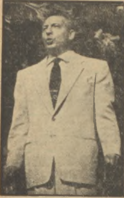
Ezio Pinza Altın ses..