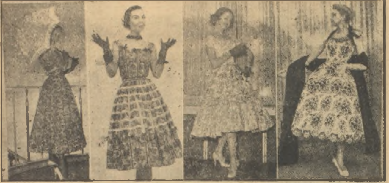
Ucuz kumaşlarla yapılabilecek dört yazlık model