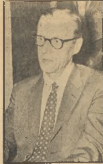
Prof. Nurkse Nabza göre...

halde az gelişmiş memleketlerde ilk yapılacak iş, sabit sosyal sermaye tesislerini kurmaktır. Bu tesislerin bir hususiyeti de ithalinin mümkün olmamasıydı. Amerikadan çelik veya makine ithal edilebilirdi. Fakat yol, baraj ve liman ithali mümkün değildi. Serbest teşebbüse taraftar memleketlerde bile bu iş hükümete düşüyordu. Liberalizmin en parlak günlerinde bile, hükümetler bu işe seyirci kalmamışlardı. Diğer taraftan az gelişmiş memleketlerde tasarruf imkânları bir hayli sayıftı. Dış yardım zarurıydı.