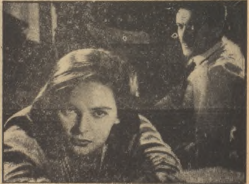
"Bir bisikletlinin ölümü"

Alain Resnais: Lamorisse'le aynı yaşta, fakat "tarzı" bambaşka. Fransız Sinema Enstitüsünde tahsil gören Resnais, sinemanın yaşayan en büyük dokümanter filimcilerindendir. İlk üç filmi "Van Gogh" (1948), "Guernice" (1949), "Gauguin" (1951) sanat üzerine filmlerin en güzel örneklerindendi. Resnais "Les Statues Meurent Aussi - Heykeller de Ölü" (1954) filmiyle, evvelce çevirdiği sanat üzerine filmleri bundan sonra çevireceği dokümanterlerle birleştiriyordu. Ortaya bir yandan Afrikadaki zenci sanatının en güzel eserlerini tanıtan,