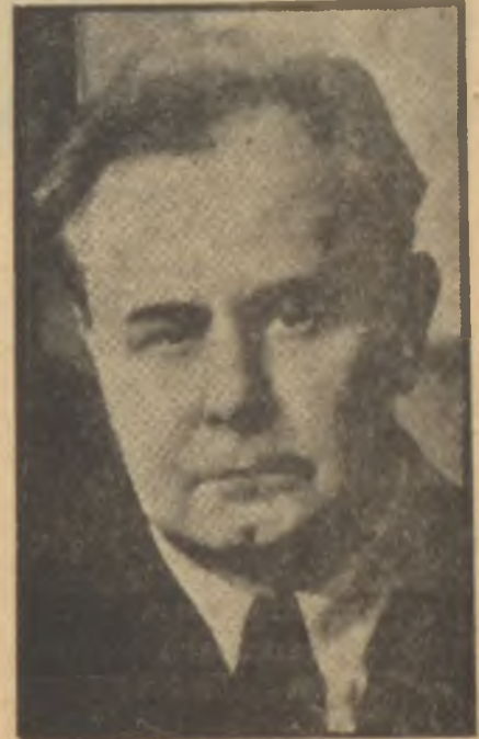
Josef Hofmann İnce bir teknik

"Duygunuz var; fakat bu gerektiği gibi belirmiyor. Kulagınız var; fakat bu bir iç kulak. Yapmak istediğinizi duyuyorsunuz; ama bunu gerçekleştiremiyorsunuz. Teknik kolaylığınız var; fakat bu henüz ifadeli bir teknik olma seviyesine yükselememiş. Ritminiz var; fakat bu ritim tabii ve temelli bir nabız atma haline gelememiş. Sizde şimdilik eksik olan şey bilgi; piyanistliğin ve musikinin ana prensipleri hakkındaki bilgi. Çalışmanız hakkında hüküm verecek, çalışmanızı düzeltecek ve inceltecek ölçülere malik değilsiniz".