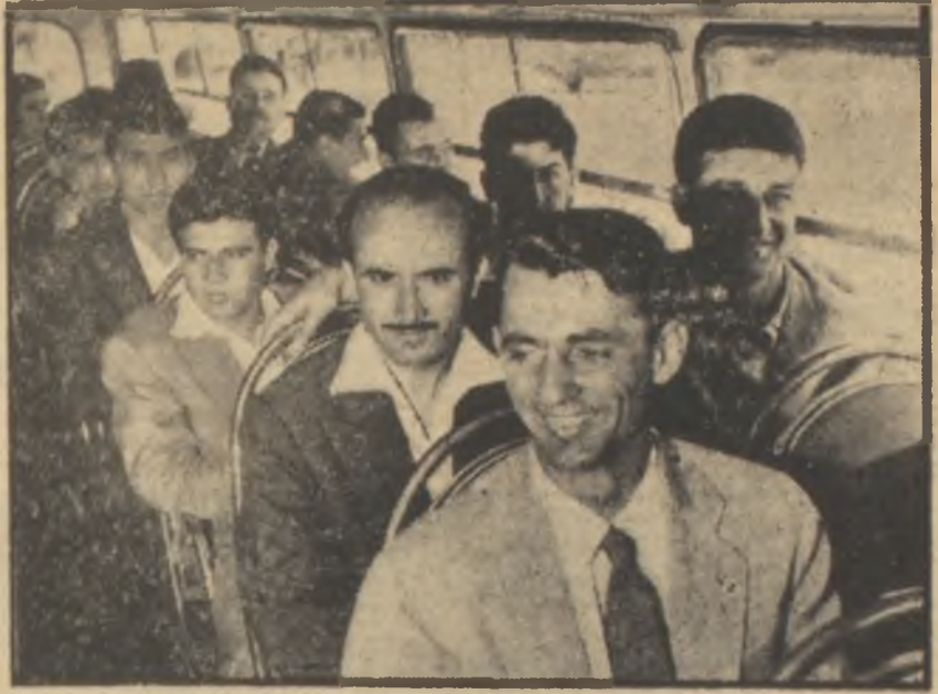
Fenerbahçeliler Almanya seyahatinin başında