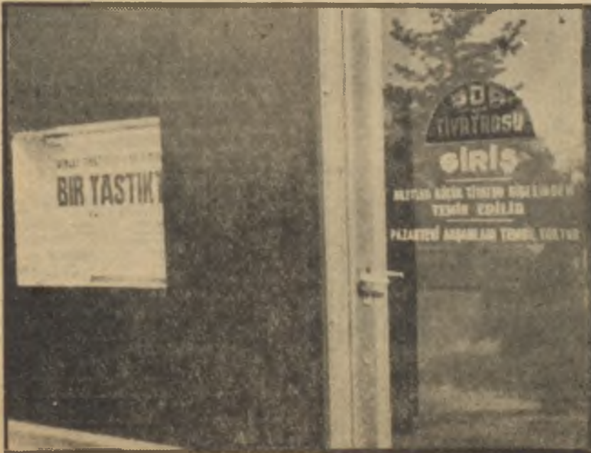
Oda Tiyatrosunun girişi