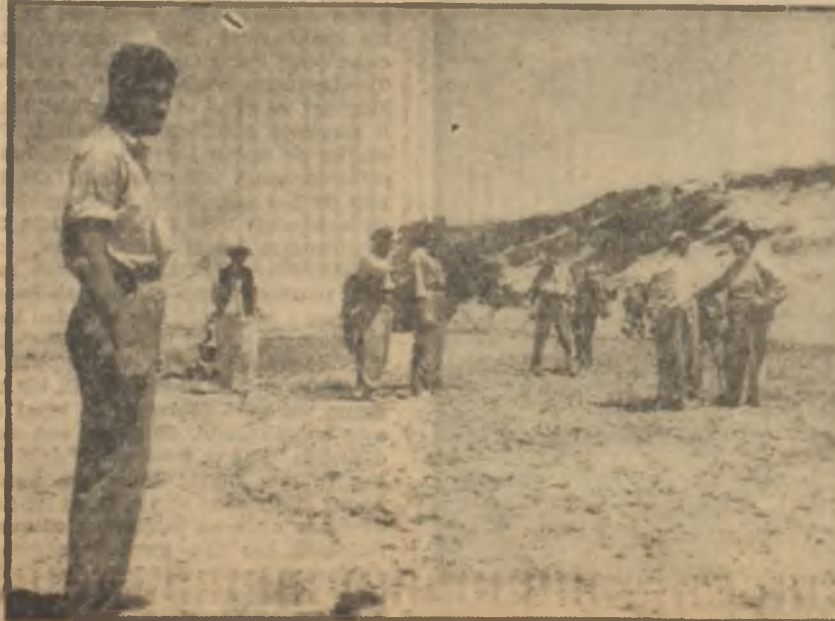
"Ak Altın"dan bir sahne Yedi kişi rejisörünü arıyor