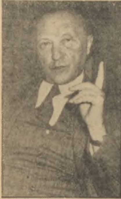
Adenauer Seçim turnesinde

Gene aynı mesajında, Başkan Eisenhower iktisadi ve teknik Amerikan yardımı üzerinde de duruyordu. Başkan Eisenhower'e göre bu yardımlar, geri kalmış memleketleri bağımsızlıklarını korumak için gerekli siyasi ve sosyal gelişmelerinde şimdiye kadar teşvik etmişti ve şimdiden sonra da etmesi gerekiyordu. Ancak bu yardımların günün şartlarına daha uygun ve daha devamlı olarak yapılabilmesi için, geri kalmış memleketlere uzun vadeli borç verecek bir "iktisadi kalkınma için ödünç verme fonu" kurulmalıydı. Başkan, Kong-