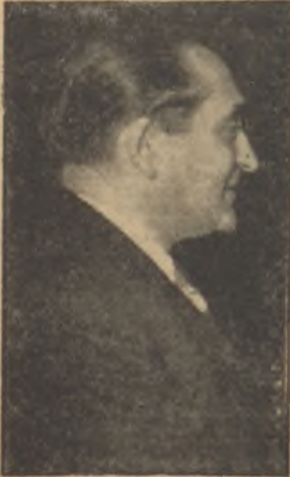
Mendès - France İçki kolaylaştırıcı istifa

mekle beraber, ikinci hal şekli şimdi-lik daha kuvvetli görülmektedir. Parlamento tahminlerinde bulunmayı, at yarışlarında bahsi müstereklerle girişmek gibi itiyad haline getirenler, şimdiden ortaya bazı isimler atıyorlardı. İlk akla gelen isim U. D. R. S. partisi ileri gelenlerinden Pleven idi. Cumhurbaşkanı Coty, şimdiden Pleven'i durumu aydınlatmak için istişarelerde bulunmakla vazifelendirmişti. Pleven, Dördüncü Cumhuriyetin hayatına sıkı sıkıya karışmış simalardandı. Harp sonu enflasyonunun başlıca mesuliydü Hindi Çini mağlûbi yeti sırasında Savunma Bakanıydı. Sağcılar Pleven'in başbakanlığını her halde sevinçle karşılayacaklardı. Avrupa Birliğine taraftar olması Sosyalistlerin hoşuna gidecekti. Fakat birçok Sosyalist, Pleven'in Dien-Bien-Phu faciasındaki rolünü henüz unutmamışlardı. Diğer bir U.D.R.S. mensubunun da adı başbakanlık için sık sık söyleniyordu: Mollet'nin Adalet Bakanı Mitterand. Mitterand, Sosyalistlerin kolayca kabul edebilecekleri bir adamdı. Fakat Mitterand'ın Cezayir hakkındaki oldukça liberal fikirleri mutedilleri korkutuyordu. Mollet'nin diğer bir bakanının, Cezayir politikasına hararetle taraftar radikal Billères'in adı da favoriler arasındaydı. Fakat Billères'in kendi partisi içindeki durumu pek kuvvetli değildi. Hiç değilse Mendès-France taraftarı redikaller reylerini ondan esirgiyeceklerdi. Halkçı Cumhuriyetçilerin şeflerinden Pflimlin'in hükümeti kurma şansı oldukça kuvvetli gözüküyordu. Edgare Faure'un Maliye Bakanı, sağcılarının mali mese-