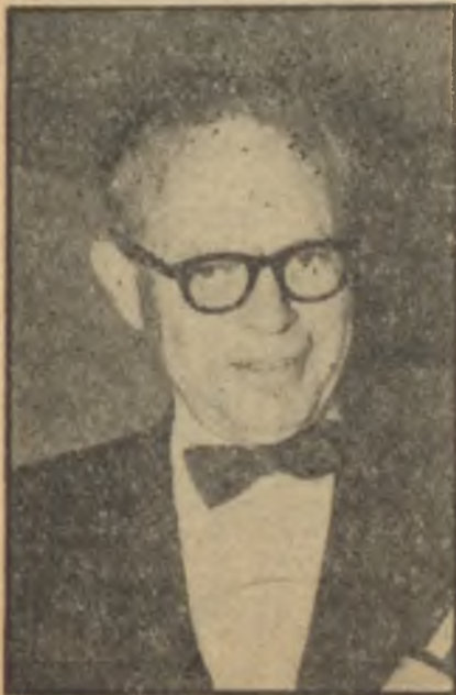
Gardner Cowles Amerikalı aklı!

Amerikanın meşhur Look mecmuası sahibi Gardner Cowles Hindistandan İstanbul'a geldi ve Kıbrıs meselesine dair fikri sorulunca şu beyanını verdi: "Amerikan efkârı İngiltere'nin Kıbrıs meselesini halletmesini candan arzulamaktadır. Fakat İngiltere bu işi kısa zamanda başaramadığı takdirde, Amerikan halkının ekseriyeti Kıbrısın 10 ilâ 15 yıl için NATO idaresine verilmesine taraftardır. O müddetin sonunda da plebisit yapılır".