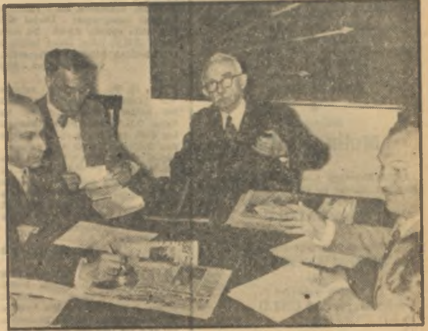
C.H.P. Meclisi toplantı halinde

İşte Bayındır sokak No. 35 teki C.H.P. Genel Merkez binasında Parti Meclisi toplantısı daha oturumun ilk dakikalarında böylece hararetlendi. Sonra üyeler konuşmağa başladılar. Son üç ayın hadiseleri teker teker dile getiriliyor ve bu arada bilhassa Bahar Havası üzerinde ısrarlı ve tenkitçi bir şekilde duruluyordu. Bu arada bazı üyeler teşkilâtla yaptıkları temasları belirtiyor ve bilhassa partinin genç mensuplarının Bahar Havası karşısında duydukları hüsrana tercüman oluyorlardı. Teşkilât açtıktan açığa Genel Başkanı muahaze ediyordu. Hele Zafer gazetesinde D.P. Genel Başkanıyla başbaşa çekilmiş resimler bu tenkitlere cerez vazifesini görüyordu. Zira o güler yüzlü resimlerin çekildiği gün-