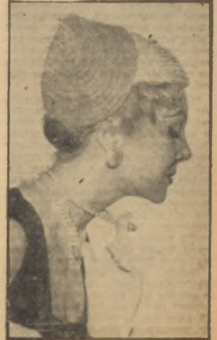
Bir hasır şapka

Fakat bu yaz hasır yalnız hafif saatlerin hafif ihtiyaçlarını karşılamak için kullanılmamıştır. Akşamın en şık saatlerini hasır şapkalar, hasırdan yapılmış ince zarif çantalar karşılamaktadır.