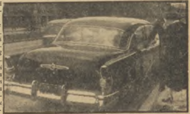
Ulusta çıkan resim

Bu hafta Ulus gazetesi Çalışma Bakanının hamısını, zevci Ankara-