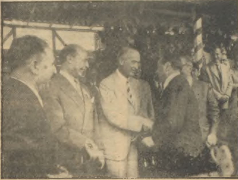
Alfreid Krupp ve Menderes elele