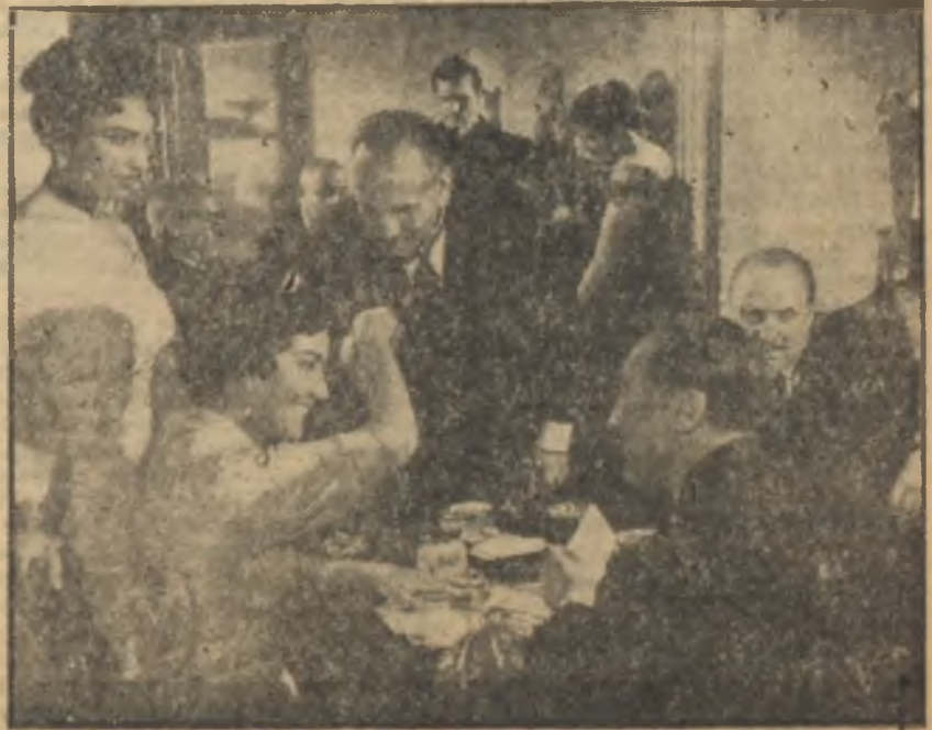
"Beş Hasta Var"

Oyunculara rol dağıtımı da bir mesefe olarak meydana çıkıyordu. Sinema oyunculuğunun ilk şartı o-