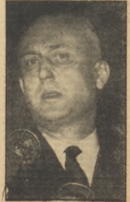
Pflimlin Bicilmiş kaftan