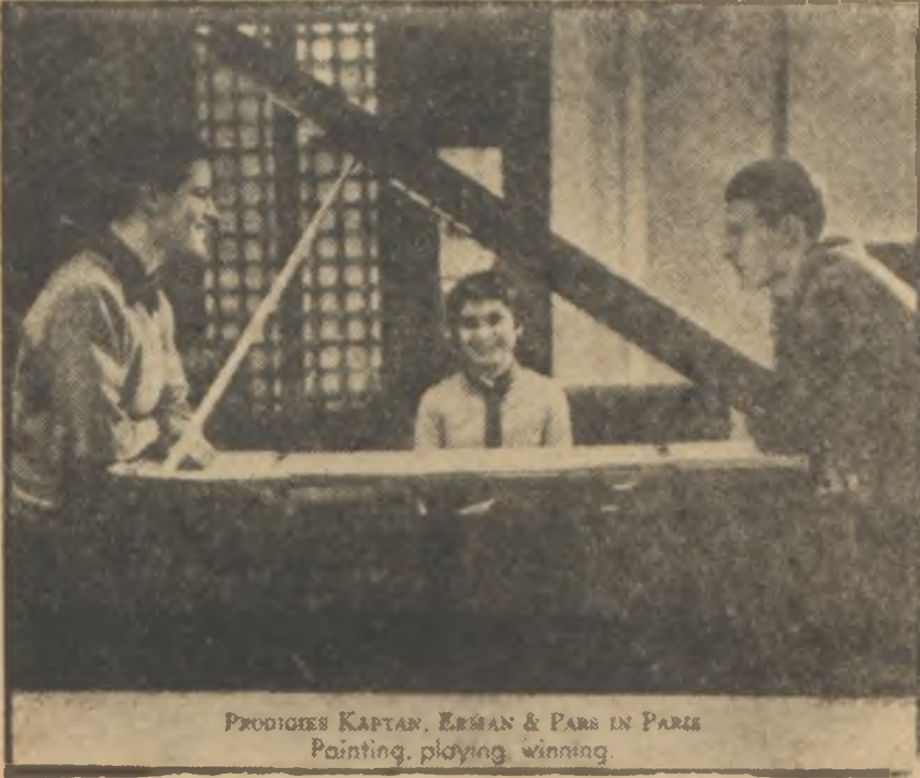
PRODIGES KAPTAN, ERMAN & PARS IN PARIS Painting, playing, winning.