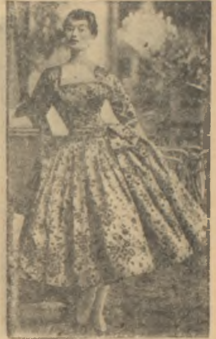
Güllü bir elbise

Baştan aşağı pliseli elbiseler pek revaçtadır ve ekseriyetin beli sıklıkla, elbiseden çıkan bir kemerle hafifçe gösterilmiştir.