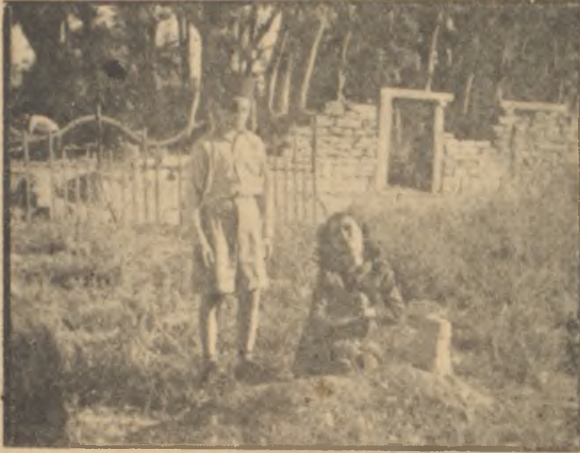
Bol gözyaşı ve mezarlıklı bir sahne