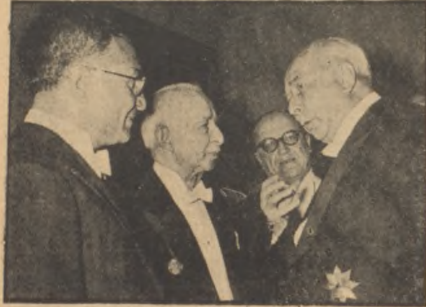
Dr. Heuss ve İnönü Hariciye Köşkünde

Bu haftanın ortasında Çarşamba günü, İktidarın meşhur nâsiri