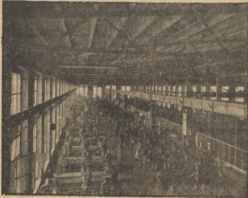
Batı Almanyada yükselen yeni bir fabrika

Demir-çelik istihsalı birimi başına yatırım payı da artacaktır. Çünkü yeni yeni çelik fabrikaları kurulması gerekecektir. % 30 nisbetinde artmış bir demir-çelik talebini karşılayabilmek için yıllık ham çelik istihsalı 77.5 milyondan 103 milyon tona çıkarılmalıdır. Mesken inşaatı sahasındaki yatırımlarda % 17 kadar bir artma olacağı tahmin edilmektedir. Son beş yılda inşa edilen meskenle-