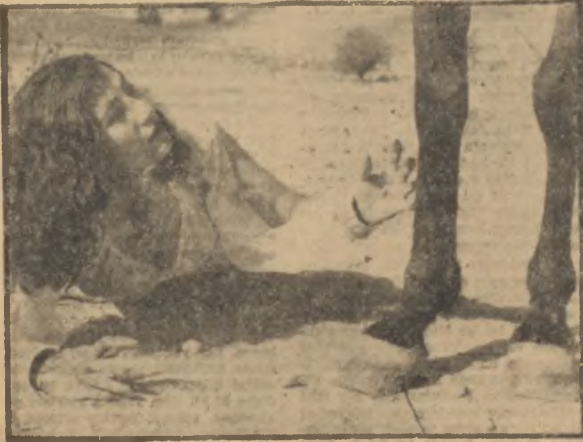
Yerli filmlerimizden bir sahne Taşkızak tezgâhlarında atom denizaltısı..

Husulî teşebbüsün sinemacılık çalışmalarını yürekler acısı bir durumdakiydı. Piyasada akıl almaz Ali Cengiz oyunları dönüyordu. Bazı film şirketleri bu meslekte kısa yoldan zengin olmanın ilâcını bulmuşlardı. Film karaborsası film çevirmekten çok kârlı bir işti. 150 liralık negatif