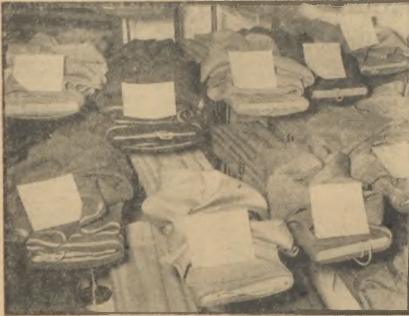
Bir kumaşçı vitrininden görünüş