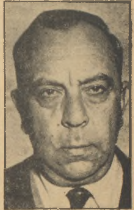
Dr. Fazıl Küçük