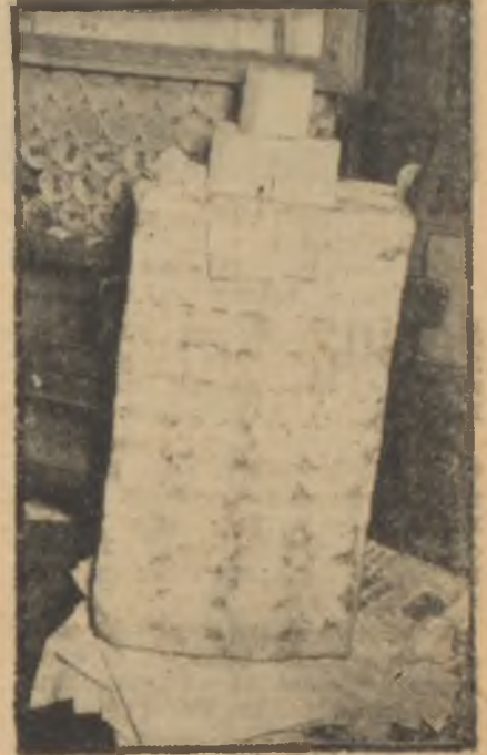
Bir çuval sabun

Kararın ilk neticesi kopmak bilmeyen kuyruklara bir de sabun kuyruğunun eklenmesi oldu. Zeytin yağından imal edilen sabunların mevcudu tükendikten sonra kuyruk koptu. Artık sabunlar don yağından imal edilecekti. Türkiye'nin don yağı istihsalı bu maksada yetecek kadar fazla olmadığından Amerikadan don yağı getirilecekti. Fakat henüz sabun imalatçıları Amerikan yağlarına kavuşmuş değillerdi. Bu yüzden sabun istihsalı azalacaktı. Üstelik bütün sabun imalâthaneleri don yağını kullanacak vasıfta da değillerdi.