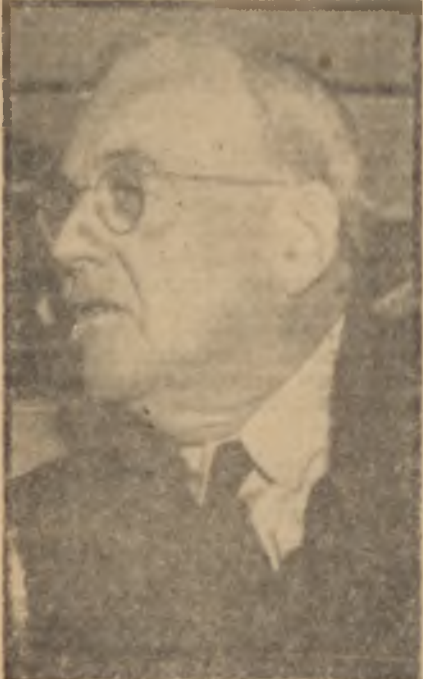
John Foster Dulles

Bu sırada Kral Hüseyin örfi idare ilan ediyor, seçimlerden galip çıkan siyasi partileri dağıtıyor, liderlerini hapsediyor, bir sürü subayı ordudan uzaklaştırıyor, talebe teşekküllerini ve gazeteleri kapatıyordu. Kral Hüseyine göre Ürdün, "milletlerarası komünizmin tecavüzüne" uğramıştı. Bilindiği gibi Eisenhower