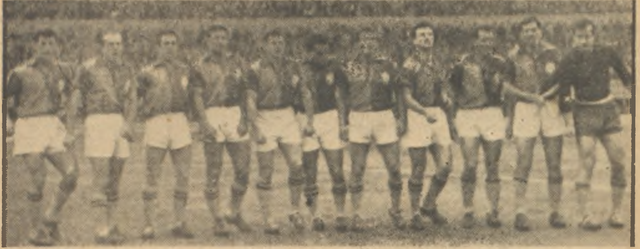
Talihsiz Galatasaray onbiri