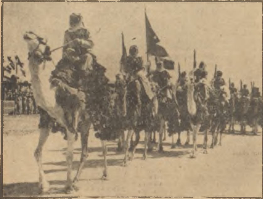
Ürdün ordusundan hecin-süvalar

Bayramın birinci günü, Ürdün halkı sokağa çıkma yasasına