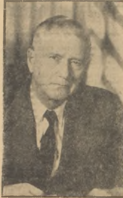
James P. Richards

Şimdi Amerika Sovyet Rusyanın sulh teşebbüsüne nasıl ve ne şekilde mukabele edecekti? Bir kısım liderler, Rus teşebbüslerini müsbet karşılıyorlardı. İki blok arasındaki yakınlaşma ve kültürel münasebetle-