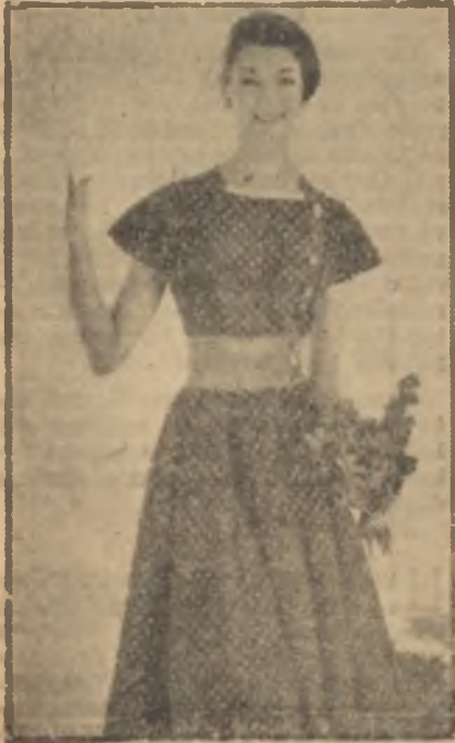
Puanlı bir rob

İngiltere krallığının Parisi ziyareti moda merkezinde bazı ilham-