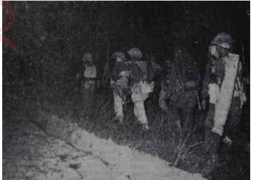
Sina çölünde İsrail askerleri

İsrail bu dunun karşısında ne yapabilirirdi? İsrailde Ben-Gurion aleyhtarını nümayişler günden güne şiddetini arttırıyordu. Gazze'yi yeniden