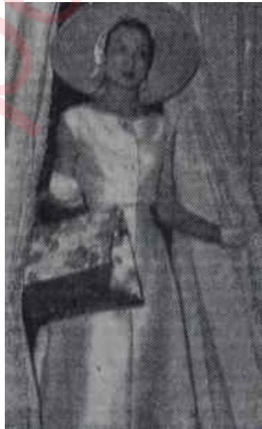
1957 İlkbahar modası

İ lkbahar modası, Parisli birkaç büterzinin ortaya attığı yeni hatlar ve yeni buluşlar demektir. Bu büyük terziler umumiyetle ana hatlarda birleşirler. Fakat bu sene 1957 ilkbahar ve yaz modasına girerken Pariste tertip edilen defileler, her terzinin daha ziyade kendi kaprislerine göre hareket ettiğini, müşterek hareket noktalarının eskisi gibi kat'i ve belirli olmadığını göstermiştir. Bu sene muayyen bir hat yoktur. Bütün koleksiyonlarda nazarı dikkati celbeden şey, geçen senenin "hürriyet" ve "yumuşaklık" vasıflarının iyice benimsenmiş olmasıdır. Bu sene yaz modası, hafifliği ve yumuşaklığı ile kadınları cezbedecektir. İpekliler yaz