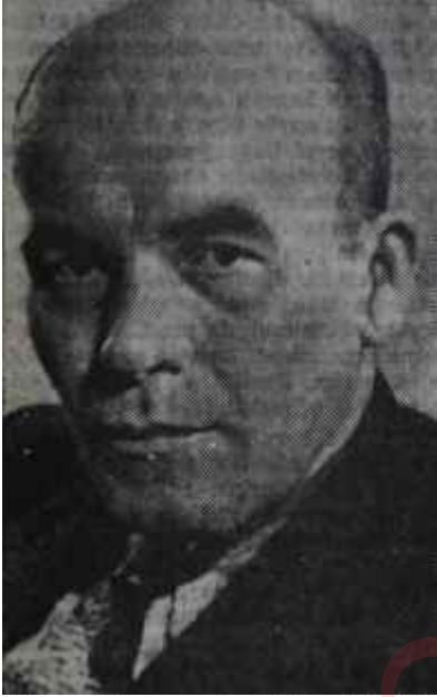
Gomulka Dolar peşinde

Washington'da bulunan Polonya heyeti geçen hafta Amerikan hükümetinden 300 milyon dolarlık bir yardım talep etti. Bunun 200 milyonu Amerikadan buğday ve pamuk ithaline tahsis edilecek ve Polonya parasıyla ödenecekti. Geri kalan 100 milyon dolar, İthalat - İhracat Bankasının açacağı kredilerle makina ithaline tahsis edilecekti. Polonya Amerikadan 300 milyon dolar isteyen ilk memleket değildi. Fakat "Sam Amca" nedense bu 300 milyon dolar lâfından pek hoşlanmıyordu. Ama bu sefer hiç değilse kanunî mazeretlere sahipti. Kanunla 300 milyon dolar olarak tesbit edilen buğday, ve pamuk