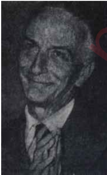
Segni Vakit tamam

Türk aydınları. Gençler, üniversiteliler, yargıçlar, profesörler, memurlar, gazeteciler.. Figaro yazısına, bu bahiste yanlış olduğunu mutlaka ispat etmelisiniz.. Türk ruhunda bu yılının yeniden çöreklenmesine mutlaka mâni olmalısınız.