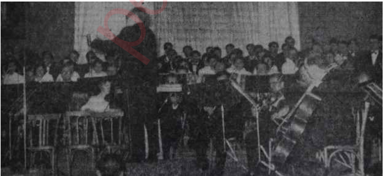
Gazi Eğitim Enstitüsü korusu Üniversite konserinde

Konserin üç cepheli başarısızlığı gene, musiki eğitimine, halkın musiki kültürüne ve resmî makamların, musiki müesseseleri ile olan mün-nasebetlerinde gösterdikleri ihmal ve anlayışsızlığa müteallik birkaç meseleye ışık tutuyordu. Bir kere Gazi Eğitim Müzik Bölümü Koro-su geçen yıla nisbetle bariz bir gerileme göstermişti. Bu koro, Enstitünün musiki öğretmeni, Eduard Zuckmayer'in eseri idi, bir yıl önce bu zamanlar ilk konserlerini verdiği zaman büyük takdir kazanmış ve parlak bir istikbal vaadettiği hususunda herkes birleşmişti. Aslında bu teşebbüs bazı idarî sebebler yüzünden, hiç de parlak bir istikbal vaadefimiyordu. Koronun önce belirti bir icra seviyesi tutturması sonra da bu seviyeyi yükseltebilmesi için koroyu çalıştıran Herr Zuckmayer'in, öğrencileri arasından, üyelerini iste-diği gibi seçme ve devamlı bir kadro meydana getirme selâhiyetine sahip bulunması lazımdı. Halbuki geçen yıl Enstitüden mezun olanlar yurdun dört' köşesinde öğretim vazifeleri almak üzere Ankara'dan -ve korodan- ayrılmışlardı. Bu yıl koro personelinin yeni baştan kurmak ve çalışmalara yeniden başlamak lüzumu hasil olmuştu. Bu gidişle her yıl aynı durum tekrerrür edecek, koro her yıl yeniden kurulacak ve -şüphesiz- bir ilerleme