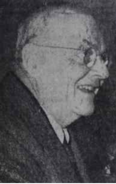
John Foster Dulles

Bir ip te iki cambaz; biri genç, biri ihtiyar