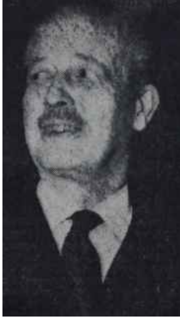
Başkan Eisenhower - Başbakan MacMillan