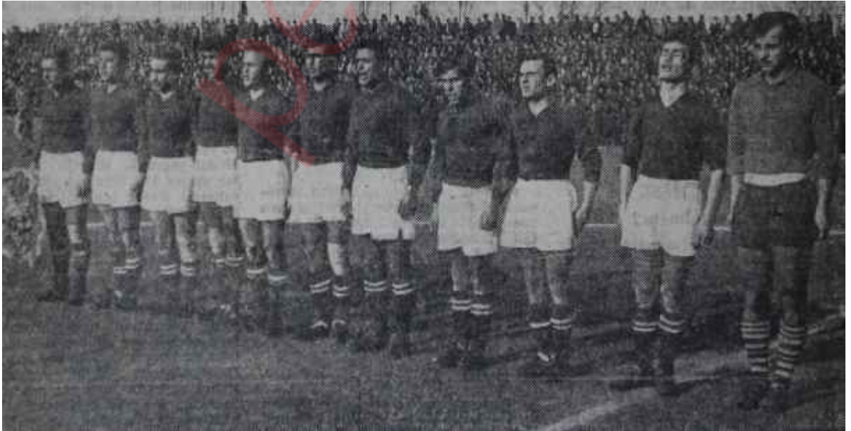
Türk Ordu takımı İtalyanlara karşı istikrarlı

Cumartesi maçında da Fenerbahçe ve Beşiktaş galibi Beykoz, Emniyet ten -o da sonunculuk namzediydi- pa-