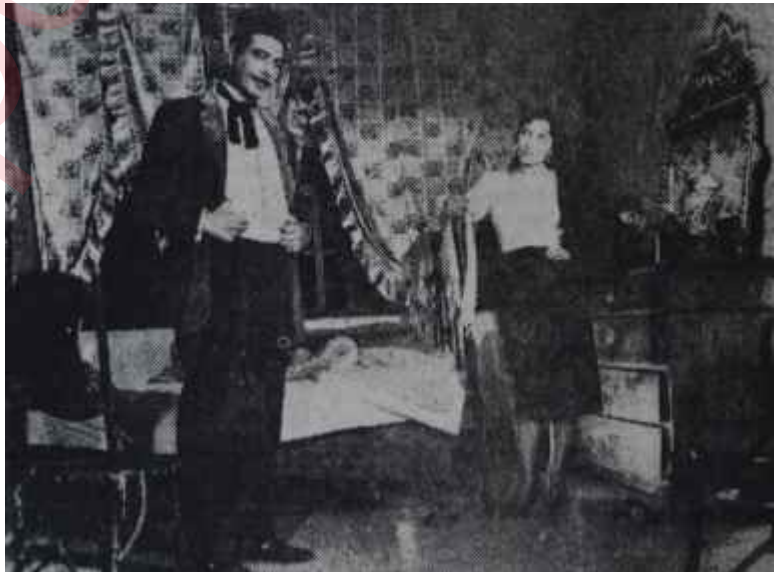
'Beş Hasta Var' dan bir sahne

"Beş Hasta Var"ın dikkat çekici tarafı, tehlikeli bir temayülü ortaya koyması: Fasit bir daire içinde dönüp dolaşan, klişe olaylar, klişe tiplerle dolu olan konu rejisörü "şekilcilik" e yöneltiyor. Hep aynı şeyleri velev yip duran küçük küçük olayları alâka çekici bir kılığa sokmak için rejisörün gayreti dekorlara, kostümlere, görüntü düzenlemelerine çevrilmiş. Aranmış kamera açılan, "pittoresque" dış manzaralar, aynı pozda iki insanın büyük planlarıyla yapılan geçişler hep bu "şekilcilik" endişesinin neticesi. Bu durum, belki gelişmemiş bir seyirci topluluğunu oyalay, aldatılabilir ama rejisörün de kendi kendini aldatması gibi kaçınılmaz bir yola çıkar.