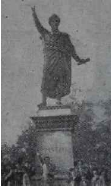
Petöfi'nin heykeli "15 Martta buluşalım"

rı çoktan beri Budapeşte sokaklarında kulaktan kulağa fısıldanıyordu. Bu şayialar kukla Kadarın kulağına kadar gitmişti. 15 Mart sabahı 1848 ihtilâlinin kahramanlarından şair Petöfi'nin heykelinin altında telsizle mücehhez bir polis otomobili bekliyor ve makineli tüfekleri dizlerinin üzerinde polislerle dolu arabalar Budapeşte caddelerinde vızır vızır devriye geziyorlardı.