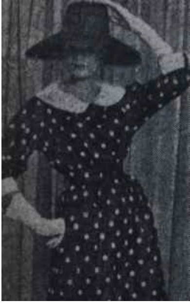
Puanlı elbise 1957 ihtilâli!

oyunmaktadır. Uzun kollar ekseriya bileklerden yukarda kesilmiştir; "kimono"dur ve böylece kadının tabii ve yuvarlak omuzları meydana çıkmaktadır. Dümdüz küçük mantolar, Hint "sari"lerinden ilham alan kapüşon yakalar, hareketle ortaya çıkan yumuşak ve cazip bir biçim 1957 ilkbahar modasında Doğunun tesirlerini ifade etmektedir.