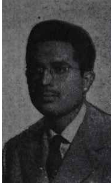
Tarık Dursun K.

Yeditepe yayınları arasında çıkan "Vezir Düşü"nde 13 hikâye yer almış. Bu 13 hikâyeden biri 1951, bir diğeri de 1957 tarihini taşıyor, iki tane 1952 tarihli, bir tane 1953 tarihli, dört tane de 1954 tarihli hikâye var; geriye kalan dört hikâye de 1955 te yazılmış. 1957 tarihini ve "Deli Otları İstanbul" adını taşıyan hikâye hariç, diğerlerinin hepsini hatırlıyoruz. Bu hikâyeleri daha önce okumuş olduğumuz halde kitap haline getirilmiş şeklinde de hiç sıkılmadan bir defa daha okuyabiliyoruz. Buradan bir netice çıkarabiliriz: Demek ki Tarık Dursun hikâyelerini iki defa okuduğu zaman bile okuyucuyu sıkılayacak kadar bir olgunlukla yazmasını biliyor. Bir hikâyenin üst üste sıkılmadan okunması, hikâyeyi yazan lehinde yabana atılmıyacak bir not sayılabilir. Gerçekten de Tank Dursun, genç neslin en iyi hikâyecisidir. Şiirde olduğu gibi hikâyede de edebiyatımız altın çağını geride bırakmıştır. Şiirimiz nasıl Orhan Veli, Cahit Sıtkı gibi aslarını kaybettikten sonra bir duraklama ve bocalama devrine girdiyse, hikâye de önce Sabahattin Ali, daha sonra modern hikâyeci Sait Faik'i kaybetmekle bir duraklama ve bocalama devrine girmiştir. Gerçi Sait Faik devri hikâyecilerinden Orhan Kemal, Kemal Bilbaşar, Samim Kocagöz hayattadır ve hikâyeciliğe devam etmektedirler ama, o eski havalardan çok şey kaybetmişlerdir. Bunlardan bilhassa Orhan Kemal ve Samim Kocagöz artık bu gün hikâyeden çok romanın