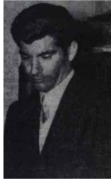
Ali İhsan Göğüş Onuncu köye doğru

Başbakan gazetecilerden ayrılırken bu basın toplantısının bir hususiyeti daha olduğu anlaşıldı. Hususiyet şuydu ki bu toplantıyı bir yemek takip etmiyecekti. Bundan evvelki toplantılarda âdet olmuştu; toplantı biter bitmez büfe açılıyor ve neşe içinde yemek yeniyordu. Gerçi Park Ötele gelenler yemek değil, Başbakanın fikirlerini öğrenmek maksadında daydılar ama, bir kere âdet olmuştu. Yemek hikâyesinin iç yüzü şuydu: Geçen seferki toplantının bir hayli büyük yükün tutan faturası Türkiye Gazete Sahipleri Sendikası Başkanı Selim Ragıp Emece gönderilmiş ve başkan faturayı Başbakanlık Ö-