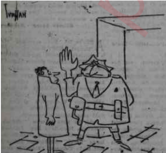
BUNDAN EVVELKİ TOPLANTIDA MENDE- RESE SUALLER SORAN ALİ İHSAN GÖĞÜŞ SON BASIN TOPLANTISINA ALINMADI

Başbakan basın toplantısının yapıldığı salona gelip yerini aldığı zaman çok neşeli görülüyordu. Sağında Namık Gedik, solunda ise Emin Kalafat vardı. Fatin Rüştü Zorlu toplantı masasına değil, hemen Başbakanın arkasındaki bir iskemleye oturmuştu. Başbakan yerine yerleşip son derece şık, gri kruvaze elbisesinin düğmesini çözdü ve dirseklerini masaya dayadı. Sonra mümeyyizleri hiçe sayan çok çalışkan bir talebenin güveniyle "Buyrun beyler, suallerini bekliyorum" dedi. Dedi ve fakat oraltıktan çıkmadı. Sanileri dakikalar kovaladive bu dakikaların sayısı çoğaldıkça Başbakanın yüzündeki tebensüm genişledi. Nihayet gene Başbakanın sesi duyuldu: "Şu anda dünyanın en garip basın toplantısında bulunuyoruz". Durum hakikaten garipti, kimse sual sormuyor ve bizzat Başbakan bu hale güliüyordu. Nihayet buzlar çözüldü ve sualler sorulmağa başlandı. Bu suallerden Kırısra ilgili, olanını cevaplandırmayı Fatin Rüştü Zorlu'ya bırakan Başbakanın konuşması hakikaten C.H.P. Genel Başkanının İzmir nutkuna tam bir cevap teşkil ediyordu. İktidar lideri de, İnönünün İzmir nutkunda yaptığı gibi üslûbun yumuşaklığına itina gösteriyor ve tıpkı İnönü gibi, bugüne kadar taraftarı olduğu fikirleri müdâfaa ediyordu. Başbakanı dinleyenler, ilk anda değişikliğin sadece üslûpta olduğunu zannettiler. Ama Başbakanın söylenmesi gereken bütün sözleri söylediği muhakkakta. Bu arada Başbakanın bir suali cevapsız bıraktığı da gözden kaçmadı. Milliyet yazı işleri müdürü Abdi İpekçi.