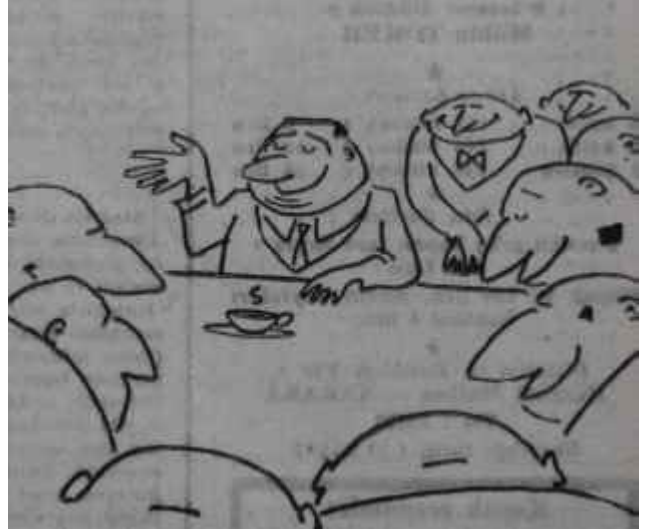
SON BASIN TOPLANTISINDA MENDE- RERES DÜNYANIN EN ACAPİP BASIN TOPLANTI- SINDAYIZ HIÇ SUAL SORULMUYOR DEDİ.