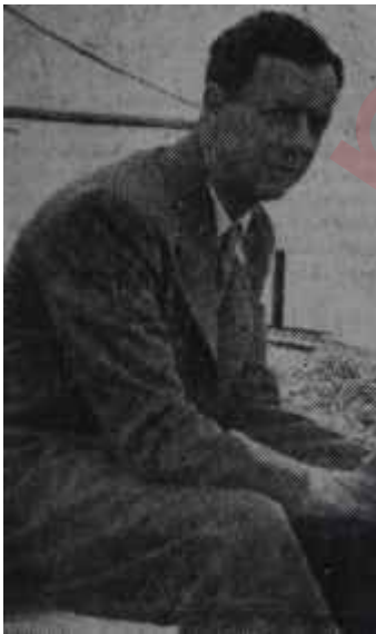
Benjamin Britten öğreten bestekâr

Üniversiteliler Müzik Derneğinin hazırladığı Ankara Musiki Festivali nihayet başlamak üzeredir. Çeşitli güçlüklerden bir kısmını yenmeğe, ötekilerinin yanından geçmeğe muvaffak olan, festival tarihini bir iki defa tehir etmeğe mecbur kalan müteşebbisler, artık işleri yürür hale getirmişlerdir, önümüzdeki Cumartesi günü Büyük Tiyatrodan, Ferit Alnar idaresindeki Cumhurbaşkanlığı Orkestrasının vereceği bir konserle açılacak festivalin on tane olay ihtiva eden programı, ölçülerimiz, imkânlarımız ve kuvvetlerimiz nisbetinde, çok zengin, çeşitli, hatta iddialıdır. Yerinde bir görüşle, festivale Türk musikisinin ve çağdaş musikinin hakim olması sağlanmıştır. İlk icraları yapılacak olan Türk eserleri arasında Bülent Arel'in Passacaglia ve Fuga'sı, Bagatelleri, İlhan Usmanbaş'ın Keman Konsertosu ve Piyano Prelüdlere vardır. Bundan Başka Anton Webern'in Bagatelleri, Kre-