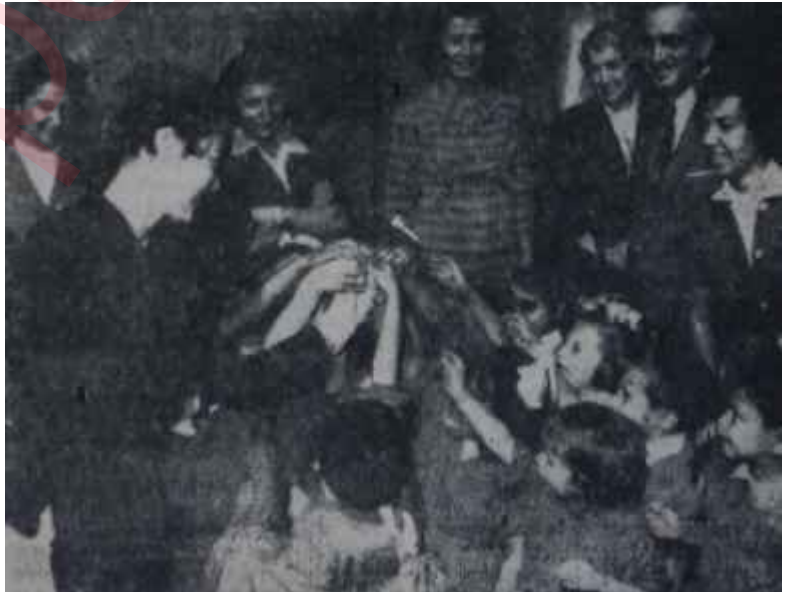
Kimsesiz çocuklarla meşgul olan hanımlar

Süreyyadaki öğle yemeğini tertip eden, Arnavutköy Amerikan Kık Kolejileri Derneği idi. Ankarada toplanan bu faal İstanbullu hanımların dövizi şu idi: "Hem çalışalım, hem eğlenelim".. Senelerden sonra birbirlerini bulan çok eski arkadaşlar mektep sıralarındaki kadar neşeliydiler, gülüyorlardı.. Yemek ortasında bazan çok eski bir mektep şarkısını tutturuyorlardı. Her cemiyet gibi en çok ehemmiyet verdikleri, sosyal yardım kollarıydı. Tahsillerini yarım bırakmak durumuna düşen ralışkan çocukları himayelerine alıyor ve maddi yardımlar sayesinde bu gibi çocukların okullarına devam etmelerini sağlıyorlardı. Sosyal yardım, yalnız maddi değil manevî bakımdan da ele alınabilecek birşeydi. Derneğe mensup bazı hanımlar Çocuk Esirgeme Kurumunda gönüllü olarak çalışıyorlardı. Keçiörendeki Çocuk Yuvasına giderek orada çocuklarla meşgul oluyor, onlara alâka gösteriyorlardı. Bu kimsesiz çocukların maddi ihtiyaçları yoktu. Ama ne de olsa bir anne, bir abla, bir kadın şefkatinden, yakınlığından tam olarak istifade edemiyorlardı. Onların bildikleri ve sevdikleri kelimeler vardı: "hademe" nedir biliyorlardı, "hemşire"yi de iyice taniyorlardı, "ambar memuru" kelimesi de onlara hiç yabancı değildi. Ama "denizi", "vapur", "tank", "uçak" gibi kelimeler onlara bir hayli yabancı geliyordu. Gö-