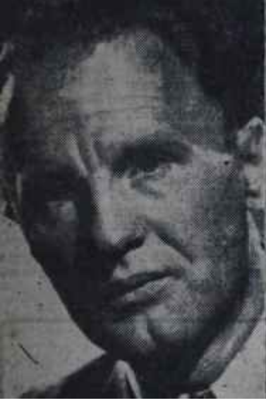
Janos Kadar Saati geliyor

Nehru ve Tito gibi bu teze dünden taraftar elçiler kullanan Amerikanın Rus tezini kabul etmemesi için mühim bir sebebin mevcudiyeti şimdilik iddia edilemezdi. Esasen Doğu Almanya'da karışıklıkların başlaması ihtimali, Batı Almanya kadar Amerikayı da endişelendiriyordu. Batı Almanya, Almanyanın birleştirilmesi meselesinin bir an önce neticelenmesini ileri sürüyordu. 1957 Seçimlerinde iktidara gelmesi bir hayli kuvvetli olan Sosyalist Partisi Şefi Ollenhauer, Almanyanın birleşmesi ve Orta Avrupanın silâhsızlanması konusunda Ruslarla derhal müzakerelere girişilmesi talep ediyordu.