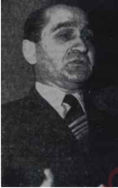
Mendes - France Yalnız adam

Süveyş Kanalı'nın işgali denemesinde İngiltere ve Fransa karşılığında Rusya ve Amerikayı birlikte buldular.