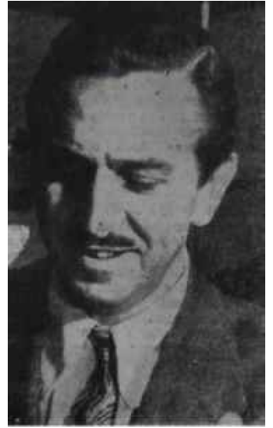
Walt Disney Farelerin Dostu

1928-39 yılları arasında altın çağını yasayan Disney'in konuları özlü olduğu kadar tekniği de sağlamdı. Filmlerinin belli bir dramatik kuru-