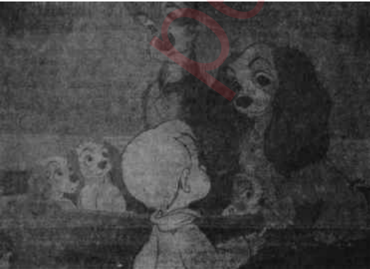
Disney'in cinemascope canlı - resmi: "Lady'nin Aşkı"

"Pamuk prenses ve Yedi Cüce"-nin ticarî başarısı arkasından benzerlerinin ortaya çıkmasına sebep oldu. Sırasıyla, "Pinocchio", "Dumbo", "Alis Harikalar Diyarında", "Kül-Kedisi" gibi canlı - resimlerde Walt Disney'in masal anlatma tekniği kalıplaştı ve katılaştı. Konuları ve kahramanları "Streotype"lar haline geldi. Eski canlılığını, yaratıcılığını