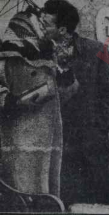
Sevişen bir çift Tabiat hükümünü yürütüyor

Bütün bu şikâyetlerden elde edilen netice şudur: Erkekler aşka icabeden zamanı ve düşünceyi verme-