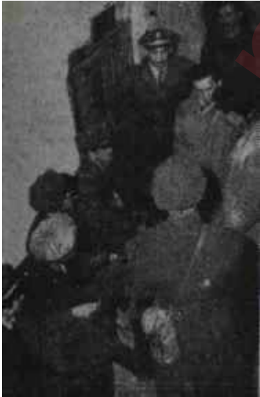
Anıtlar Derneği Kongresi Bombalı siyanet melekleri

Bu bakımdan, birçok Demokrat erkân için Muhalefetsiz Meclis bir ideal olmakla beraber bu yolda yapılan vaadler daha ziyade kuvvet şuru bu mahiyetindeydi. Ama umumi efkârın böyle garip sözler karşısındaki aksülâmeli D.P. için faydadan çok zarar iras ediyordu. Artık herkes anlamıştı ki Demokrasi çok partili Meclis demektir, Demokrasi İktidarın karşısında kuvvetli Muhalefet demektir. D. P. yi, göz tutan başka bir teşekkülün bulunmadığı mucip sebebiyle desteklemek niyetini el'an muhafaza