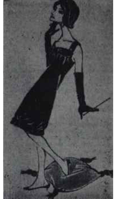
Zamanımızın kadını Zevce değil, bilmece

Madem ki, erkeklerin kadın bünyesini ve kadının cinsî ihtiyaçlarını bilmesi şarttır, erkek bu mevzuda muhakkak bilgi sahibi olmağa çalışmalıdır. Bunun için bütün neşriyatı takip etmesi ve cinsî hayatın aile saadetinde oynayacağı rolü bilmesi tâyindir. Fakat kitapların öğretemeyeceği birşey varsa o da her çiftin kendi hususi vaziyetidir. Erkek kârısının durumunu en iyi karı-