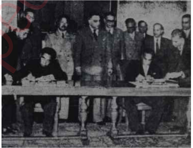
Chou En-lai Pakistanda Sahravardi ile müşterek tebliği imzalıyor Nehru'nun eteğine yapışan kıza

Siyasî partiler Sukarno'yu destekliyorlardı. Sumatradaki ayaklanma üzerine 8 siyasî parti, "askerî bir hükümet darbesinin önlenmesi ve demokrasinin muhafazan" hakkında müşterek bir tebliğ neşrettiler. Tabii korunacak olan bir Asya demokrasiydi. Siyasî şefler herşeyden önce keselerini doldurmakla meşguldüler. Bir ihtilâl dâvasına adı karışan Dış İşleri Bakanı Abdülğani, ordunun müdahalesine rağmen, mevkiinden uzaklaştırılmamıştı. Sansür memleket dışına haber sızmasına mani oluyordu. İsyân bastırılmıştı ama, huzursuzluğun devam ettiği muhakkaktı. Rezaletlerin ve nüfuz ticaretinin kaide okluğu bir memlekette, bunun başka türlü olması beklene- mezdi. İktisadî kalkınma teraneleri altında, "Yiyin efendiler, yiyin; ta hânı iştiha sizin" prensibini, Endonezyalı liderler canı gönülden benimsemişlerdi. Fakat halle ne kadar cahil, sansür ne kadar kuvvetli olursa olsun ta prensibin yaşama şansı ancak bir şekilde mümkündü: Huzursuzluğu zorbalıkla bastırmak.. Sukarno ve şürekâsının yaptığı da buydu.