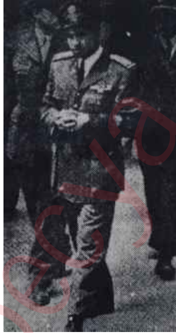
Albay Seraç Suriyeli Nasır

idin Amerikayı Bağdad Paktına girmeğe davet eden son teklifi cevapsız kalmıştı. Arap memleketleri arasındaki bir konferansa önyak olan İran'ın teşebbüsü reddedilmişti. Eisenhower, yeni Orta Doğu müşavirleri Hammarskjöld ve Nehru ile birlikte, Bağdad Paktına rağmen, Orta Doğu için sulh projeleri hazırlamıyordu. Adeti vechile Amerika, ilk adım olarak Orta Doğu için geniş bir iktisadi yardım plânı hazırlamıştı. Daha onbeş yirmi gün önce Ike'in yardımın, ve sözcüsü Nixon, bu fakir Arap memleketlerinin mahdud gelirlerini askeri masraflara tahsis zorunda kalmalarının günah olduğunu söylemiş, geniş bir iktisadi yardım programının lüzumunu belirtmişti. Ame-