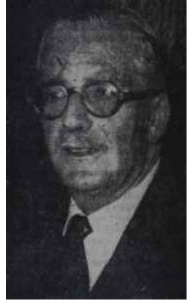
Sir Anthony Eden Gösterini kapayan centilmen

Gayet güzel Arapça konuşan İngiliz Başbakanı, ta başlangıcından itibaren Arap Birliğinin kuvvetlenmesi için gayret sarfetmişti. Arap Ligi, Eden'in bir eseri idi. 1954'de Süveyş Kanalı Bölgesini Nasıra cömertçe bağışlayan da Eden idi. Bugün Mısırın bu nankör evlâdını cezalandırma kararı veren de gene Eden oldu. Pygmalion, senelerden beri emek verdiği eseri birden bire kurtmaya kalkışmıştı. Nasır gitmeli, Mısırın yerini Irak almalıydı. Nuri Said Paşa bütün muvaffakiyetsizliklere ve postunu kaybetme tehlikesine rağmen, Nasırın yerini almak ümitlerinden birşey kaybetmemişti. Suriye-Irak mücadelesi, bu hikâyenin bir faslıydı.