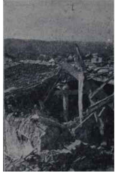
Yıkılan evler Ocaklar söndü

Geçen sene şimalden gelen ve Sibirya tarafından memleketimizi tehdit altında tutan büyük soğuk dalgasının tahribatını unutmamak la--