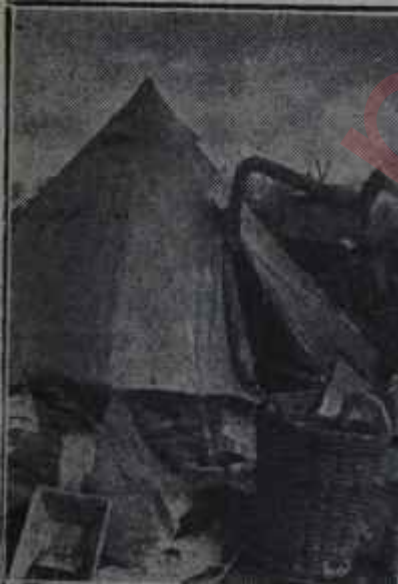
Sobalı çadır Soğuk şiddetliydi

Gelmesi beklenen bu soğuk dalgasının geçen defa olduğu gibi fazla tahribata sebebiyet vermiyeceği, memleketimizin bazı bölgelerinde kendisini fazla hissettirmeyeceği tahmin edilmektedir. Şu günlerde memleketimizin bazı bölgelerinde başlayan yağmurun gelmesi beklenen bu soğuk dalgasının öncüsü saymak yerinde olur.