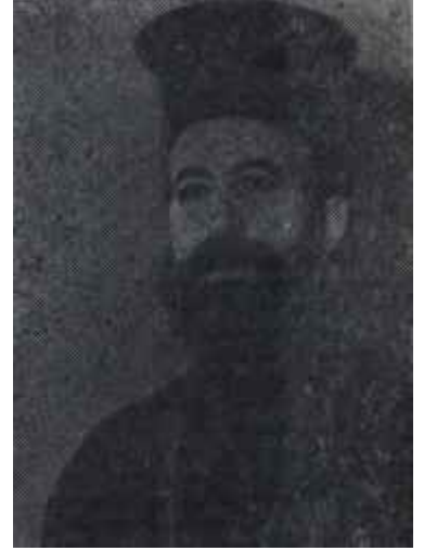
Makarios İtidal unsuruymuş

Kıbrıs mevzuunda milli bir politikaya ihtiyacımız aşikârdır ve bunu öteki partilerin de iştirakiyle gizli, gültüsüz patırdısız toplantılarda çizmek için ön ayak olmak iktidarın vazifesidir. İngiltere Dış İşleri Bakanıyla o hava içinde yapılacak temaslarda bu hava içinde yapılacak temaslardan çok daha müşbet netice verir. Seneler senesi bilhassa Türkiye ile İngilterenin uyutukları Kıbrıs meselesi bugün zecri kararlar ya tedbirlerle hallolunmak kabiliyeti ni kaybetmiştir. İngiltere bunu görmektedir. Mutlaka ve mutlaka rea-