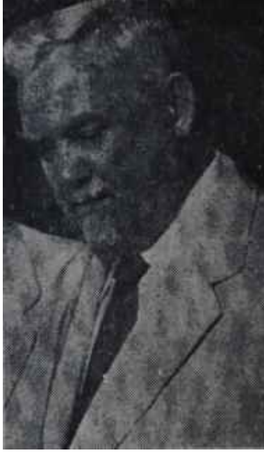
Mareşal Bulganin Yeni metodun bir vasıtası

Bilindiği gibi komünizmde ana fikir sınıflar kavgası fikridir. Komünist doktrinlere göre, tarih zincirleme bir sınıflar kavgasından başka bir şey değildir. Sınıflar arasındaki