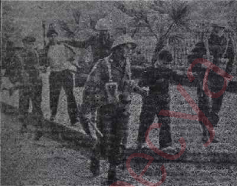
Kıbrıs'ta talebe nümayişi

Türkiyede ifade edilmek istenmeyen Ur hususunun artık bilinmesi zamanı gelmiştir. Bizim mütemadiyen hücum ettiğimiz, tenkidlerimize hedef tuttuğumuz, nutuklarımızda veya yasalarımızda küçümsediğimiz Makarios İngilizler nezdinde Kıbrıs taki müfritlerin değil, mutedillerin basırdı ve ifrata karşı koymasıyla tanınmıştır. Londra hükümetinin onunla müzakereye girişmesi de bundandır. Müstemlekeler nazın biz-zat başbakan tarafından bu "kasta-