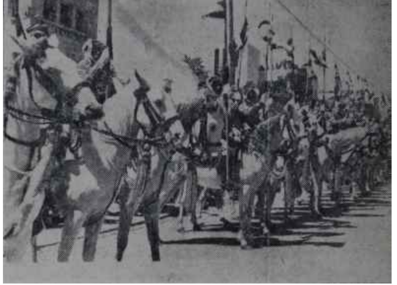
Arap Lejyonunun süvarileri Tankları Amerika'dan geliyor

İhraç lisanslarının iptali ve on sekiz tanka konulan ambargo için gösterilen "durumu daha iyi incelemek" bahanesi, aslında, gerçek durumu izahtan uzaktı. Bu tankların tesliminin bugüne kadar neden geciktirildiği zaten biliniyordu. Geçen sene içinde gönderilmesi gereken bu tankların teslimi. İngiltere ile Suudi Arabistan arasında çıkan bir anlaşmazlık sonunda, İngiliz hükümetinin Amerikan makamları üzerinde yaptığı baskılar yüzünden geciktirilmişti. Amerika şimdi, yapmak zorunda bulunduğu ve amme efkarının öğrenmesini istemediği bu tank sevkiyatının böylece açığı vurulması üzerine, "durumu daha iyi incelemek" bahanesinden daha başka sebeplerle ihraç lisanslarının iptal ediyor ve on sekiz tanka ambargo koyuyordu. Amerika gerçekte, haberin Arap - İsrail anlaşmazlığını alevlendirmesinden ve