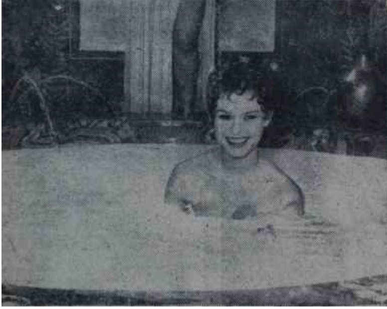
Brigitte Bardot'nun banyosu 400 litre halis süt !.

R omada çevrilen Neronun hayatına dair bir filmde Fransız yıldızı Brigitte Bardot, Neronun gözdelelerinden birini canlandırmaktadır. Filmin en alâka çekici sahnesi Brigitte Bardot'nun süt banyosu yapmasıdır. Rejisör bu sahneye büyük ehemmiyet vermiş ve hakiki olmasına gayret göstermiştir. Brigitte Bardot'nun yeşil mermerden banyosunun doldurulması için tam 20 teneke - 400 litre - süt kullanmak icap etmiştir.