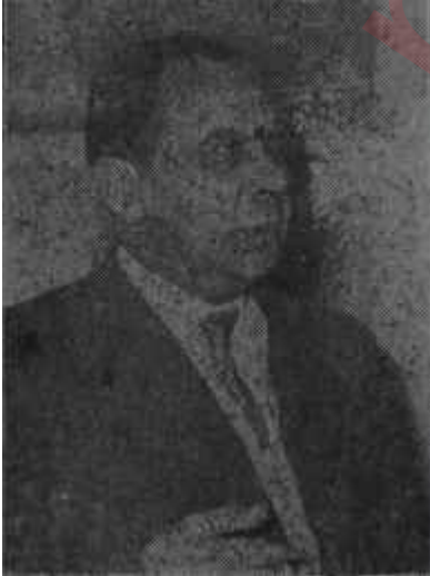
Dr. Fazıl Küçük Ekalliyetin sesi

Bu durumun, bizim tarafımızdan ileri sürülen tezin muvaffakiyet ihtimalini arttırmadığına şüphe yoktur. "İngiltere adadan çekilirse Kıbrıs bizindir" demek iyidir ve politiktir. Ama acaba devlet adamlarımız bunun imkânlarını temin etmişler midir? Zira seneler senesi Fatih Rüştü Zorlu D. P. iktidarına ne kadar borçlanırsak borçlanalım Amerika'nın bize yardım etmekte kaçınmayacağı fikrini aşılamaştı ve biz, bu tahmin doğru çıkmayınca bugünkü Son derece müşkül, son derece sıkışık vaziyete düştük. Acaba aynı Fa-