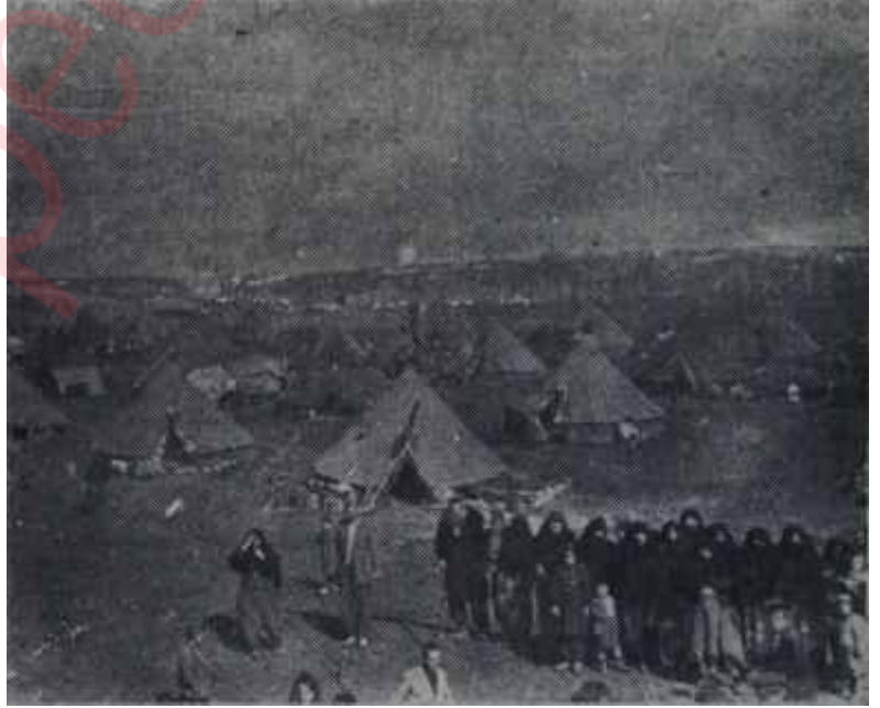
Eskişehir halkı çadırlara sığındı Habersiz gelen felâket!

Nitelik hava değişimlerinin dünyamız üzerindeki tesirleri ve meydana getirdiği felaketler sadece* zelzeleler değildir. Havanın ani değişikliği neticesinde su baskınları, şiddetli fırtınalar da olmaktadır. Bilhassa su baskınları havanın ani değişiklikleri ile sıkı sıkıya ilgilidir. Milyonlarca metre küp suyun bir anda, dünyanın bir bölgesini tedbirsiz yakalıyarak yeryüzüne inmesi neticesinde su baskınları, büyük taşmalar ve şehirlerin bu baskın sonunda