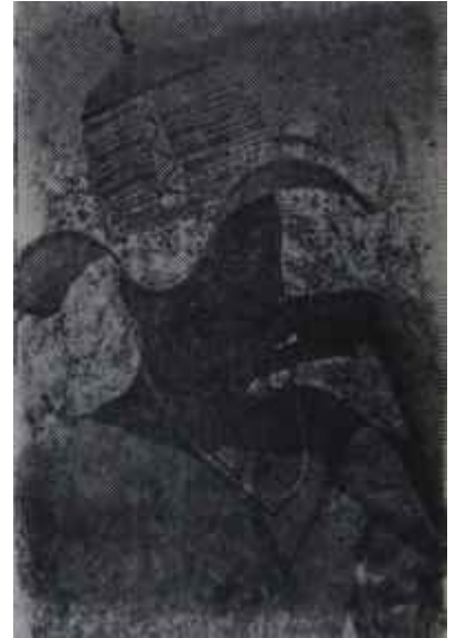
Şık bir Nigeryah Kraliçesi şerefine!

Bu açayip defileyi seyreden halk çılğınca alkışlıyor ve hayranlıklarını belirtiyorlardı. Yegane ihtilaf, hangi bakanın en şık olduğu meselesinden çıkıyordu.