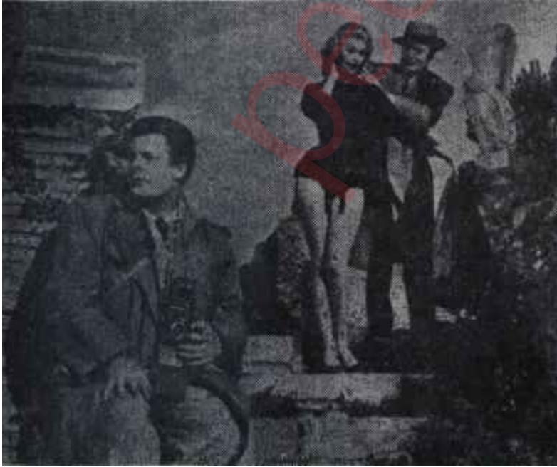
Sophia Loren "Kadın Olmanın Saadeti"nde Saadet yolu güçlüklerle doludur

Filmin acı realizmi, ikna kabiliyeti, beşeri olması gösterildiği yer-