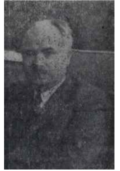
Muhalefet liderleri Falso yaptılar