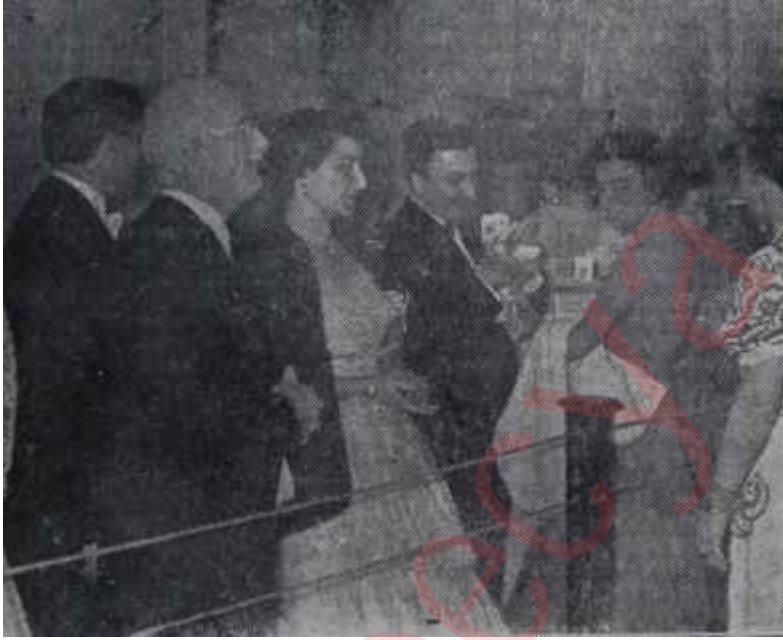
Hariciye köşkündeki balo Çocukların esirgenmesi de unutulmadı

Büfe, piyango, sıcaktan, kalabalıktan şikayet işte bütün baloların başlıca meşgaleleri bunlardı. Kenarda koltuklar vardı, fakat baş köşeleri tutanlar buraları bir türlü terkedemiyor, ancak kendi yakınlarına devrediyorlardı. Kalabalık içinde herkesin telaşı eğlenmek değil, birbirini görebilmektir. Dans bile sanki güç bir vazife idi. Vakıa o dar pistte, o kalabalıkta ve sıcakta dans hakikaten güç bir vazife idi ama gene de, tek tük dans etmenin zevkini çıkararak, etrafa neşe saçacak şekilde eğlenmesini bilenler vardı.