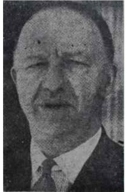
Mr. Butler Sterlin uğruna

tedbirleri açıkladı. Geçen yıl İstanbul'da aktedilen Beynelmîlel Para Fonu toplantısında Mr. Butler tarafından ifade edilen "mâli bakımdan daha sıkı bir disiplin altına girmek" hususundaki fikirler, bu suretle tatbik yoluna girmiş bulunmaktadır. Bütçenin ilan edilmesine bir buçuk ay kala yapılan bu açıklama dünya iktisat mahfillerinde beklenmiyor değildi. Ancak İngilterenin aldığı tedbirler beklenilenden çok daha sertti. Faiz hadlerinin yükseltilmesinin yanı sıra mahallî idareler yatırımlarının kısılması ve hususî sermaye yatırımlarının sıkı bir murakabe altına alınması İngilterenin bu hususta ne kadar azimli olduğunu göstermektedir. Nitekim Mr. Butler, icap ettiği takdirde daha sert tedbirler almakta hiç tereddüt edilmeceğini de açıkça beyan etmiştir.