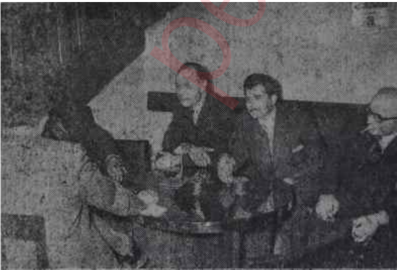
Meclis'te merdivenaltı Kaynayan kazan

A K İ S Bu hafta 36.250 adet basılmıştır.