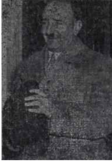
Fuad Köprülü Hukuki bakan