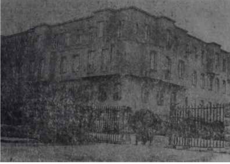
Milli Savunma Bakanlığı Çıkış kapıları kapanmalıdır