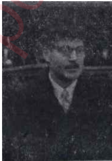
Fatih Rüştü Zorlu Hakiki bakan

G ece celsesinde iktisadi İşbirliği mevzuunda Hür. P. adına Fethi Çelikbaş tenkidlerde bulununca Menderes kürsüye gene Prof. Köprülü'yü çıkarmadı. İktisadi İşbirliği teşkilâtı Dış İşleri Bakanlığına bağlıydı, görüşülen Dış İşleri Bakanlığı bütçesiydi. Ama Fethi Çelikbaşın tenkidlerini gene Fatih Rüştü Zorlu • resmi zevcesiyle kızının 1954 mayısından bu yana Pariste kim tarafından gönderilen dövizle geçindikleri ve Cadillac aldıkları bilinmeyen döviz komitesi sabık başkanı - cevaplandırdı. Hem de müteaddit defalar kürsüye gelerek ve gene Menderes IV. hükümetini ilzam eden sözler sarfed-