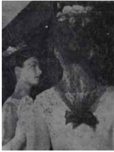
Gece için saç Castillo icadı

sela yünlü ile karışık ipekliler, şantuglar çokça kullanılmıştı.