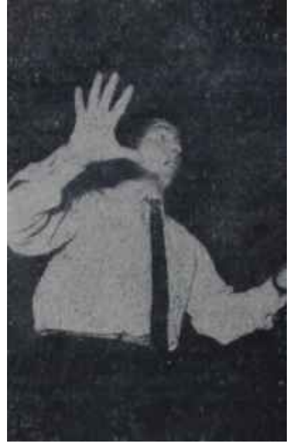
Sağcı Poujade Her şeyin aleyhinde

Kaldı ki, yeni Başbakan Guy Mollet de, okulların tamamen layikleştirilmesi konusunda aşırı görüşler ileri-sürerek Cumhuriyetçi Halk Topluluğunu ürkütmüş değildir. Başbakan, programında, Hükümetin bu konuda taraf tutmayacağını ve Meclis çoğunluğunun izhar etmek üzere bulunduğu görüşe uygun olarak hareket edeceğini söylemiş ve böylece, çekimsiz kalmakla müsbet oy kullanmak arasında bocalayan Cumhuriyetçi Halk Topluluğunu kendi safına çekmiştir. Yarın Meclis çoğunluğu okulların layikleştirilmesi yolunda bir karara varırsa, M. R. P. bu kararı yerine getirmek durumunda kalacak olan Mollet kabinesini desteklemeye devam edecek midir? Bu sorunun kesin cevabını vermek çok güçtür. Ancak adedi şimdilik ne olursa olsun, Mollet'in, çok nazik ve seyyal bir çoğunluğa dayandığını söylemek yanlış olmayacaktır.