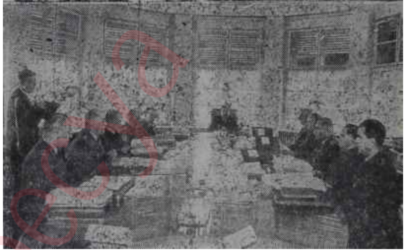
Yüksek Askeri Şura Subaylar için geni esaslar

Böylece yani yedeksubaylık kanunu tasarısında er sınıfı dışında kalanlar üç sınıf üzerinden toplanacaktır: Yedeksubaylar, yedek askeri memurlar ve yedekassubaylar.. Yedekassubaylar sınıfına köy ve sanat enstitülerinden mezun olanlar da dahil edilmektedir. İstiyen yedeksubayın, yedeksubaylığının bitiminde orduda "yedek subay" olarak kalması da mevcut hükümler arasında alın-