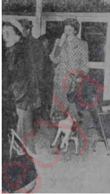
Uçak yolcusu köpek Memnun görünüyor