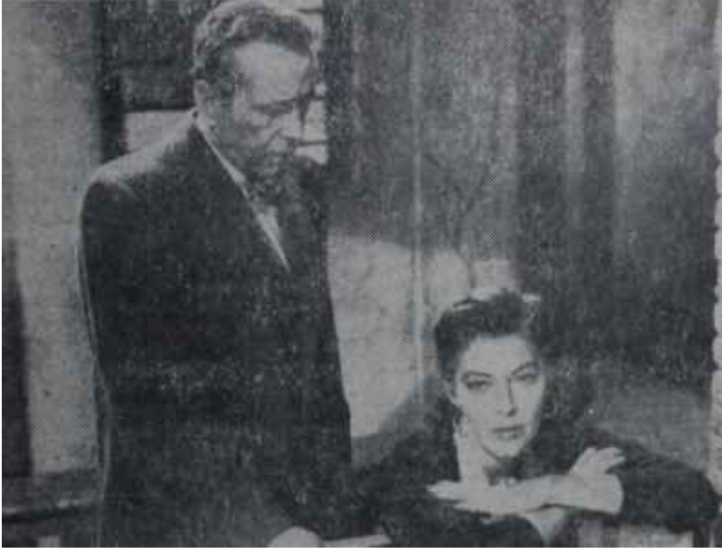
Ava ve Bogart "Çıplak Ayaklı Kontes" te Kadın denen muamma..