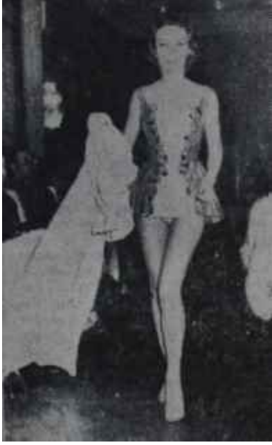
Bir mayo modeli İyi teşhir edildi

kat kalça ve bacak kısımları tatsız, hatta kusurlu idi, ayakları büyüktü. Mayolar cidden güzeldi ve dışarıda kar yağarken, insana güzel bir yaz günü hasreti veriyorlardı. Ekserisi naylon olan mayolar bildiğimiz klasik mayo biçiminde idiler. Yalnız bir tanesinin brötelleri kolların üstünde duruyor ve mayoya daha ziyade açık bir elbise üstü manzarası veriyordu. Bütün mayoların birer zarif, kısa ceketleri vardı. Kırmızı, kapüşonlu bir plaj mantosu insanın gönlünü çalışıyordu.