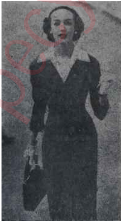
Bir rob - manto Yılın modası

Fransız güzeli İse, Maggy Rouf'un defilesinde Christian Diora ait bir kokteyl elbisesi giyinmişti. Bu elbise dizlere kadar pulla işlenmiş