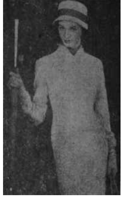
Bir jarse elbise Sıcak, yumuşak..

ve sınımsız vucuda oturmuş bir kılıf şeklinde olup, dizlerden aşağıda üst üste gelen iki kat tülle birden zengin bir bolluk kazanıyordu.