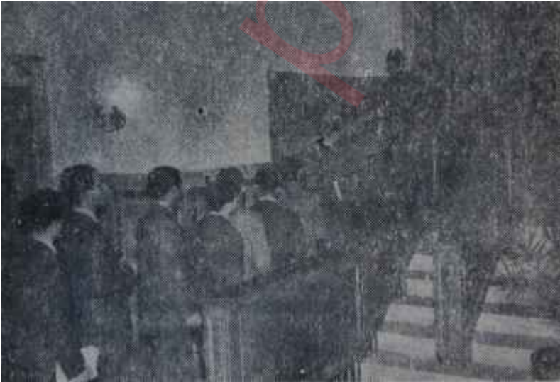
Millî Kütüphaneye giriş İlim yolunda güçlük

Millî Kütüphanemizin, henüz posta pulları kısmı yoktur, (İngiliz Millî Kütüphanesinde vardır). Paralar, madalyalar, estamplar, gravürler, yazmalar, plânlar kısımları henüz kurulamamıştır. Bir müzesi yoktur. Millî Kültür hazinelerimiz mahvolup gitmiştir ve mahvolup gitmektedir. Bunları kurtaracak, ilim ve sanat bozkırlarımızı sulayacak olan bir baraja ihtiyacımız vardır. Ankara merkezinde günden güne dolmakta olan arsalarından birini derhal bu işe ayırmak ve bir Millî Kütüphane binası yapmak lazımdır. Bu binanın maliyeti 100 milyonlar içinde değildir. Belki 20 milyonu geçmeyecektir. Bugünkü binası devredilecek olan eşya, malzeme ve mükerrer kitaplarla, Ankaranın bir şehir kütüphanesi olabilir. Yarım milyonluk bir Başşehre böyle bir kütüphane çok lüzumludur da. Şehir kütüphanesi, Millî Kütüphaneyi, mütalea salonu olmaktan kurtaracak, ilmi çalışmalar dışında kitap karıştırılması, eşyasının ve personelinin işgal edilmesi gibi Millî Kütüphanelerin gayeleri dışında kalan yüklerini hafifletecek ve bunların mahzurlarını önlemiş olacaktır.