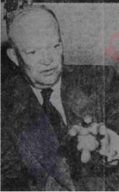
Başkan Eisenhower Anlaşma tam değil

Tebliğde NATO konusunda kısaca şunlar söylenmektedir: NATO Batı dünyasının müşterek güvenliğini