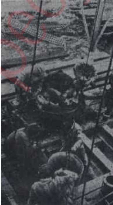
Bir petrol kuyusu Asıl hedef

Arap veya İngiliz iddiaları ne olursa olsun, meselenin esasen gergin olan Orta Doğu münasebetlerini bütün gerginleştirdiğine şüphe yoktur. Bu meselenin de bir an önce ve barışçı yollarla halledilmesi bütün dünyanın hayrına olacaktır.