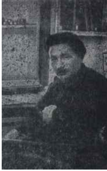
Ernest Boris Chain

cıva) penisillin tedavisiyle karşılaştırılmıştır. Gelen cevaplardan anlaşılacağına göre bu müesseselerin % 65.3 ü frengi tedavisinde yalnız penisilini; % 28.9 u penisillin ve diğer ilaçları; % 5.8 i de yalnız başına madenleri kullanmaktadır. Kuzey Amerika dispanserlerinin hepsi ve Avrupadaki dispanserlerin % 52.2 si penisilini yalnız başına kullanmaktadırlar. Tene sifiliz için genel olarak kullanılan doz 4.8-6 milyon ünite penisillindir.