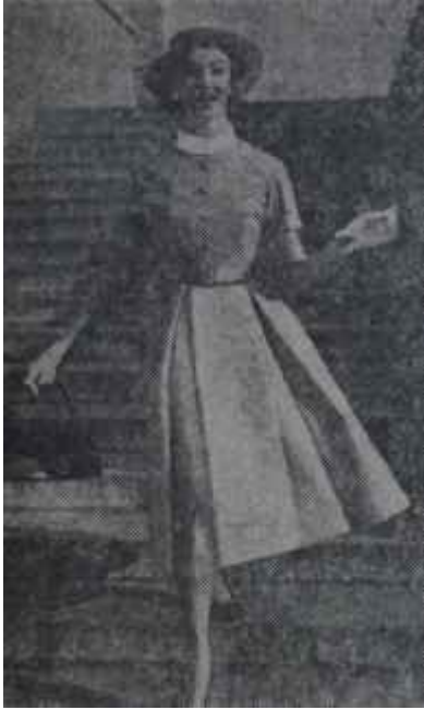
Bol etekle bolero İstisnasız bir kaide

1 — Elbise-cekete takımı: Bir kaç senedir revaçta olan elbise ve ceket takımı modası bu sene de devam etmektedir. Dar elbiseler üzerine giyilen bu tayyör ceketlerinin muhtelif biçimleri vardır. Klasik ceketlerin yanında arka uçları öne nazaran daha uzun olanları, kalın kumaşlardan yapılmış, kısa spor palto biçiminde olanları da vardır. Bol eteklerin üzerine ise daha çok vücuda yapışık, yaka-sız küçük bolerolar giyilmektedir.