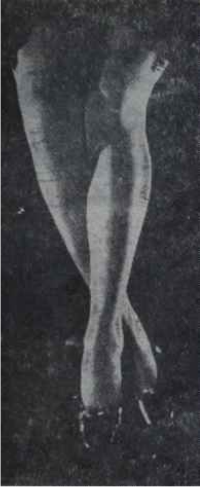
Dayanmayan çoraplar Dayanabilir misiniz ?

Zaten çamaşır modasında en mühim rolü oynayan bu sene kombinelerdir. Sütyen, korse ve zengin bir kısa dantel etek. İşte bütün bunlar bir arada olunca, iç çamaşırına kombine adı verilmektedir. Kombineler kadının vücudunu dört bir taraftan sıkı sıkı hapse almaktadır. Öyle ki belde biterek, beli kalınlaştıran veya beli de içine alarak kadının sırtını dolgunlaştıran korseler tamamiyle demode olmuştur.