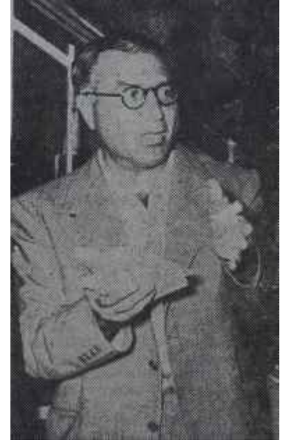
Kasım Gülek Üstadın yolunda

Bandırmada Genel Sekreteri kalabalık bir halk kütlesi tezahürat ve sevgiyle karşıladı. Hem C.H.P. popü-lerdi, hem de şahsen Kasım Gülek.. Karşılama candandı ve hararetiydi. Belki de buna müteşekkik olduğun-