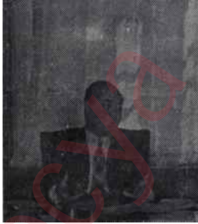
Makamda ufak kaldı

Yunanlıların devamlı ve ısrarlı zorlamaları bizi bir Kıbrıs meselesiyle karşı karşıya getirdi. Bir yandan Yunanlıların sonu gelmeyen tahrikleri, bir yandan dış politikamızda takip ettiğimiz tereddüdü yol, bir yandan içeride tedbir noksanlığı herşeyi aleyhimize çeviren, milyonların bir anda heba olmasını doğuran 6-7 Eylül hadiselerine-yol açtı. Kıbrıs meselesi, bizim için bir milli haysiyet davası olmuştur. Milletçe bu derece benimsenmiş, hassasiyet gösterilmiş bir davada ne derece ihmalkâr olduğumuzu,