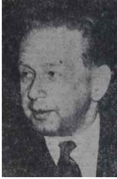
Dag Hammarskjöld Siyasette 'H' modası

İngiltere şu günlerde adanın kendinden çıkmasına rıza gösterir bir