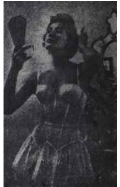
Naylon çamaşır Oh ! Oh! Oh !

Kadınlara soracak olursanız, onların istediği muhakkak naylon değildir. Onlar, ipek fabrikalarımızdan sağlam ve kaliteli çamaşırılık kumaş bekliyorlar. Bir de çorapçılardan sağ-