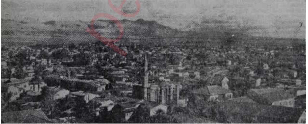
Lefkoşa'dan bir görünüş Kültür yardımımız bile eksik

Kıbnsa sahip çıkmak için onu yeneden, ama bu sefer kültür silâhlarıyla fethetmemiz gerekirdi. Bunu yapacağımız yerde bir "Liman lokantası nutku" ile her şeyi halledeceğimiz zehabına kapıldık. Asıl hata işte budur.