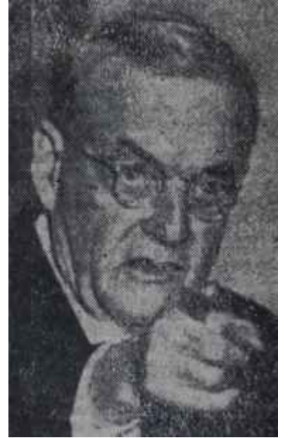
Foster Dulles Şimdi onu itham ediyorlar

Cumhuriyetçi idarenin hazırladığı bu yeni - önümüzdeki seçimlerde idarenin de Demokratların eline geçmesi halinde son - bütçe tasarısında, sosyal ve ekonomik düzen ve güvenliğin sağlanması, yeni tarım, eğitim ve bayındırlık plânlarının gerçekleştirilmesi için ayrılan önemli meblâğların yanı sıra, askerî giderler geniş ölçüde kısılmıştır. Bu giderlerde, yürürlükte olan 1955-56 mali yılı büt-