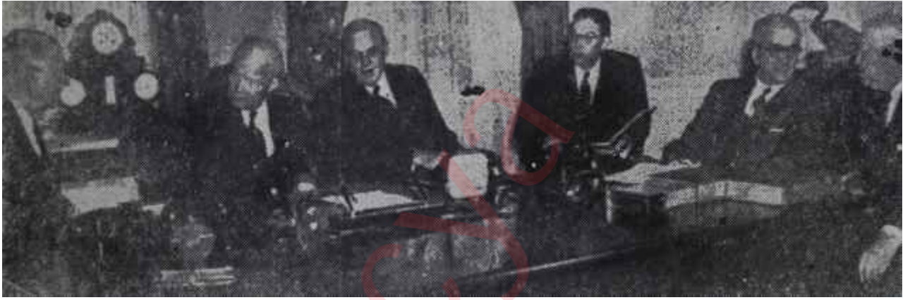
Amerika'nın 1956 mali bütçesi hazırlanıyor Dostlara da denk yardım

Eisenhower idaresinin yeni bütçe tasarısının Demokrat ekseriyetin hakim, bulunduğu Kongre'de nasıl karşılanacağı kesin olarak bilinmemektedir. Bilinen tek şey, tasarının Demokrat çoğunluğu gerçekten güç bir duruma düşürdüğüdür. Karşılına denk bütçe ile çıkan Cumhuriyetçi idarenin isteklerini reddetmek, Demokratları, halk efkârı karşısında, tekrar açık bir bütçeye avdeti istemek gibi ağır bir töhmet altında bi-