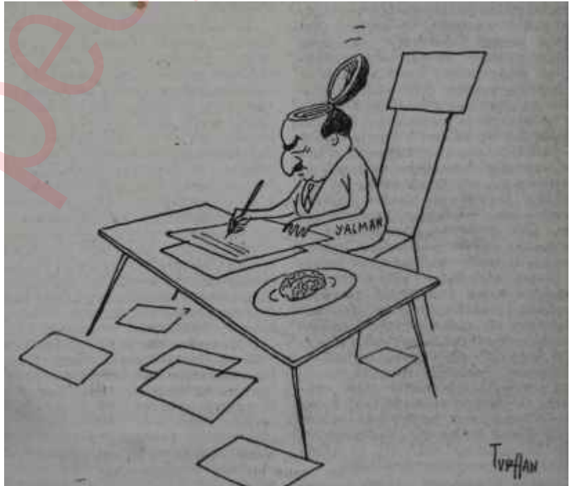
BAŞ - YAZAR

İşin bunlardan da feci tarafı, kanunun uygulanma şeklidir. Bazı tanınmış gazeteciler davaya başlanılmadan önce tevkif edilmekte ve dava çoğu zaman gizli oturumda görülmektedir. Sanığa, şerefe tecavüz fiiline konu olan olayın doğruluğunu is-