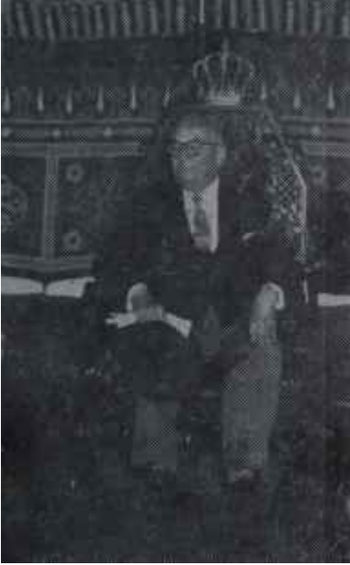
Celal Bayar Bir yolculukta