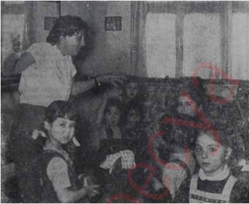
Fenmen bale okulu

Çocuk bahçesi sistemi tatbik edilirken, çocukların istidatlarını keşfetmek, karakterlerini ve bazı arızalarını tesbit etmek mümkündür. Çünkü çocuk, oyun sırasında kendisini tamamiyle bırakıyor ve iç âlemini tamamiyle meydana koyuyordu.