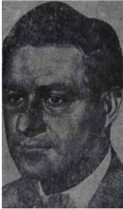
Gian - Carlo Menotti

Toby rolüne gelince... Elinden ge-lenı yapmağa gayret eden, fakat el-