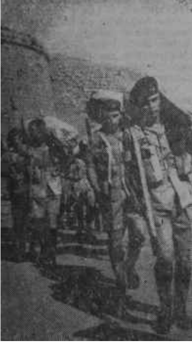
Kıbrıs'a sevkiyat Geldikleri gibi gidecekler mi?