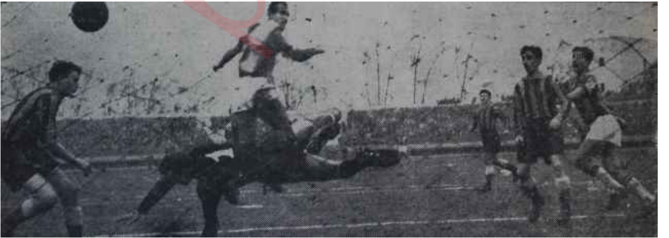
Galatasaray - Radnički maçı İsfendiyar vardı

Tribünün meşhur simalarından biri, herhalde gazeteci olduğunu unutarak, yanındaki şahsa: "Biliyor musun, İşin sonunda iki puvan olmayınca futbol insana heyecan vermiyor". Bu söz arkadaşı tarafından tasvip gördü ve beraberce mensup oldukları kulübün ilk devredeki durumunu kısaca gözden geçirdiler. Aralarında fikir ihtilâfı yoktu. Biri söylüyor, öbürü de baş sallamasıyla mukabele ediyordu. Üstat eğer futbol On dokuzuncu asrın sporudur, o zaman icad edilmiş ve o günün insanlarına heyecan vermektedir. Bugün ise bir buçuk saatlik zaman içinde hele gol olmazsa maç bir eziyet oluyor deseydi, herhalde daha isabetli konuşmuş olurdu. Gazetecilikle kulüpcülüğü bir arada bağdaştırmak hele efkârıumumiyenin temsilciliğini yaptığım unutup renk müdafiliğine kalkmak doğrusu biraz garipti. Gönül isterdi ki, spor yazarlığa yapanlar Yirminci asır insanların sporda aradıkları heyecanı kavrayabilsinler ve ona göre hareket etsinler.