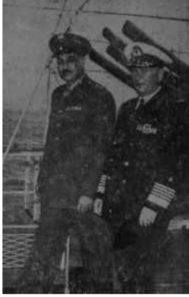
Mareşal Tito Müttefikî cephe !..

Titonun bu sözlerini anlamak gerçekten güçtür. Tito Bağdat Paktna yükleneneğine, pakta idare edenlerin beceriksizliğine işaret etse daha doğru bir iş yapmış olurdu. Bağdat paktnı Orta Doğuda huzursuzluk yaratmış, Arap devletlerinin büyük bir kısmının husumetini üzerine çekmiş olabilir. Bu, bu gibi paktların lüzumsuzluğu değil, sadece Bağdat Paktnın kuruluşunda ve yürütülüşündeki hataları gösterir. Eğer Bağdat Paktnı