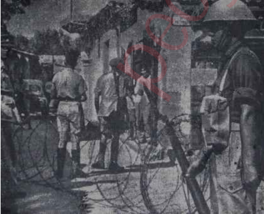
Kıbrıs'ta barikatlar Ama gene insanlar ölüyor

Halâ aynı sertlik ve uyuşmazlık havası içinde gelişen Türk ve Yunan siyasetinin bağdaşması, bugün için gerçekten imkânsız görünmektedir. Her iki Hükümetten biri diğeri lehinde bir fedakarlıkta bulunmadıkça bu davanın nasıl halledilebileceğine biz akıl erdiremiyoruz. Eğer Türk Hükümeti bu konuda bir görüşe sahipse bu görüşü açıklaması gerek-