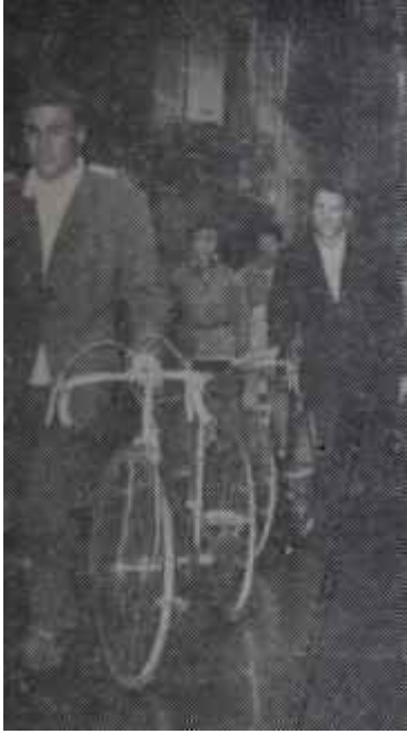
Bisikletçiler Mısır'da Suriye'yi geçtiler