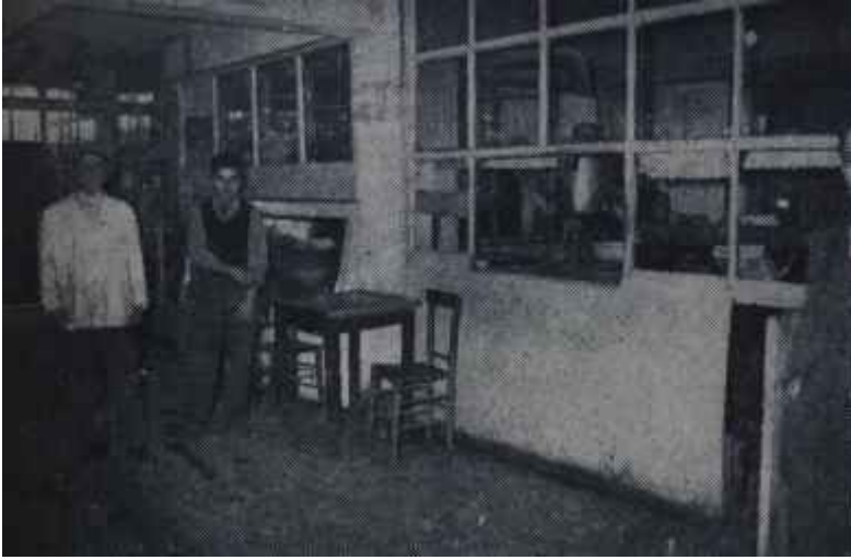
Yurdlardan bir görünüş: Kantin Bir de burslu talebeleri görseviz