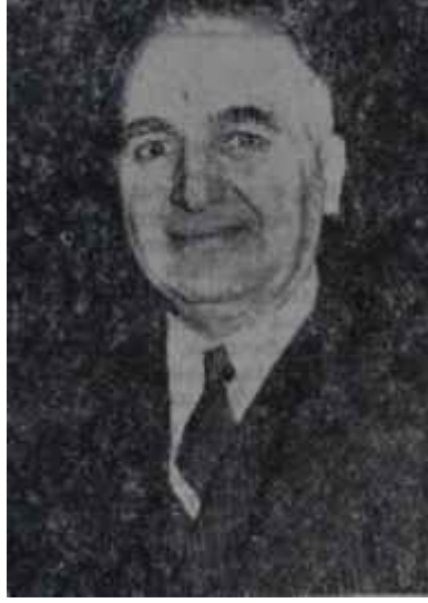
Hadi Hüsmen İcraatta ilk zorluk

Memleketimizde tütün mahsulünün başlıca üç alıcısı vardır: Tekel, tütün işleri ile uğraşan yerli iş adamları, yabancı alıcılar - bilhassa Amerikalılar. Tekel iki maksatla tütün alır. Bir defa fabrikalarında işlenip yurt içinde istihlak ve yurt dışına mamul olarak ihraç edilecek sigara ve sair mamuller için tütün alır; bir de müstahsili korumak maksadıyla himaye alımları yapar. Bundan maksat tütünlerimizin değer pahasını temin etmek ve müstahsilin güç durumunda kalmasını önlemektir. Mahnın her halü kârda elinde kalmıyacağından emin olan müstahsilin, sair alıcılar karşısındaki vaziyeti, böylece önemli mikyasta kuvvetlendirilmiş olur. Terli alıcıların bir, kısmı sadece bir aracından ibarettirler. Bunlar asıl müstahsil eline geçmesi gereken gelirlerin bir miktarını araya girmek suretiyle alırlar. Diğer bir kısmı ise aldıkları tütünleri işletip ihraç ederler. Yabancı alıcıların büyük bir kısmı da mübayaa ettikleri tütünleri iş-