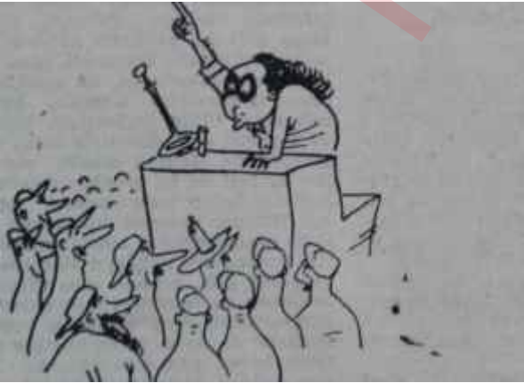
SAMED AĞAOĞLU, PAHALILIĞIN SEBEBİ KASIM GÜLEK'TİR DEDİ (Gazetelerden)

4 — 1 ve 3 numaralı fıkralarda yazılı işlerin birlikte yapılması halinde bir takvim yılı içinde alınan ücretlerin yedi katı ile mubayaa bedellerinin yıllık toplamı 21 bin lirayı aşmamak,