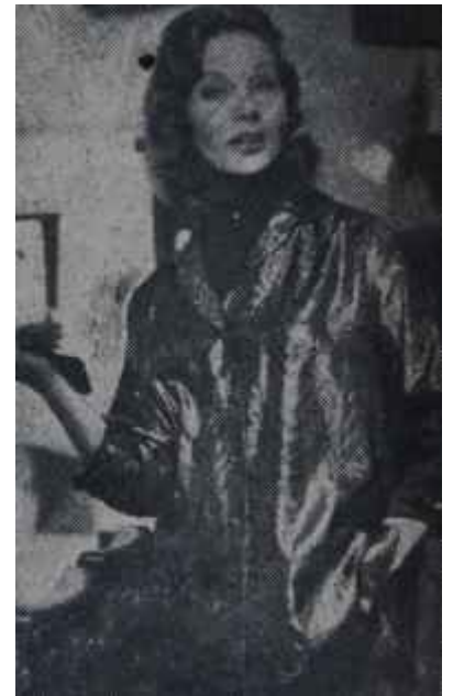
Pantolon ve lame sveter Kadın icadı

Dağ kıyafetlerinde yaş mevzuubahis değildi. 40 yaşındaki bir kadın, 20 yaşında bir genç kızın giyindiği