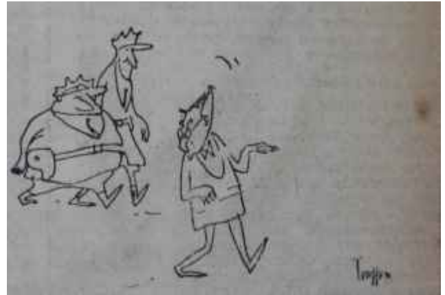
HÜKÜMET, PAHALILIĞA KARŞI YENİ TEDBİRLER ALACAK (Gazetelerde)