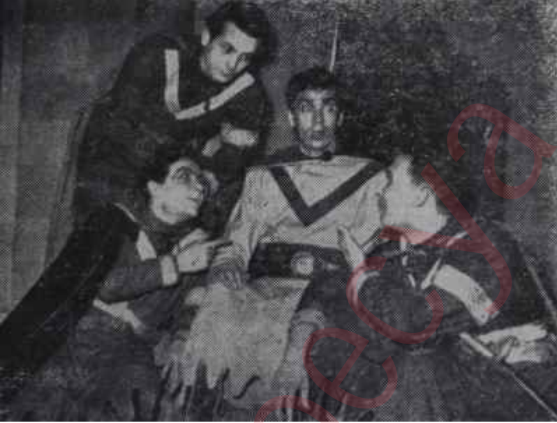
Dördüncü Henri'den bir sahne Seyircileri de mi deli edeceğiz ?

"Genç Osman". ismini taşıyordu ve Musahipzade Celâl Bey ile M. Şükri Erden'in müşterek mesailerinin mahsulü idi.