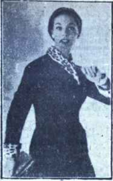
Genç kadın Tip No: 2

Orta yas bugün, kadınlar için de, 30'dan 40'a yükselmiştir. Kadınların yaşayış tarzı, alınan gıdalar ve herşeyden evvel bir haleti ruhiye meselesi asrımızın büyük mucizesini başarmıştır: Herşey son süratle ilerlerken, yaşlılığın gayet ağır bir tempo da yürümesi mucizesi.. Evet yaşlılık ağır bir yürüyüşe tâbidir ve moda bu sahaya da el atmış, her kadına daha genç olmak fırsatım bağışlamak istemistir.