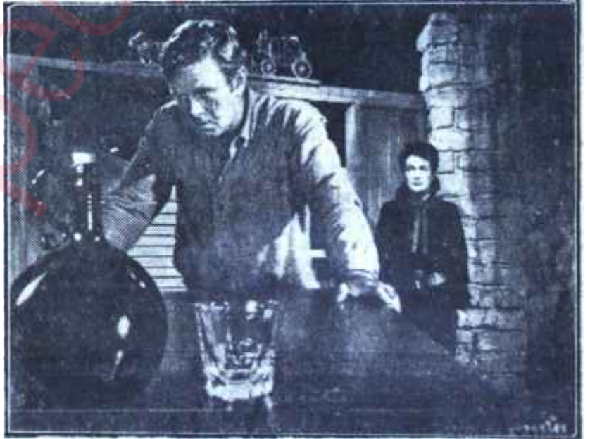
Sterling Hayden ve Joan Crawford "Johnny Guitar"da