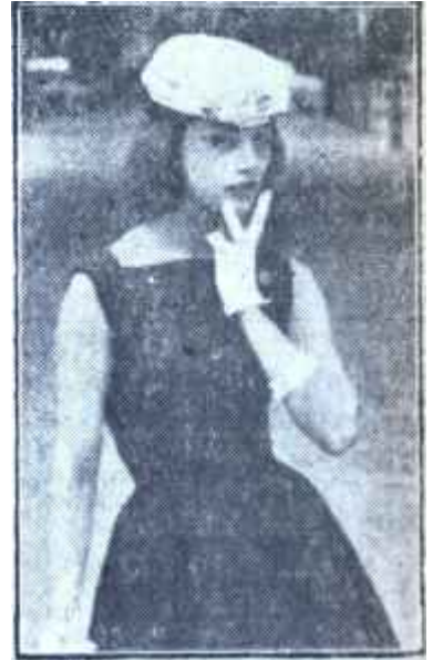
Çok genç kadın Tip No : 3

Jumper-elbise de onun çok işine yarıyordu. Bu umumiyetle koyu renkli, bol etekli Önlük şeklinde bir elbise idi ve içine istediği bluzu giyebilir veya açık yakasına muhtelif yelekler ve jile'ler takabilirdi. Onun kiraz rengi "dra"dan veya kadifeden güzel bir eteklisi vardı. Bu eteklik ile gayet şirin bluzlar, sveterler giyinirdi. Dans ederken süslü bit kumaştan kapalı yakalı ve uzun kollu bir şömizye elbiseyi tercih etmişti. Isıtıcı bir mantosu, kapuşonu, fantazi bir yağmurluğu vardı. Onun en çok sevdiği şey hoş detaylardı: Sık sık değişen yakalar, güzel spor kemerler, fantazi ayakkabılar onun şıklığı yapan şeylerdi.