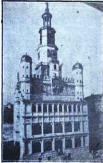
Poznan Belediye binası Hücumun hedefi bu değildi

Geçen haftalar içinde Poznanda başlayan yargılamanın demirperde verisi devletlerinde bundan önce yapılan duruşmalardan farklı olduğunu işaret etmiştik. Duruşmalar gizli yapılmıyor, yabancı, basın mensupları salondan dışarı çıkarılmıyor, yabancı hukukçuların davayı müşahit olarak takip etmelerine müsaade ediliyordu. Bütün bunlar, gerçekten,