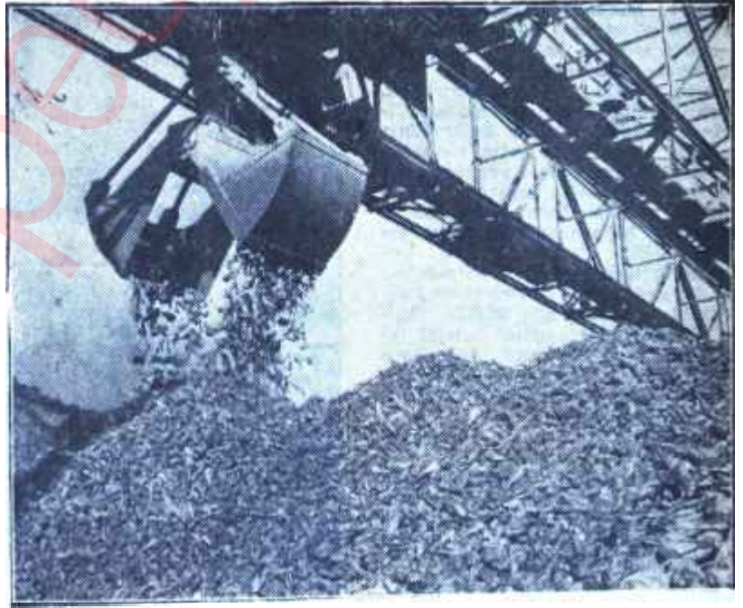
Pancar mahsülü fabrikada İhracat hazırlığı

Bir kere daha sabit oluyordu ki altı yıldır takip edilen iktisadî siyasetin hedefi açık olarak tesbit edilmiş değildi. Böyle bir siyasetin verimli neticeler vermeyeceği, bazı sıkıntılara sebep olacağı da söz gö-türmez bir gerçektir.