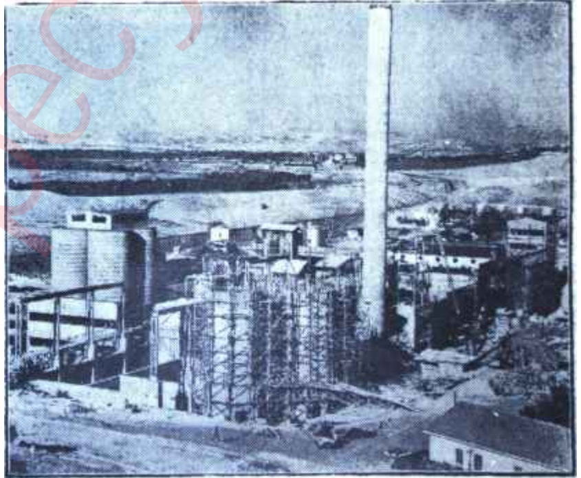
Bir çimento fabrikası Bacalar yükseliyor, fakat...

Sivas fabrikası misalinde Başbakan haklı olabilirdi. Fakat tek başına bu haklılık bile durumu bütün açıklığı ile ortaya koyuyordu. Bir işin içinde pişmiş, o işin bütün inceliklerini öğrenmiş kimseler bile demek ki yanılıyorlardı. O halde o iş hakkında sağlam bilgiye sahip olmayan bir kimsenin yanılma ihtimali çok daha fazla idi. İktisadî mevzular kavranılması güç, karışık mevzular olduklarından durumlarına