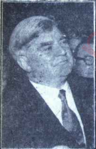
Aneurin Bevan Yeni hesap makinası

Kongrenin toplanmasına takaddüm eden günlerde, İcra Komitesinin bu Sandalyesine başlıca iki aday vardı. Bunlardan biri Partinin sağ kanadını temsil eden Mr. George Brown'du. George Brown, Krutçef ve Bulganin'in geçen aylar içinde yaptıkları Londra seyahatinde bu liderlere yaptığı kaba muamele ile tanınmıştı. İşçi Partisinin Sovyet idarecileri şerefine verdiği ziyafette Krutçef ve Bulganin'e sorduğu suallerle Mr. Brown, Rus devlet adamlarını güç duruma düşürmüş ve ziyafet, bu sualler yüzünden ziyaretin en tatsız safhası olarak karşılanmıştı. O gecedan sonra da açıkça anlaşıldığı gibi, Mr. Brown, Sovyet-