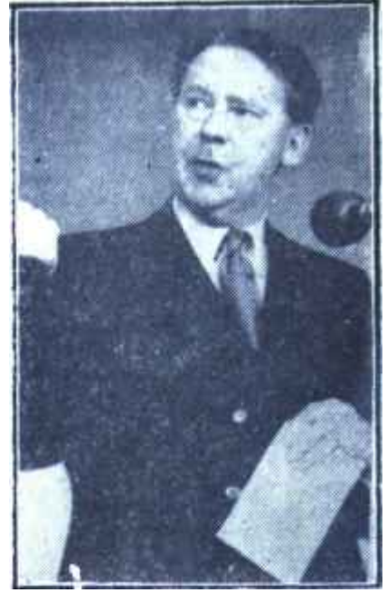
Gaitskell Tesanüd peşinde

Bevan'dı. Bilindiği gibi Bevan, bundan iki yıl kadar önce, İşçi Partisinin sağ kanadı ile anlaşamadığı için Partinin Meclis grubundan ihraç edilmiş, solcu bir politikacıydı. Bevan, komünizme kadar varmamakla beraber,