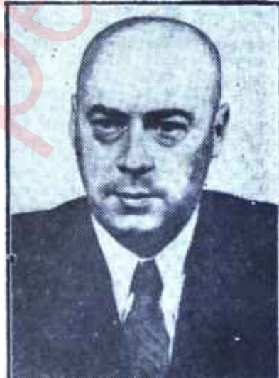
Cyrankiewicz Liberal komünist

Demirperde gerisi devletlerinde, zaman zaman, buna benzer suçlarla sanık sandalyelerine oturtulmuş insanlara, bu insanlar hakkında en ağır cezaların tatbikini isteyen savcılara rastlamak hiç de olağanüstü sayıl-