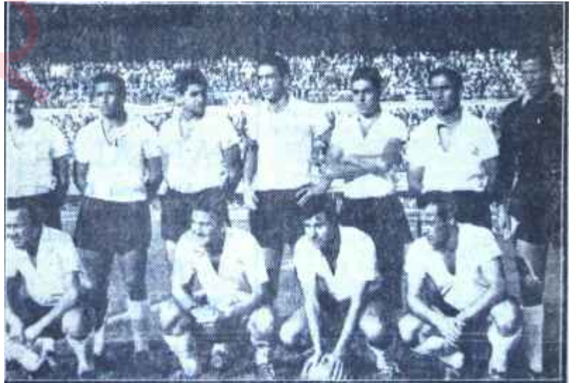
Beşiktaş profesyonel futbol takımı

"San Francisco Operası Müdürü Kurt Herbert Adler, yıldız soprano Renata Tebaldi'nin Francesca rolünü oynayamayacağını öğrendiği zaman Gencer'i angaje etmişti. San Francisco'lu dinleyiciler, bazı zengin aryalara rağmen, Zandonai'nin operasını hareketsiz ve can sıkıcı buldular. Fakat soprano Gencer dinlenecek birşeydi. Sesi büyük, sıcak, güzeldi; heyecan uyandıran bir kudret taşıyordu. Amerika, Leylâ Gencer'den daha çok şey dinleyecektir".