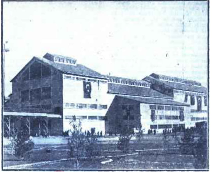
Erzurum Şeker Fabrikası

Birçok ileride başarının şartı, varılmak istenilen hedefin iyice bi-