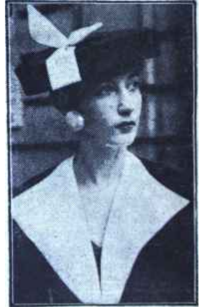
Daima genç kadın

1956 - 57 modasının bir hususiyeti de 1 yaşlı kadın mefhumunu ortadan kaldırmasıdır. Her kadın gençtir, isterse daha da genç olabilir. Neden olmasın? Vaktile kadınlar 30 yaşından itibaren yaşlı sayılmazlar mıydı?