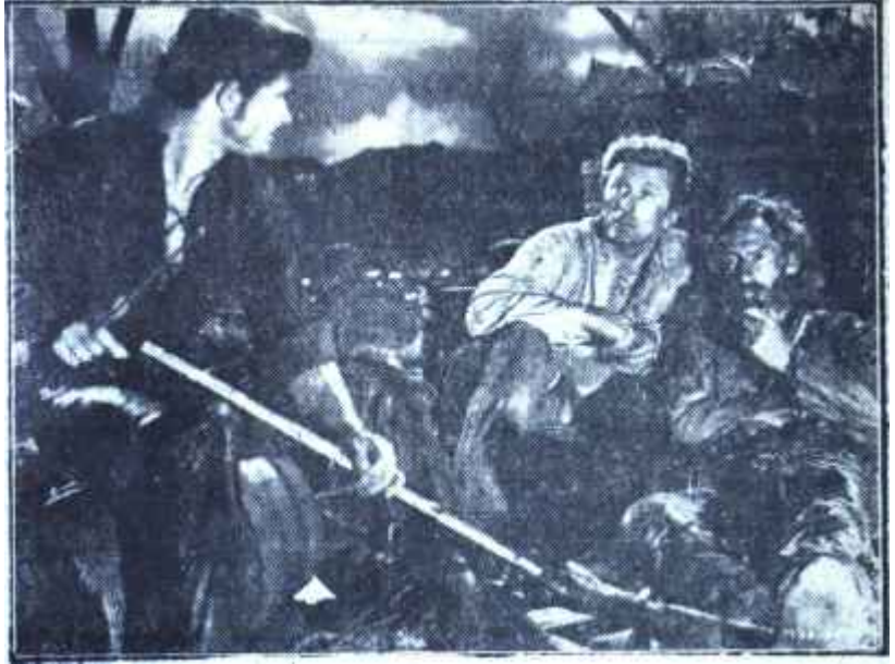
"Yeşil Gözlü Esire"den bir sahne

Film Meksika ihtilâlinin son yılınkûm edilen bir albayın eline fırsat da (1919), kurşuna dizilmeye mah-