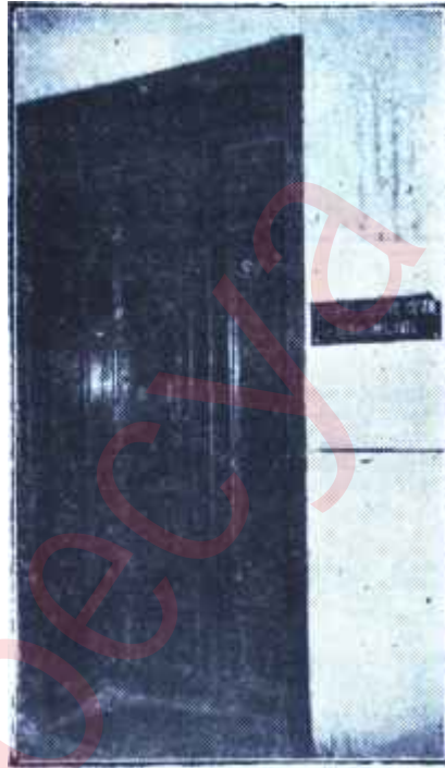
Toplu Basın Mahkemesi Gazetecilere mahsus

C. K. nun 161/3 ncü maddenin tatbiki istenilmiş bulunduğunu ve fiilin suç addedilebilmesi için anasırın tamamiyetinin şart bulunması ve madde unsur olarak ortada bir yazı ve bir fiil mevcut ise de ancak manevi unsurun tecellisi halinde suçun tamam olacağı ve 161 nci maddenin 3 ncü bendinde tadat edilen ammenin telâş ve heyecanını mucip olmak ve maksadı mahsus müstenit bulunma hükümlerinin hadisede var denilemeyeceği ve Basın Kanununun 32 ncü maddesi sarahati müdafaayı teyit eder mahiyette bulunduğuna ve hadisenin matbuattaki intişar şekli ammenin telâş ve heyecanı mucip ve maksadı mahsus kabul edilmediğine göre Akis Mecmuasında neşredilmiş olan yazının suç hududu dahilinde mütalâasının isabetli telâkki edilemeyeceğini ve bu itibarla beraat ka-