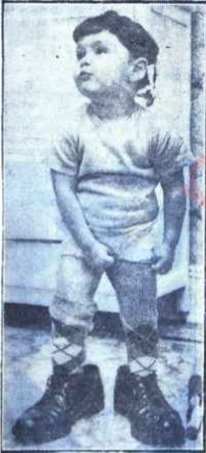
Haşan Çocuk Bir mütecessis

Liyakat kazanmadan ehliyetname alanlar, çalışmadan vazife başında tutulanlar, muvaffak olmadan alkışlananlar hep bu marazi acıma hissini neticesi değil midir. Fertlerle karşı karşıya geldiğimiz zaman göstereceğimiz zaaf- lar, ekseriya cemiyetin aleyhindedir ve kendi kendimizi tatminden başka birşeye yaramaz. Az sempatik olmak pahasına da olsa, ileri memleketlerde merhamet gizlidir.