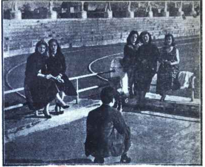
Altın yumurtlayan tavuk: Turist!..