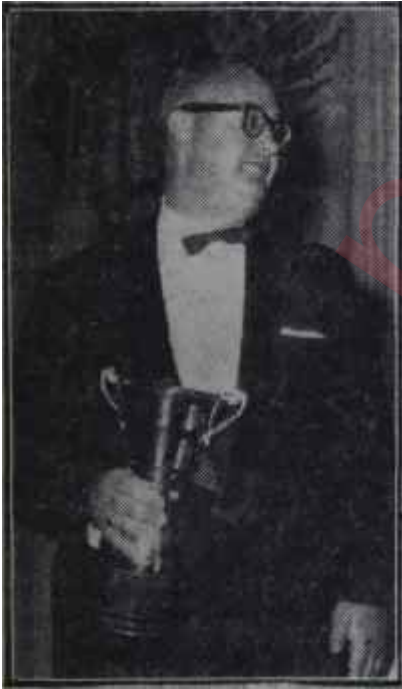
Robert Aldrich En iyi rejisör!

Seyirci geçen yıl beliren tehlikeleri hatırlayarak bol Amerikan filmi görmeme endişesine de kapılmamalıydı. Amerikalı filmcilerin alacakları hâlâ transfer edilmemişti ama, Türk seyircisi Amerikan elçisinin şahsi tavassutu, sayesinde Hollywood şaheşerlerinden mahrum olmayacaktı. Elçi arabuluculuk yaparken, Amerikan filmlerinin Amerika için sağladığı propagandanın yanında Hollywood stüdyolarına olan borcun devede kulak kalacağını hesaplamıştı. Fakat işin ticarî yönünü de küçümsemek gerekirdi. Avrupalı filmciler Amerikalılardan açılacak yere talipti. Kredi vermeyi de kabul ediyorlardı. Seyircinin bol ve iyi Avrupa filmi seyretmesi bu sefer, mesela Fransız yahut İtalyan filmleri tiryakileri yaratacak, ticarî muvazene sağlandıktan sonra yeniden Amerikan filmi alışkanlığı aşılacak pek güç olacaktı. İyisi mi, böyle bir karışıklığa meydan vermemek için borçlar bir müddet daha birikebilirdi.