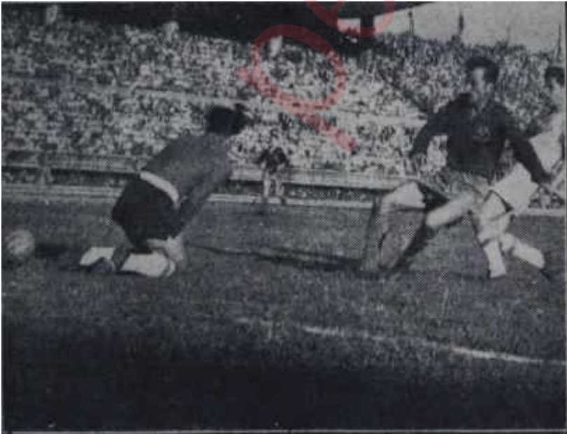
Dinamo Galatasaray'a gol atıyor