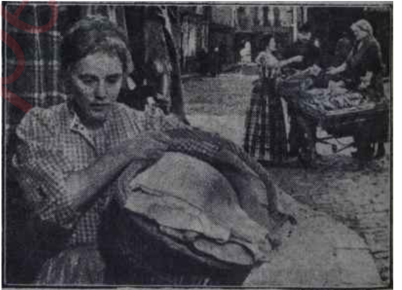
Maria Schell "Gervaise"de Hakedilen bir sanat mükâfatı

Luis Bunuel'in İspanya'dan ayrılı- şındanberi uykuya dalan İspanya sineması, L. G. Berlangâ ve J. A. Bardem gibi iki kuvvetli şahsiyet sa-