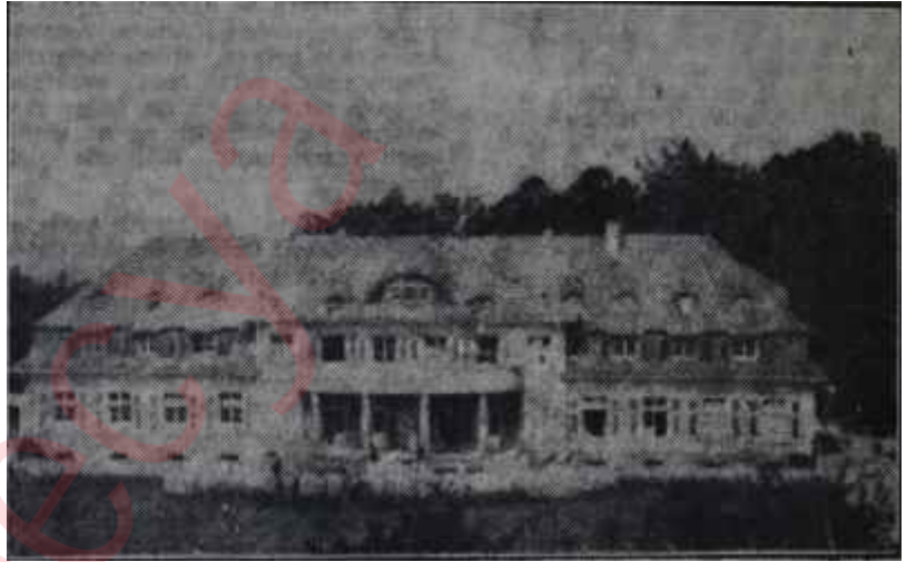
Darmstadt Modern Musiki Okulu Dağ başındaki hür ses...

daki ciddiyet sayesinde kazanmıştı. Okulun hususiyetleri, oraya bir defa uğrayan bir musikişinası her yıl ziyaretini tekrarlamağa sevk etmekteydi. Çünkü orada, modern musikin teknik ve estetik meselelerim dostça münakaşa edebilme imkânını buluyor, günümüzün musikisini bol bol dinleyebiliyordu. Halbuki, memleketine döndüğünde, konser dinleyicilerinin karşısına hâlâ Beethoven yahut Çaykovski senfonilerinin çıkarıldığını, "Webern" isminin "Weber" diye yanlış imlâyla yazıldığını, "Sihirbazın Çırağı"nın modern musiki diye sunulduğunu görüyordu; Geçenlerde, Darmstadt Tatil Kursu'nun çalışmalarını hakkında "Musical America" dergisine bir makale yazan muhabir -David Hicklin şöyle diyor: "Darmstadt'daki konser dinleyicilerine bir göz gezdirince insan, meselâ Ankara'lı bir çağdaş musiki me-