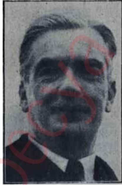
Sir Anthony Eden

Bilindiği gibi bu konferansa 24 devlet davet edilmiş, ancak 22 devlet katılmıştı. Mısır, konferansa kanaldan faydalanan bütün devletlerin çağrıldığını, bunun çok ufak ve da-