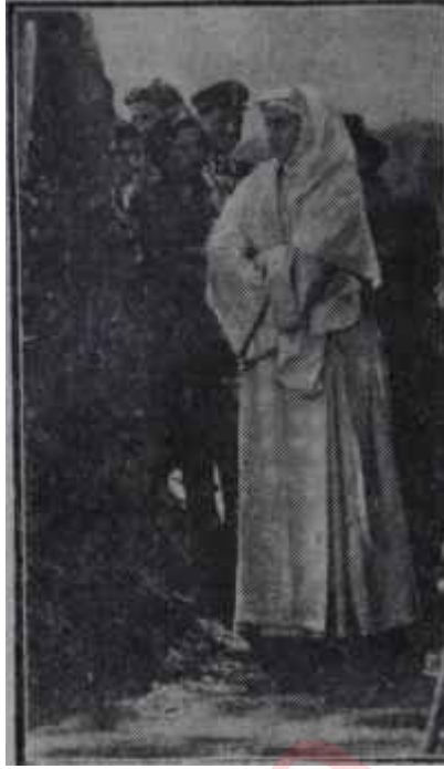
Magnani "Soeur Loetizia"da Venedikteki İtalya

hibi sinemacıyla, Avrupa'da İtalyan sinemasından açılacak yeri doldurmaya hazır olduğunu ispat ediyordu. Festivalin bir başka keşfi de Yunan sineması olmuştur. Nikos Kunduros'un "Drakon"u değişik tepkiler yaratmış, bazı kritiklerce festivalin yüz karası olduğu iddia edilmiş, bazıları ise genç rejisörün trajik mizahını öve öve bitirememişlerdi. Haklı haksız bir yana işin ticari cephesi de Yunanlıların yüzünü güldürecek durumdaydı. Mihail Kakoyannis'in "Stella"sından sonra bir Yunan filmi daha, Nikos Kunduros'un "Drakon"u Avrupa sinema salonlarını dolaşmaya başlayacaktı. Kakoyannis ve Kunduros adlarının da hatırdan yer etmesinden sonra Avrupa'da sesi duyulmayacak kadar cılız olan yalnız Türk sineması kalıyordu. Bu acı gerçek karşısında sinemacılarımız milli sinemamızın yolunu hâlâ "Kamelyalı Kadın"larda, "Papatya"larda arıyorlardı. Halbuki hedefe çiçekli yollardan değil, çeşitli müşkül ve mânilerle dolu kayalık geçitlerden gidiliyordu. Umursamazlıkları lâubalilik derecesine yaran prodüktörlerimiz Venedikteki Yunan başarısından ders almıyorlardı.