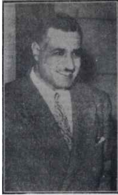
Cemal Abdülhâsır İkinci bir Musaddık mı?

Amerika Birleşik Devletlerinde iyimser bir hava vardı. İktisadî durumun sağlamlığına güveniliyordu. Otomobil sanayiinde geçenlerde kendini gösteren buhran bu güveni sarsmamıştı. Meşhur çelik grevi de, enflasyoncu baskıyı artıracak neticeler vermiş olmasına rağmen, umumiyetle kötümser olmayı gerektirecek bir şey olarak kabul edilmiş değildi. Grev neticesinde işçi ücretleri ile bir---- çelik fiatları da yükselmişti. Çelik fiatlarının yükselmesi, içinde çelik bulunan istihlâk maddelerinde kendini gösterecekti. Nitekim otomo-