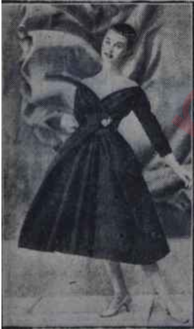
Dior'un siyah elbisesi % 100 Parisli

Pariste büyük terziler defileleri tertipliyerek modellerini teşhir ederler, nihayet bu modellerin fotoğrafları basına verilir ve böylece bütün dünya yem modanın hatlarını öğrenir. Moda muharrirleri ise resimlere iyice bakar, tefsirleri okur ve kendi görüşlerine göre yeni hatlara bir isim takarlar. Bazıları için bu senenin hattı "zeytin" hattıdır. Çünkü bu hat kadına bir zeytin yuvarlaklığı ve oval bir manzara vermektedir. Üstelik zeytinin çeşitli ye-