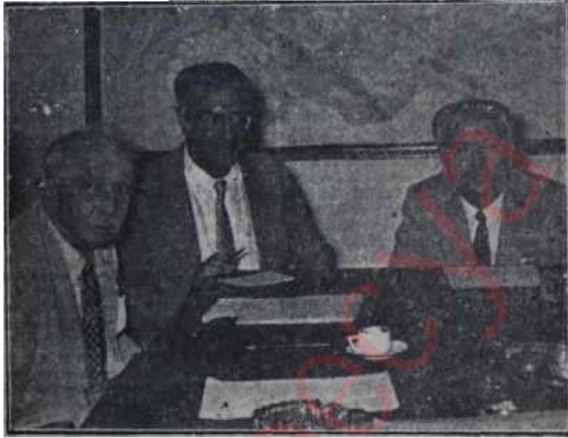
İnönü — Gülek — Karaosmanoğlu