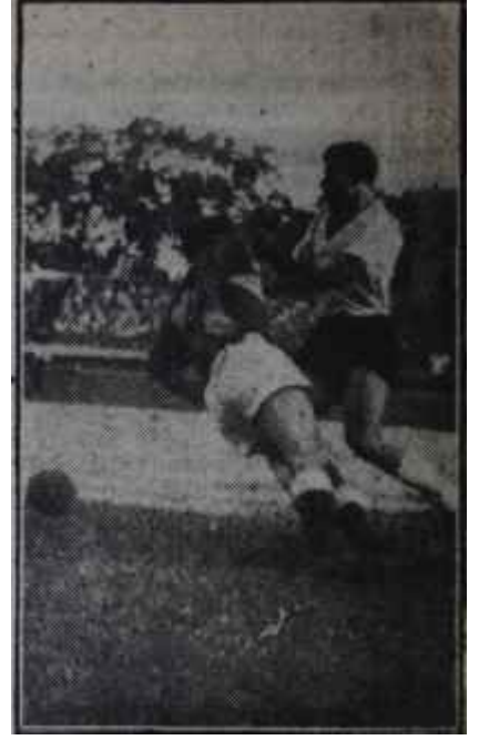
Beşiktaş — Vefa, İtiş - kakış!.

Geçen pazar günü Mithatpaşa Stadının tribünleri tıklım tıklım dolmuştu. İstanbul Valisi Gökay mikrofonun başında heyecanlı bir konuşma yapıyordu. Bu seferki konuşması şehir işlerine ait değildi. Ne bir çeşme yapılmıştı, ne bir mektebin temeli atılıyordu, ne de bir kurdele kesiliyordu. Bu konuşma sportifti. Galatasaray'ın 50 yıllık hizmetleri belirtiliyordu. Gerçekten Gökay bu mev-