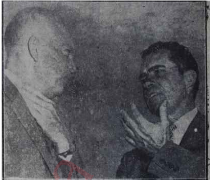
Başkan Eisenhower ve Yardımcısı Nixon