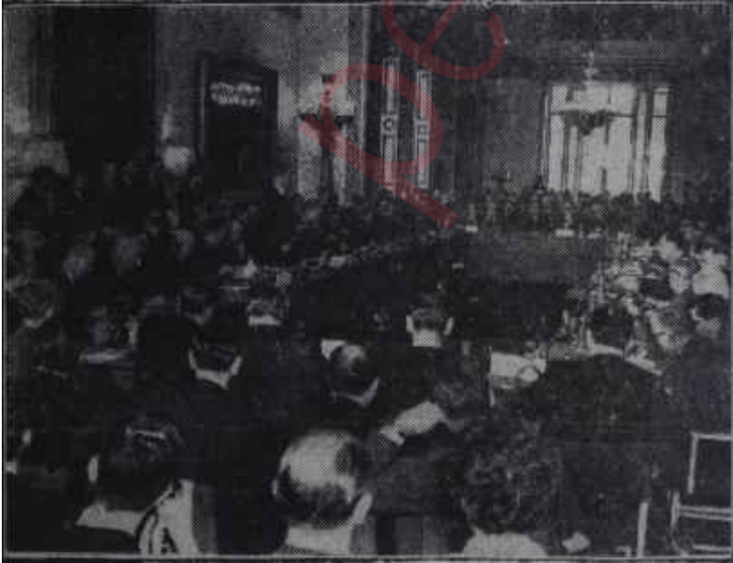
Konferansın açılışından bir görünüş

Gerçekten Şepilof'un bu sözleri Mısır Başbakanı Nâsır'ın geçen pazar günü yaptığı basın toplantısında söylediği sözlerden farksızdı. Şepilof, öyle anlaşılıyor ki, böyle konuşmakla hem Mısır'ı tatmin etmek, hem de meseleyi ileride toplanacak daha geniş, bir konferansa havale ederek orada daha başka meseleleri de kendisi için daha elverişli şartlarla ele almak imkânını hazırlamak istiyordu.