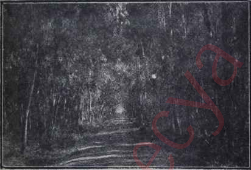
Alâka mevzuu ormanlarımız Parti disiplinine yağmur çekti

O halde, Zirai Mahsuller vergisi veya Orman Kanunu mevzuunda kudretini duyuran seçmen, niçin aynı milletvekillerinin rejim meselelerindeki reylerine o nisbette tesir edemiyordu? Bunun kusurunu sadece milletvekilinde değil, seçmende aramak lâzımdı, işte bir kanun! Hem de mühim bir kanun.. Hükümet ehemmiyet veriyor, geçmesini istiyor. Ama milletvekilleri mukavemet ediyorlar. Bir çoğu çıkıyor, çok şiddetli tenkidlerde bulunuyor. Sonra Basın Kanunu geliyor. Hükümet ona da ehemmiyet veriyor. onun da geçmesini istiyor. Ama kürsüde, aleyhte vaziyet alacak bir tane milletvekili görünmüyor. Niçin? D.P. Grubu ittifakla basına konulan tahditleri lüzumlu mu buluyor? Hayır! Ancak seçmen o mevzuda kuvvetini ve işe verdiği ehemmiyeti kâfi derecede vüzhla gösterememiştir. Milletvekili, seçmenin memlekette Basın ser-