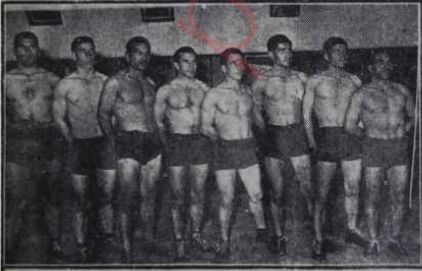
Denizli Güreş Takımı

Kendi köşelerinde sakın sakın çalışan Denizlili güreşçiler, dünya şampiyonlarına kafa tutmakla bizde güreşin gerçekten ata sporu olduğunu isbat ettiler. Seyirciler de güreşteki başarılarımızın fertlerle daimi olmadığı bir kere daha yakinen görmüş oldular. İlk adımı atılmış olan müsabet çalışmalarından dönülmeyerek eldeki mevcut antrenörlerden gerektiği gibi istifade edilmesi güreşçilerimize yeni ufuklar açacaktır.