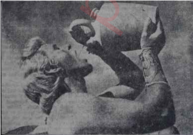
Richard Burton "Büyük İskender" de

Mondial - Star şirketinin listesindeki 42 film arasında alâka çekici birkaç Amerikan filmi bulunmasına rağmen Avrupa Stüdyolarının kalbur üstü hiçbir eserine rastlanmayışı büyük bir eksiklik .