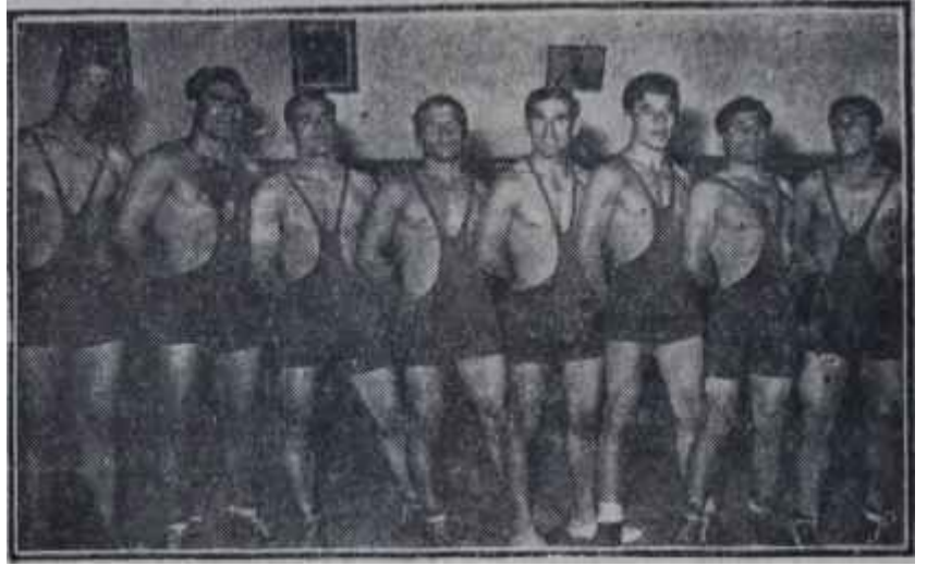
Ankara Güreş Takımı

İdare heyeti toptan istifa eden kulüp Fenerbahçe olsaydı; gazete-