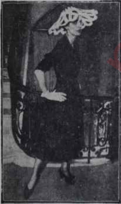
Yeni sonbahar modası

İşte bu iki prensip kadınları şapşallıktan ve şişman görünmekten kurtarmak için düşünülmüştür. Böylece kadın en ince ve cazip tarafını