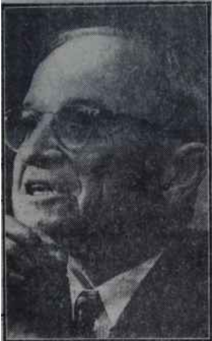
Harry S. Truman Senarist

matikman cumhurbaşkanı olursa., Cumhuriyetçi partinin "kudema" sı yani Taft'ın intikamını almayı düşünen reaksiyoner kanadının gizlice tahayyül ettiği bu ihtimal, partinin liberal unsurlarının son derece korkutuyordu. İşte Stassen'in Ike'in tarafsız, fakat mütebessim nasılları önünde Nixon'a sertçe cephe alışı, bu genç ve zeki Cumhuriyetçi liderin kariyeri ile ilgili hesapları bir yana, Ike'ı bile başkanlığının ilk senelerinde bocalatan bu ananeperest cumhuriyetçilere başkanlık yolunu kapatıyordu. Dış politika meselelerini halâ tecritçi devirlerden kalma itiyâdlarla incelemeye alışık eski Cumhuriyetçilerin Nixon'un arkasında sıralanmalarına bir mukabele olmak üzere Ike'in silahsızlanma sekreteri Stassen, liberal vali Her-