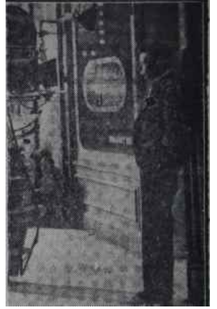
Frank Sinatra kamera önünde

Listenin içinde bir de renkli cines-mascope spectacle var: "Büyük İskender - Alexander the Great". "Time" bu filmde bahsederken, filmi İspanya'da hazırlayan Robert Rossen'in 4 yılda 4 milyon dolar harcadığını yazıyor ve İskenderin İrani daha kısa zamanda daha az masrafla zaptettiğini de ilâve ediyordu. Rossen tarihî gerçekleri yakından takip etmekte, fakat işin içinden çıkamadığı zaman hikâyeyi görüntülerle anlatamayıp sözlerle sığınmaktadır. Böylece film dramatik hikâye olmaktan çıkıp tarihî kronikler haline gelmektedir. Ama Rossen'in Robert Wise'dan hiç te aşağı sinemacı olmadığını düşünülürse "Büyük İskender" in geçen yılın "Güzel Helen" inden daha geniş bir alâka toplamasını beklemek yerinde olur.