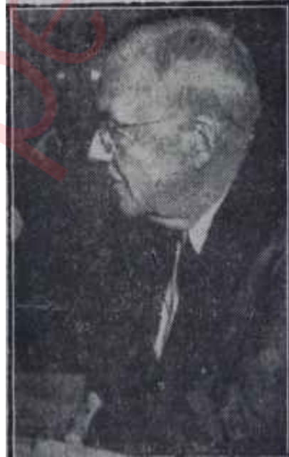
John Foster Dulles

Konferansın ilk iki gününde yapılan konuşmalardan sonra karşılıklı taraflar arasındaki görüş ayrılıkları resmîyete dökülmüştür. Gerçekten, Batılılar ile Sovyet - Mısır bloku arasında Süveyş konusunda