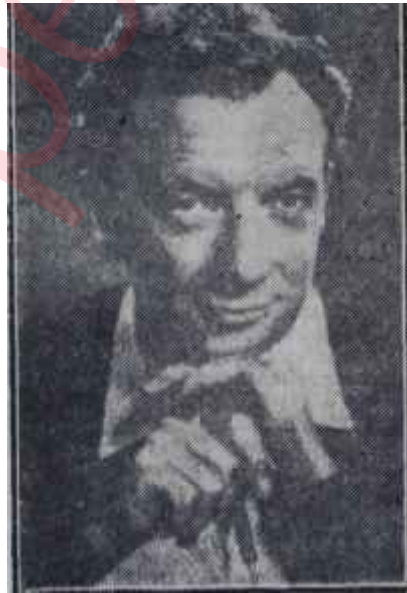
Benjamin Britten Notaları karalanacak

kaydetme ihtiyacını duymuş, bir ressam ve musikişinas olan Rudolf Benesch'le beraber yeni bir yazı sistemi üstünde çalışmaya başlamıştı. Üç yıl sonra Joan Benesch, Sadler's Wells trupuna katıldı. Orada Benesch'ler., sistemlerini deneme ve tatbik imkânını buldular. Kolaylık için, kayıtlarını, bildiğimiz beş çizgili musiki portesi üzerine yapıyorlar ve danstaki hareketleri musikinin ritmlerine, vurgularına, nüanslarına uydurarak, doğrudan doğruya notaların altına yazıyorlardı. Yazı tarzları şu esasa dayanıyordu: Bir dansçıyı portenin tam üstünde arkadan görünmek üzere tasavvur ediyorlar ve vücudun mühim kısımlarının - eller, dirsekler, ayaklar, dizler, baş, vs. - bu durumda tam görünüşlerini kesin olarak çiziyorlardı. Böylece dansçının duruşunu üç boyut içinde kolaylıkla kaydetmek ve okumak mümkün oluyordu. Bu usulü geliştirerek hareket hatlarını da kaydetmeğe başladılar. Nihayetinde dansçıların tek veya grup halinde hareketlerini, dolaşmalarını, istikametlerini her bir dansçının muayyen bir anda sahnedeki mevkiini gösteren "partiyonlar" meydana getirdiler.