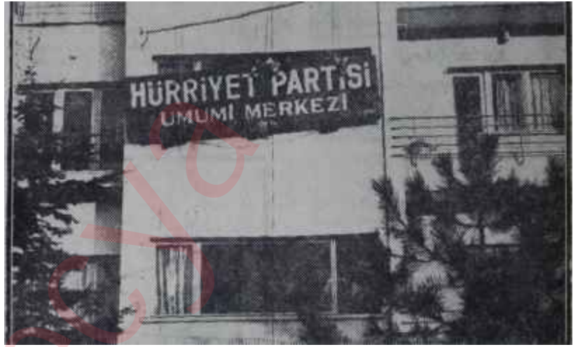
Hürriyet Partisi Merkezi Siyasî İlimler Akademisi

Hür. P. Büyük Meclis içinde en kuvvetli gruptu. Ne var ki bu kuvvetinden dahi layıkı veçhile istifade etmiyordu. Partinin Meclis içindeki faaliyeti dahi kıvılcım kıvılcımdı. Bir meselede başarı gösteriliyor, sonra ipin ucu bırakılıyordu. Bilhassa iktisadî meselelerde Hür. P. kıymetli mütehassıslara sahip bulunduğu halde tenvir ve tenkid vazifesini iyi yapmıyordu. Milli Korunma Kanununun müzakeresi sırasında ortaya atılan fikirler üzerinde sonradan ısrar edilmemiş. Parti uykuya dalmış, seçim bölgelerine gidenler, kendilerinden bahsettirmemiş, gazeteciler gerektiği şekilde tenvir edilmemişti. Bütün bunlar bir araya gelince kısa bir zaman evvel umumi efkârın alâka mihrağı olan Hürriyetçiler karanlığa gömülmüşlerdi. Hür. P. nin avantajlarını kaybet-