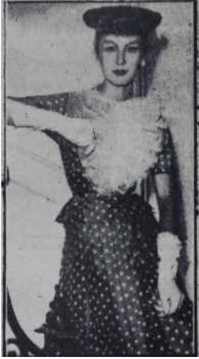
Bir hazır elbise

Dünyanın her tarafında ve sayfiye yerlerinde tatil ve istirahat, yaz sporları ve eğlenceleri devam ederken modanın merkezi olan Paris, hummalı bir faaliyet ve çalışma devresine girmiş bulunuyor. Büyük terliler 1956 - 1957 kış modellerinin sırrını sıkı sıkı muhafaza etmeye çalışırken, Parisli hazırlıyeciler ilk yenikleri çoktan piyasaya sürmüş bulunuyorlar. Modanın esas hatlarını ancak ve ancak Parisli büyük terziler değiştirirler. Bu bütün dünyanın onlara verdiği bir imtiyazdır ve hazırlıyeciler de bu kaideye riayet ederek mevsim başı değişikliklerini moda hatları üzerinde değil, ferruat üzerinde yaparlar. Bu bakımdan Patiste ilk sonbahar kokusunu taşıyarak vitrinlere çıkan hazırlıyeciler daha ziyade geçen mevsim modasının bir devamıdır. Daha doğrusu hazırlıyeciler geçen mevsimde kadınlar tarafından en çok beğenilen, en çok tutulan elbiseleri kendilerine model itihaz ederek bunları daha cazip, daha kullanışlı, daha pratik şekilde hazırlamaya gayret etmişlerdir. Böylece henüz kadınlar plajlarda istirahat edip yanarken 65.000 işçi Pariste onlar için çalışmış ve tatil dönüşü onları vitrinlere cezbedecek yirmi milyon parça giyim eşyası hazırlamışlardır.