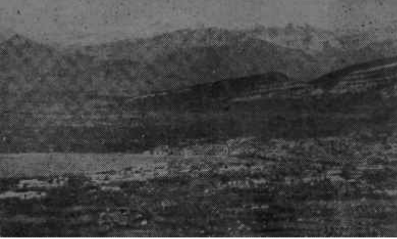
Cenevreden bir görünüş İncir çekirdeği gene dolmadı

Fransız Başbakanının ötedenberi yeni seçimlere gidilmesine taraftar olduğu bilinmekteydi. Ancak Fransız Meclisine bu yolda getirdiği bir teklif, peşinden bir de "seçim sistemi" meselesini sürüklemekte gecikmemiştir. Gerçekten Fransada kurulan Meclis ve kabinelerin istikrardan mahrum bulunması milletvekillerinin büyük bir kısmını ötedenberi düşünceye