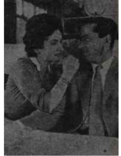
Bay ve Bayan Skofic Meşhur olmanın derdi

Vakıa "Ekmek, aşk ve fantezi" filminde Gina süksesini giyindiği paçavralarla yaptı ama Gina'nın gardrobu fevkalâde zengindir ve hususi hayatında değilse bile davet olunduğu toplantılarda daima gayet şatafatlıdır.