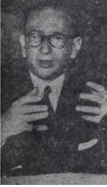
Edgar Faure Seçmen önünde

sevketmekteydi. Faure'un yaptığı teklif, bu meselenin de Meclis önüne getirilmesi için bir vesile teşkil ediyordu.