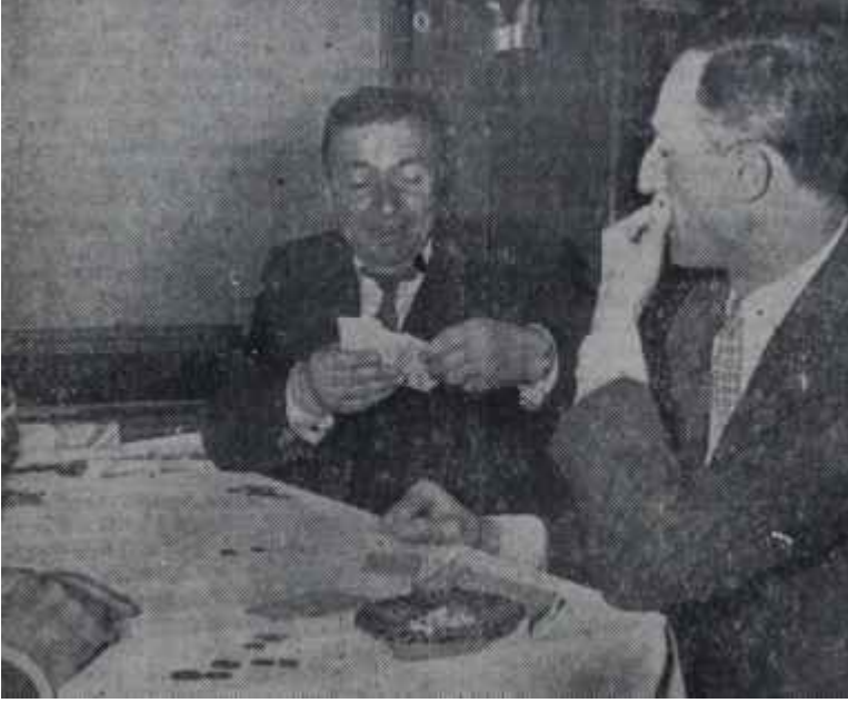
Kayseri'ye hususi trenle gidiş Kalkınmanın büyük heyecanı içinde...