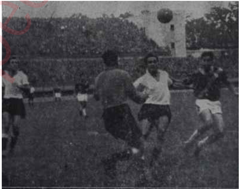
Beşiktaş — Galatasaray maçı Galibiyetten mağlubiyete

Haldun Dormen, kendisi gibi genç ve fedakâr arkadaşları ile giriştiği bu teşebbüsünde yalnız bırakılmamalıdır, zira bu gençler sahnede gösterdikleri başarı ile kendilerini seyredenlerde büyük ümitler uyandırmıştır. İstanbuldan on gün için Ankaraya gelen bu genç tiyatro heyeti, gördüğü alâka üzerine ikametini bir o kadar daha uzatmaya mecbur olmuştur. Bu hadise, tıpkı geçen sene aynı sahnede temsil edilen Jezabel piyesinde olduğu üzere, Ankaranın bir hamle tiyatrosuna muhtaç olduğunu ispat etmekte, Ankaralı seyircinin Devlet Tiyatrosu repertuarını tasvip etmediğini anlatmaktadır. Fakat anlayan kim?