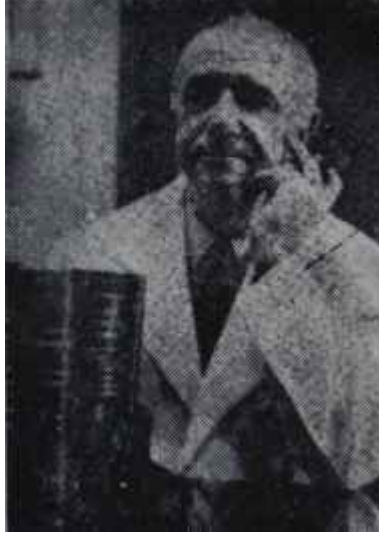
Dr. Vincent du Vigneaud

Elektron, tabiatta elektrik yükü taşıyan en küçük parçacıktır. Daha 1897 de J. J. Thomson tarafından keşfedilmiş, o zamandan beri aralıksız yapılan deneylerle özellikleri her sene biraz daha anlaşılacak ve nihayet 1928 de İngiliz fizikçisi P.A.M. Dirac'ın teorisine hüviyeti tamamen ortaya konmuştu. Bütün deneylerin iyice gerçekledikleri Dirac elektron teorisi modern teorik fiziğin en güvenilen, en güzel eserlerinden biri haline gelmişti. İşte şimdi, Lamb'in ölçüleri elektrik kuvvetler karşısında, Kusch'un ölçüleri de manyetik kuvvetler karşısında elektronun Dirac teorisinden biraz farklı hareket ettiğini gösteriyordu. Aradaki fark doğrusu pek azdı ama gene de deney hatası sayılamayacak kadar büyüktü. Ortada açıklanmaya muhtaç yeni bir olay vardı. Bir heyecan dalgası bütün teorik fizikçileri sardı. Acaba o kadar sevdikleri, güvendikleri Dirac teorisinin de son günleri mi gelmişti? Bunu da şimdiye kadar deneyin geride bıraktığı sayısız teori gibi terk edip yerine daha ileri, belki bambaşka bir teori bulmak mı gerekecekti? Meselâ Einstein'ın izafiyet teorisinin doğuşunun sebebi de New-