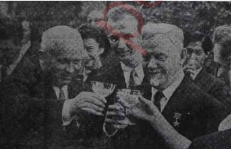
Kruşef ve Bulganin Kuzuyu gözlleyen kurt

"— Batılılar teklif ettiğimiz yeni Avrupa güvenlik sistemi projesine da-