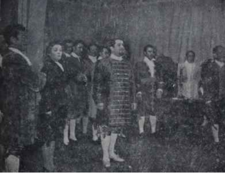
Maskeli Balo Güzel sesler, güzel yüzler

ettiği görülüyordu. Ses için fazla bir şey ilave etmemiz lüzumsuz. Pes seslerdeki rahatlığını bilhassa belirtelim. Keza pianissimolarındaki bıraklık, dinleyicilerin hayranlığını - haklı olarak - büsbütün arttırmakta idi. İlâve edeceğimiz bir nokta daha var : Alkışlara fazla selâm vermesi eserin bütünlüğünü bir hayli ihlâl ediyordu ki buna hiç de lüzum yoktu.