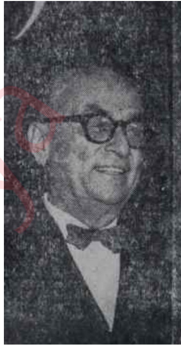
Cumhurbaşkanı Celâl Bayar

Gayrimesul bir mevkide bulunan Cumhurbaşkanı Celâl Bayarın memleketi böylesine mesuliyet altında bırakan bir demec vermek hakkına sahip olup olmadığı, üzerinde durulacak bir anayasa meselesidir. Anayasa harbe karar vermek yetkisini doğrudan doğruya Türkiye Büyük Millet Meclisine bırakmaktadır. Ürdünle aramızda bir ittifak mevcut bulunmadığına göre mesele Mecliste görüşülmüş dahi değildir. Kaldı ki bir harbin âdetına meselesi olduğu Orta Doğuda Arap - Yahudi ihtilâfı dolayısıyla Türkiye'nin bu şekilde bir vecibe yüklenmesini Türkiye Büyük Millet Meclisinin kabul edip etmeyeceği son derece şüphelidir. Hal böyle iken Cumhurbaşkanı Celâl Bayarın İsrail hududunu gezmekle de kalmayıp yakardaki beyanatı yapması hadisesinin, hükümet tarafından Meclise izah olunacağına ümid etmiyoruz. Eger İsralden Ürdüne gelecek bir tecavüz dolayısıyla Türkiyeli harbe sokmak bugünkü hükümetin politikası ise onu da tasvip etmediğimizi söylemeliyiz.