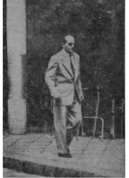
Ben Yusuf bekliyor Sabreden derviş

Ancak bu neticeye ulaşmak Faslılar için sanıldığı kadar kolay olmamıştır. AKİS okuyucuları Fas milliyetçileri ile Fransızlar arasında geçen kanlı hadiseleri, Fas meselesinin zaman zaman geçirdiği karışık safhaları bu sütunlarda takip etmiş bulunuyorlar. Kısaca tekrarlamak lazım gelirse denebilir ki Fas meselesi, şimdiye kadar, başlıca üç büyük safhayı arkasında bırakmıştır. Bunlardan birincisi İkinci Cihan Savaşının sona ermesinden sonra her Kuzey Afrika memleketinde olduğu gibi Fas'ta da cereyan eden ilk hadiselerdir ki Muhammet Bin Yusuf'un tahttan uzaklaştırılmasına kadar devam etmiştir. İkinci safha Bin Yusuf'un tahttan uzaklaştırıldığı 1053 Ağustos'u ile içinde bulunduğumuz 1055 yılının Ağustos ayında Faure kabinesinin beş bakanı ile Faslı temsilciler