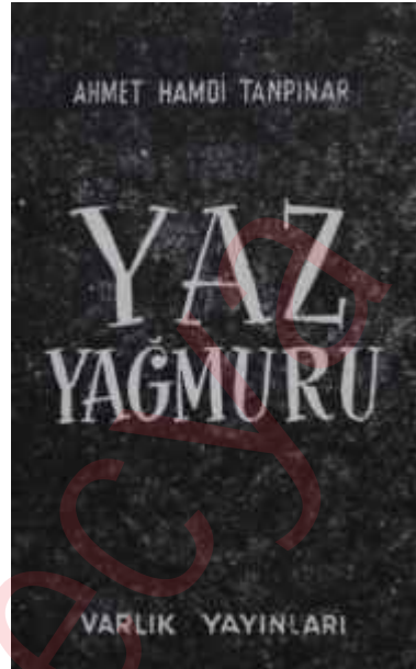
Yaz yağmuru Bereket getiriyor

Bu müşahedelere dayanarak mu-harririn mizacına, yahut bu hikâyeleri yazdığı sıralardaki ruh durumuna dair hükümlere gidecek değiliz; za-