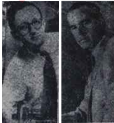
Kusch ve Lamb

ton mekaniğinin izah edemediği pek küçük farklar olmuştur. Fakat Dirac teorisinin hayranları korktuklarına büsbütün uğramadılar. Zamanımızın en parlak teorik fizikçilerinin kesif gayretleri kısa bir zaman içinde gösterdi ki, yeni deneyler Dirac teorisinin yanlışlığını ortaya koymamaktadır. Bunlar sadece onun tatbik edilemeyeceği bir duruma aittirler. Deneyleri izah etmek için Dirac teorisini de içine alan ve esasları senelerden beri zaten mevcut olan daha geniş bir teoriyi kullanmak gerekiyor. İyi ifade edildiği zaman bu geniş teoriden - ki ilmi adı alanlar teorisidir - yeni sonuçlar pek âlâ çıkarmak mümkündür. Elektron karakterini tamamen belirtmek için Dirac'inkinden daha geniş bir teoriye ihtiyaç olduğu böylece ilk defa kesin olarak meydana çıktı. Bugün Lamb ve Kusch'un deneyleri elektronun yapısı hakkında son görüşleri temsil eden