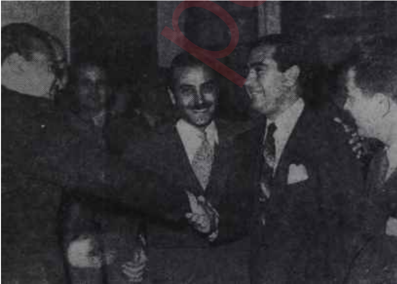
Beraattan sonra tebrik Darısu cümleinin başına !

T. C. K. nün 192. nci maddesinde yazılı "Bir hususu isnat etmenin" bir kimsenin yapmadığı, işlemediği hu-