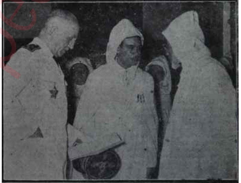
Fas Sultanı ve yeni Fransız Valisi

Kuzey Afrika'da, Hindicini'de köhne sömürge siyasetini zamanımızda da devam ettirmek itiyadında olan Fransız idarecileri ve çoğunluğa hakim politikacılar eninde sonunda hesaplarında yanıldıklarını anlayacak-