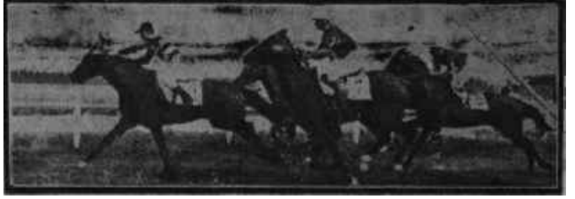
Bir koşunun bitışı Bir de eksiklikleri bite