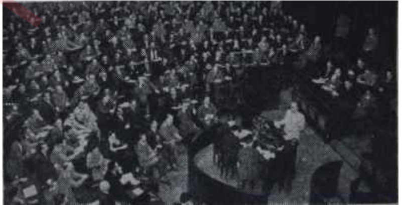
Tek Sesli memleket: Yugoslavya

Politikanın bir takım icapları vardır. Demokrasinin de öyle. Demokratik rejimlerde, muvaffak olamayan yerini başkasına bırakır. Teni tedbirleri başkası dener. Aynı şahsın her yolu denemesi, yaptıklarını inarak, bilerek yapmadığının delili olmaktan başka mâna taşımaz. Milli Meclislerde hükümet başkanlarının itimat isterken programlarını en ufak teferruatına kadar açıklamalarındaki sebep budur. Hükümet başkanı bir yol tavsiye eder. Meclis beğenirse, ona fırsat verir. Ama yolun çıkmaz olduğu görülünce adama «efendi, haydi baka» lm» denir ve o adam çekilir. Zaten yaptığını bilerek, inarak yapıyorsa başka bir yol tutmasına imkân da yoktur. Zira batıda devlet adamının bir başka mânası prensip adamdır.