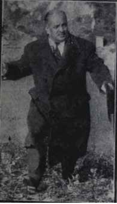
Fahrettin Kerim Gökay