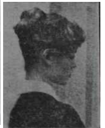
Brigitte Bardot iddiasını ispat ediyor Bu, uzun saçta dair atasözü değildir