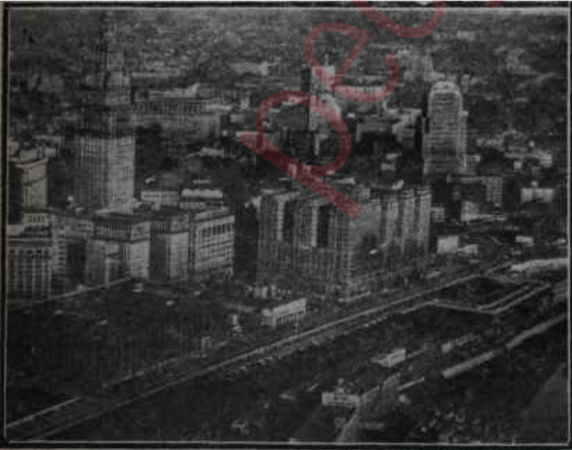
Newyork'tan bir görünüş