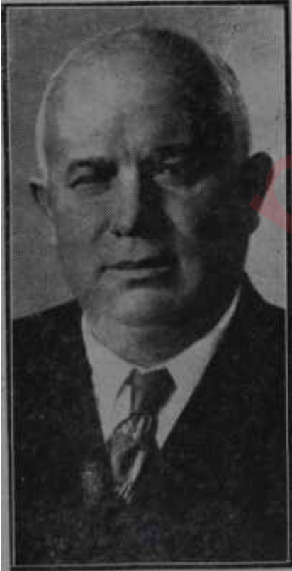
N. S. Krutchev Silâhlar onun elinde

Moskovada bulunan kordiplomatik mensupları ve yabancı basın müntesipleri geçen haftanın başlarında kendilerine birer davetiye geldiğini öğrenince şaşırdılar. Davetiyelere birer de harita eklenmişti ve haritada, bir zamanlar Çariçe Katerinanın gözdelelerinden Orlov Kontuna ait olan ve Moskovanın 100 km. kadar güneyinde bulunan bir malikânenin yeri ve yolu gösteriliyordu. Bu malikânenin şimdi Sovyet Konseyi Başkanı Bulganin tarafından yazlık ikametgâh olarak kullanıldığını bilenlerin hayretleri ise iki katlı olmuştu.