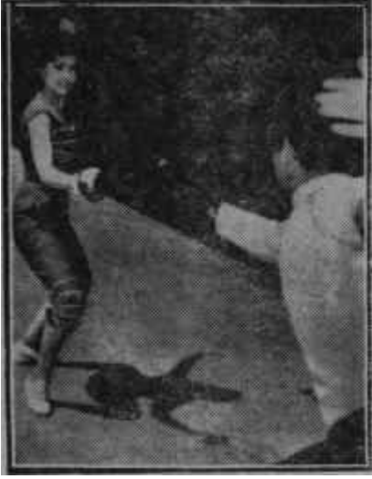
Gina Lollobrigida Eli kılıçlı kadın

cinsleri plajlarda serinlerken, Lollobrigida sıkı elbiseler içinde, eskrim öğreniyordu. Çünkü yeni rolü, icab ettiriyordu.