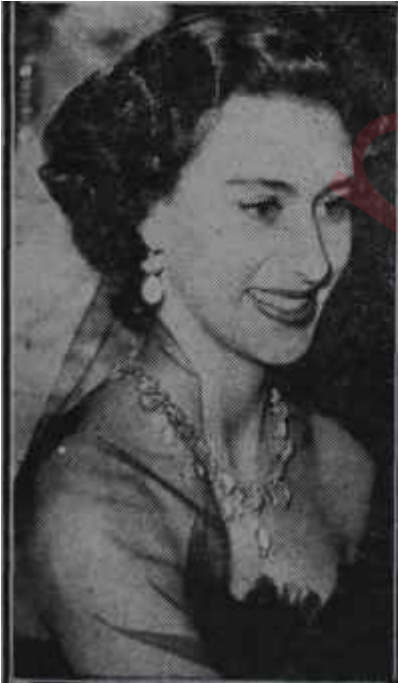
Prens Margaret Aştan önce

1952 senesi idi.. Margaret'in fotoğrafları birden, büyük bir değişiklik göstermeğe başladı. Bu güzel fakat donuk kız fevkalâde sıcak, fevkalâde mesut, tatmin edilmiş bir ifade taşıyordu. Onu bir çok zengin ve aristokrat gençlerle nişanlı telâkki eden efkârı umumiye, karısından ayrılan Townsend'i o zamanlar, nazarı itibara bile almıyordu. Halbuki iki