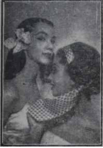
Saçlarda yeni moda Etağfurullah!

gitti. Her şeysi tamamı, yalnız kravatını bir türlü bulamıyordu. Sinirlendi. İhtimal onu aşırımlardı. Derdini anlatmak için karısını arıyordu. Onu plajın üstündeki gazinoda gördü. Oturmuş dondurma yiyordu ve inanılmıyacak şey, saçlarını, o sapsarı at kuyruğunu, kaybolan kravatla bağlamıştı. Mazeret olarak: