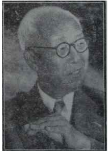
Syngman Rhee Dosta ihanet mi ?

Kurulmuş tarafsız komisyon, işte bu hükümlerin tatbikine nezaret etmekle görevlendirilmişti. Koreden