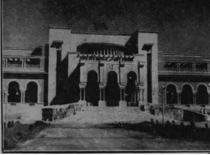
Kral İbni Suud'un yeni sarayı Çöl ortasında cennet

Kral İbni Suud, kendisine yeni bir saray inşa ettirmiştir. Saray inşasının bir an önce tamamlanabilmesi için iki bin işçi, geceli gündüzlü çalışmıştır. Bugüne kadar yapılan sarayların en muhteşemi ve büyüğü olan bu bina için milyonlar harcanmıştır.