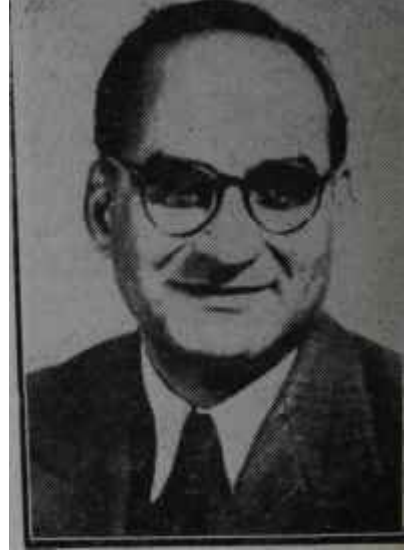
Çudhurî Muhammed Ali Zor meseleler