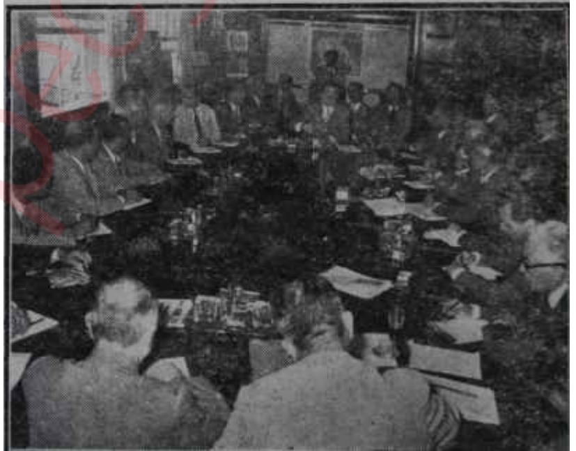
Başbakan gazetecilere izahat veriyor Sıfırı bol sözler