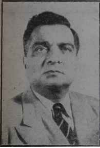
İskender Mirza Umumî Vali vekili

Glulam Muhammedin çekilmesiyle boşalan Umum Valiliğe General İskender Mirzanın vekâlet etmesi kararlaştırılmıştır. Kendisinin selefinden farklı bir politika takip etmesi beklenemez. General İskender de öteden beri "sınırlı bir demokrasi" ye taraftar bulunuyordu. Fırsat düştükçe demokrasinin bir terbiye meselesi olduğunu, Pakistanın da henüz o terbiye seviyesine ulaşmadığını söylemistir.