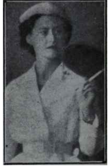
Ve şimdi... Aşk

21 Ağustos yaklaşmaktadır. Bugünlerde bütün İngilizlerin gözleri Times gazetesindedir. Çünkü bu gazetede, her gün, saray bülteni neşrolunmaktadır. Ve 21 Ağustosun sonra, her hangi bir gün, bu bülten-de şu kuru sözlere tesadüf etmek ka-